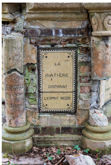
Soubassement, détail, inscription : "La matière disparaît l'esprit reste." IVR26_20245800163NUC4A