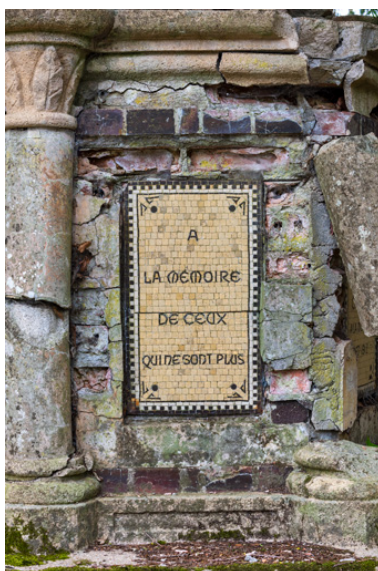
Soubassement, détail, inscription : "À la mémoire de ceux qui ne sont plus." IVR26_20245800161NUC4A