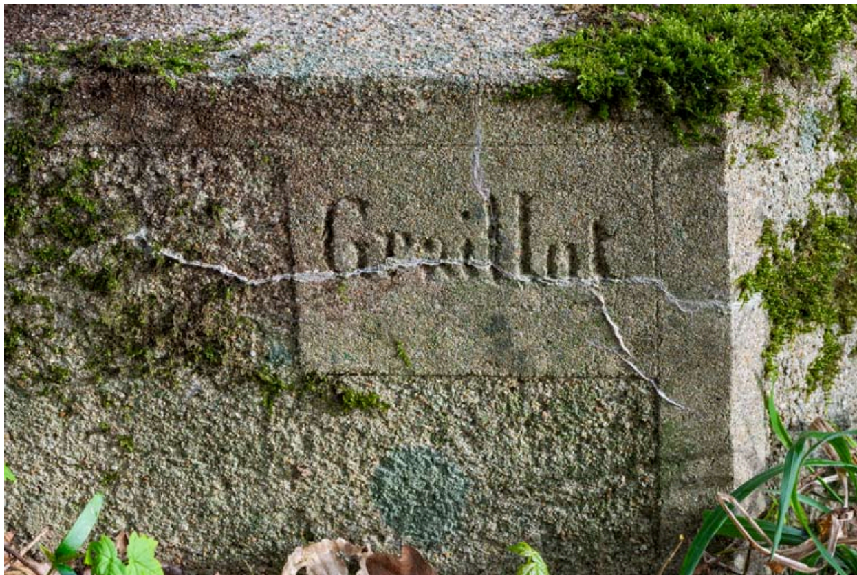
Base, détail, signature : Graillet.