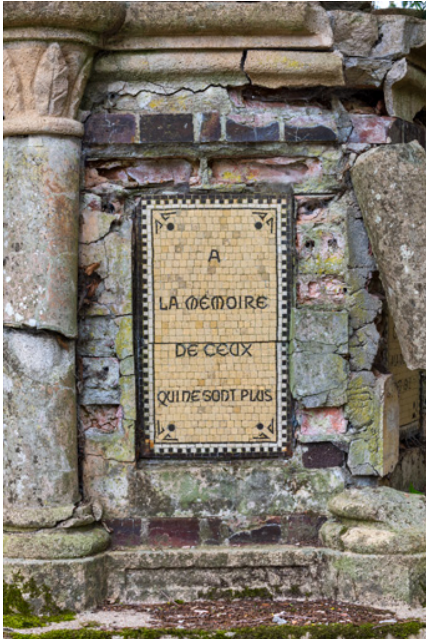
Soubassement, détail, inscription : "À la mémoire de ceux qui ne sont plus."