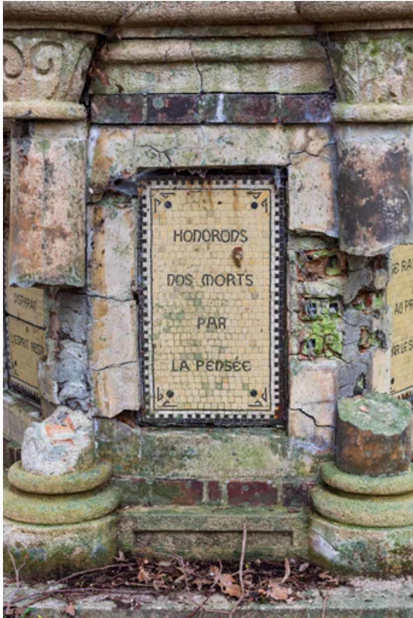
Soubassement, détail, inscription : "Honorons nos morts par la pensée."