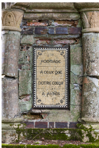
Soubassement, détail, inscription : "Hommage à ceux que notre cœur a aimés." IVR26_20245800160NUC4A