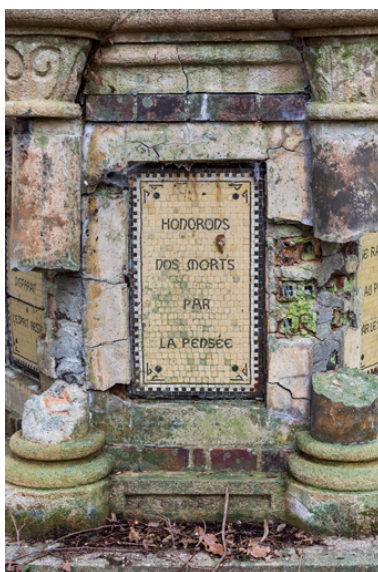
Soubassement, détail, inscription : "Honorons nos morts par la pensée." IVR26_20245800158NUC4A