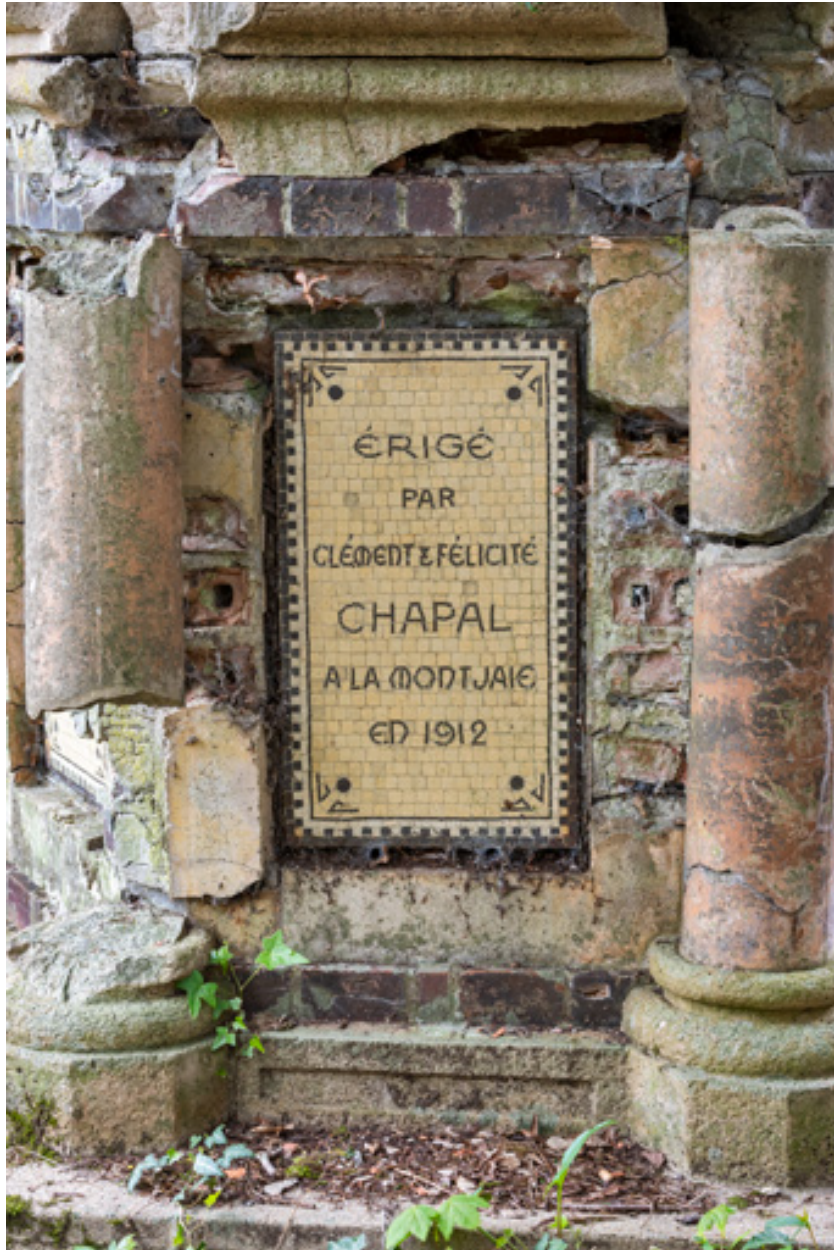
Soubassement, détail, inscription : "Érigé par Clément et Félicité Chapal à la Montjaie en 1913".