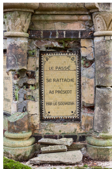
Soubassement, détail, inscription : "Le passé se rattache au présent par le souvenir." IVR26_20245800159NUC4A