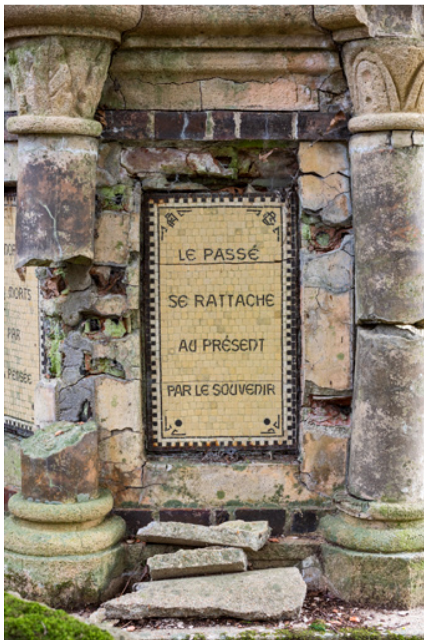
Soubassement, détail, inscription : "Le passé se rattache au présent par le souvenir."