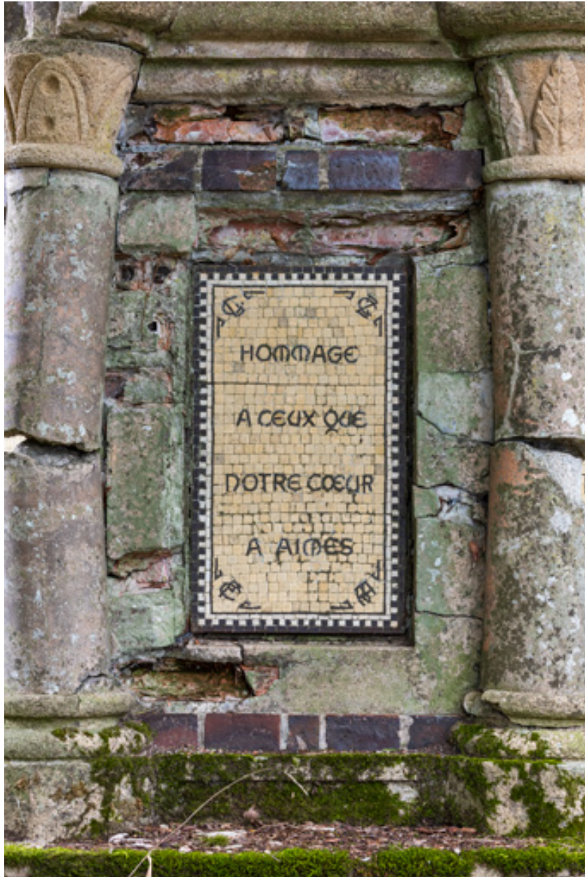
Soubassement, détail, inscription : "Hommage à ceux que notre cœur a aimés."