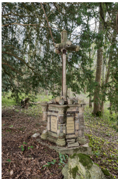
Vue d'ensemble. IVR26_20245800157NUC4A