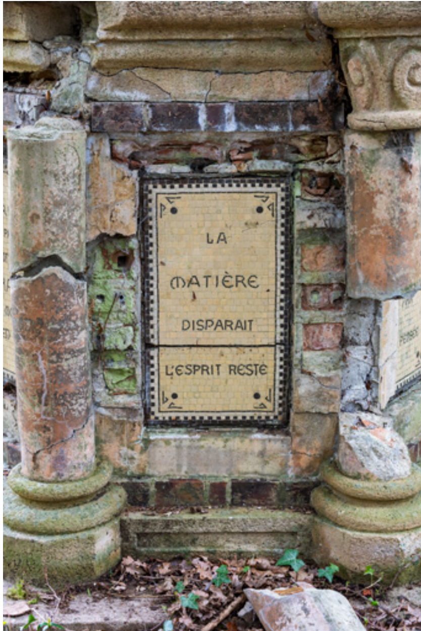
Soubassement, détail, inscription : "La matière disparaît l'esprit reste."