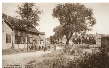
Rougemont (Doubs). Route de Vesoul. - L'Usine. S.d. [vers 1920]. IVR43_20102501410NUC4A