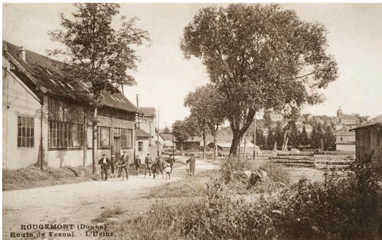
Rougemont (Doubs). Route de Vesoul. - L'Usine. S.d. [vers 1920].