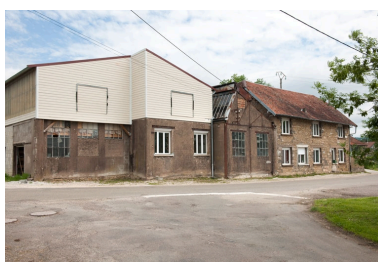
Vue générale depuis le chemin du Souvenir Français.