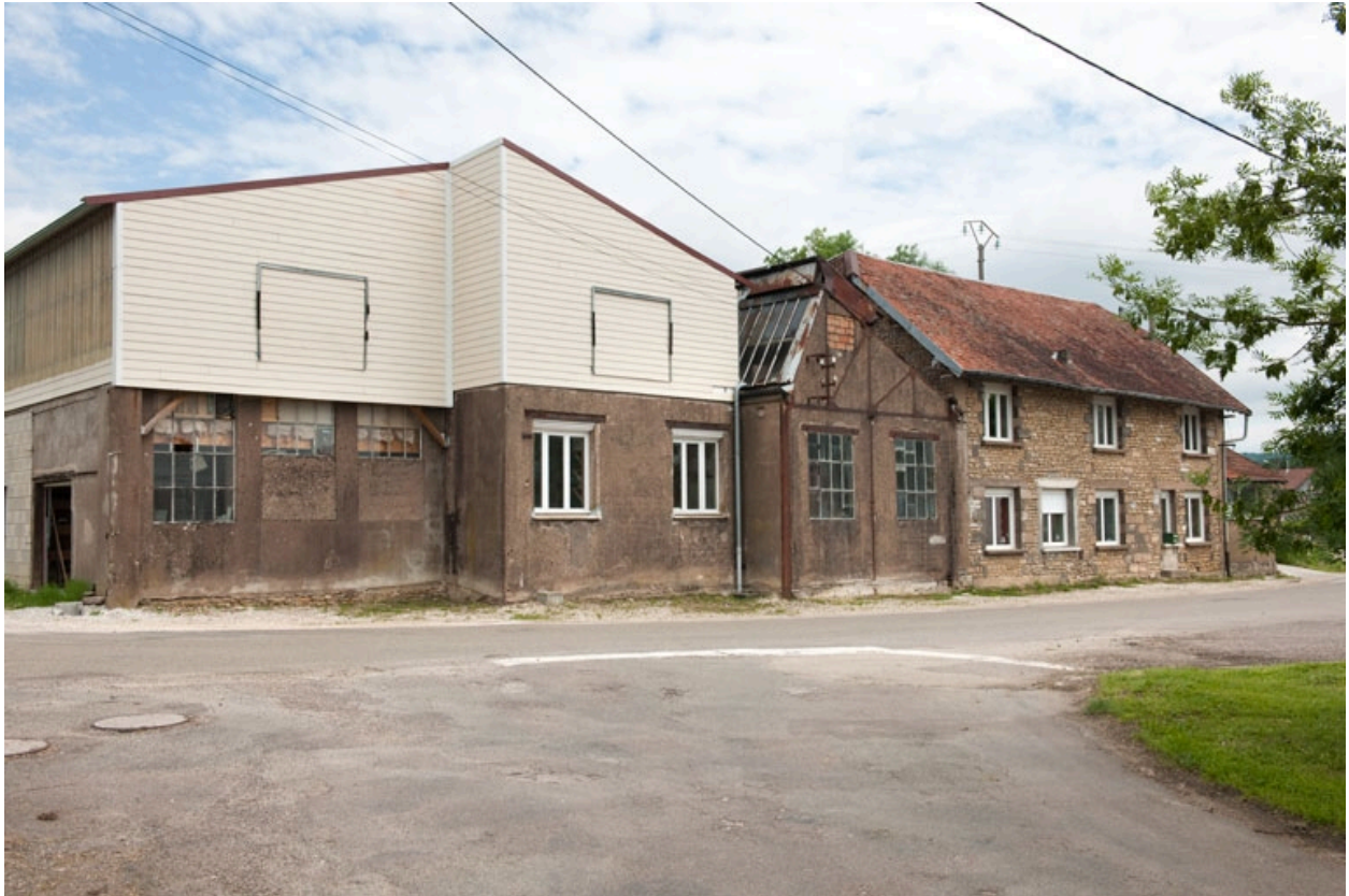
Vue générale depuis le chemin du Souvenir Français.