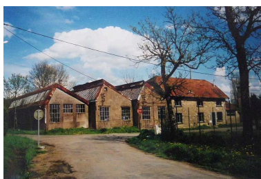
[Vue générale depuis le Chemin du Souvenir Français]. S.d. [1997 ou 1998]. IVR43_20112502946NUC2A