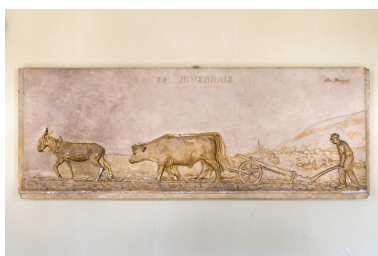
Vue d'ensemble. IVR26_20245800362NUC4A