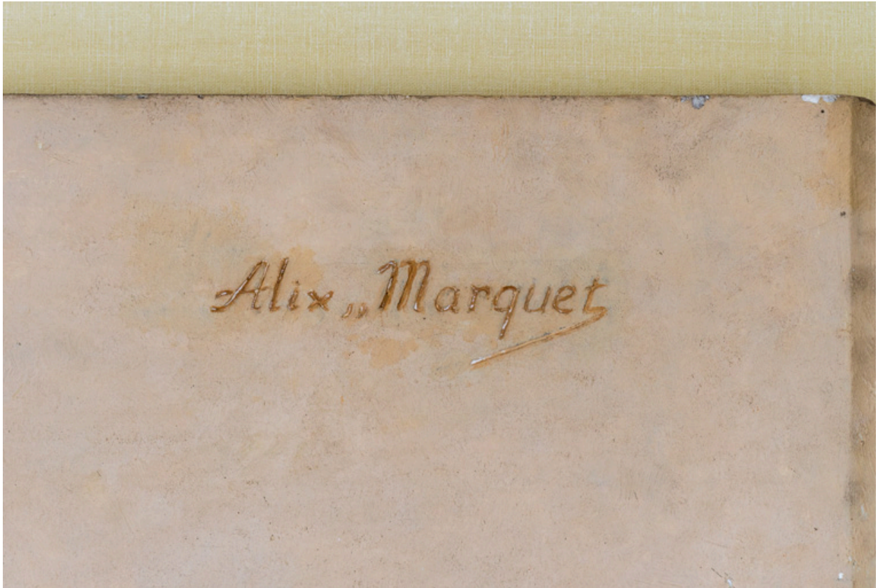
Signature d'Alix Marquet.