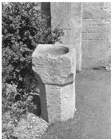
Bénitier : vue d'ensemble.