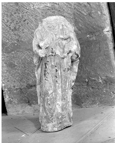
Fragment de croix monumentale : face.