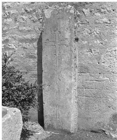
Dalle funéraire.