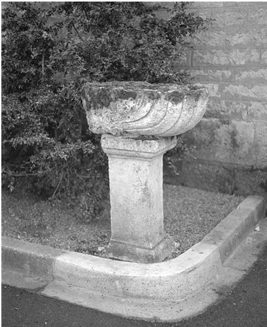
Bénitier : vue d'ensemble.