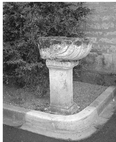
Bénitier : vue d'ensemble. IVR26_19748901408X