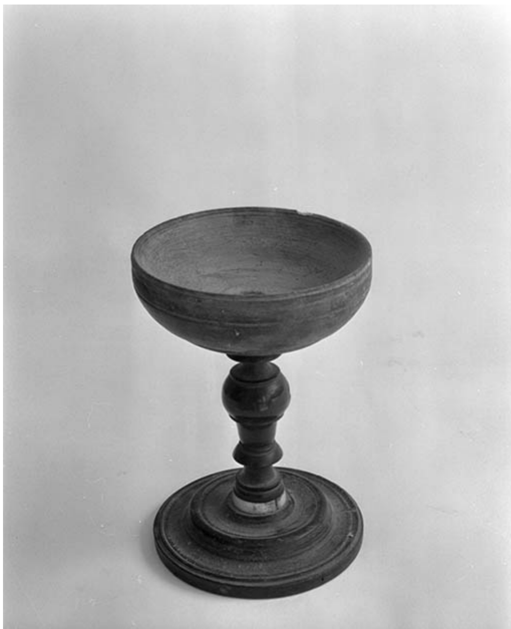
Vase à quêter : vue d'ensemble.