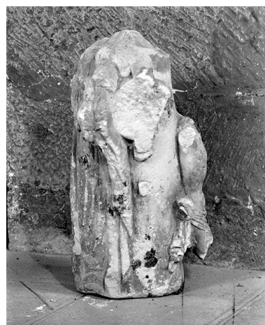
Fragment de croix monumentale : profil droit. IVR26_19748900488X