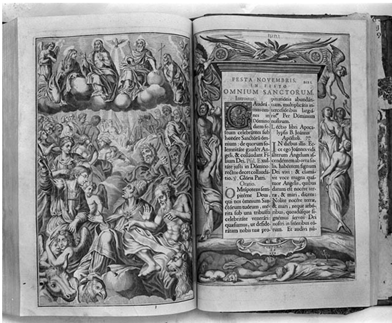
Missel romain ouvert.