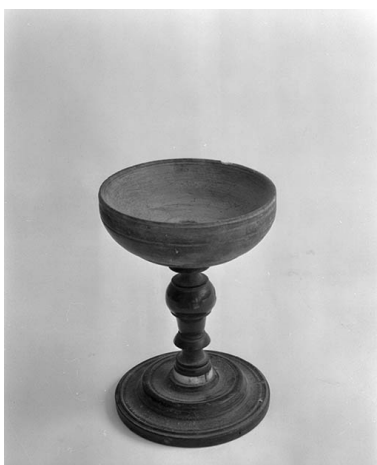
Vase à quêter : vue d'ensemble. IVR26_19748900432X