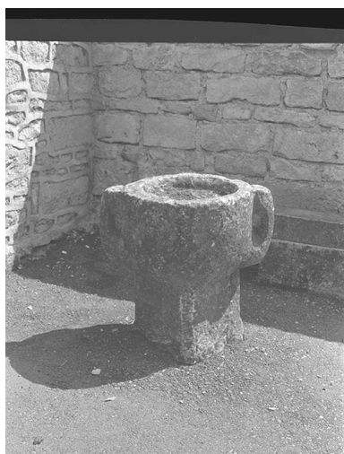
Bénitier : vue d'ensemble.