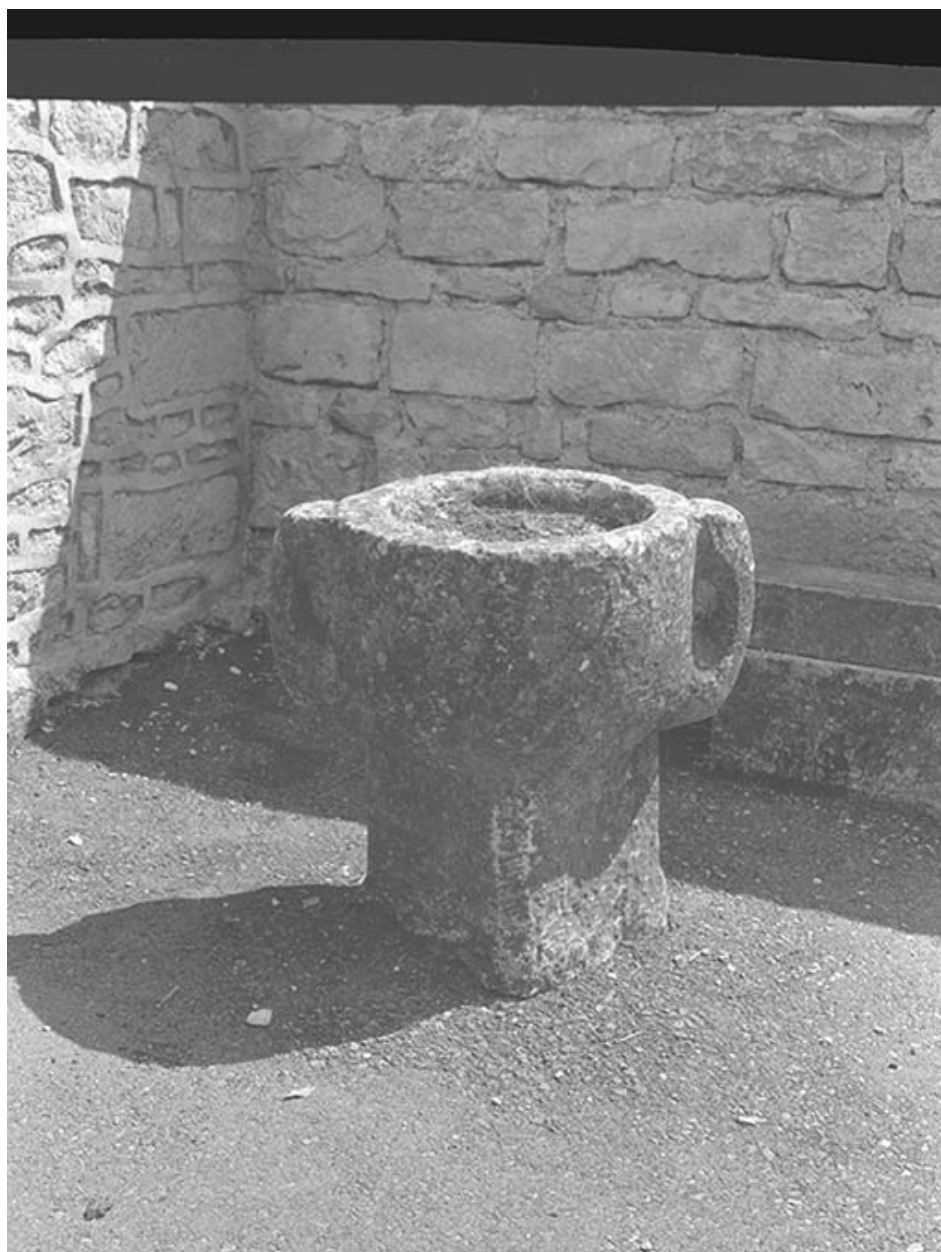
Bénitier : vue d'ensemble.