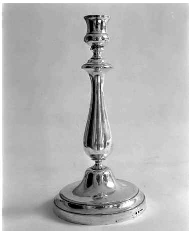
Chandelier.