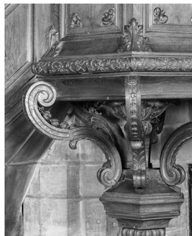
Cuve, détail du culot