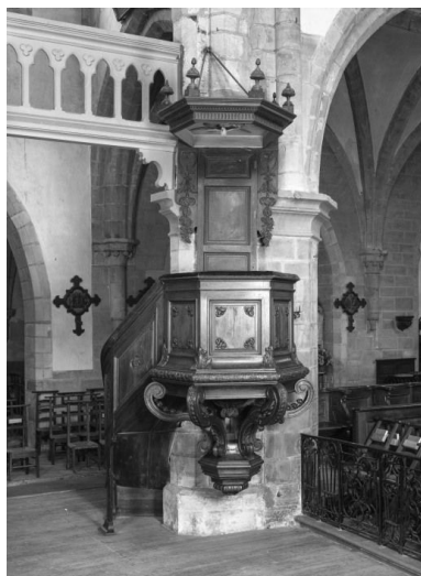
Vue de face IVR26_19862101495V