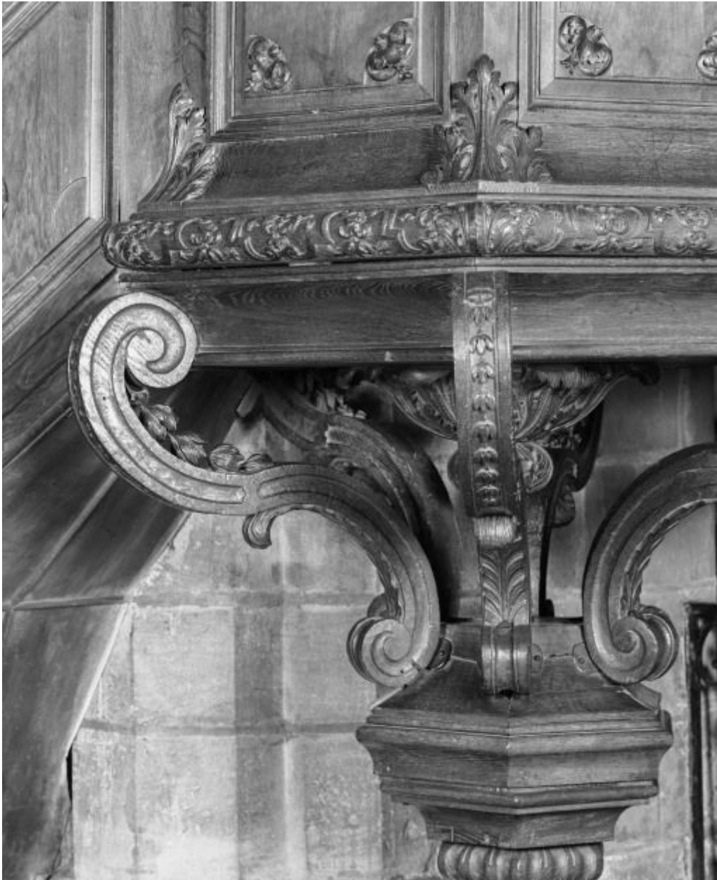
Cuve, détail du culot