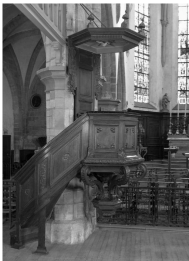
Vue de trois-quarts IVR26_19862101496V