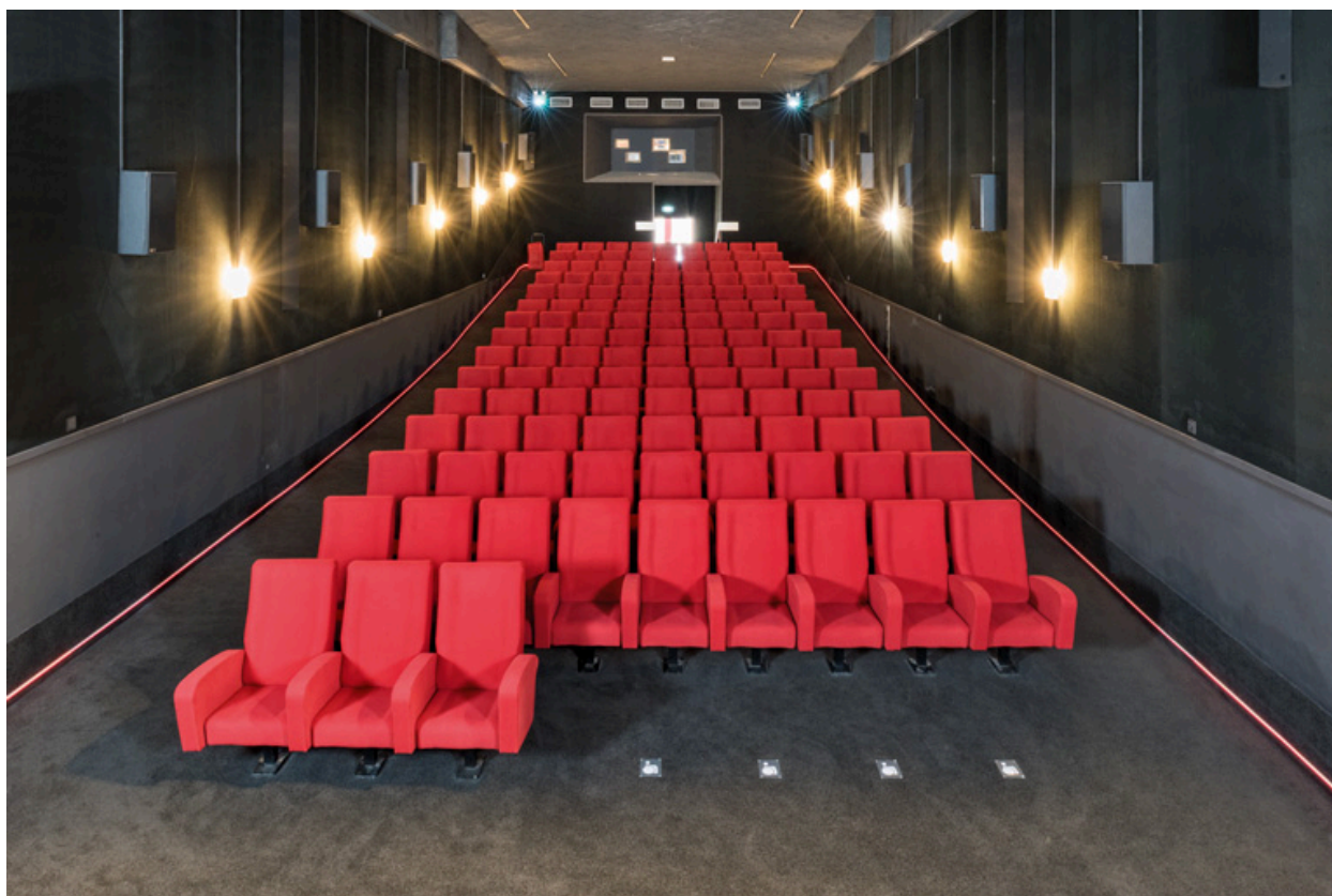
Salle, vue depuis l'écran