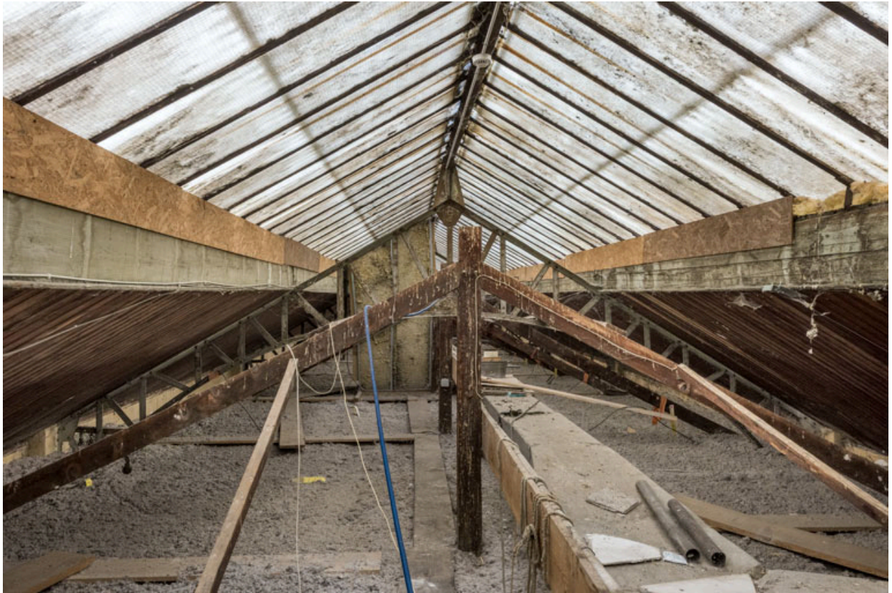
Charpente métallique et verrière, depuis le côté du quai.