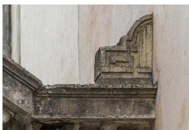
Façade antérieure : décor en partie supérieure.