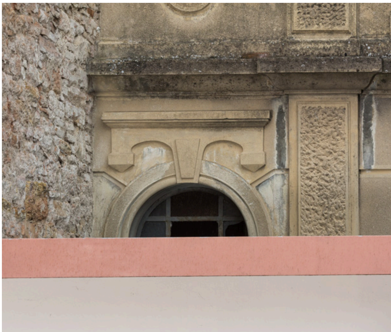
Façade antérieure : décor surmontant une fenêtre.