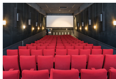
Salle, vue vers l'écran. IVR26_20257100368NUC4A