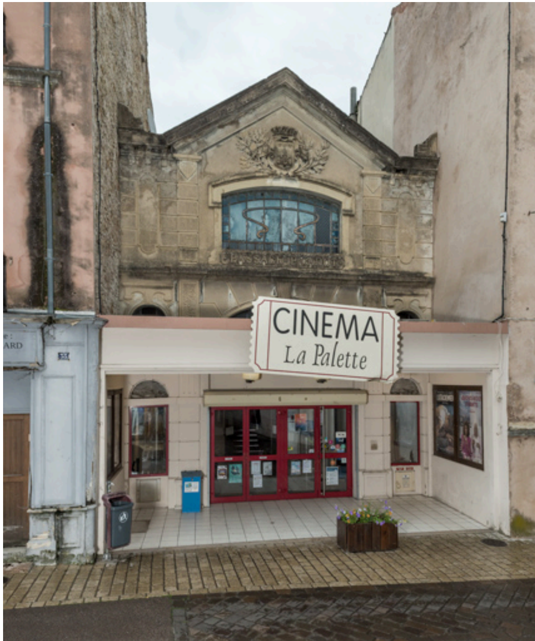
Façade antérieure, rue de la République.