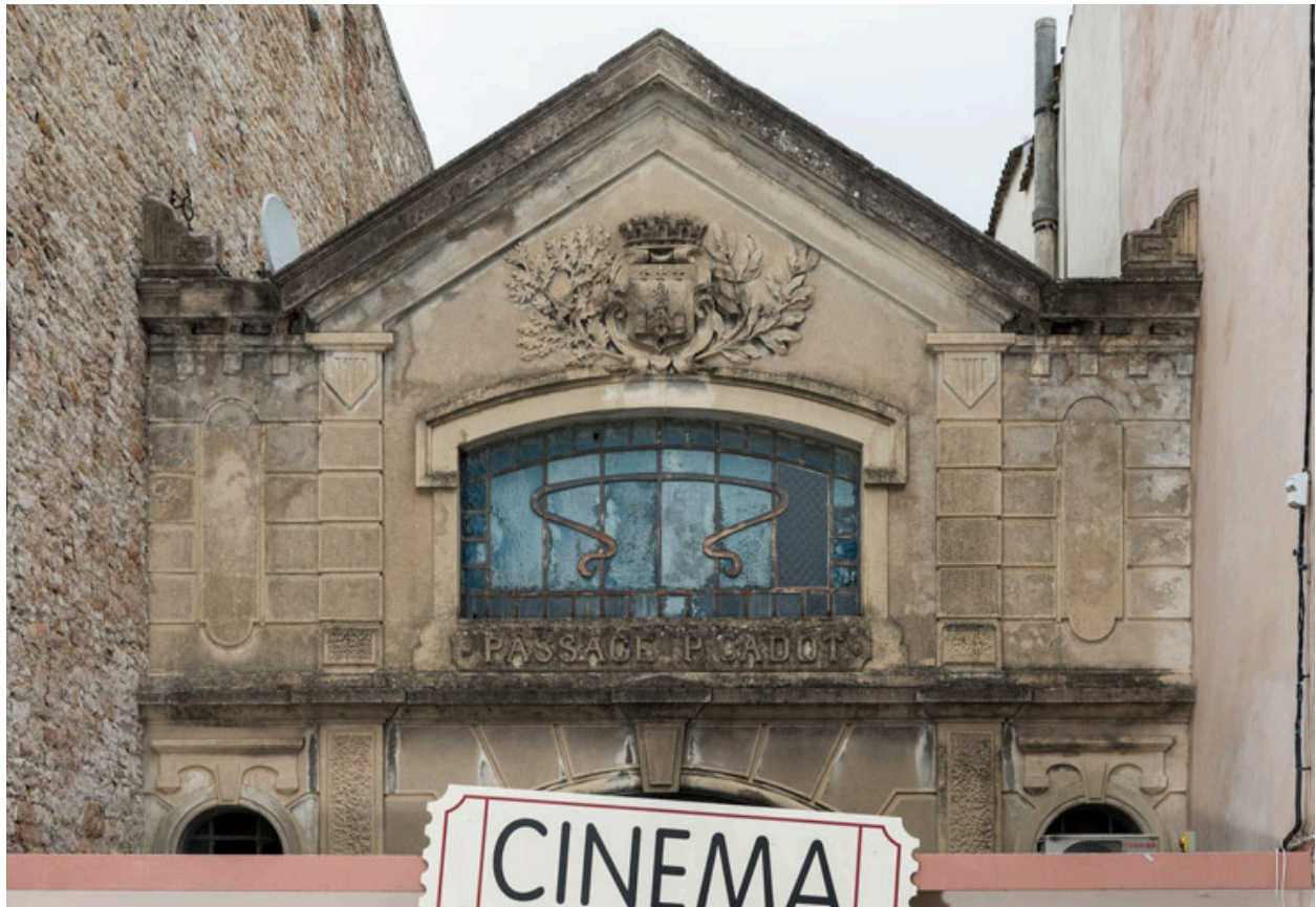
Façade antérieure : partie supérieure.