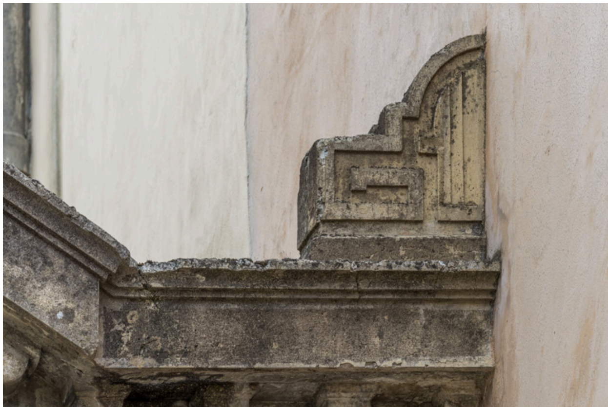
Façade antérieure : décor en partie supérieure.