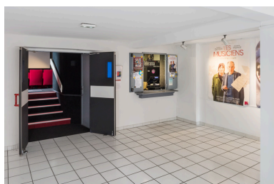
Vestibule et accueil. IVR26_20257100373NUC4A