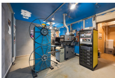
Cabine de projection. IVR26_20257100374NUC4A