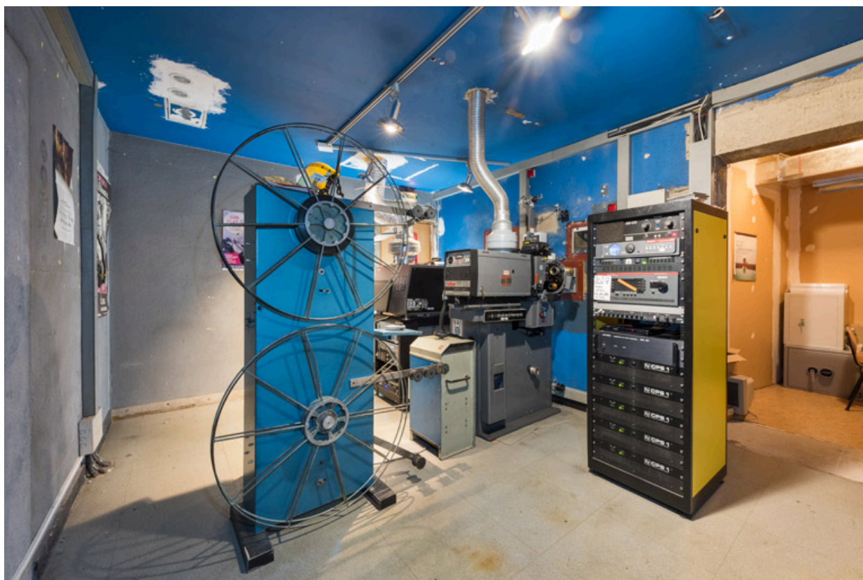
Cabine de projection.