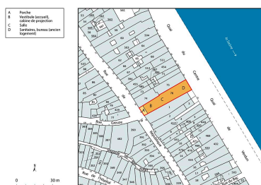
Plan-masse et de situation. Extrait du plan cadastral de la Direction Générale des Finances Publiques (DGFIP), 2022, section AN, 1/500 réduit à 1/750. IVR26_20267100175NUDA