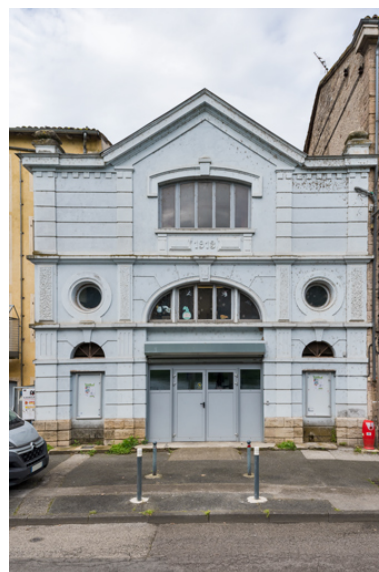
Façade postérieure, quai de Verdun. IVR26_20257100370NUC4A