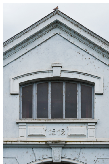
Façade postérieure: date portée 1913.