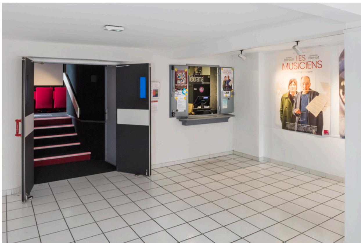
Vestibule et accueil.