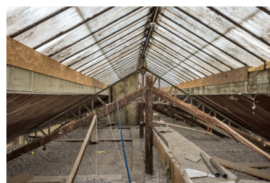
Charpente métallique et verrière, depuis le côté du quai. IVR26_20257100372NUC4A