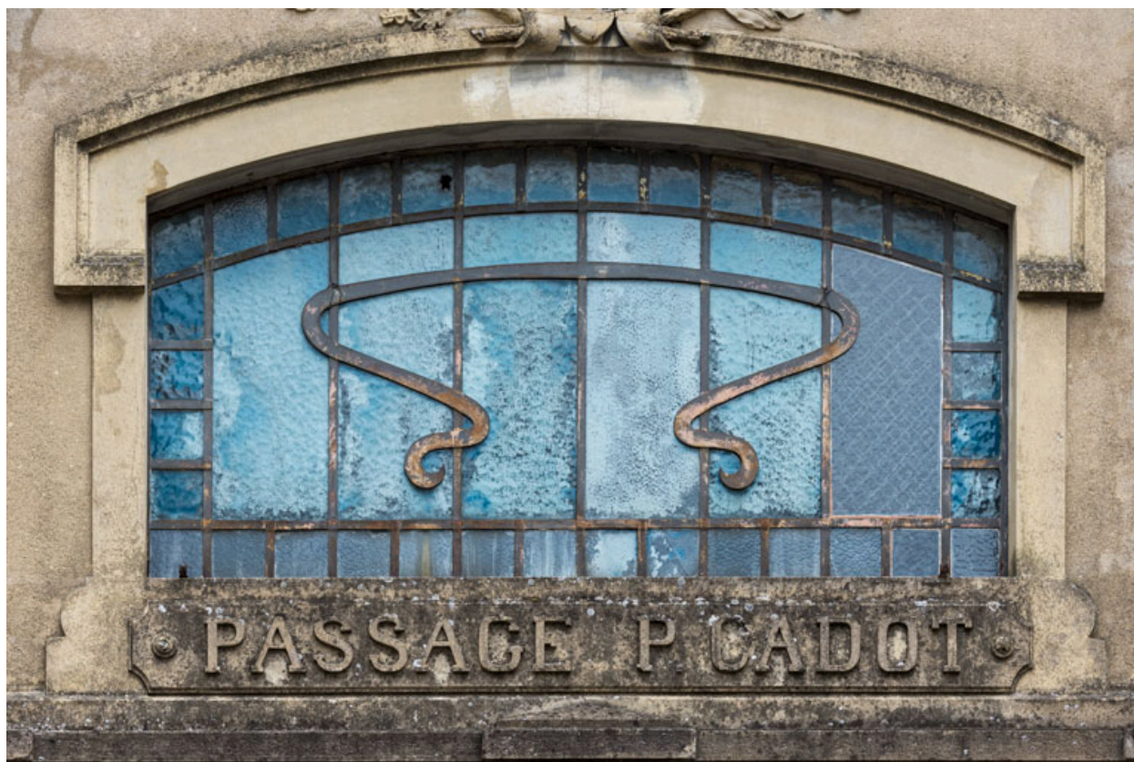
Façade antérieure : inscription et ferronnerie de la fenêtre centrale.