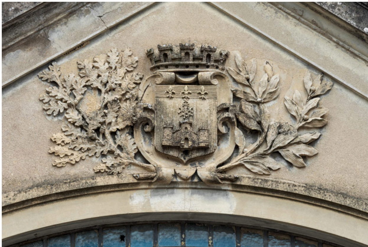
Façade antérieure : armoiries de la ville de Tournus.