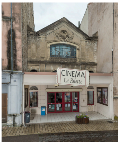
Façade antérieure, rue de la République.