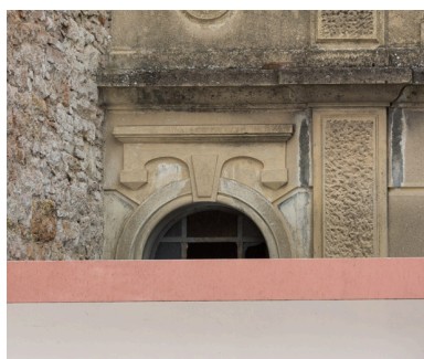
Façade antérieure : décor surmontant une fenêtre. IVR26_20257100366NUC4A