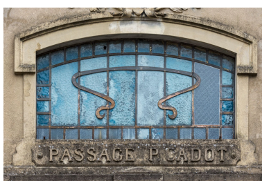
Façade antérieure : inscription et ferronnerie de la fenêtre centrale.