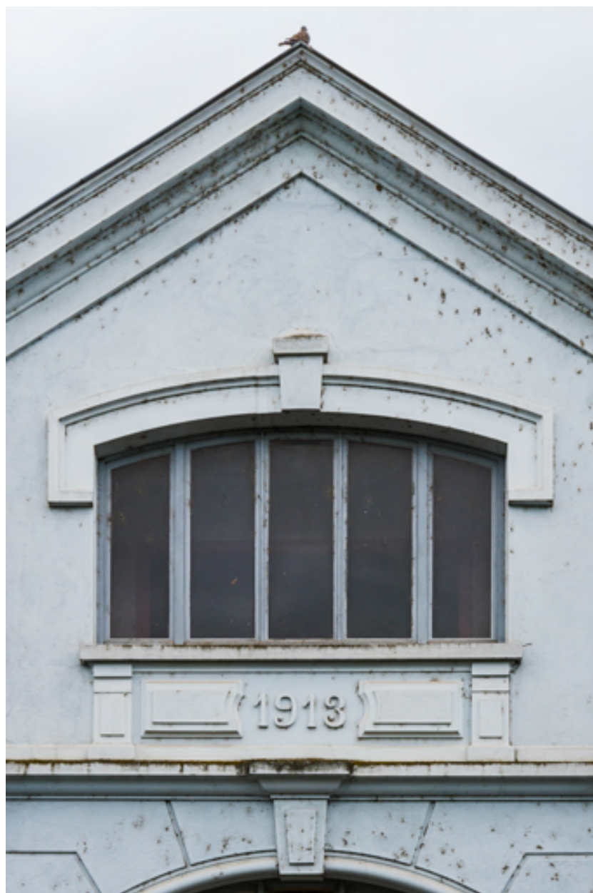
Façade postérieure: date portée 1913.