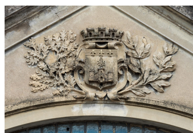
Façade antérieure : armoiries de la ville de Tournus. IVR26_20257100380NUC4A