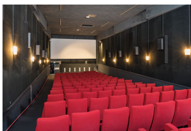
Salle, vue vers l'écran, depuis l'entrée. IVR26_20257100367NUC4A