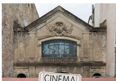
Façade antérieure : partie supérieure. IVR26_20257100365NUC4A