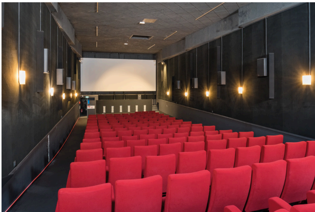
Salle, vue vers l'écran, depuis l'entrée.