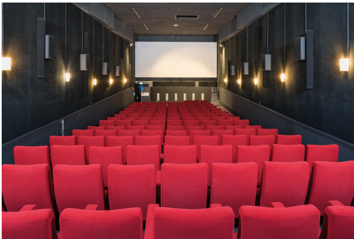
Salle, vue vers l'écran.