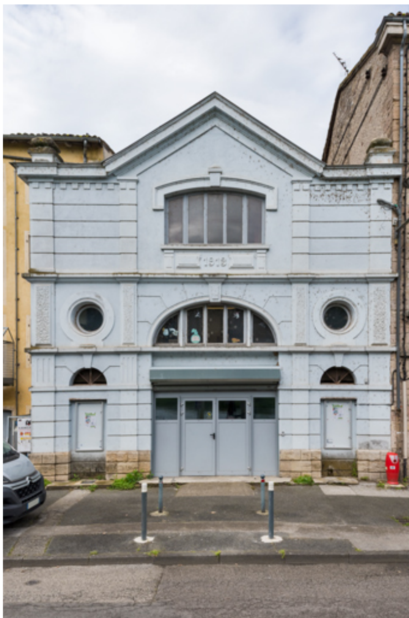
Façade postérieure, quai de Verdun.