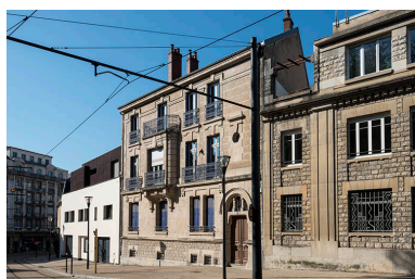
Vue de trois quarts droite. IVR43_20182500665NUC4A