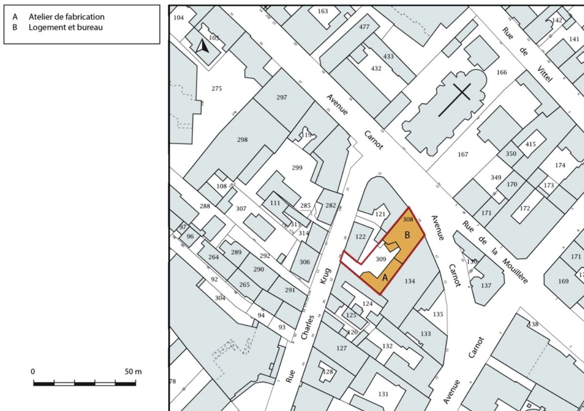
Plan-masse et de situation. Extrait du plan cadastral, 2019.