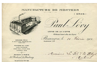
Manufacture de montres Paul-Lévy, papier à en-tête, s.d. [1914]. IVR43_20182500317NUC4A