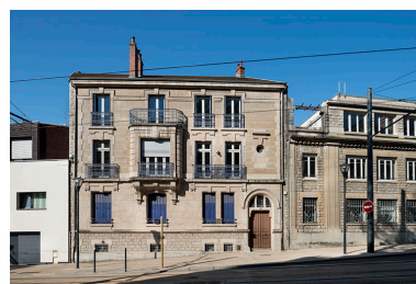
Façade antérieure.