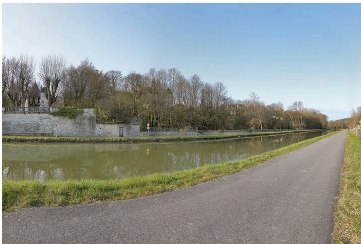
La traversée de Fleurey-sur-Ouche par le canal : enceinte du château de l'ancien prieuré Saint-Marcel et jardins des autres demeures.