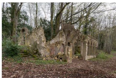
Vue actuelle.