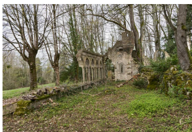
Vue actuelle.