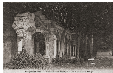
Vue ancienne. IVR26_20195800744NUC4A