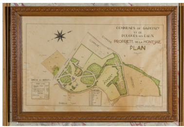
Localisation des "ruines" (9) sur un plan levé en 1912-1913. IVR26_20245800184NUC4A