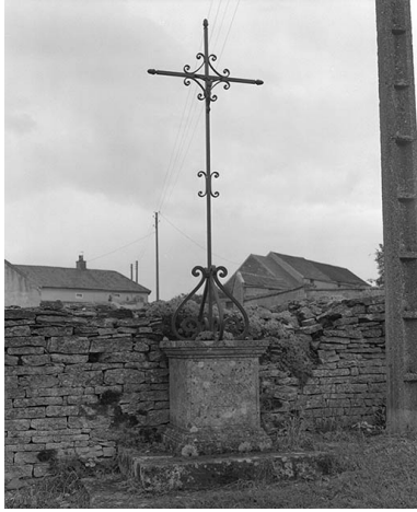
Croix de chemin.