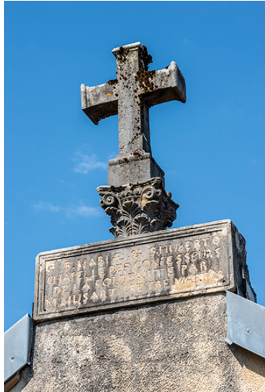
Inscription, chapiteau et croix.

Pignon avec niche surmontée d'une inscription, d'un chapiteau et d'une croix.