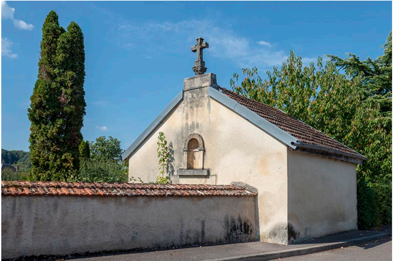
Vue depuis le sud-est.