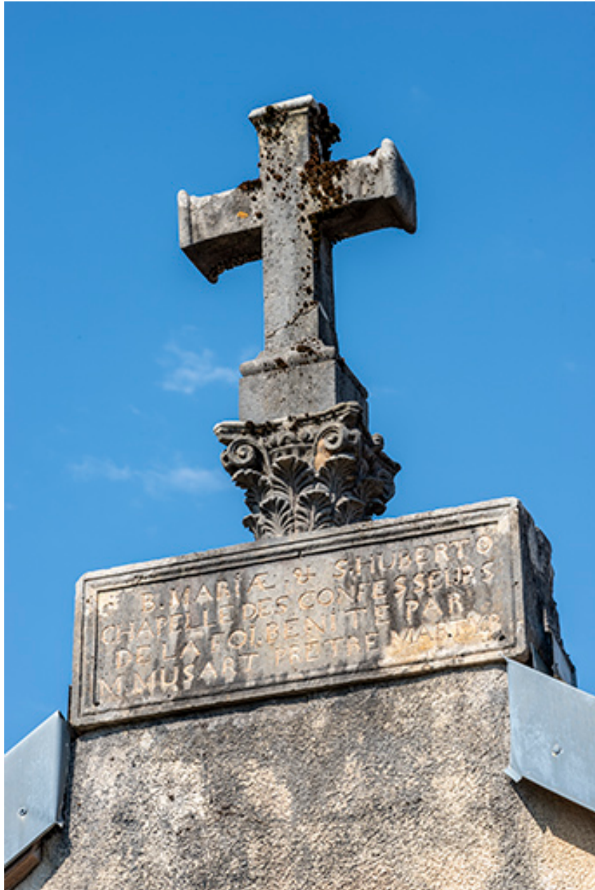
Inscription, chapiteau et croix.