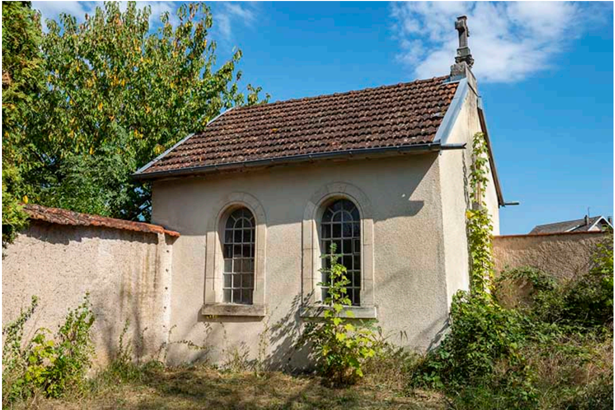
Vue depuis le sud-ouest.