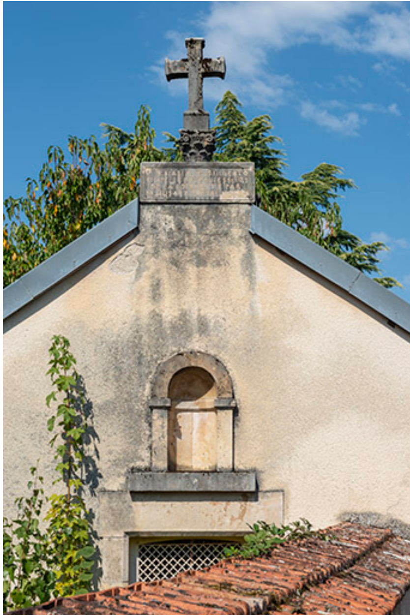
Pignon avec niche surmontée d'une inscription, d'un chapiteau et d'une croix.