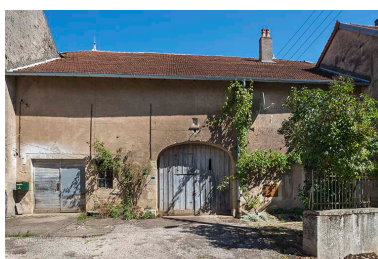
La porte cochère de la grange. IVR43_20177001219NUC4A