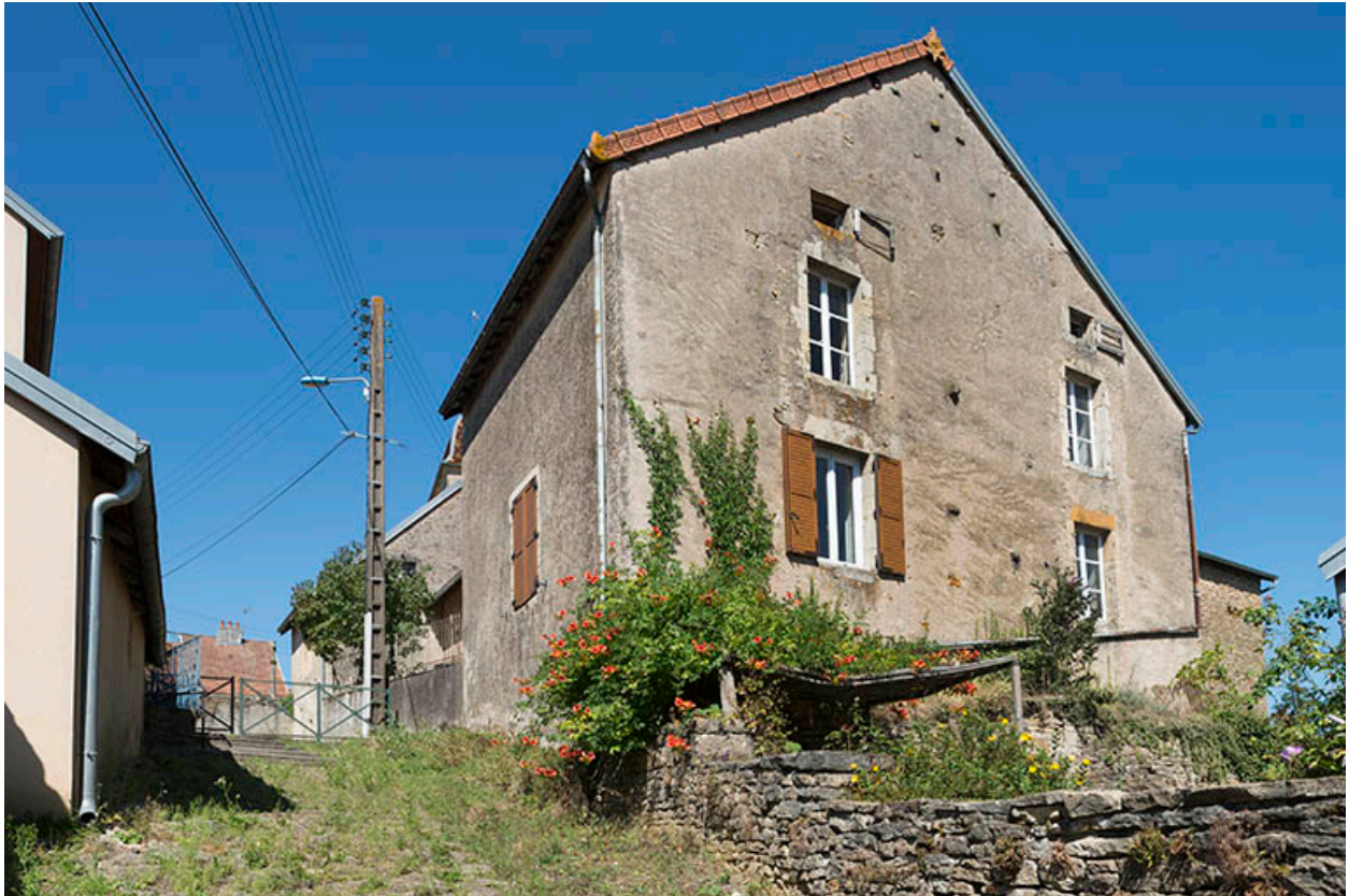
Le mur pignon côté sud.