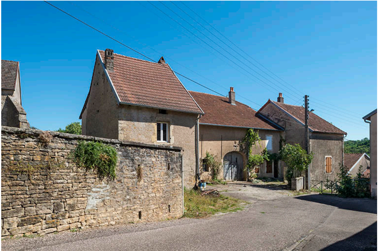
Vue depuis la rue avec le retour du mur de l'ancien cimetière.