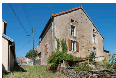
Le mur pignon côté sud.