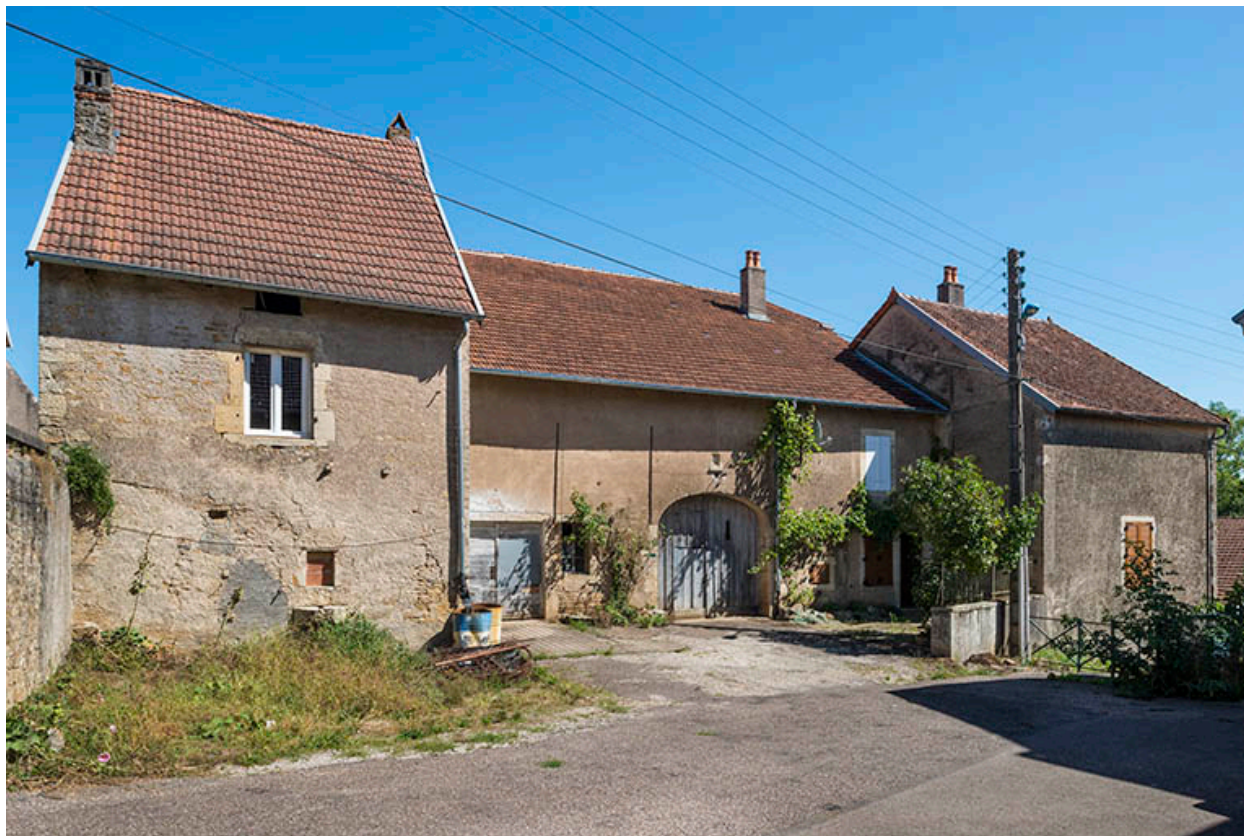
La façade antérieure.