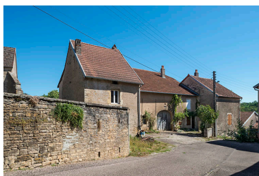
Vue depuis la rue avec le retour du mur de l'ancien cimetière.