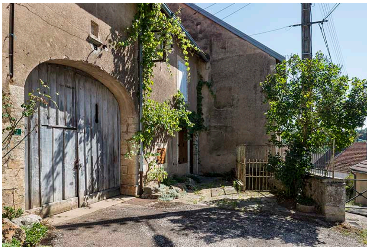
La porte cochère et l'accès vers une des maisons.