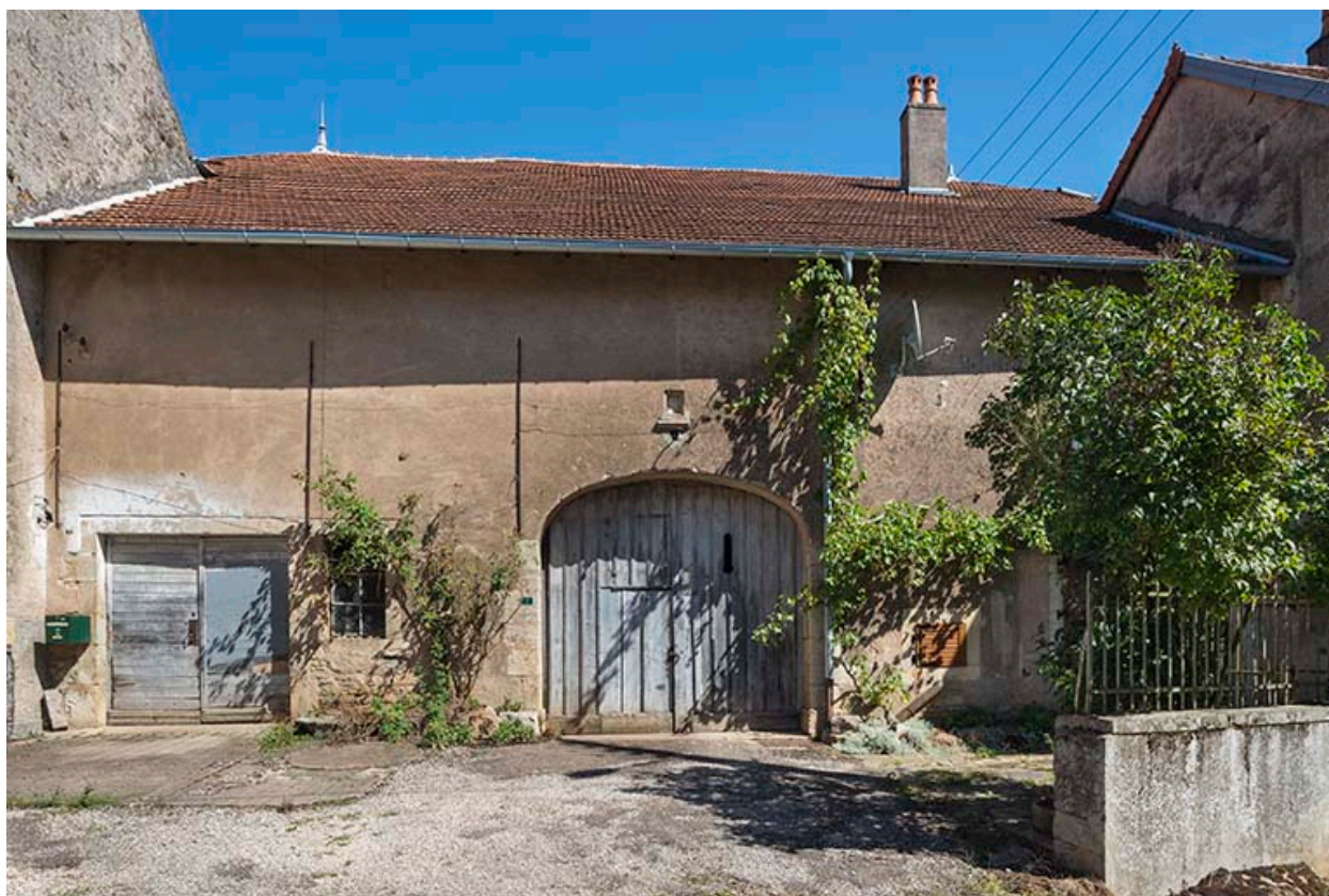
La porte cochère de la grange.