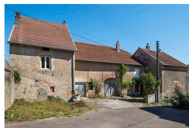
La façade antérieure. IVR43_20177001216NUC4A