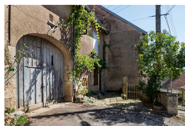
La porte cochère et l'accès vers une des maisons. IVR43_20177001220NUC4A