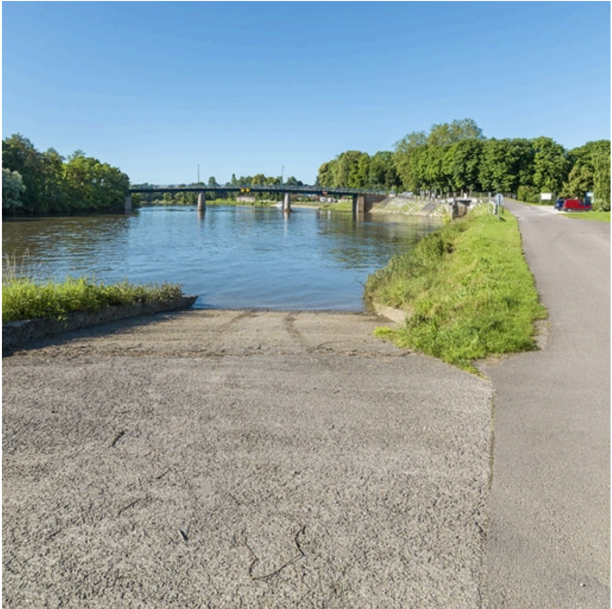
Vue d'ensemble depuis la rampe de mise à l'eau, rive droite.