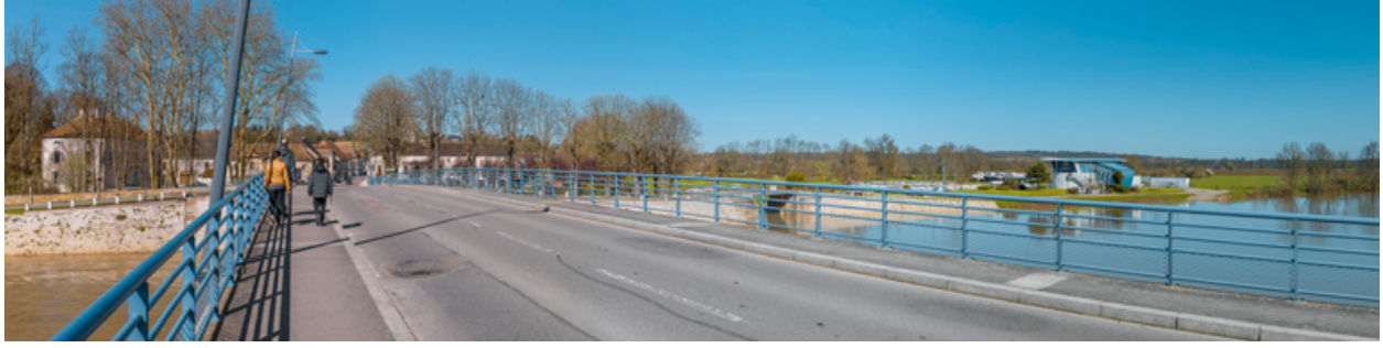
Vue d'ensemble du village de Pontailler-sur-Saône et du port, depuis le pont.