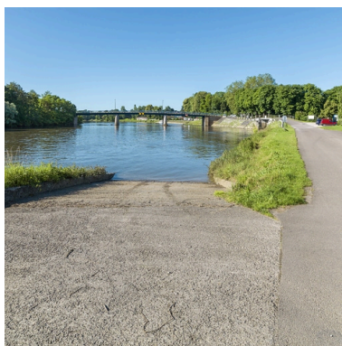
Vue d'ensemble depuis la rampe de mise à l'eau, rive droite.