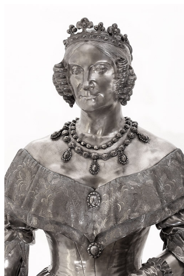
Détail : buste, de face.

IVR26_20107100934NUC2A