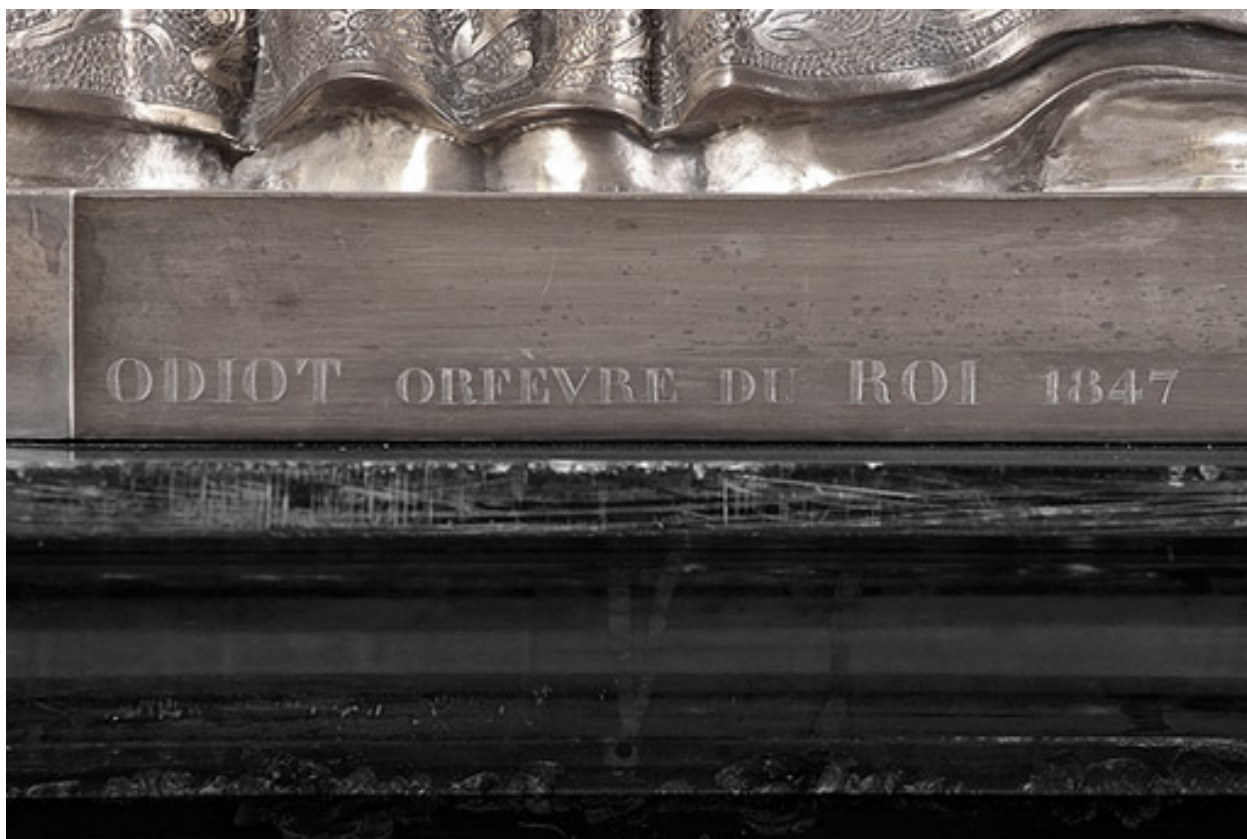
Détail : signature et date.