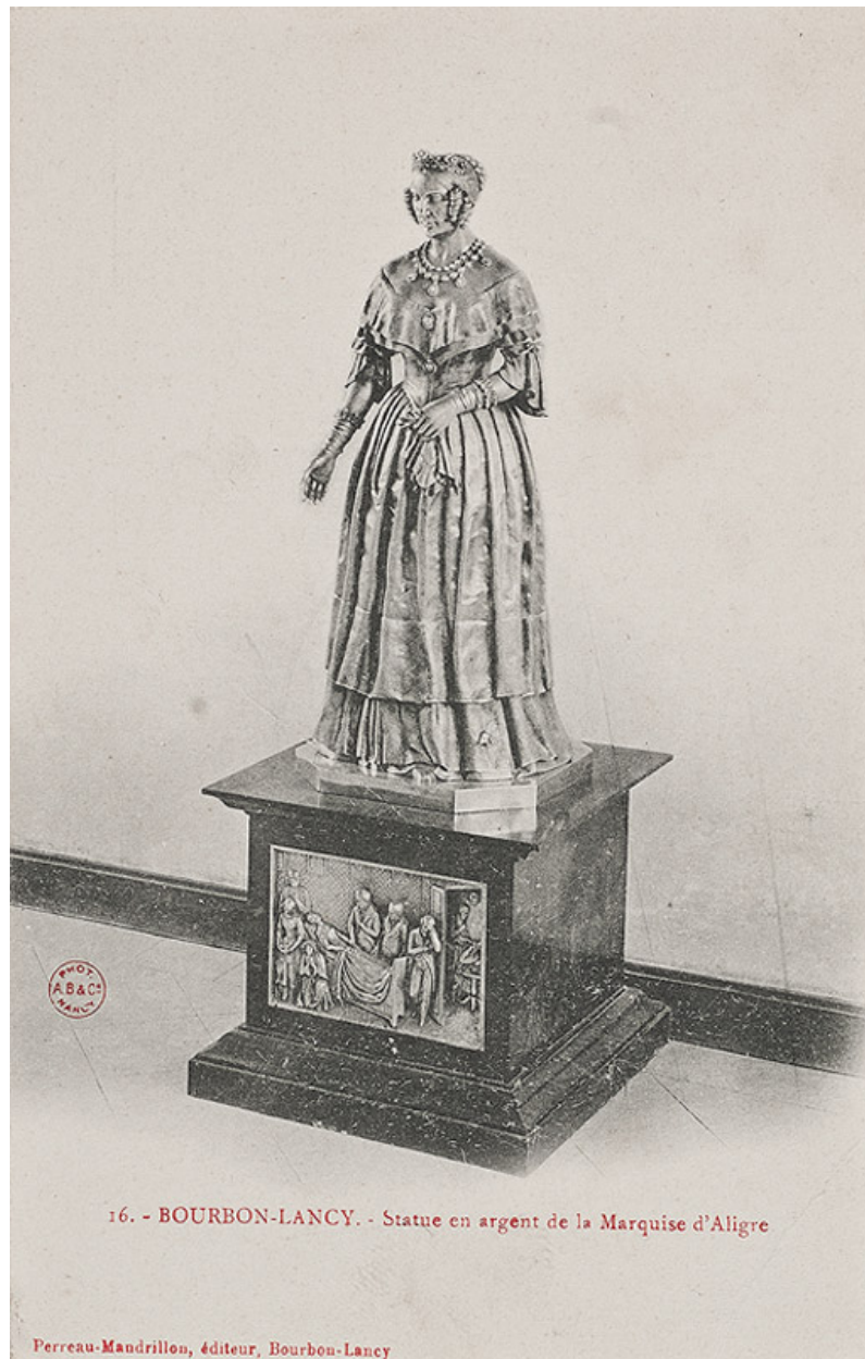
16.- BOURBON-LANCY - Statue en argent de la Marquise d'Aligre (Perreau-Mandrillon, éditeur, Bourbon-Lancy). (carte postale ancienne)