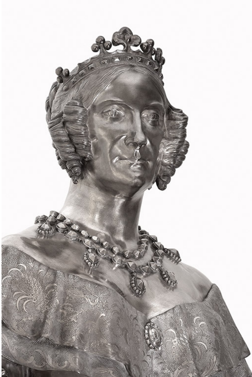
Détail : buste, de trois quarts.