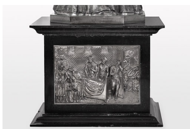
Relief du piédestal.

IVR26_20107100938NUC2A