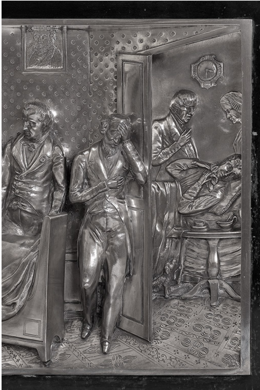
Relief du piédestal, détail.