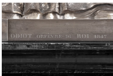
Détail : signature et date.

IVR26_20107100941NUC2A