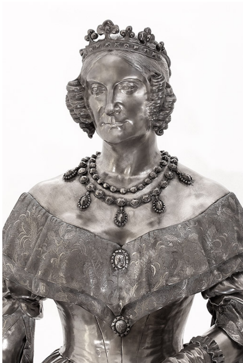
Détail : buste, de face.