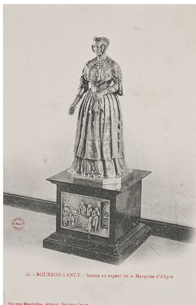
16. - BOURBON-LANCY - Statue en argent de la Marquise d'Aligre

Perreau-Mandrillon, éditeur, Bourbon-Lancy