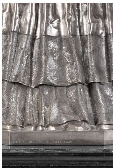
Détail de la robe.

IVR26_20107100937NUC2A