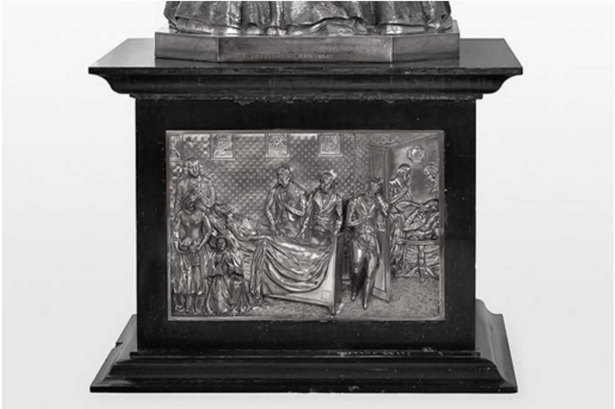
Relief du piédestal.