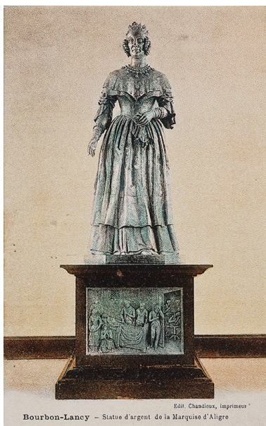
Bourbon-Lancy - Statue d'argent de la Marquise d'Aligre

16.- BOURBON-LANCY - Statue en argent de la Marquise d'Aligre (Perreau-Mandrillon, éditeur, Bourbon-Lancy). (carte postale ancienne, Collection particulière) Repro. Pierre-Marie Barbe-Richaud, Autr. auteur inconnu IVR26_20107100743NUC2A