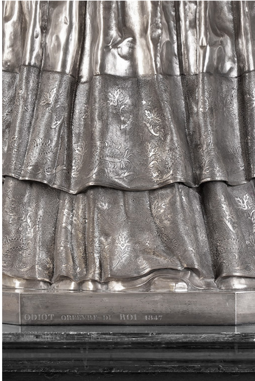
Détail de la robe.