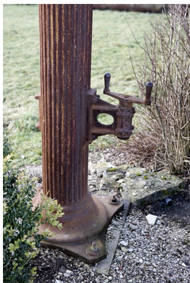
Manivelle à la base du fût.