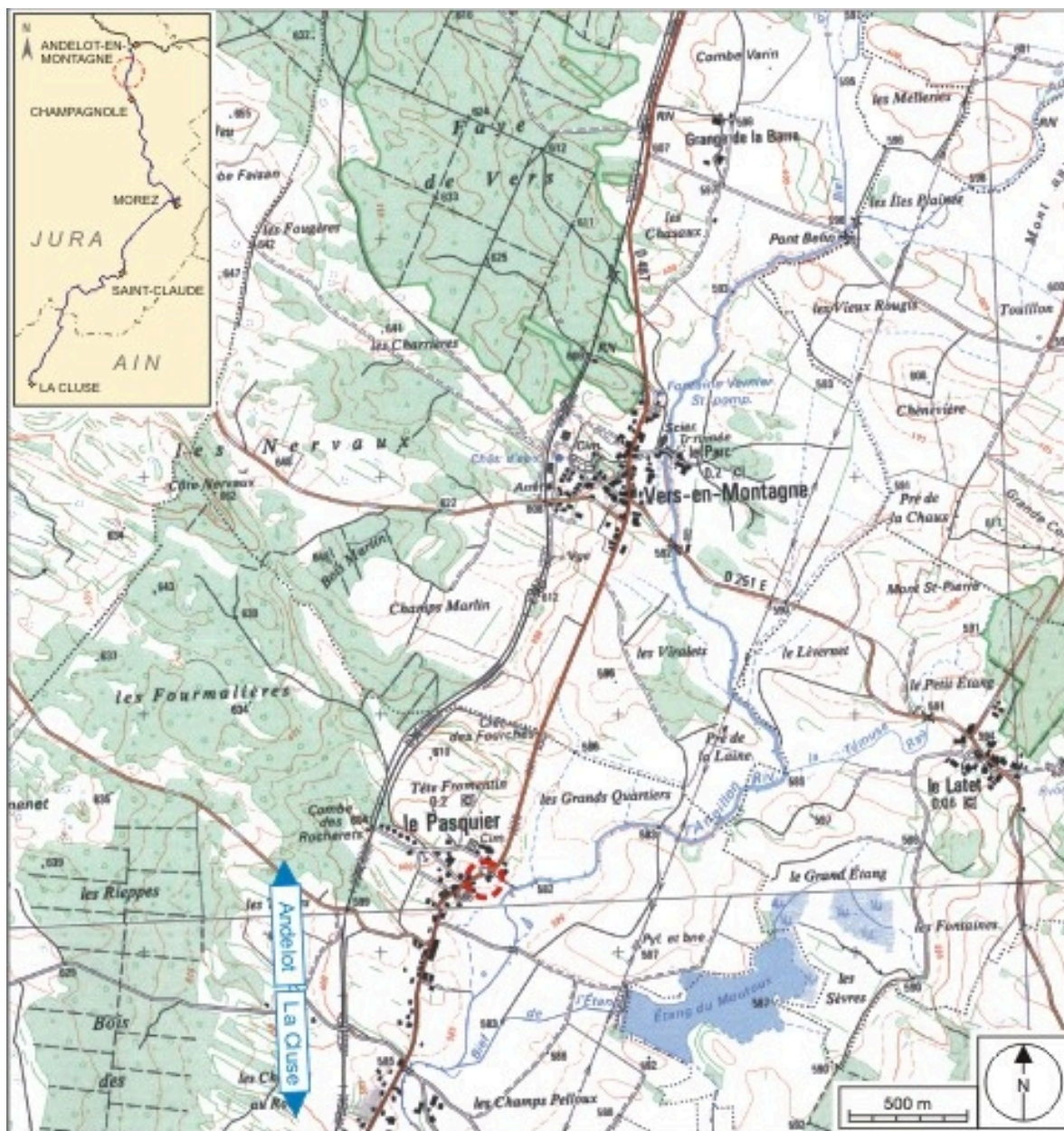
Carte et schéma de localisation. Carte topographique, IGN, 2000, dalle F087_047, échelle 1:25 000. Scan 25, licence n° 2008/CISE/2968.