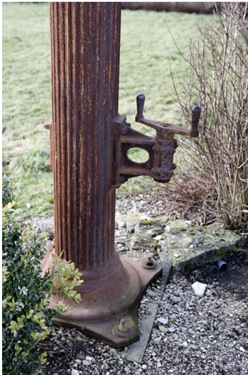
Manivelle à la base du fût.