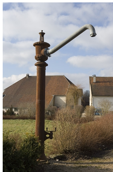
Vue d'ensemble. IVR43_20073900036NUCA