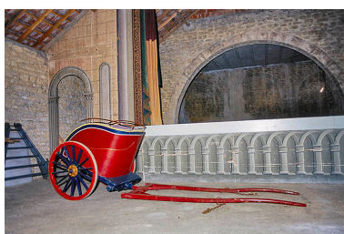
Intérieur du théâtre en 2002, avec char romain.