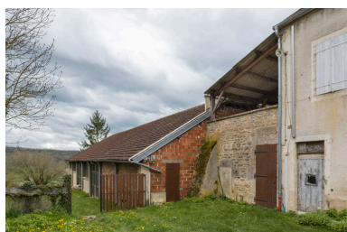
Vue d'ensemble, depuis le nord : théâtre à gauche, "ouvroir" à droite. IVR26_20242100196NUC4A