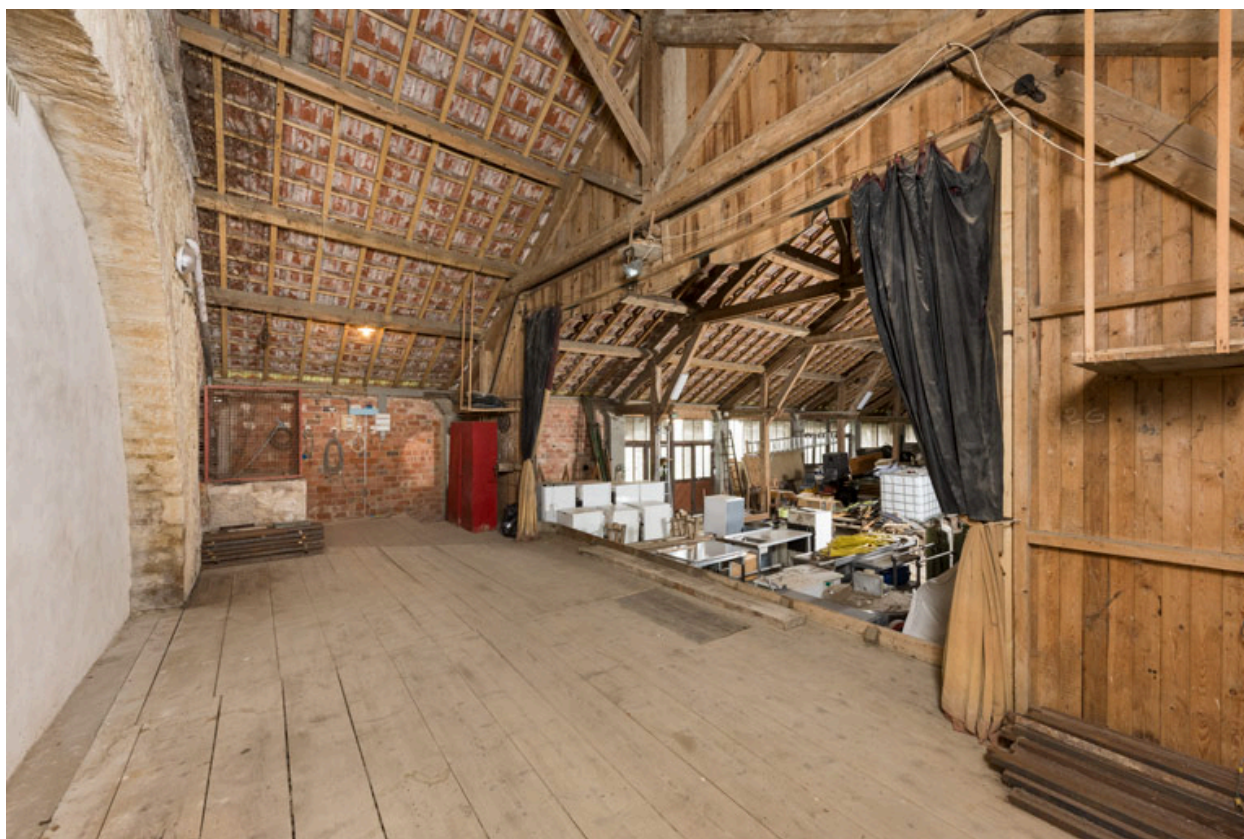
La scène, vue depuis le côté jardin (ouest).