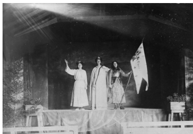
[Sainte Reine et deux personnages sur la scène du théâtre]. S.d. [fin 19e ou début 20e siècle]. Autr. auteur inconnu IVR26_20242100222NUC4A