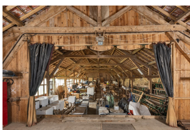
La salle, vue de la scène.