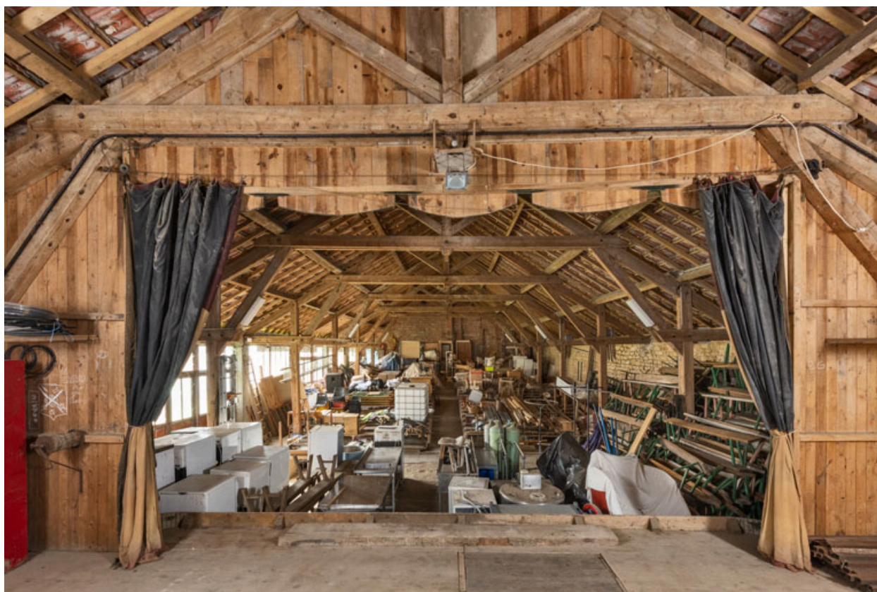
La salle, vue de la scène.