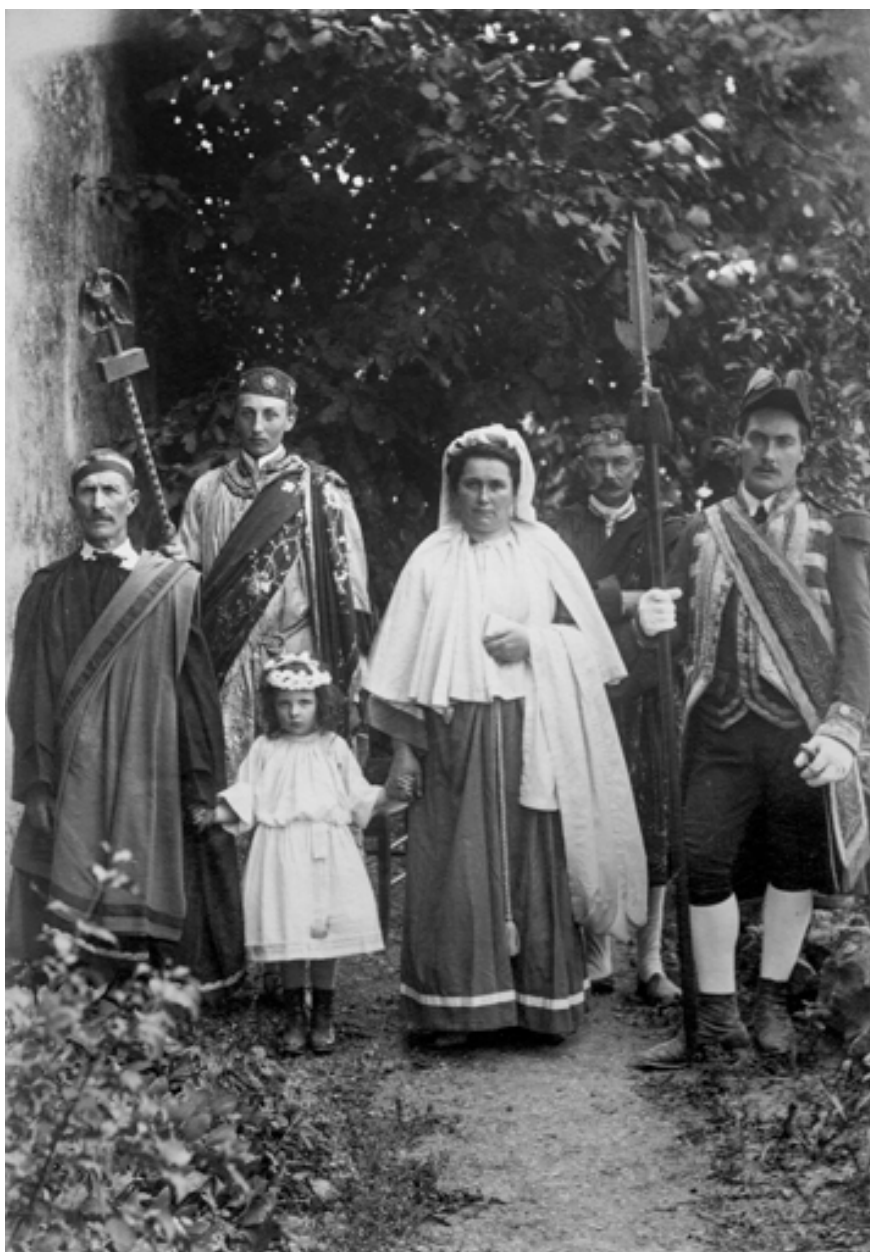
Sainte Reine enfant. 1886.