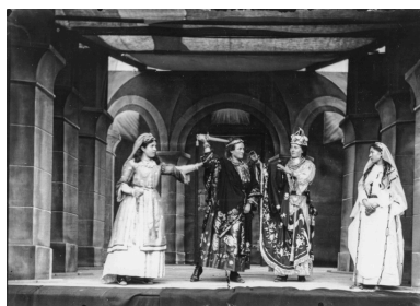
[Scène du Martyre de sainte Reine : Clément veut poignarder sa fille, Olibrius et Léonice arrêtent sa main (5e tableau, 3e acte)]. S.d. [fin 19e ou début 20e siècle]. Autr. auteur inconnu IVR26_20242100215NUC4A