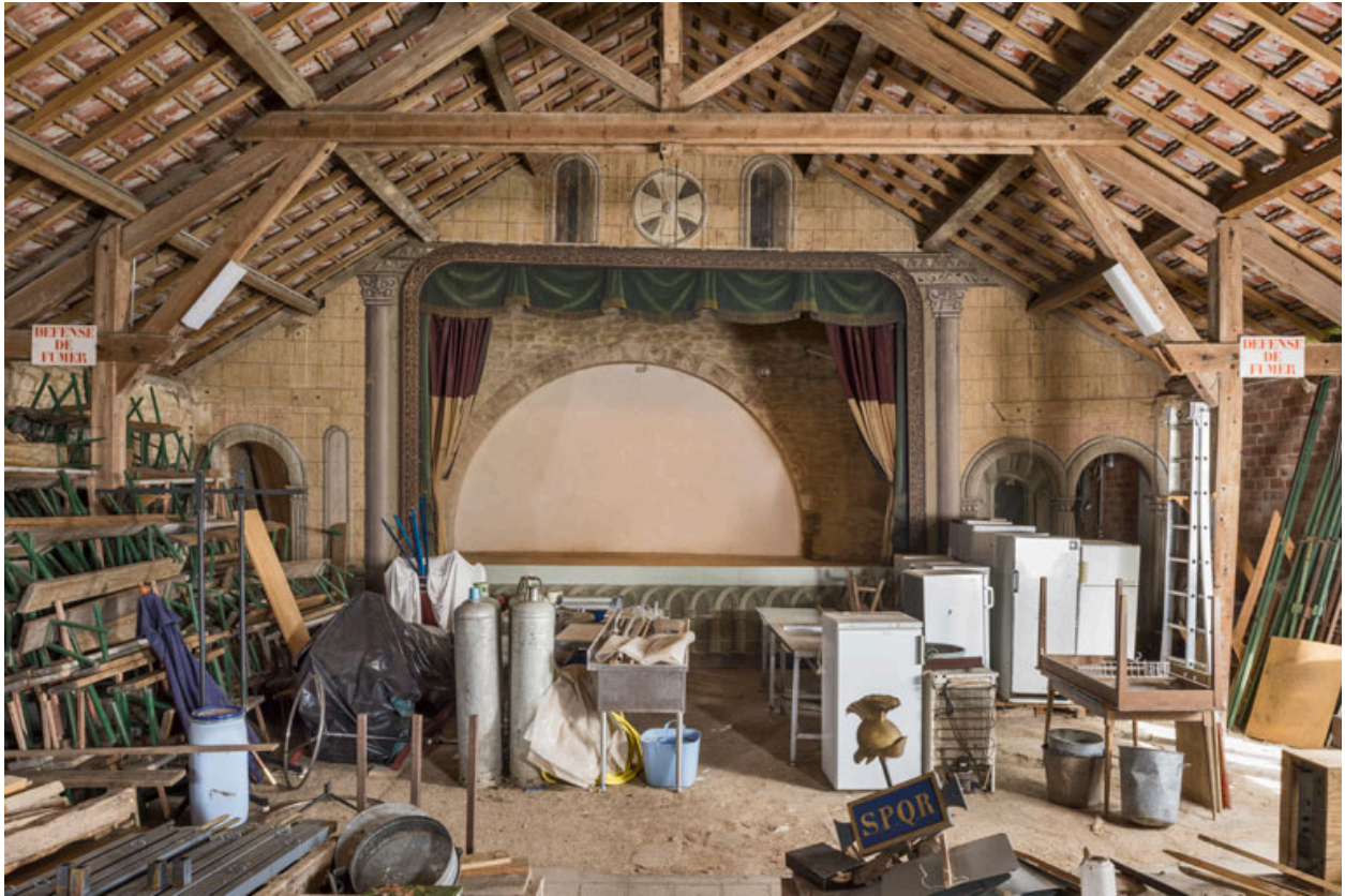
La scène, vue de la salle (vue rapprochée).