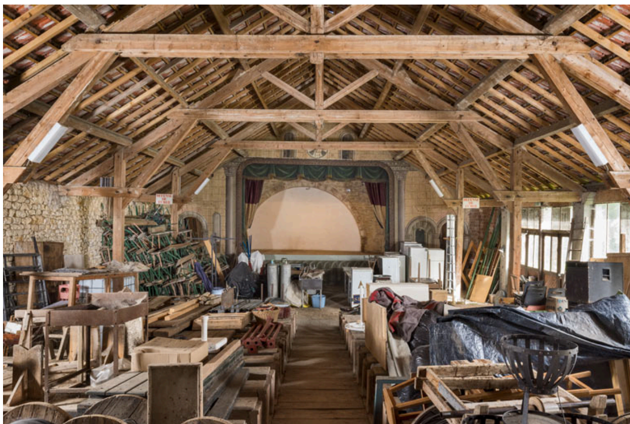
La scène, vue de la salle.