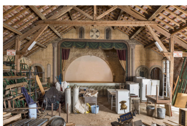
La scène, vue de la salle (vue rapprochée).