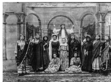
[Deux scènes du Martyre de sainte Reine : la tragédie]. S.d. [entre 1897 et 1904]. Autr. auteur inconnu IVR26_20242100216NUC4A