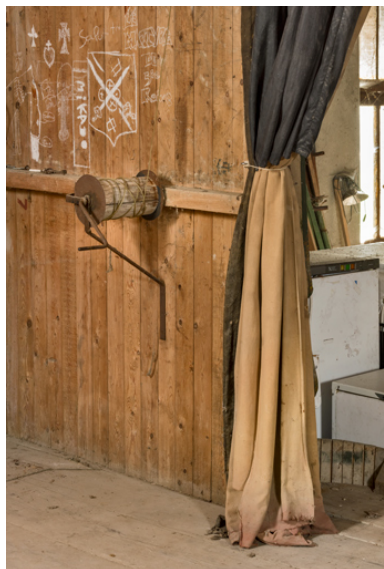
Treuil pour la manoeuvre du rideau de scène.

IVR26_20242100205NUC4A