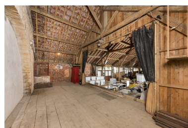
La scène, vue depuis le côté jardin (ouest).