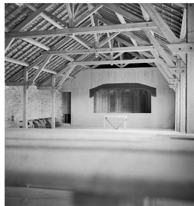
[La scène, vue de la salle]. 1937.