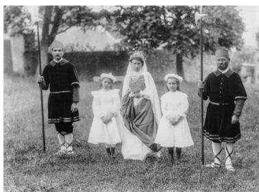
[Scène du Martyre de sainte Reine]. S.d. [fin 19e ou début 20e siècle]. Autr. auteur inconnu IVR26_20242100217NUC4A