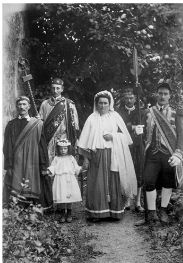
Sainte Reine enfant. 1886. IVR26_20242100219NUC4A