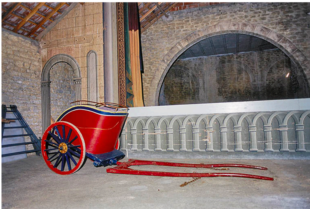
Intérieur du théâtre en 2002, avec char romain.