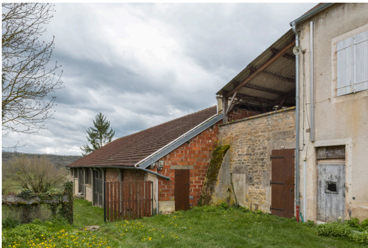
Vue d'ensemble, depuis le nord : théâtre à gauche, "ouvroir" à droite.