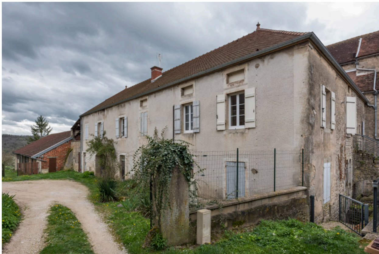
Vue d'ensemble depuis l'entrée du site, au nord. Le mur de briques du théâtre est visible à l'arrière-plan.