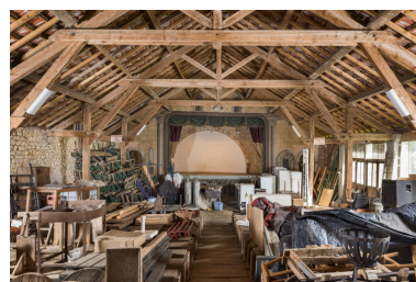
La scène, vue de la salle. IVR26_20242100208NUC4A