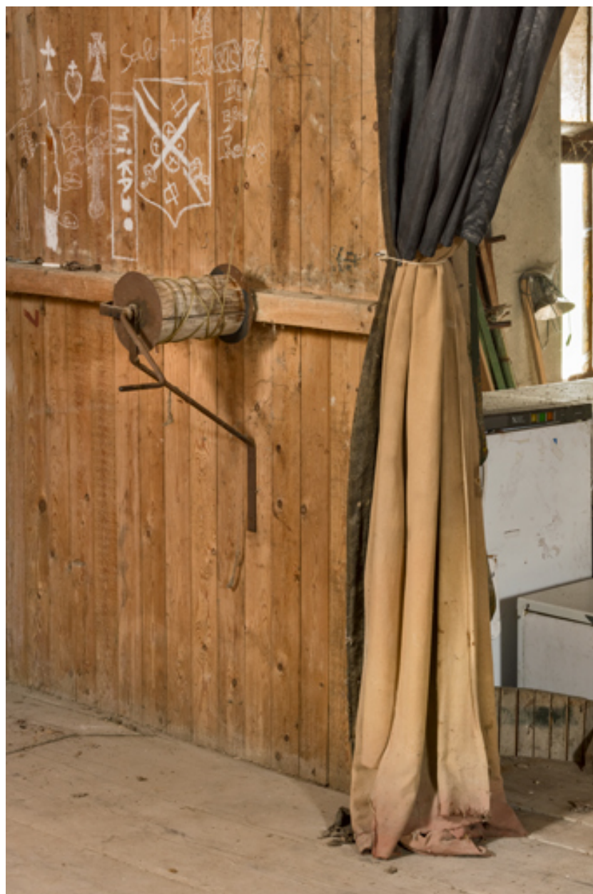
Treuil pour la manoeuvre du rideau de scène.