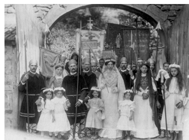
Les Sainte Reine réunies. S.d. [fin 19e ou début 20e siècle].