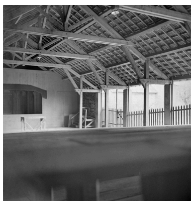
[La scène et le côté est, vus de la salle]. 1937. IVR26_20242100228NUC2A