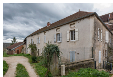
Vue d'ensemble depuis l'entrée du site, au nord. Le mur de briques du théâtre est visible à l'arrière-plan.