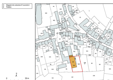
Plan-masse et de situation. Source : Direction générale des Finances Publiques - Cadastre ; mise à jour 2023, section AD, 1/1 000. IVR26_20242100310NUDA