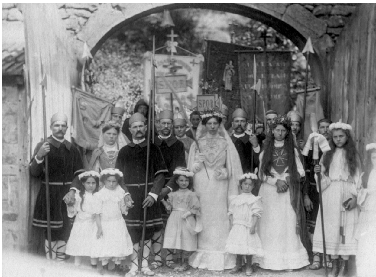
Les Sainte Reine réunies. S.d. [fin 19e ou début 20e siècle].