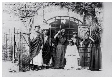
[Sainte Reine devant la fontaine]. S.d. [fin 19e ou début 20e siècle]. Autr. auteur inconnu IVR26_20242100220NUC4A