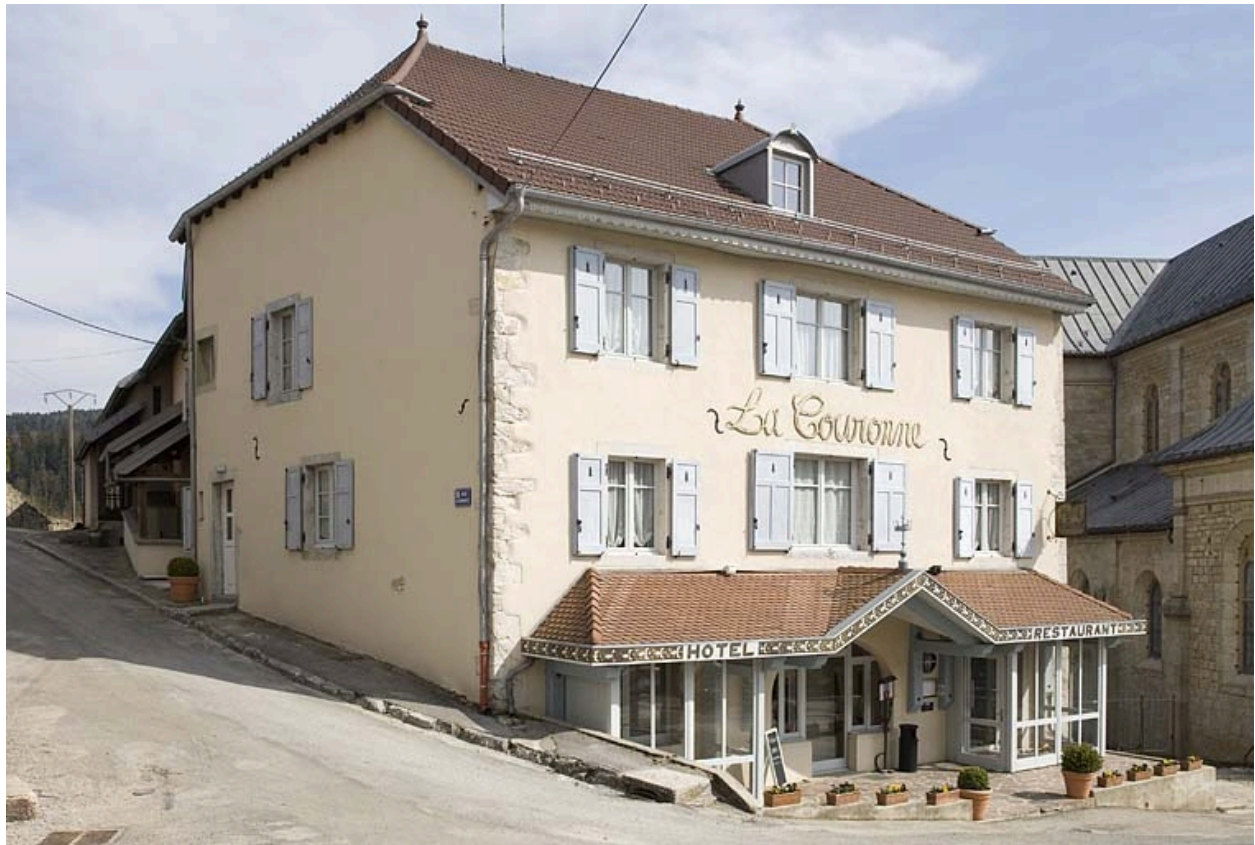
Façade antérieure et façade latérale gauche.