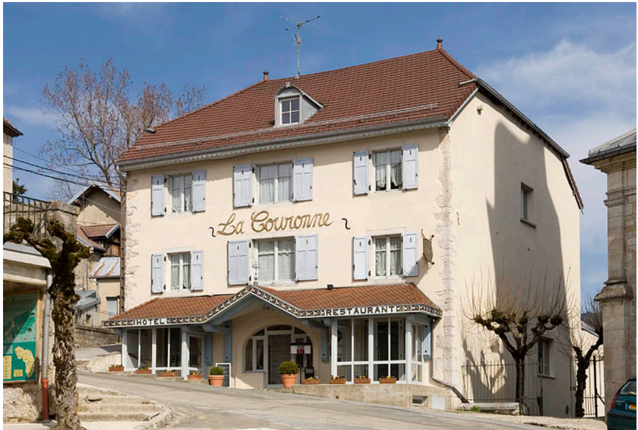
Façade antérieure et façade latérale droite.