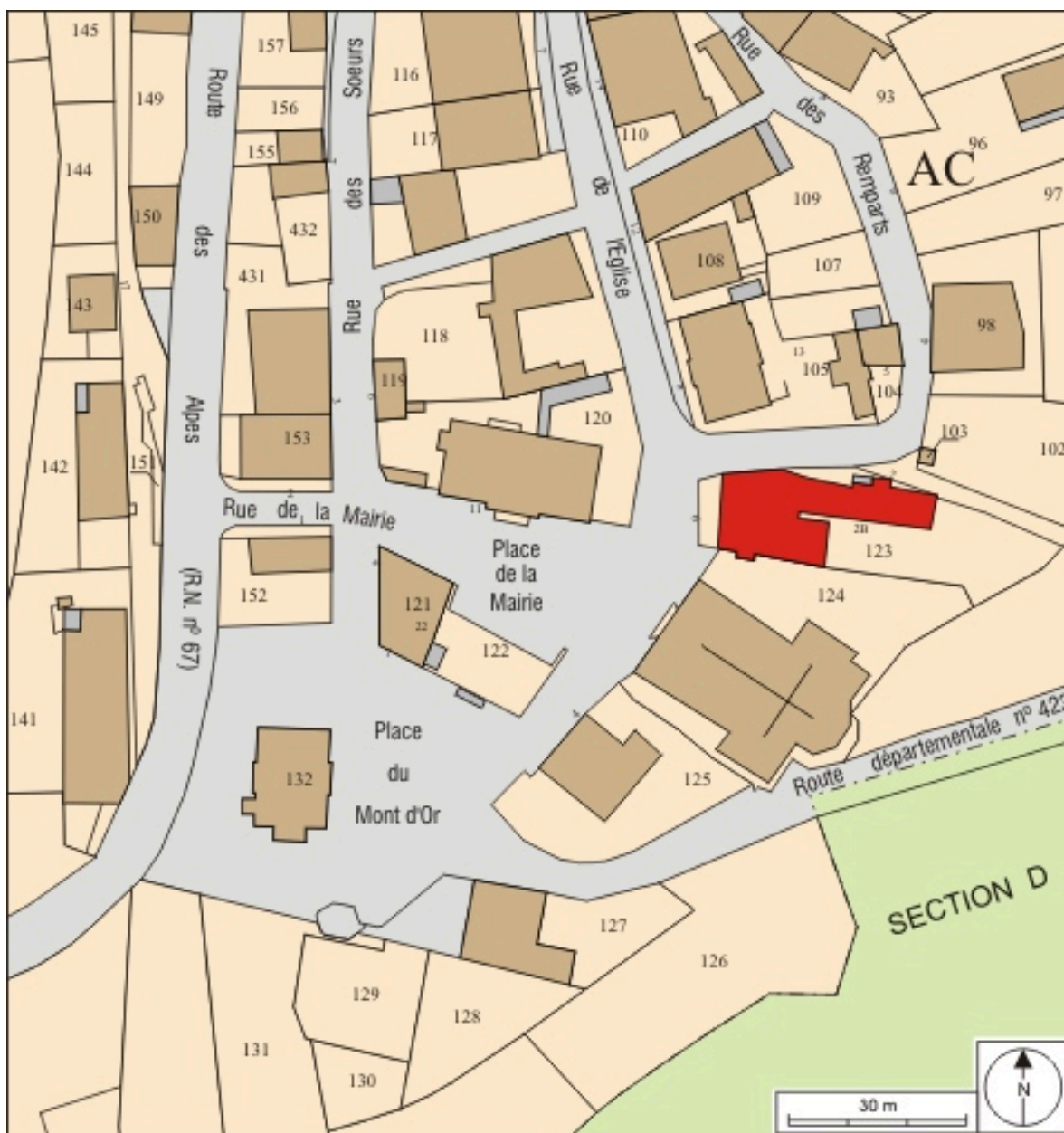
Plan-masse et de situation. Extrait du plan cadastral, 2008, section AC, échelle 1:1 000.