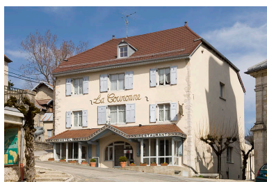
Façade antérieure et façade latérale droite. IVR43_20092501165NUC2A