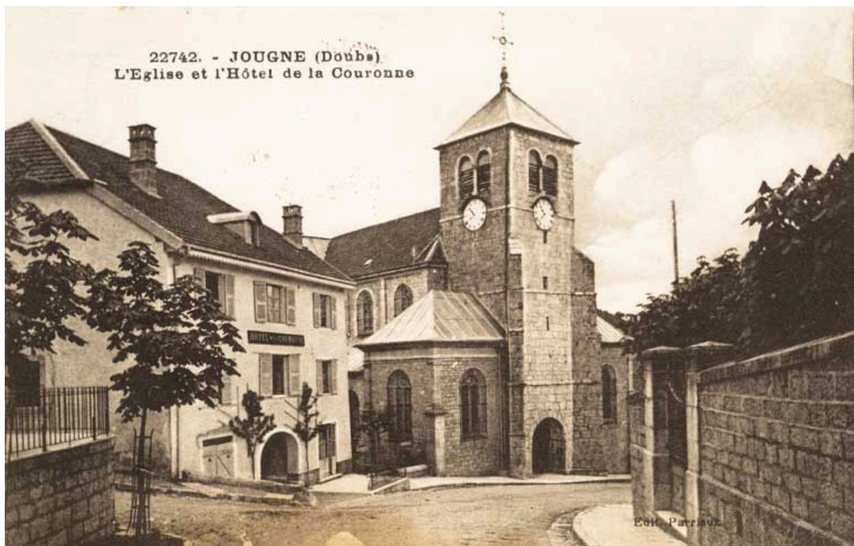
22742. - Jougne (Doubs). L'Eglise et l'Hôtel de la Couronne, [1ère moitié 20e siècle ?].