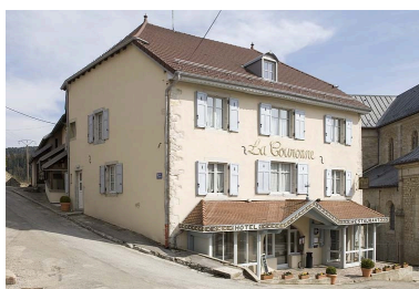
Façade antérieure et façade latérale gauche.