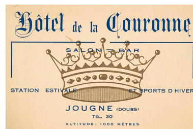
Hôtel de la Couronne. Salon- Bar. Station estivale et sports d'hiver. Jougne (Doubs), vignette publicitaire, s.d. [20e siècle].