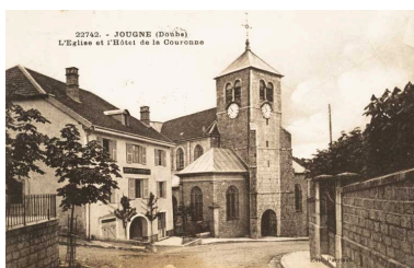
22742. - Jougne (Doubs). L'Église et l'Hôtel de la Couronne, [1ère moitié 20e siècle ?]. Phot. IVR43_20112500019NUC4A