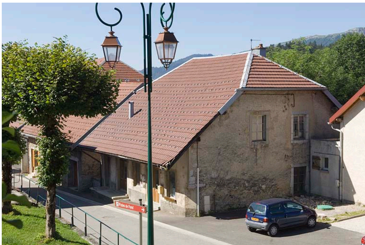
Façade antérieure et façade latérale droite.