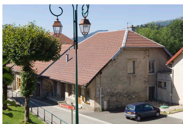
Façade antérieure et façade latérale droite.