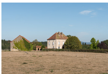
Vue de l'ancienne ferme de Parigny IVR26_20197100357NUC4A