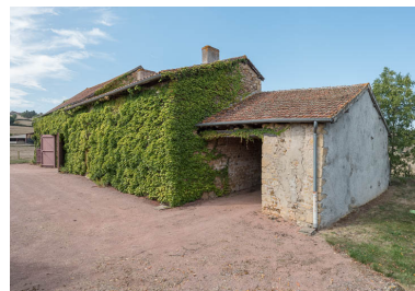
Vue du même ensemble, depuis l'est IVR26_20197100338NUC4A