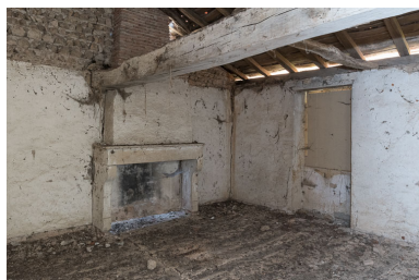
Chambre à l'étage, dans l'ancienne maison. Un plancher sépare la pièce des combles, au niveau où s'arrête l'enduit à la chaux, de couleur blanche, couvrant les murs. IVR26_20197100356NUC4A