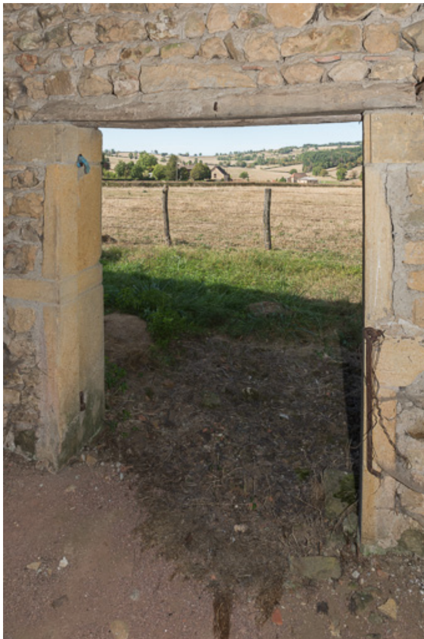
Vue du paysage environnant, depuis l'ouverture au fond du hangar