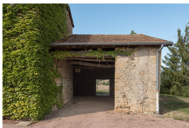
Vue du hangar agricole, construit contre le mur-pignon est de l'ancienne maison IVR26_20197100344NUC4A