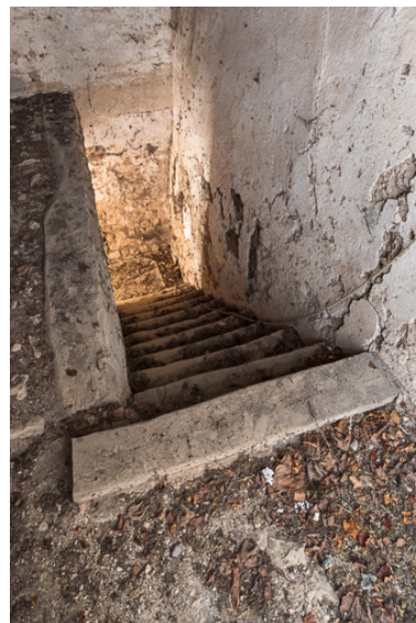
Escalier de l'ancienne maison, à deux volées droites IVR26_20197100355NUC4A