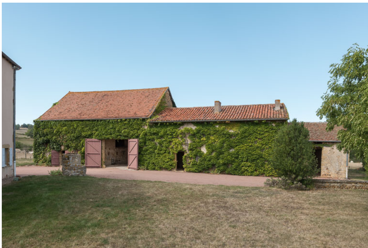
Vue du même ensemble, depuis le sud