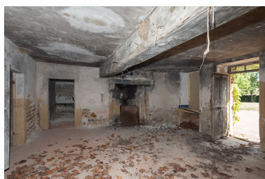
Vue de la pièce principale (cuisine) de l'ancienne maison IVR26_20197100349NUC4A