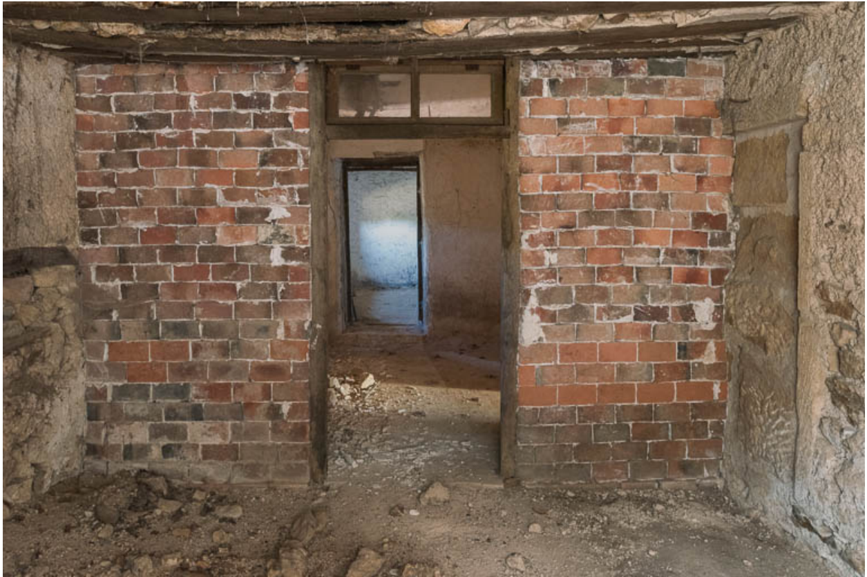
Vue intérieure de l'appentis abritant la bassie (ou arrière-cuisine). Une cloison en briques, ajoutée au XIXe siècle, a amené le bouchage d'une ancienne porte.