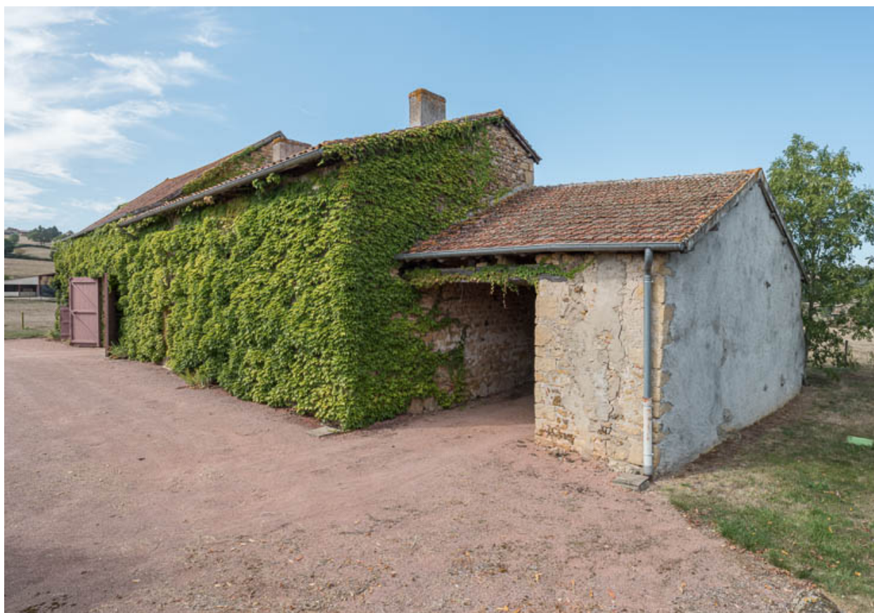
Vue du même ensemble, depuis l'est