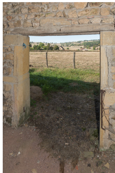
Vue du paysage environnant, depuis l'ouverture au fond du hangar