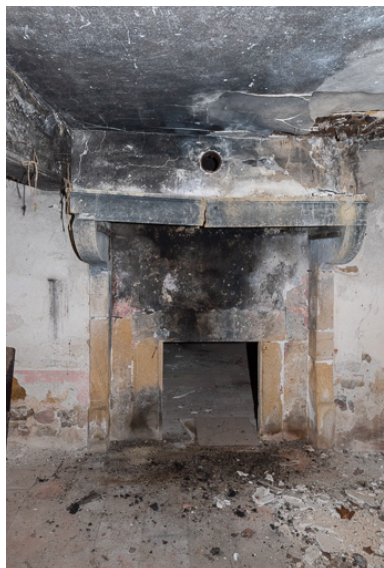
Vue de la cheminée de la cuisine, dans l'ancienne maison. Il s'agit d'un foyer double, donnant à la fois dans la cuisine et dans la pièce voisine. L'âtre est percé d'une ouverture, fermée d'une plaque en fonte. Ce type de cheminée est assez répandu dans l'architecture rurale du Brionnais des XVIIIe et XIXe siècles. IVR26_20197100351NUC4A