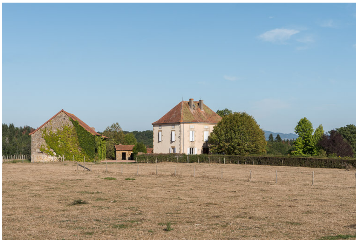
Vue de l'ancienne ferme de Parigny