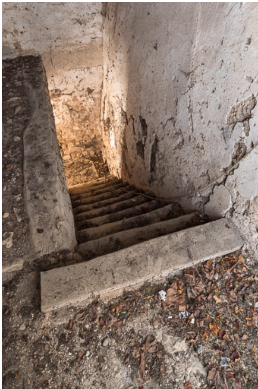
Escalier de l'ancienne maison, à deux volées droites