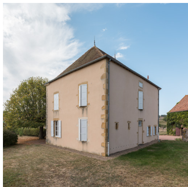
Vue de la façade postérieure de la demeure et de sa façade latérale est IVR26_20197100339NUC4A