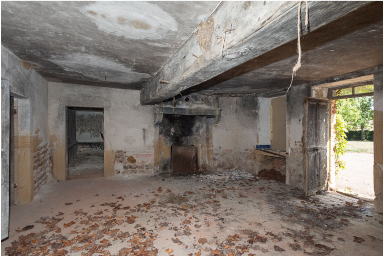
Vue de la pièce principale (cuisine) de l'ancienne maison