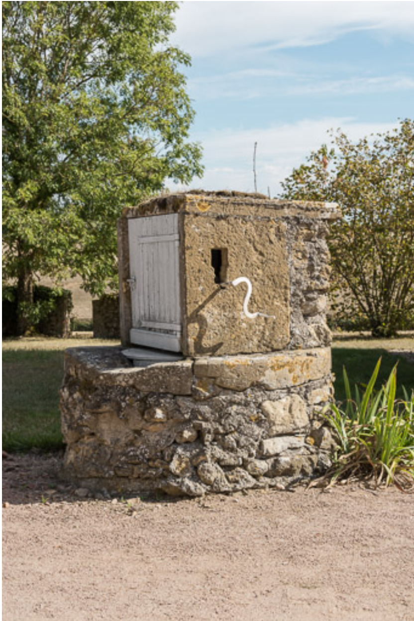
Vue du puits, dans la cour