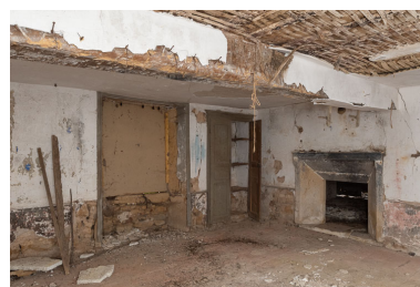
Vue d'une chambre, au rez-de-chaussée de l'ancienne maison, à droite de la cuisine IVR26_20197100353NUC4A