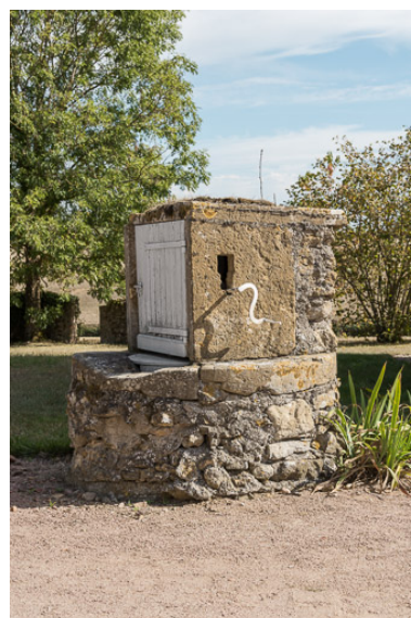
Vue du puits, dans la cour