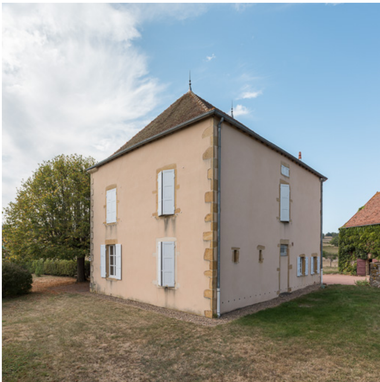
Vue de la façade postérieure de la demeure et de sa façade latérale est