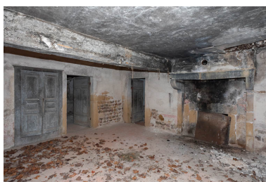
Vue de la pièce principale (cuisine) de l'ancienne maison IVR26_20197100350NUC4A