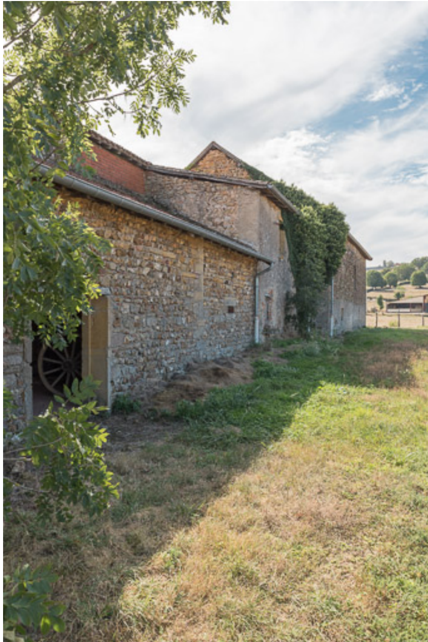
Vue de la façade postérieure du même ensemble: de gauche à droite, le hangar agricole, l'ancienne maison avec son appentis et la grange