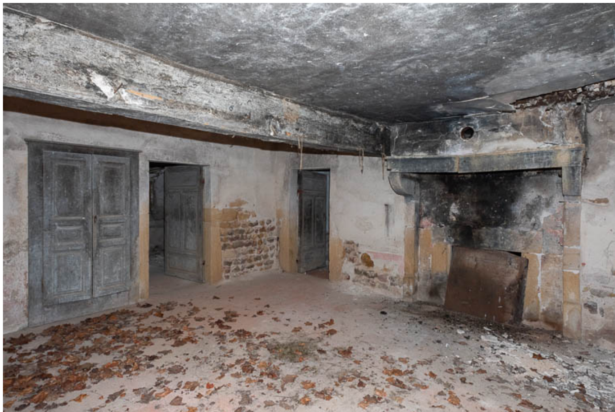
Vue de la pièce principale (cuisine) de l'ancienne maison