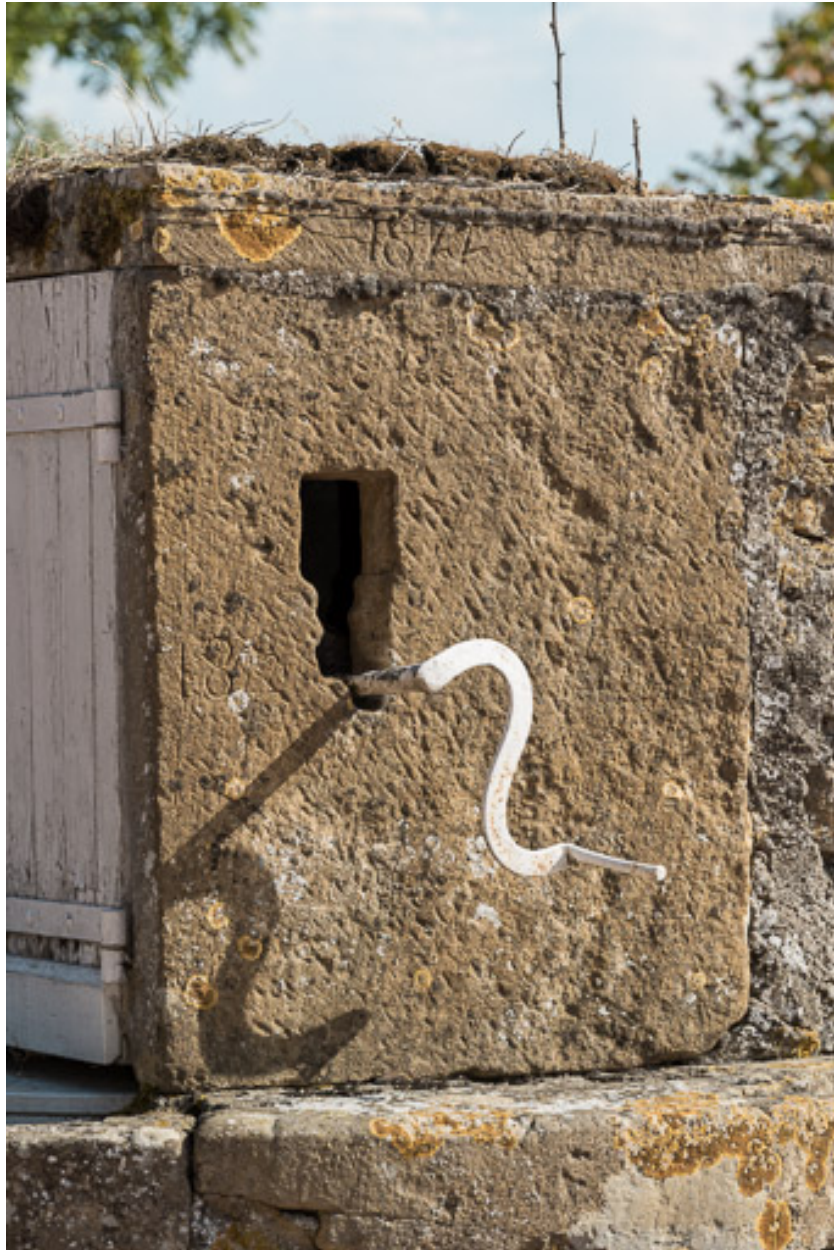
Détail du puits : superstructure avec la date "1822" gravée en partie haute