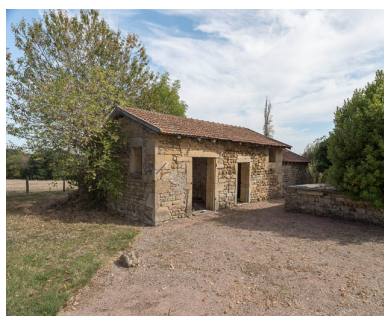
Vue du bâtiment abritant le four à pain et les soues à cochons, à l'est de la cour IVR26_20197100343NUC4AQ