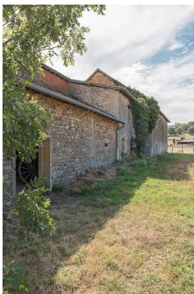
Vue de la façade postérieure du même ensemble: de gauche à droite, le hangar agricole, l'ancienne maison avec son appentis et la grange