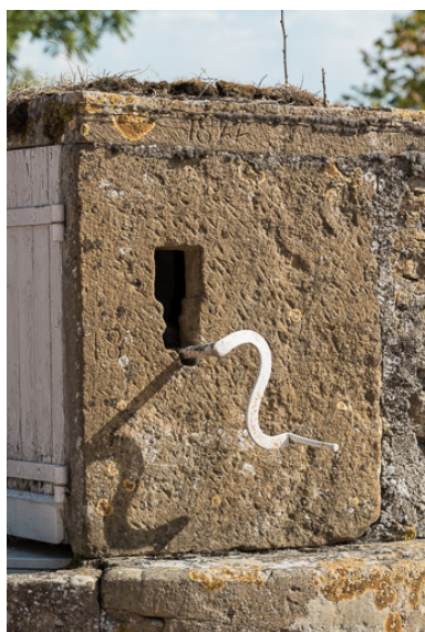
Détail du puits : superstructure avec la date "1822" gravée en partie haute IVR26_20197100348NUC4A