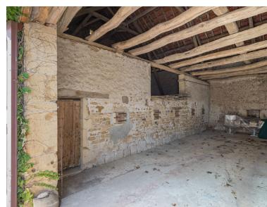
Vue intérieure de la grange. Le mur entre la remise et l'étable est percé de feurons. IVR26_20197100341NUC4A