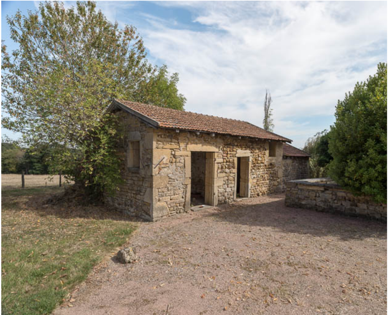
Vue du bâtiment abritant le four à pain et les soues à cochons, à l'est de la cour