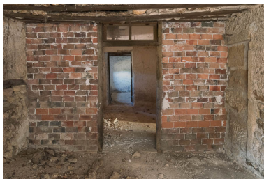
Vue intérieure de l'appentis abritant la bassie (ou arrière-cuisine). Une cloison en briques, ajoutée au XIXe siècle, a amené le bouchage d'une ancienne porte.