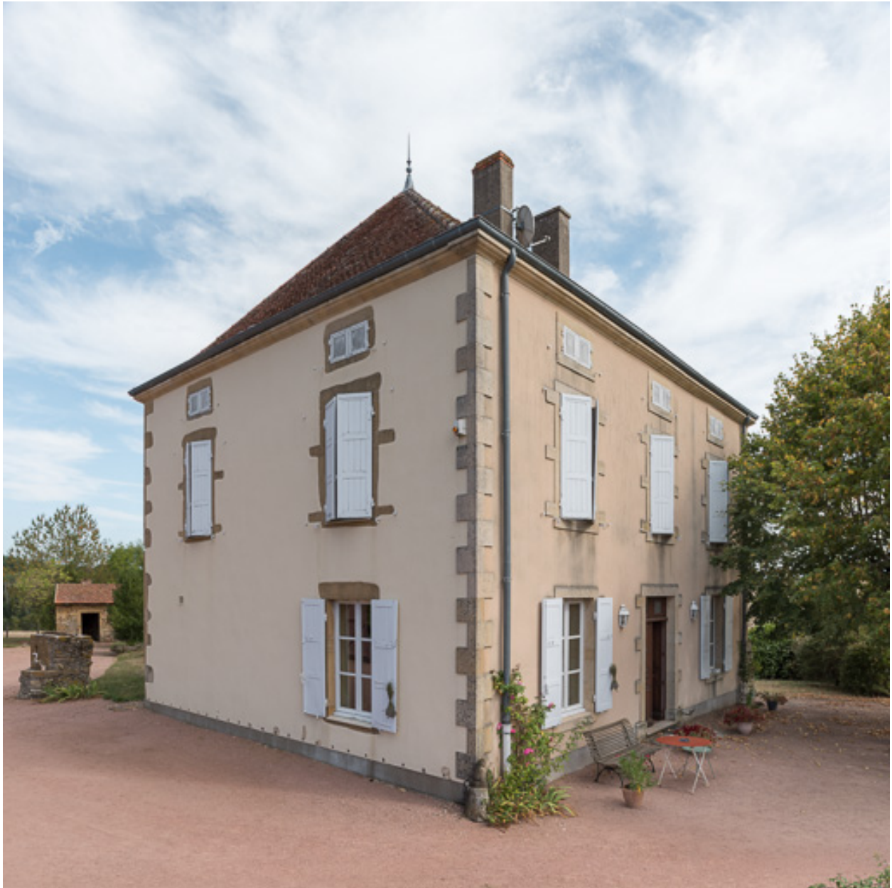
Vue de la façade antérieure de la demeure, construite à la fin du XIXe siècle, et de sa façade latérale ouest