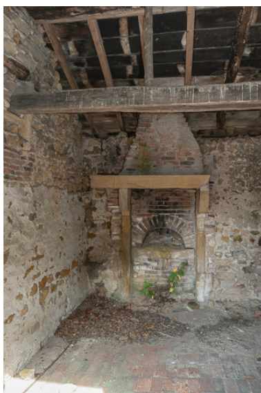
Vue intérieure du four à pain IVR26_20197100345NUC4A