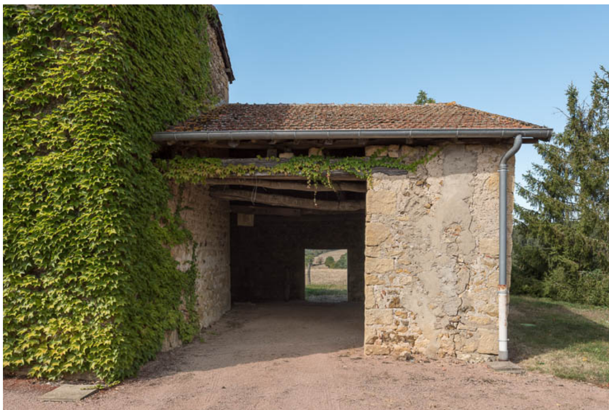
Vue du hangar agricole, construit contre le mur-pignon est de l'ancienne maison