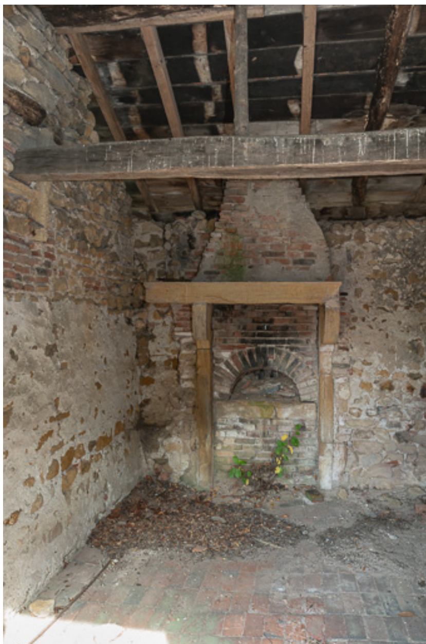
Vue intérieure du four à pain