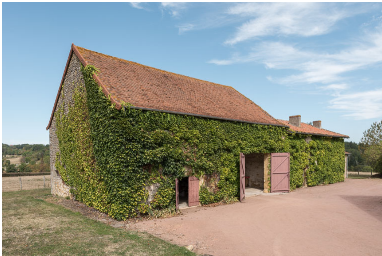
Vue de l'ensemble formé par la grange, l'ancienne maison (XVIII e siècle) et un hangar, ajouté postérieurement, depuis l'ouest