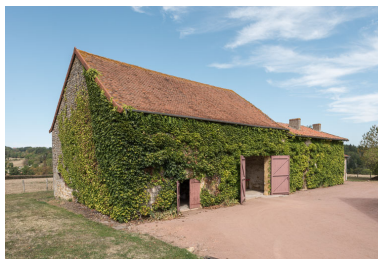
Vue de l'ensemble formé par la grange, l'ancienne maison (XVIII e siècle) et un hangar, ajouté postérieurement, depuis l'ouest IVR26_20197100337NUC4A