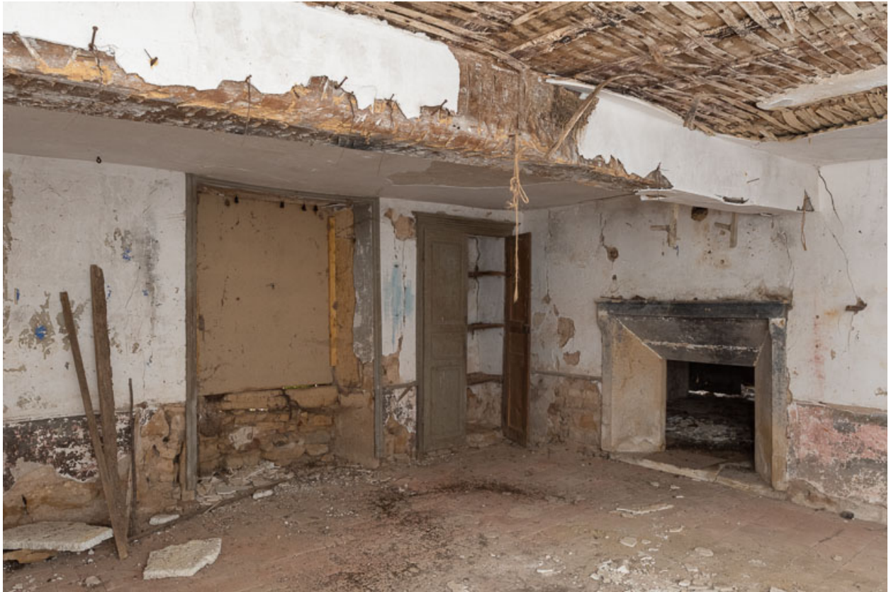
Vue d'une chambre, au rez-de-chaussée de l'ancienne maison, à droite de la cuisine