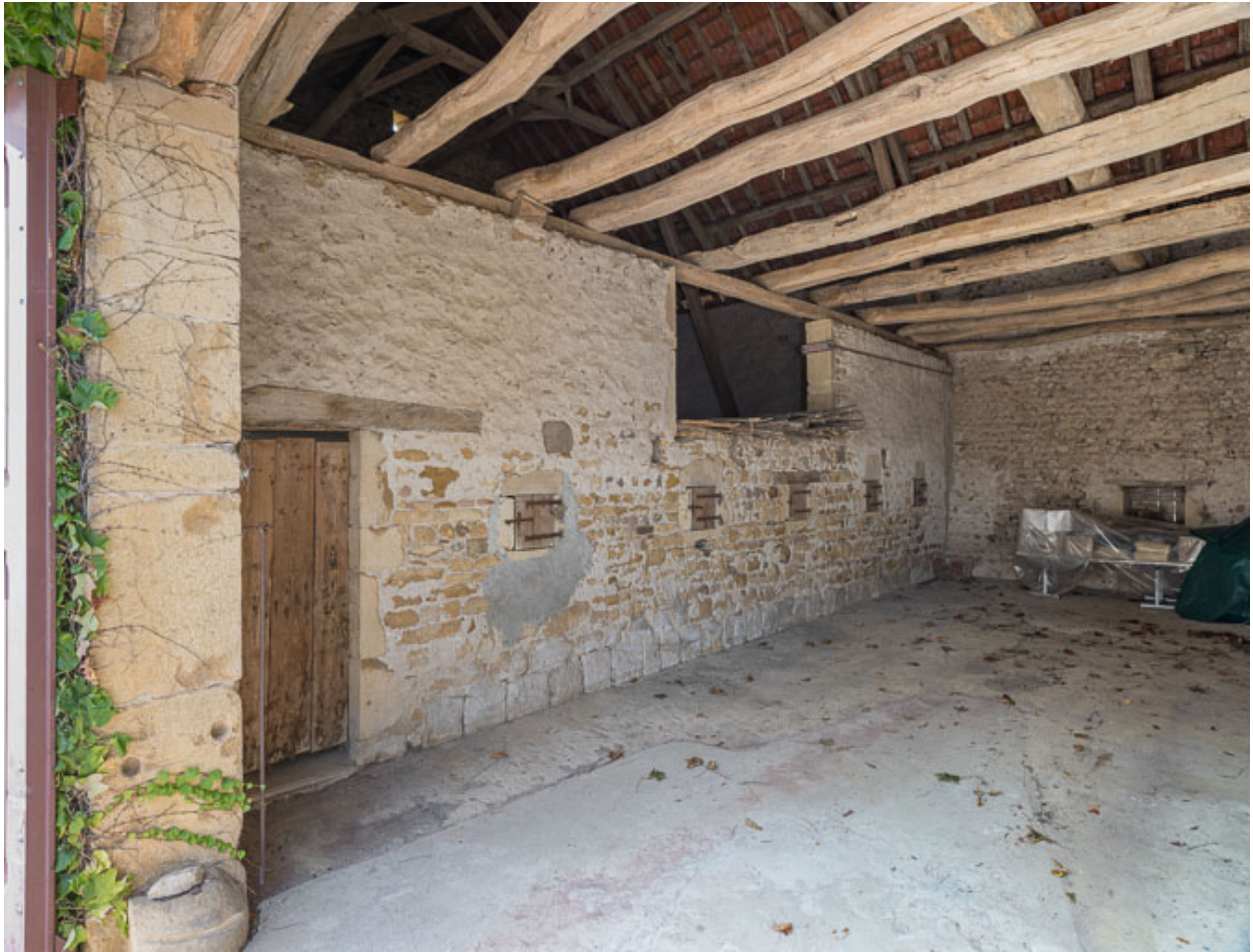
Vue intérieure de la grange. Le mur entre la remise et l'étable est percé de feurons.