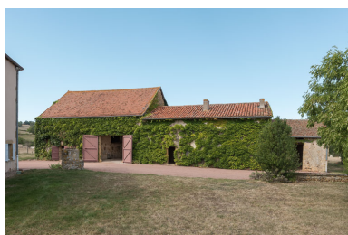
Vue du même ensemble, depuis le sud IVR26_20197100340NUC4A