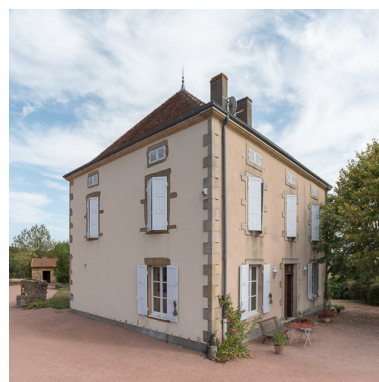
Vue de la façade antérieure de la demeure, construite à la fin du XIXe siècle, et de sa façade latérale ouest IVR26_20197100336NUC4A