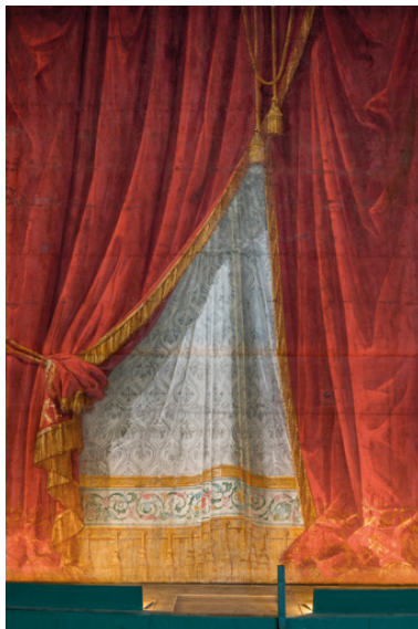
Vue de détail.

IVR26_20257101005NUC4A