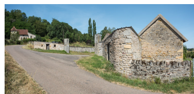
Vue sur l'entrée de la ferme. Le bâtiment agricole, au fond à gauche, a notamment servi de bergerie et a été rattaché à cette ferme au milieu du XIXe siècle. Il est aujourd'hui transformé en habitation. IVR26_20197100151NUC4AQ