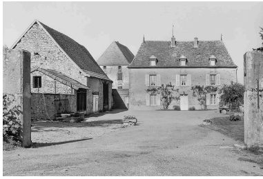
Vue de la ferme vers 1970 IVR26_20207100099NUC2