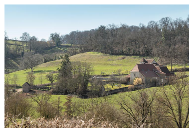
Vue de la ferme, depuis la colline de la Roue, à l'est. IVR26_20197100744NUC4A