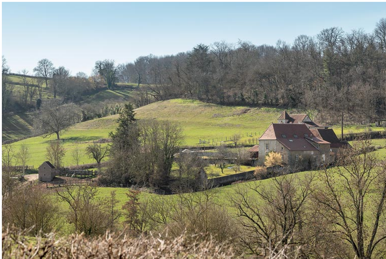
Vue de la ferme, depuis la colline de la Roue, à l'est.