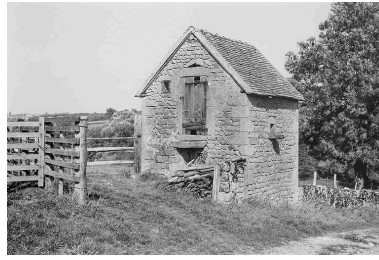
Vue d'un édicule à l'entrée d'un pré de la propriété, mentionné dans certaines sources comme bergerie, mais qui a pu aussi servir d'abri aux gardes de pré.