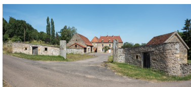
Vue d'ensemble de la ferme. IVR26_20197100150NUC4AQ

IVR26_20197100019NUDA