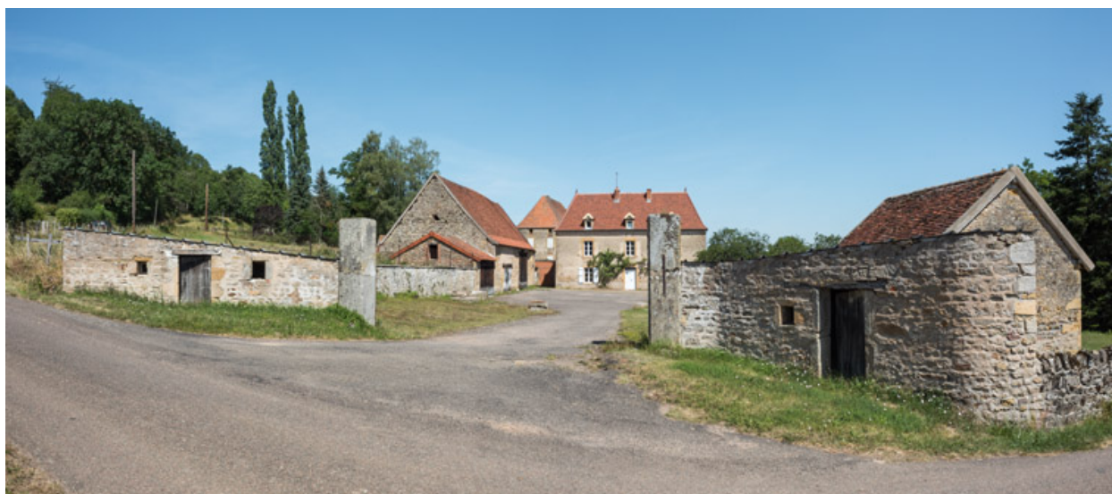
Vue d'ensemble de la ferme.