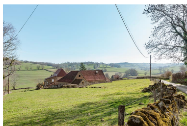
Vue de la ferme depuis la route, en venant de Chaumont. Plusieurs volumes (principalement en appentis) se développent à l'arrière des bâtiments principaux.