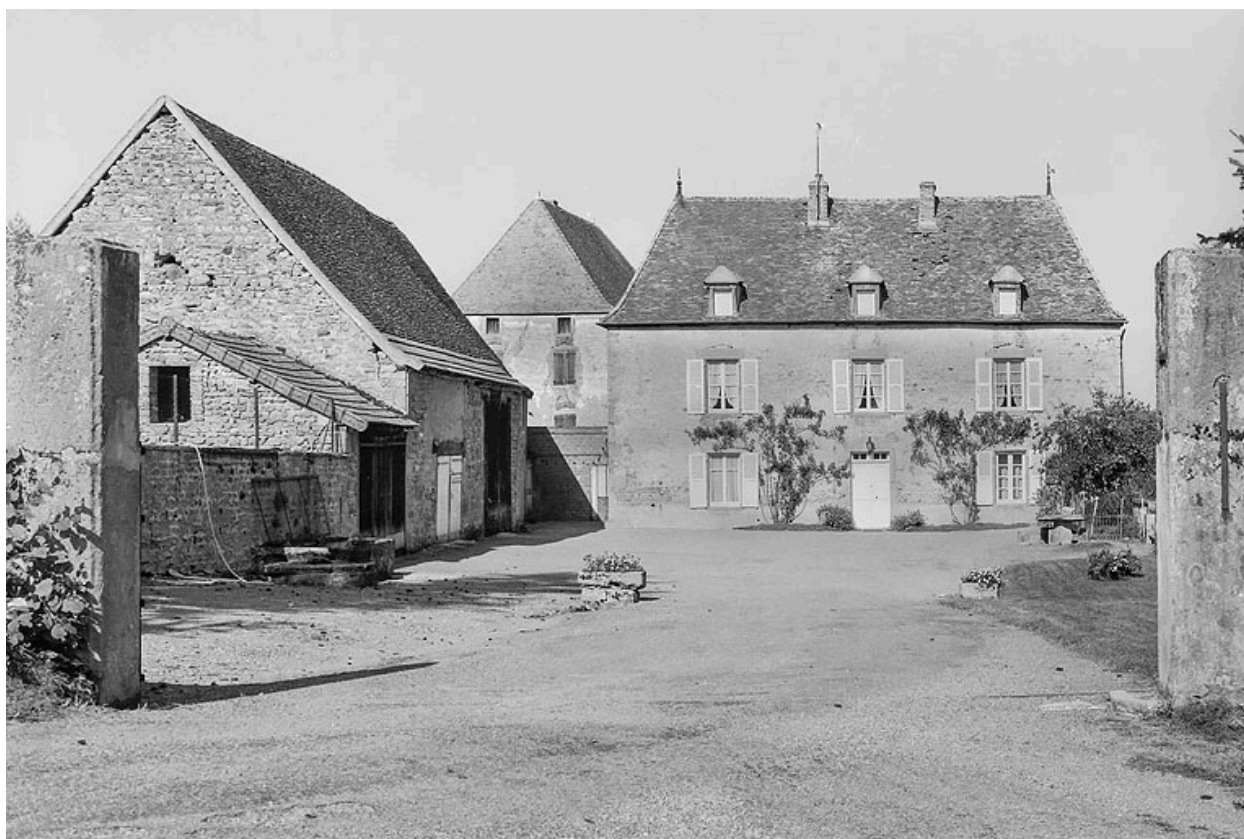
Vue de la ferme vers 1970