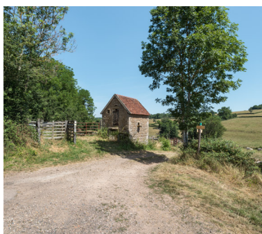
Petit bâtiment, à proximité de la ferme, qui servait peut-être d'abri aux gardes de pré IVR26_20197100152NUC4AQ