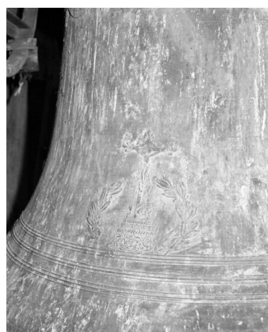
Détail : Christ en croix.