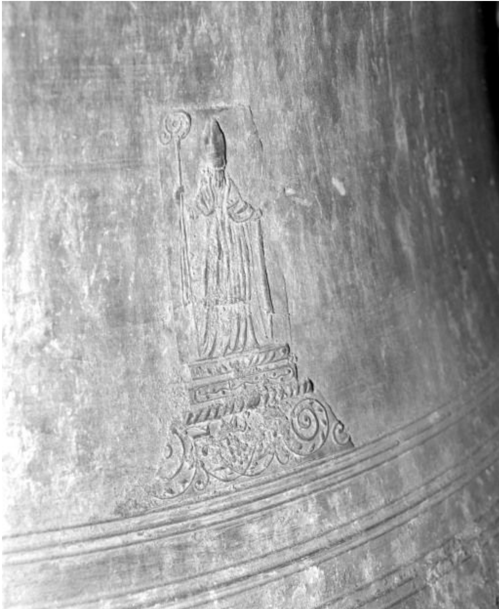
Détail : saint évêque.