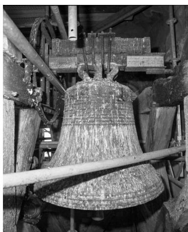
Vue pendant les travaux du clocher. IVR26_20017101082X