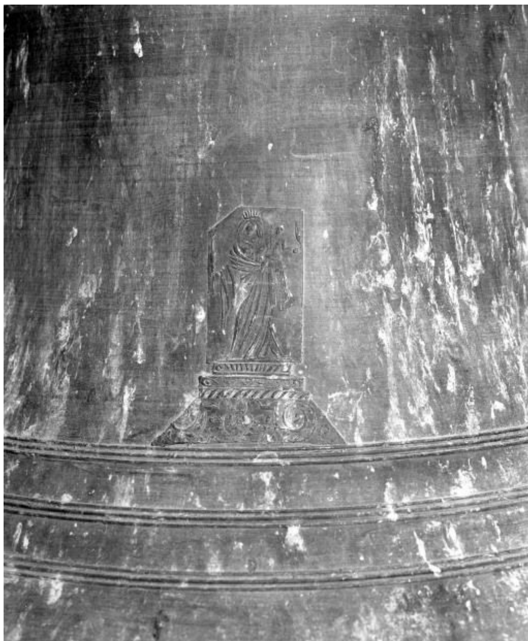
Détail : Vierge à l'Enfant.