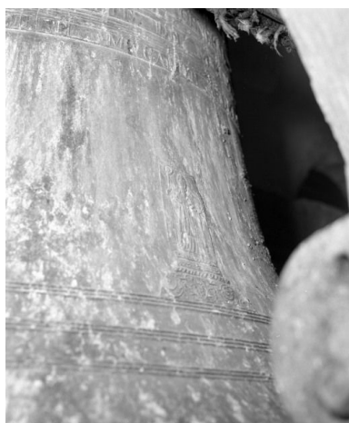
Détail : saint évêque.