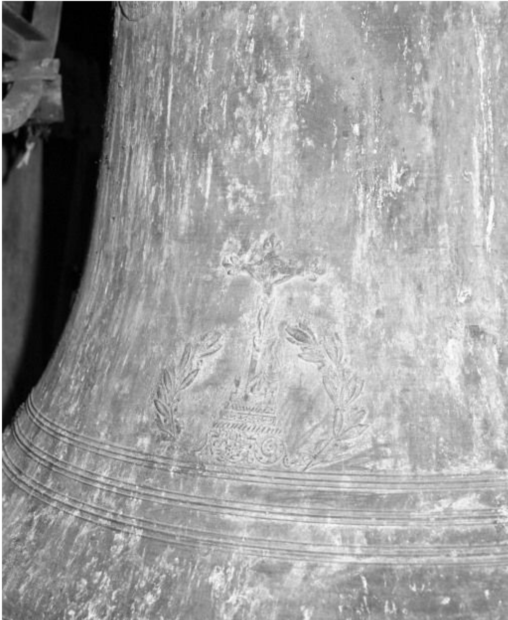
Détail : Christ en croix.