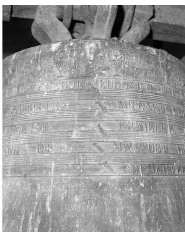
Détail : vase supérieur.