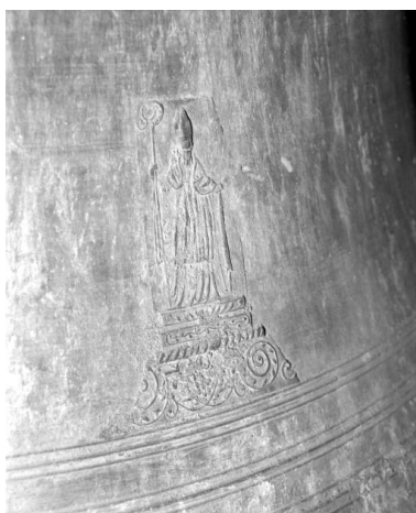
Détail : saint évêque. IVR26_20037101757X