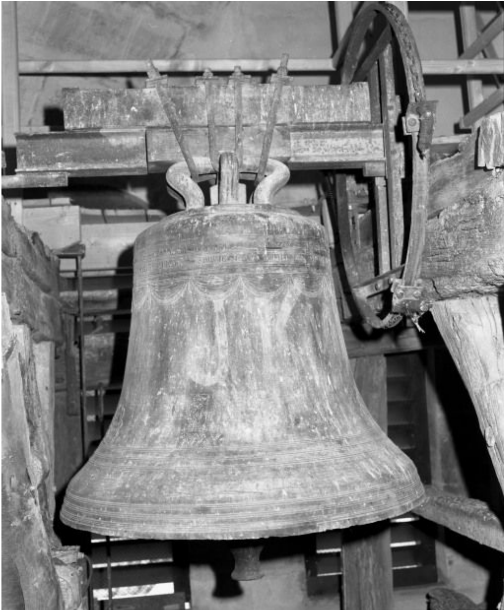
Vue d'ensemble, face postérieure.