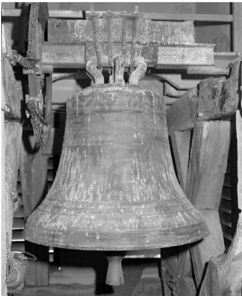
Vue d'ensemble face postérieure.