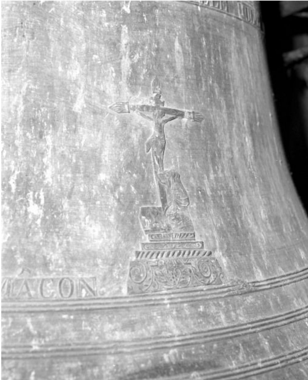
Détail : Christ en croix.