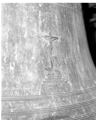
Détail : Christ en croix.