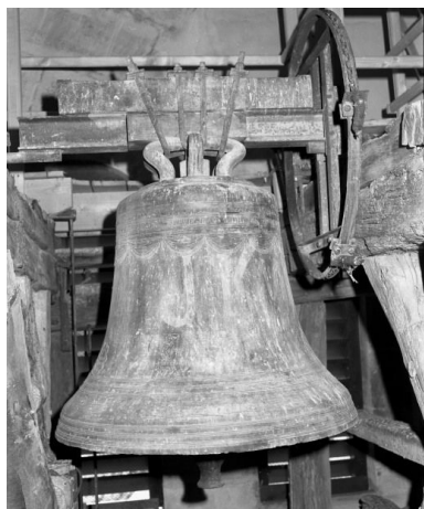
Vue d'ensemble, face postérieure. IVR26_20037101754X