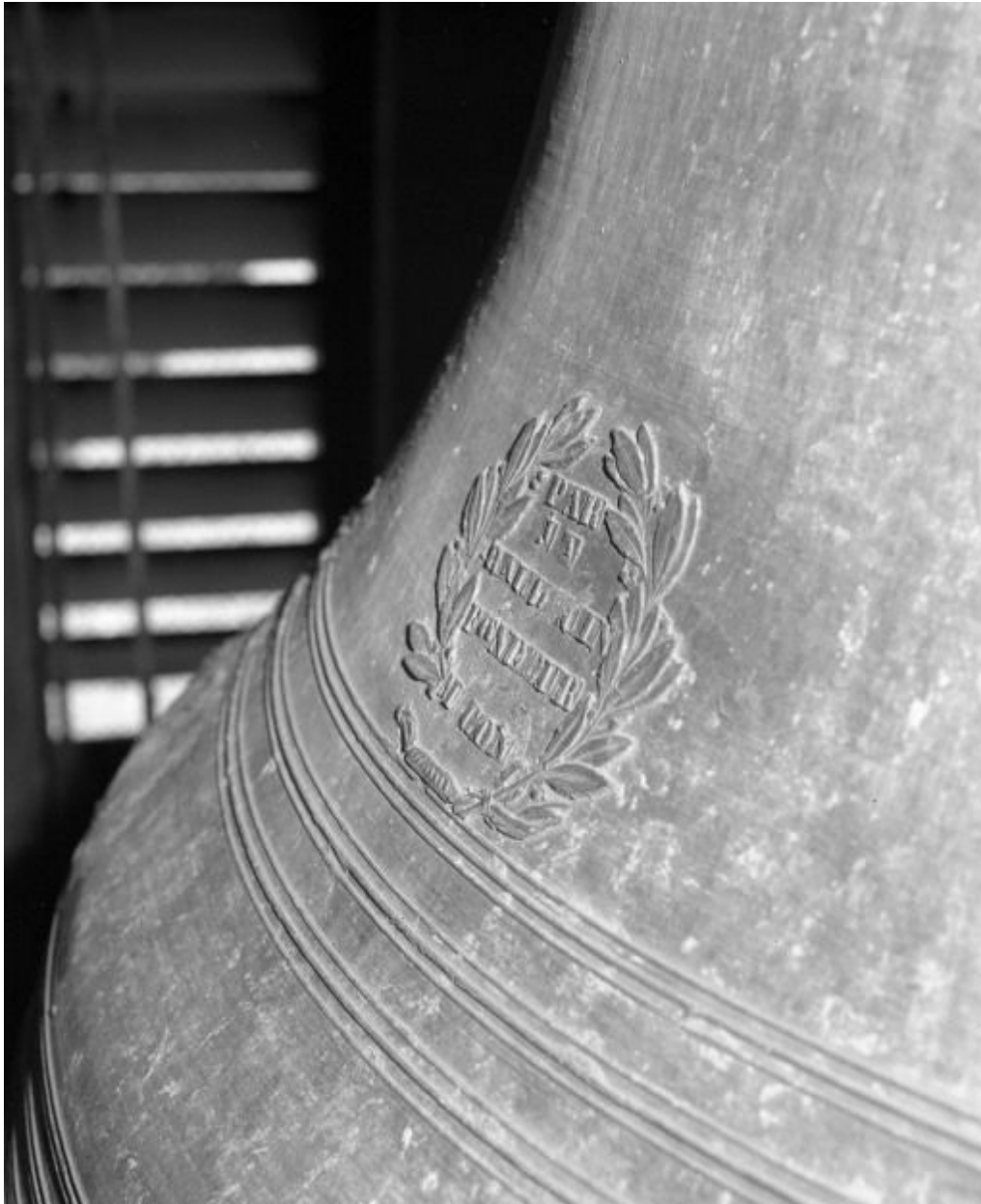
Détail : cachet du fondeur.