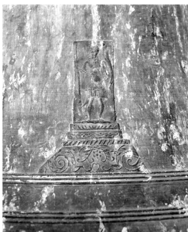
Détail : saint Michel. IVR26_20037101765X