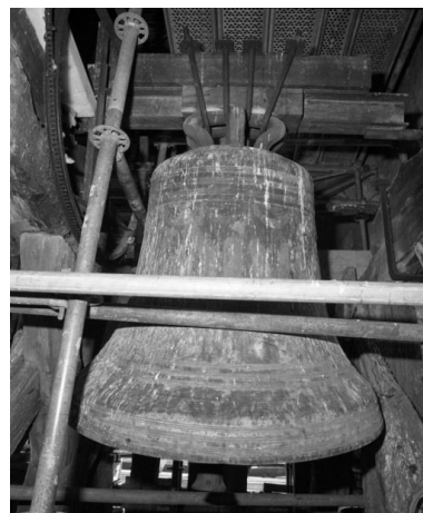
Vue pendant les travaux du clocher. IVR26_20017101081X