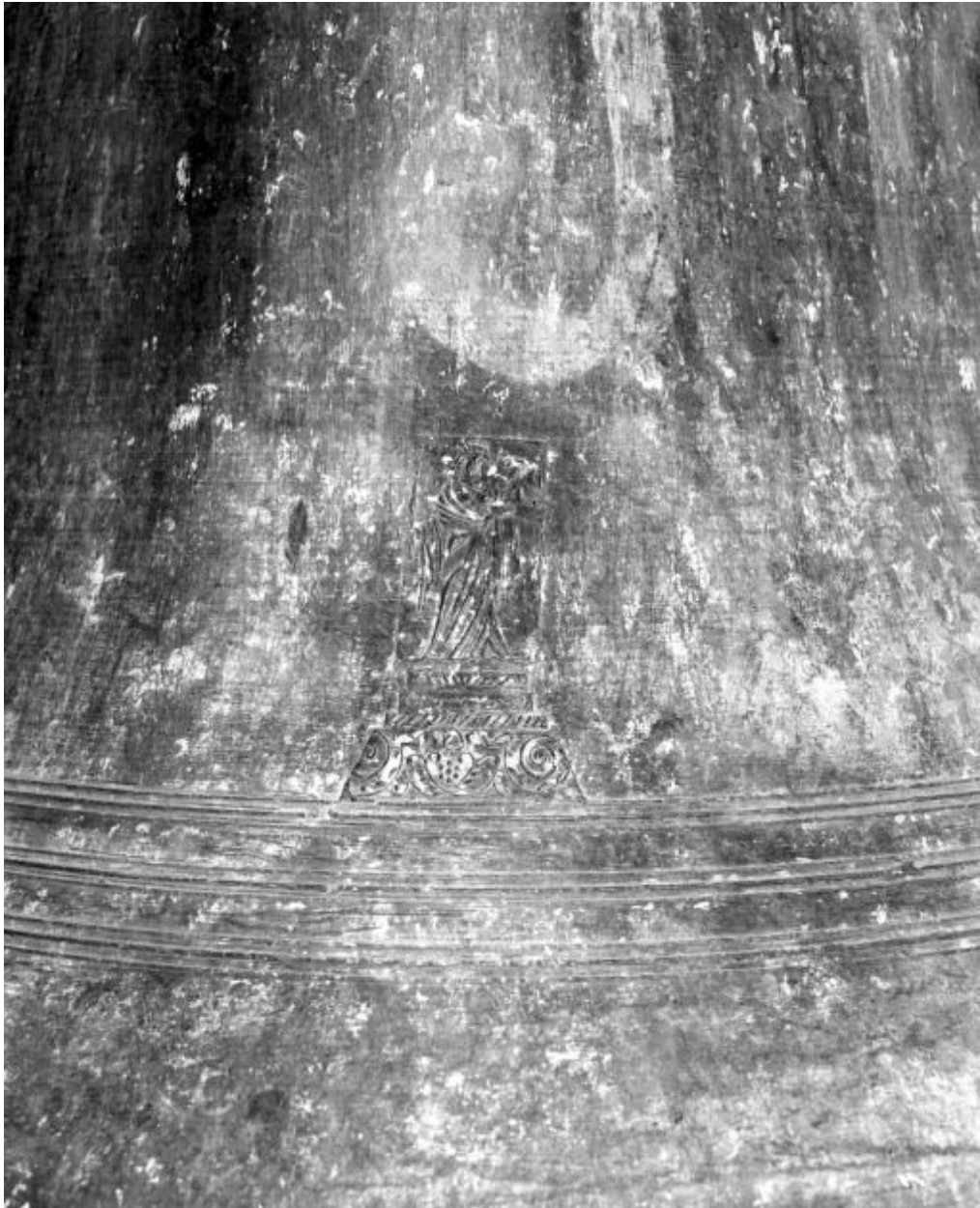
Détail : Vierge à l'Enfant.