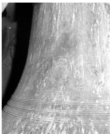
Détail : Armoiries. IVR26_20037101758X