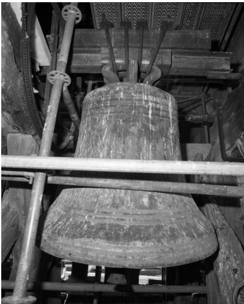
Vue pendant les travaux du clocher.