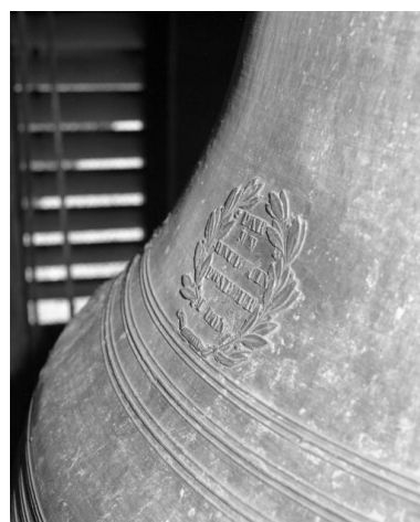
Détail : cachet du fondeur. IVR26_20037101759X