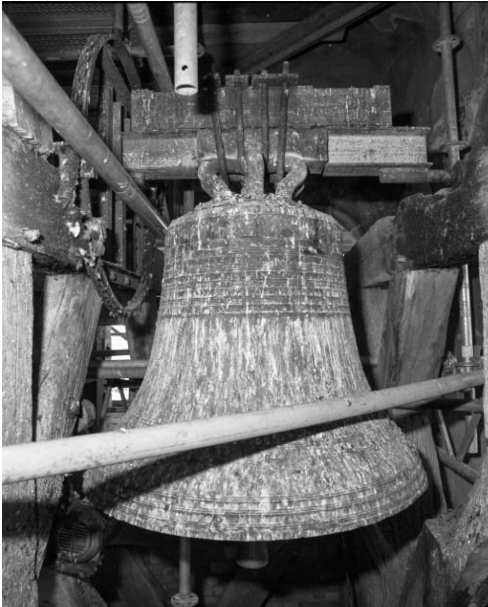
Vue pendant les travaux du clocher.