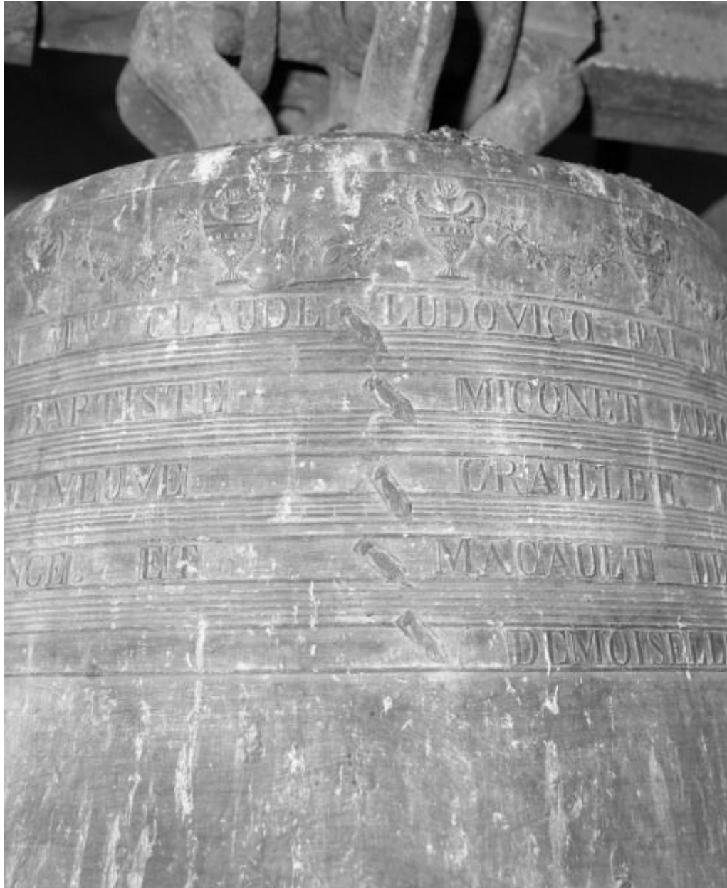
Détail : vase supérieur.