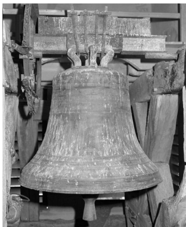
Vue d'ensemble face postérieure. IVR26_20037101760X