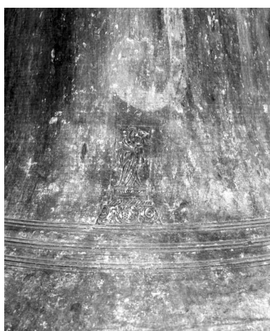
Détail : Vierge à l'Enfant. IVR26_20037101755X