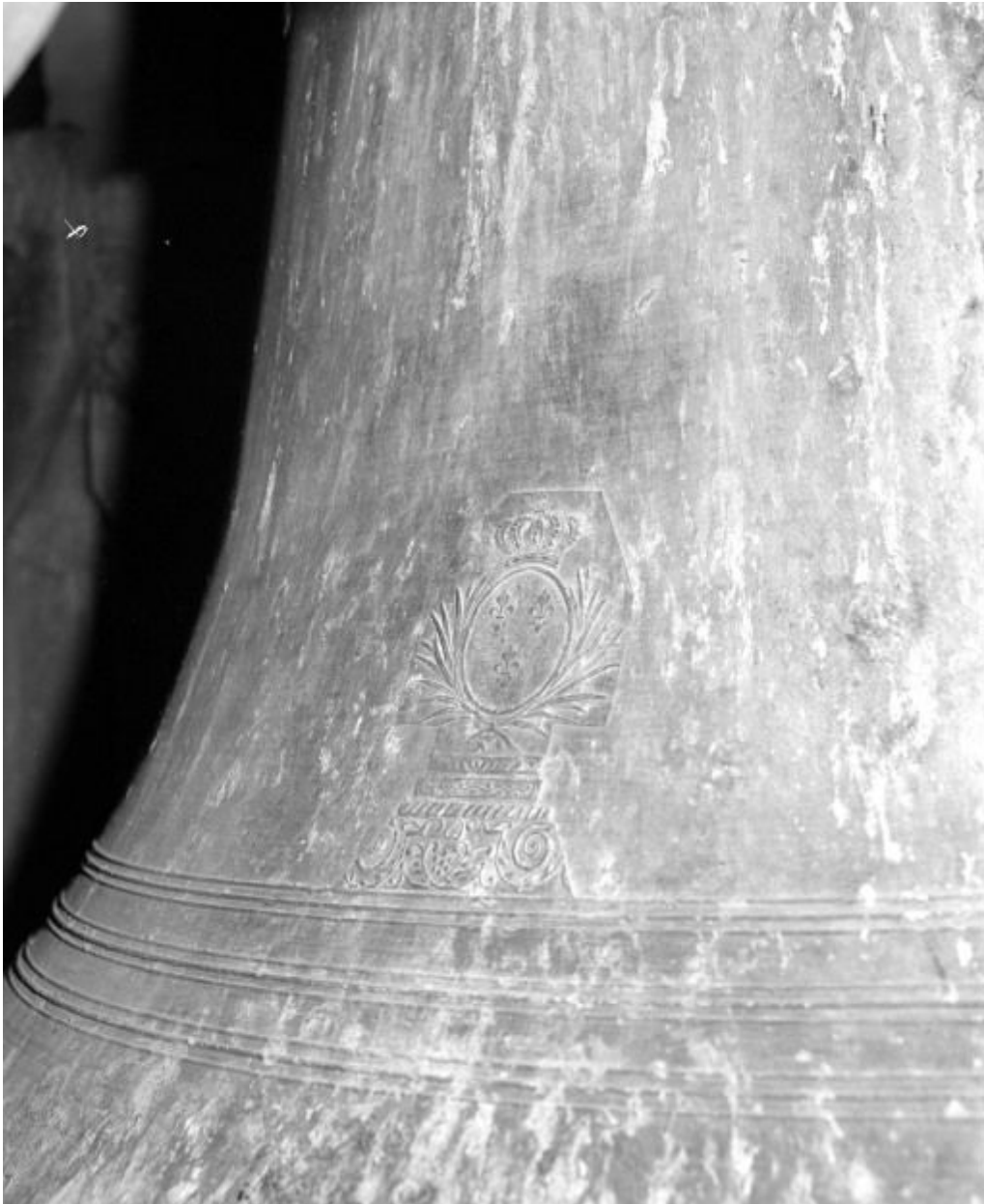
Détail : Armoiries.