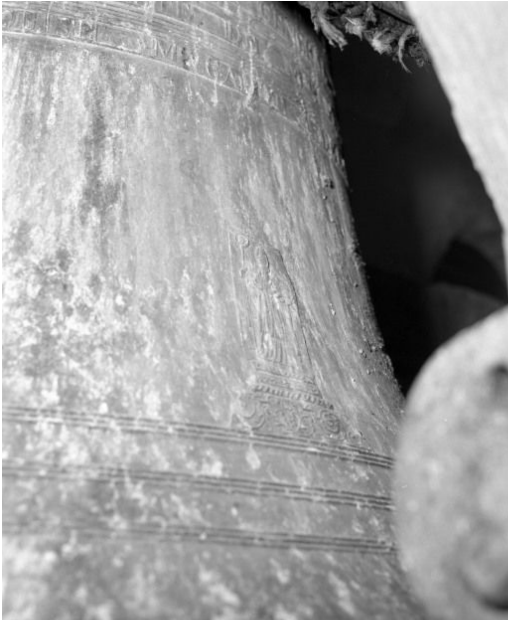
Détail : saint évêque.