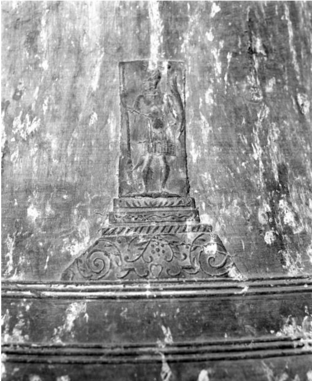
Détail : saint Michel.