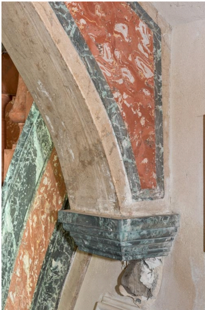
Décor de faux marbre du départ d'arc et de son culot.