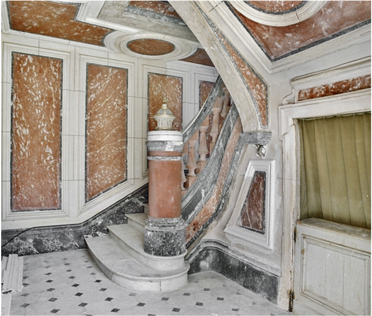
Vue depuis l'entrée, en 1996.