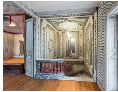
Cage de l'escalier à l'étage.