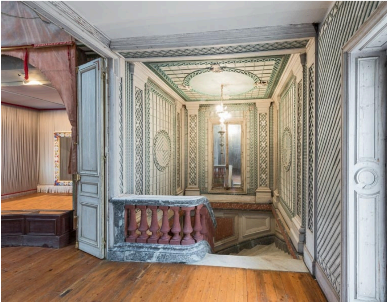
Cage de l'escalier à l'étage.