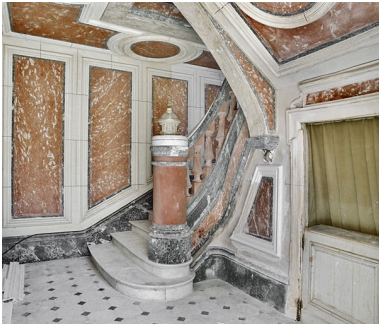
Vue depuis l'entrée, en 1996.