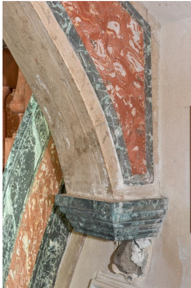
Décor de faux marbre du départ d'arc et de son culot. IVR26_20212100521NUC4A