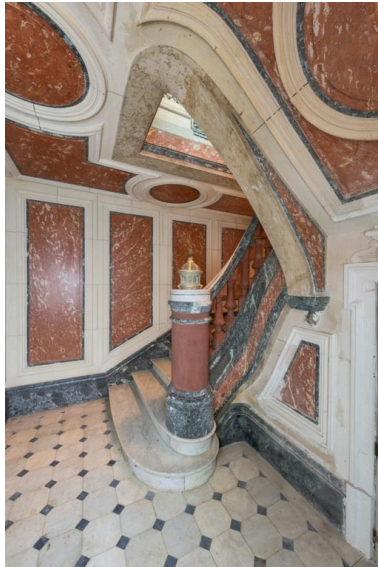
Vue depuis l'entrée. IVR26_20212100519NUC4A