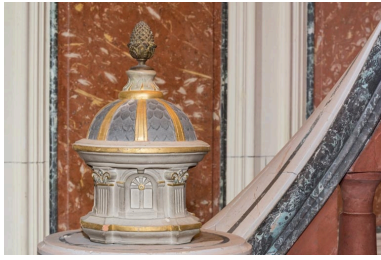
Départ de rampe : motif d'amortissement. IVR26_20212100522NUC4A