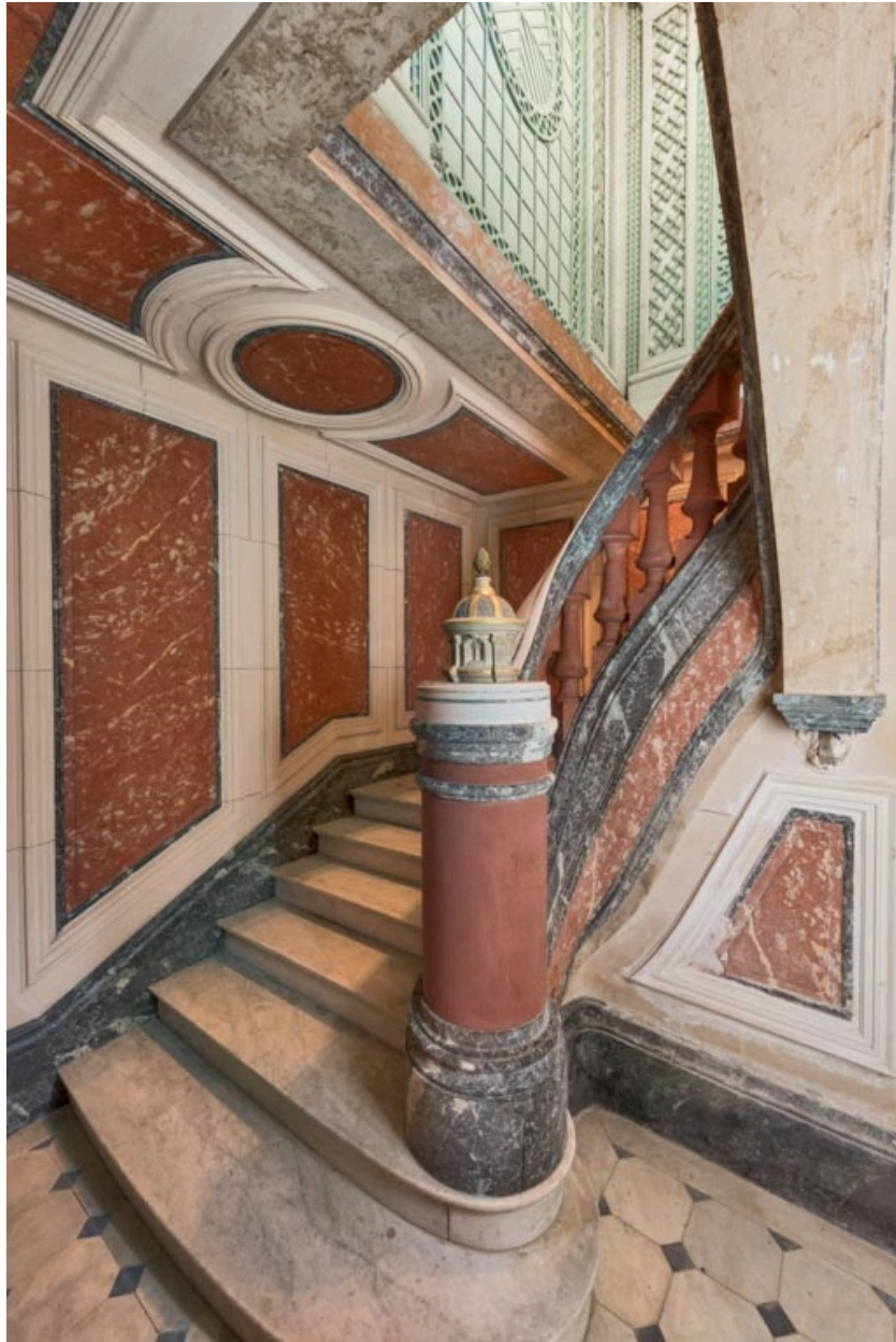
Départ de rampe.