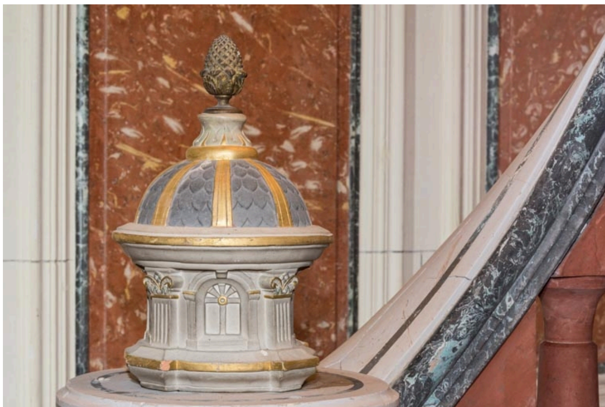
Départ de rampe : motif d'amortissement.