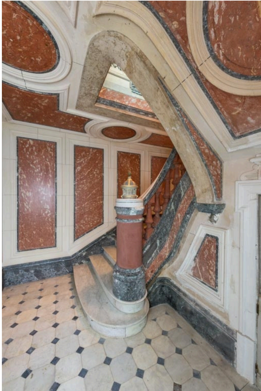
Vue depuis l'entrée.