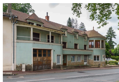
Vue actuelle. IVR26_20217100230NUC4A