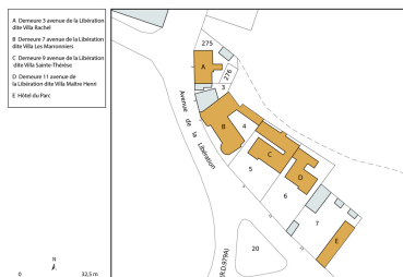
Plan-masse et de situation, extrait du plan cadastral (2023). IVR26_20237100008NUDA