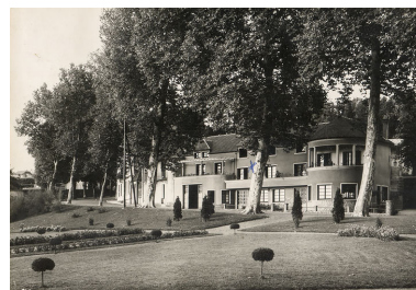
Vue, troisième quart du 20e siècle. Autr. auteur inconnu IVR26_20207100065NUC4A