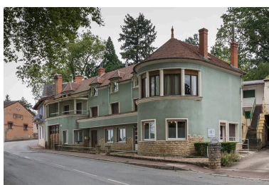
Vue actuelle. IVR26_20217100231NUC2A