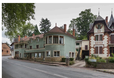
Vue actuelle.