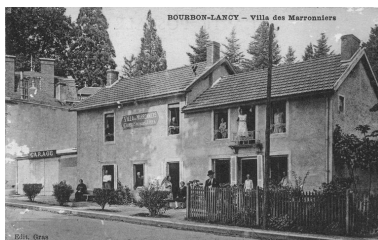
Vue, première moitié du 20e siècle. Autr. auteur inconnu IVR26_20237100023NUC2A