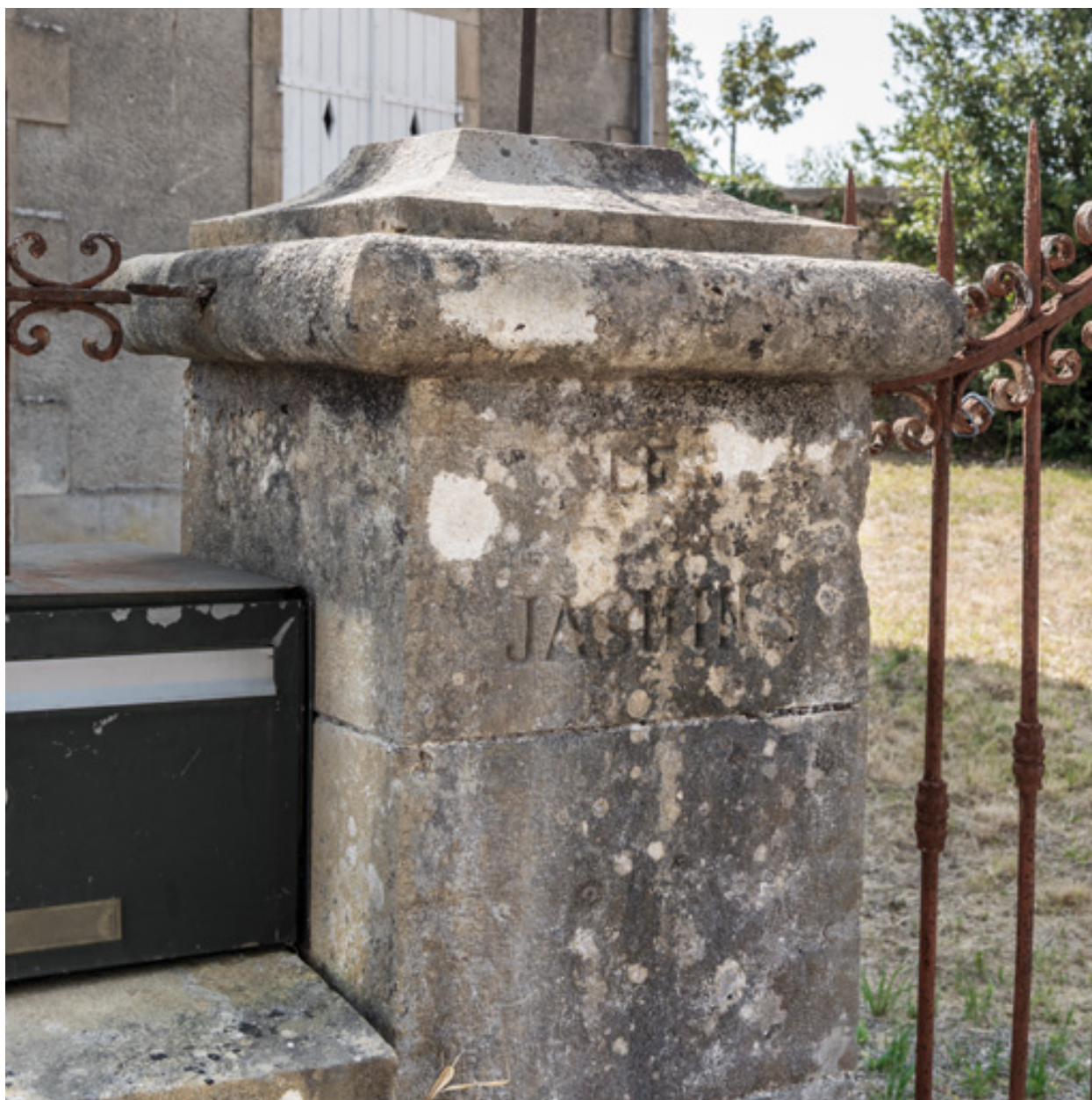
Pilier de portail portant l'inscription du nom de la villa.