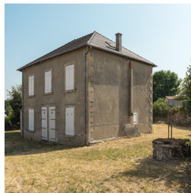
Façade principale, vue depuis le sud-ouest. IVR26_20195800518NUC2A