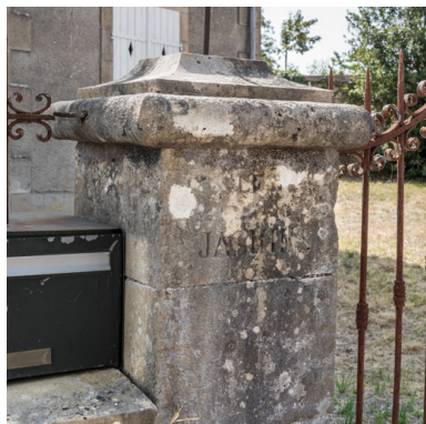
Pilier de portail portant l'inscription du nom de la villa. IVR26_20195800520NUC4A