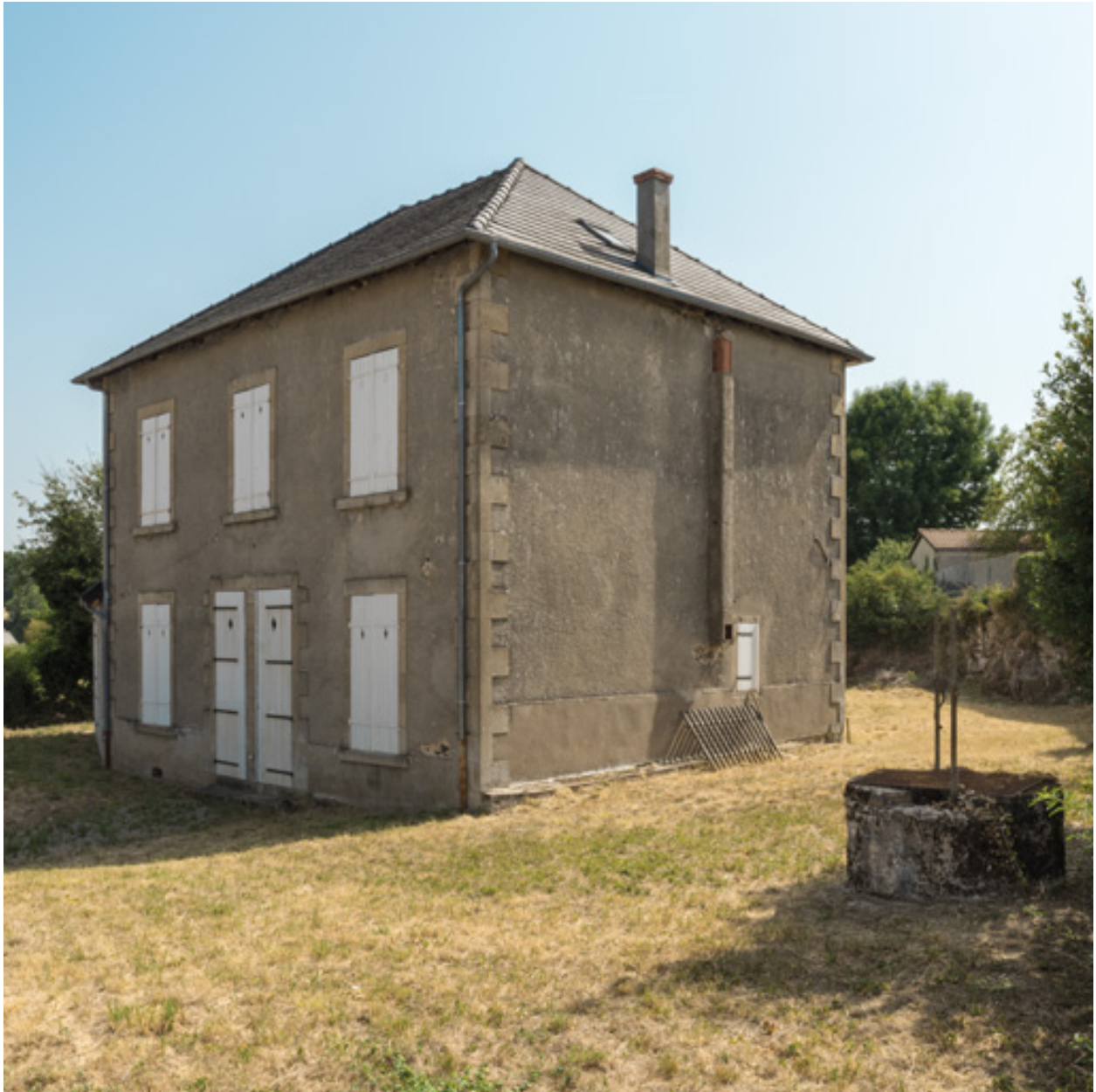
Façade principale, vue depuis le sud-ouest.