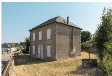
Façade principale, vue depuis le sud-ouest. IVR26_20195800519NUC4A