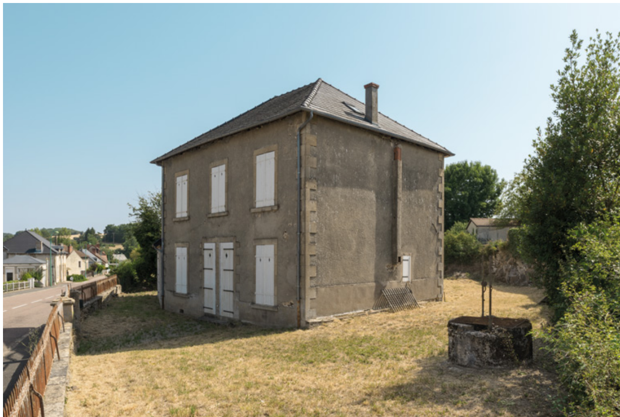
Façade principale, vue depuis le sud-ouest.