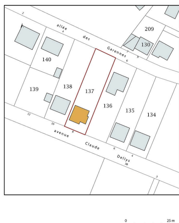
Plan-masse et de situation, extrait du plan cadastral (2020).