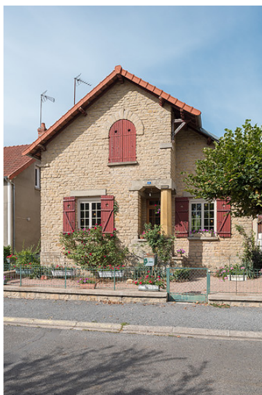
Façade sur l'avenue Claude Dellys.