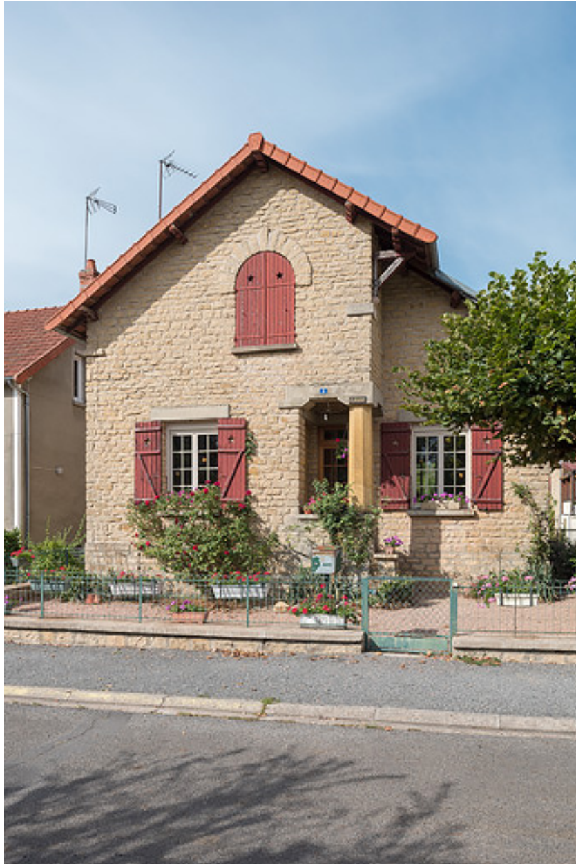
Façade sur l'avenue Claude Dellys.