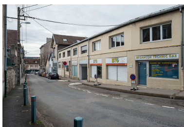
Vue d'ensemble depuis le haut de la rue.