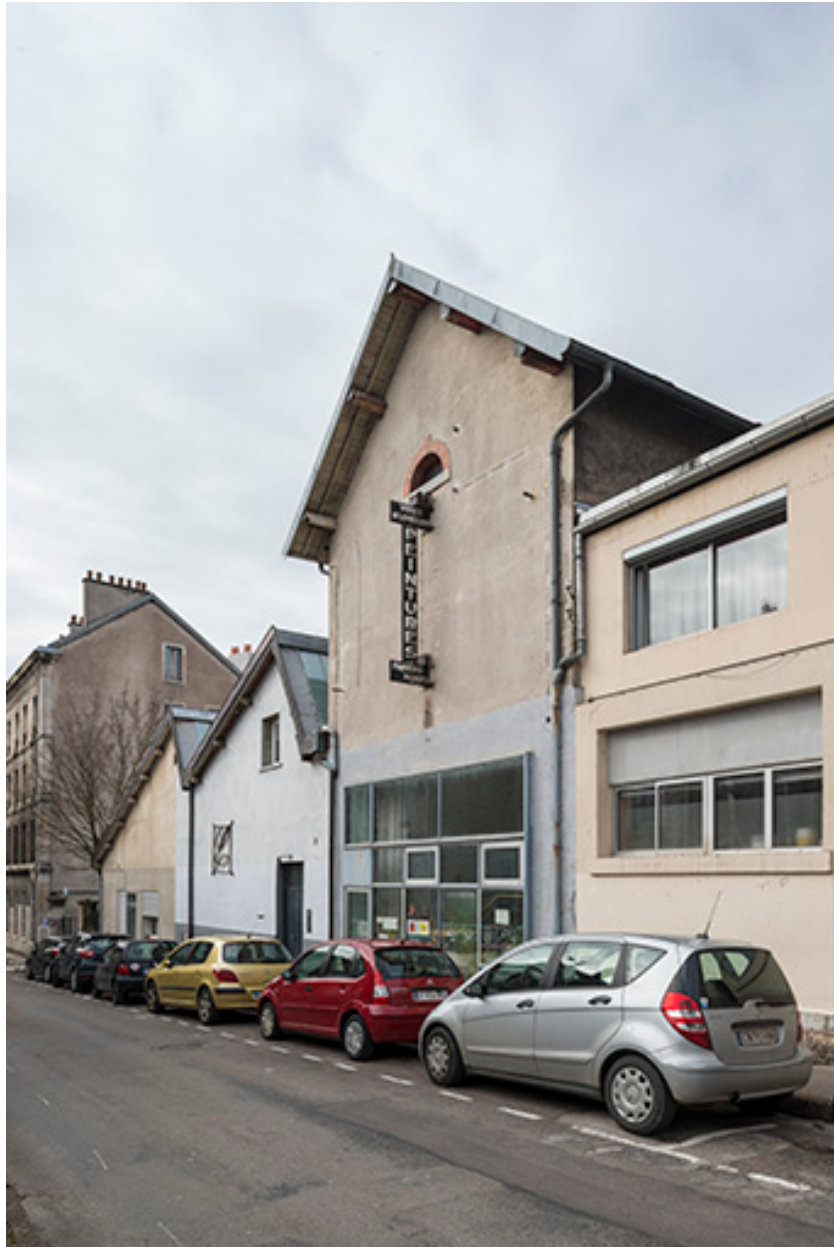
Pignons-est des bâtiments sur la rue.