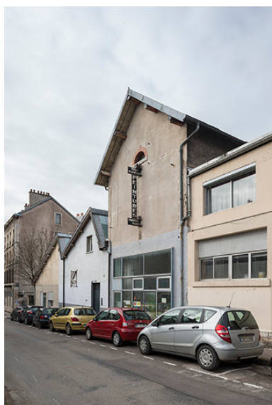
Pignons-est des bâtiments sur la rue. IVR43_20182500534NUC4A