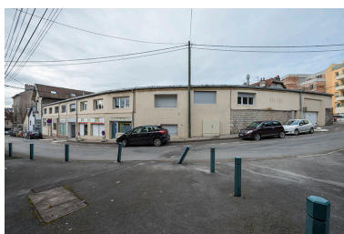
Partie nord des ateliers, dans le haut de la rue.