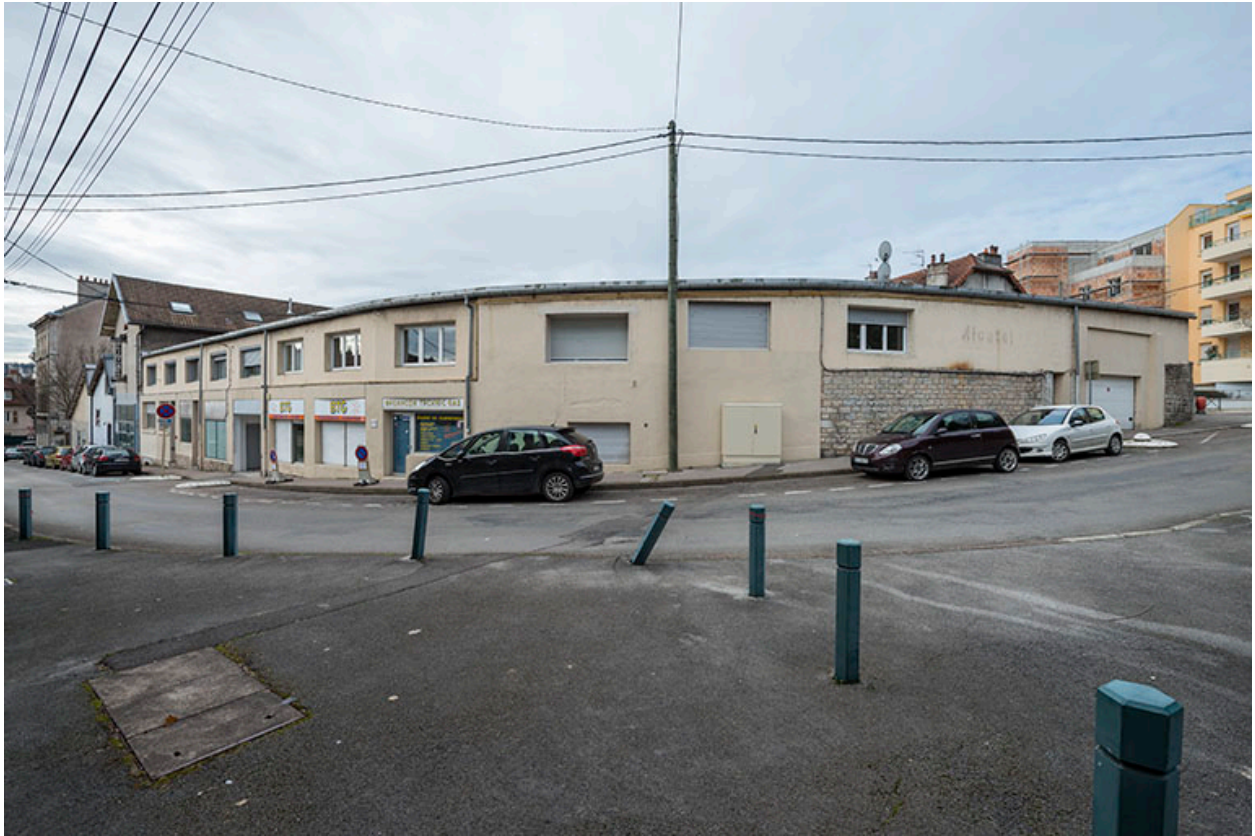
Partie nord des ateliers, dans le haut de la rue.