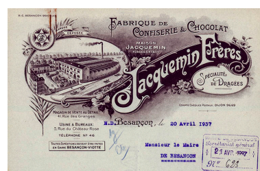
Fabrique de confiserie et chocolat Jacquemin Frères, papier à en-tête, 1937. IVR43_20192500750NUCA