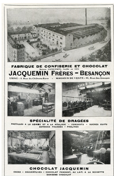
Jacquemin Frères, page publicitaire, s.d. [1923]. IVR43_20182500211NUC4A