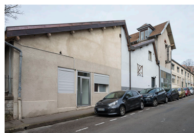
Façades est sur la rue.