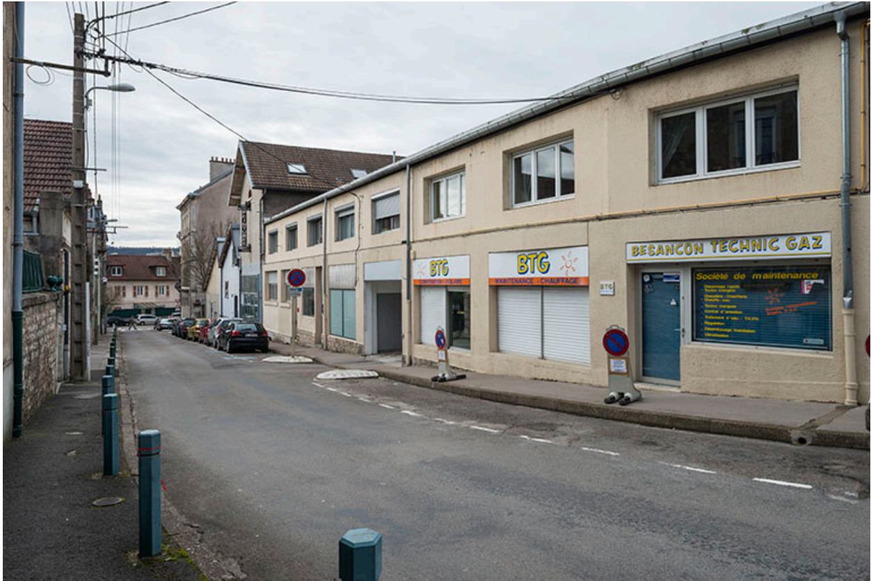
Vue d'ensemble depuis le haut de la rue.