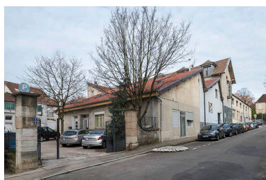
Vue d'ensemble depuis le sud-est. IVR43_20182500532NUC4A