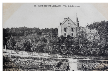
Vue de la villa dans la première moitié du 20e siècle. IVR26_20195800484NUC4A