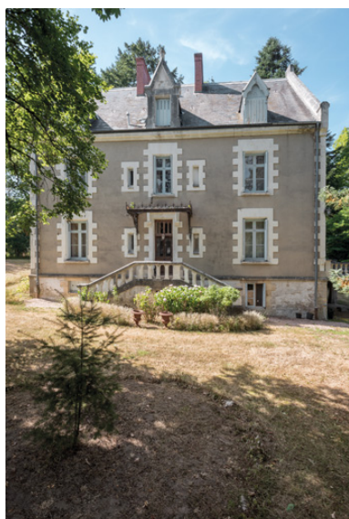
Façade sud-est.