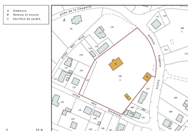
Plan-masse et de situation, extrait du plan cadastral (2020). Dess. Pierre-Marie Barbe-Richaud