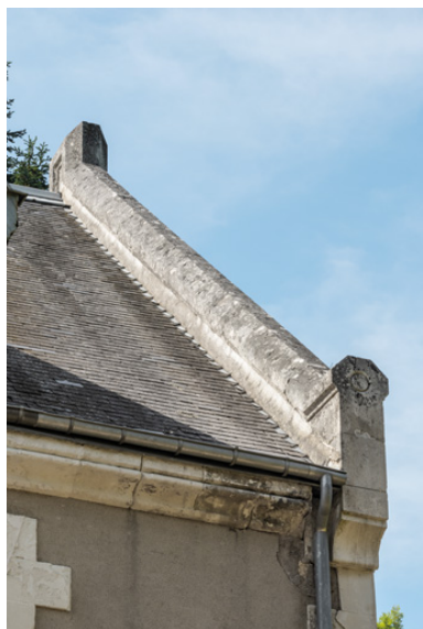
Rampant de pignon. IVR26_20195800494NUC4A