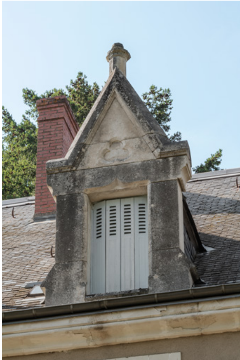
Lucarne centrale du versant sud-est de la toiture.