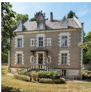
Façade sud-est. IVR26_20195800489NUC4A