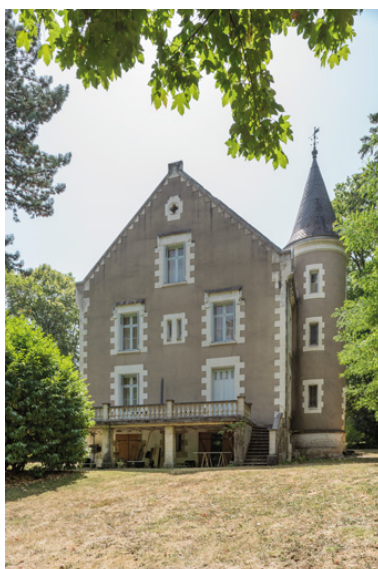
Mur pignon nord-est. IVR26_20195800531NUC4A