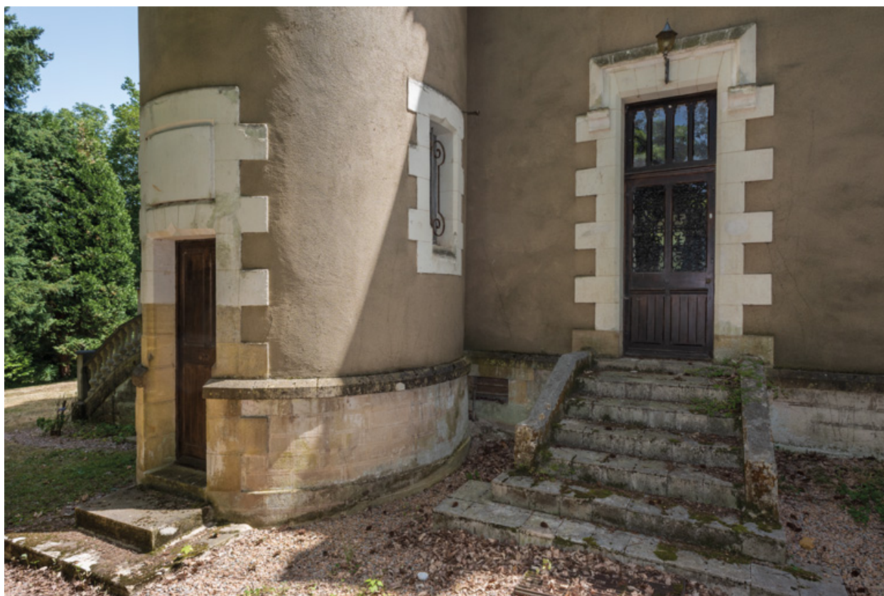
Perron de la façade nord-ouest et tour.