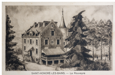
Vue de la villa dans la première moitié du 20e siècle.