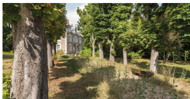
Allée conduisant à la villa depuis l'allée des Garenes. IVR26_20195800541NUC4A