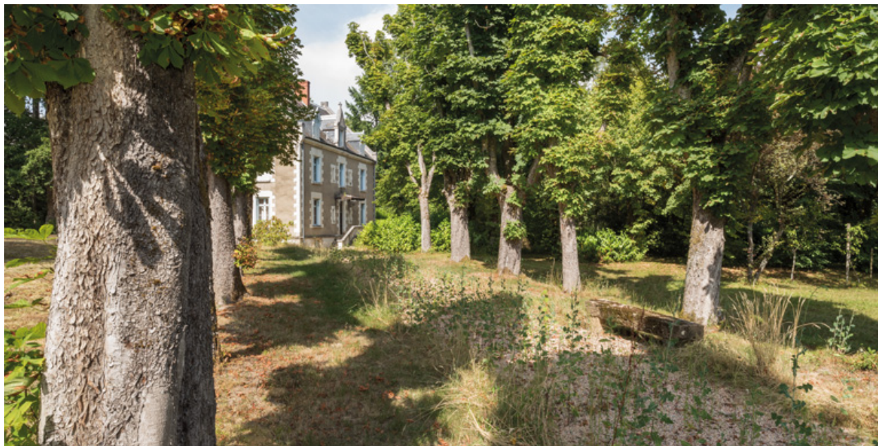
Allée conduisant à la villa depuis l'allée des Garennes.