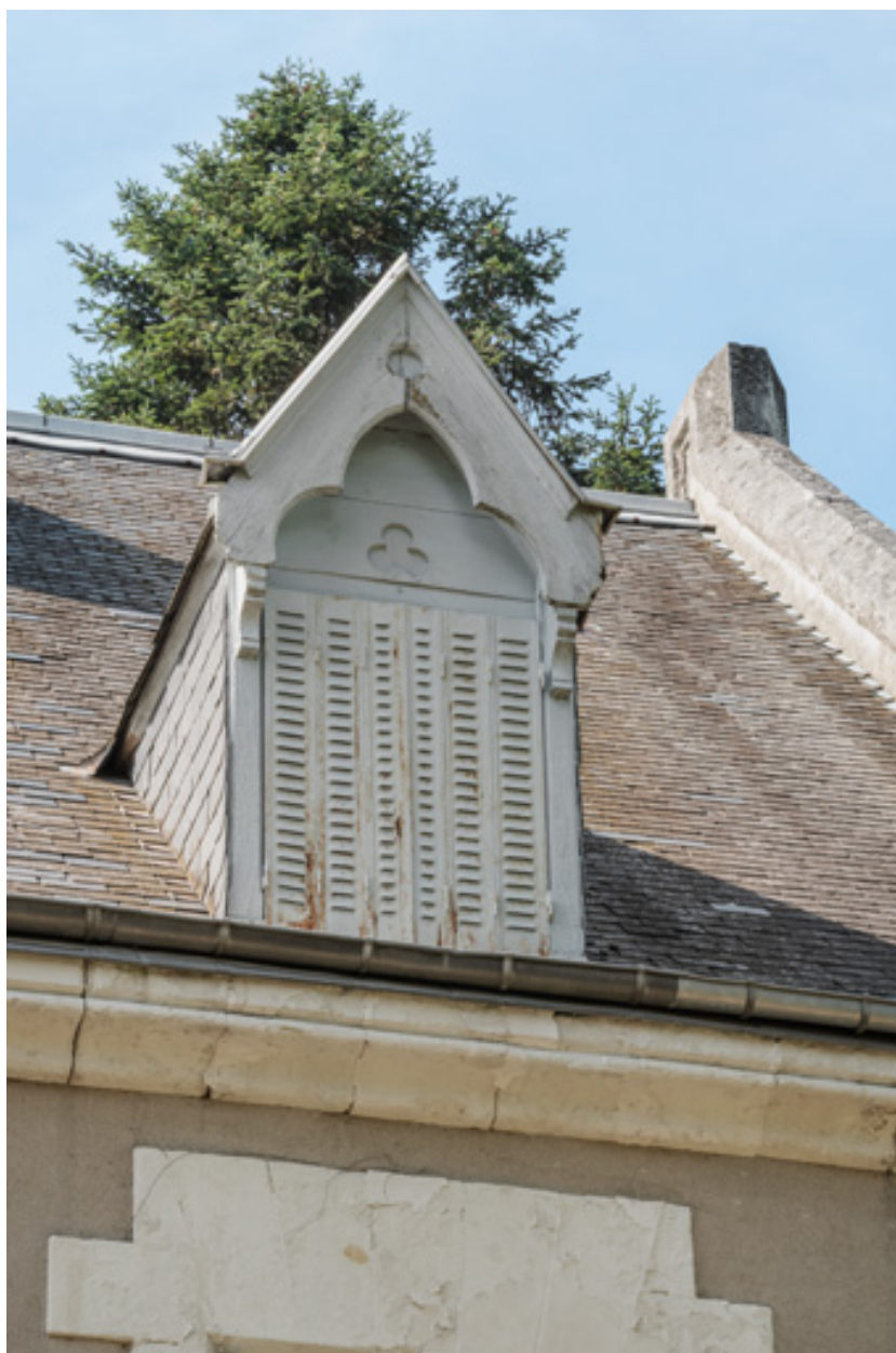
Lucarne de droite du versant sud-est de la toiture.