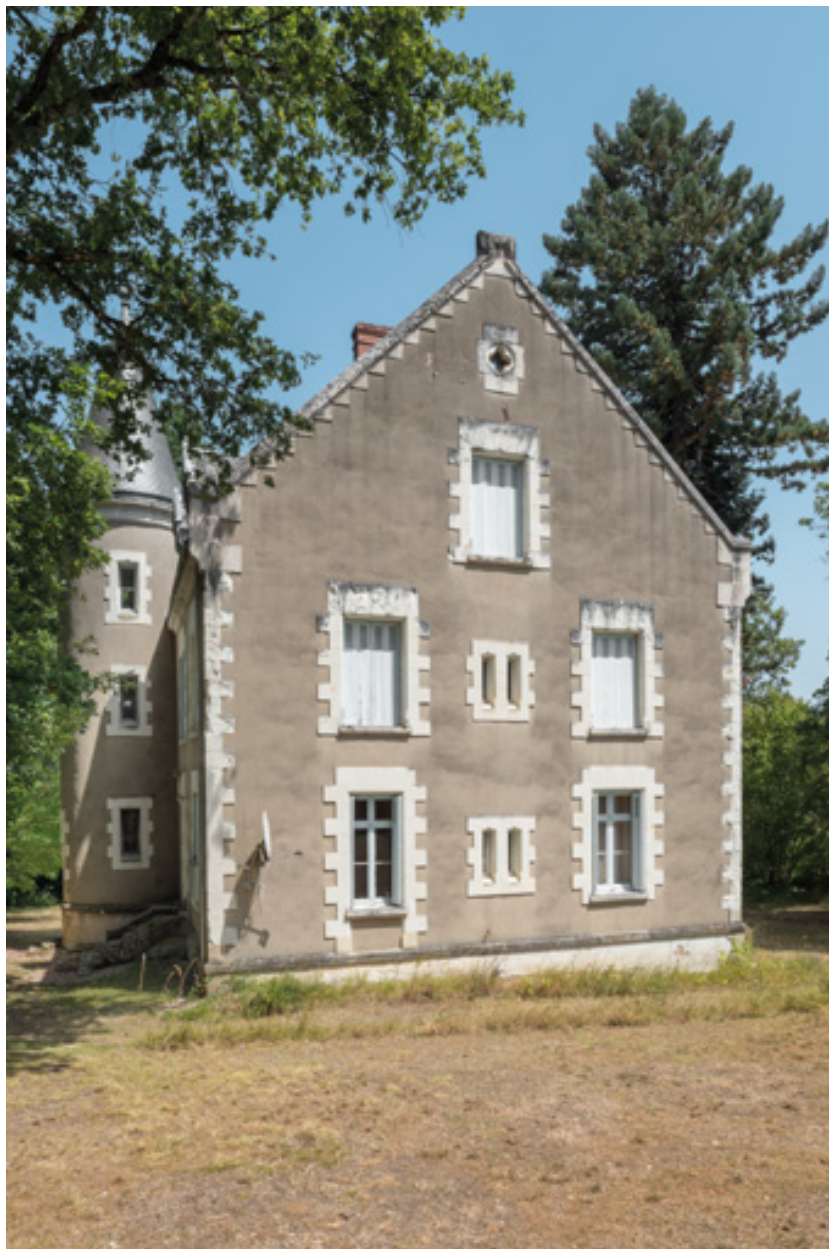
Mur pignon sud-ouest.