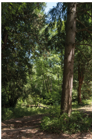
Bosquet, bassin et petit pont. IVR26_20195800533NUC4A