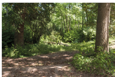
Bosquet, bassin et petit pont.