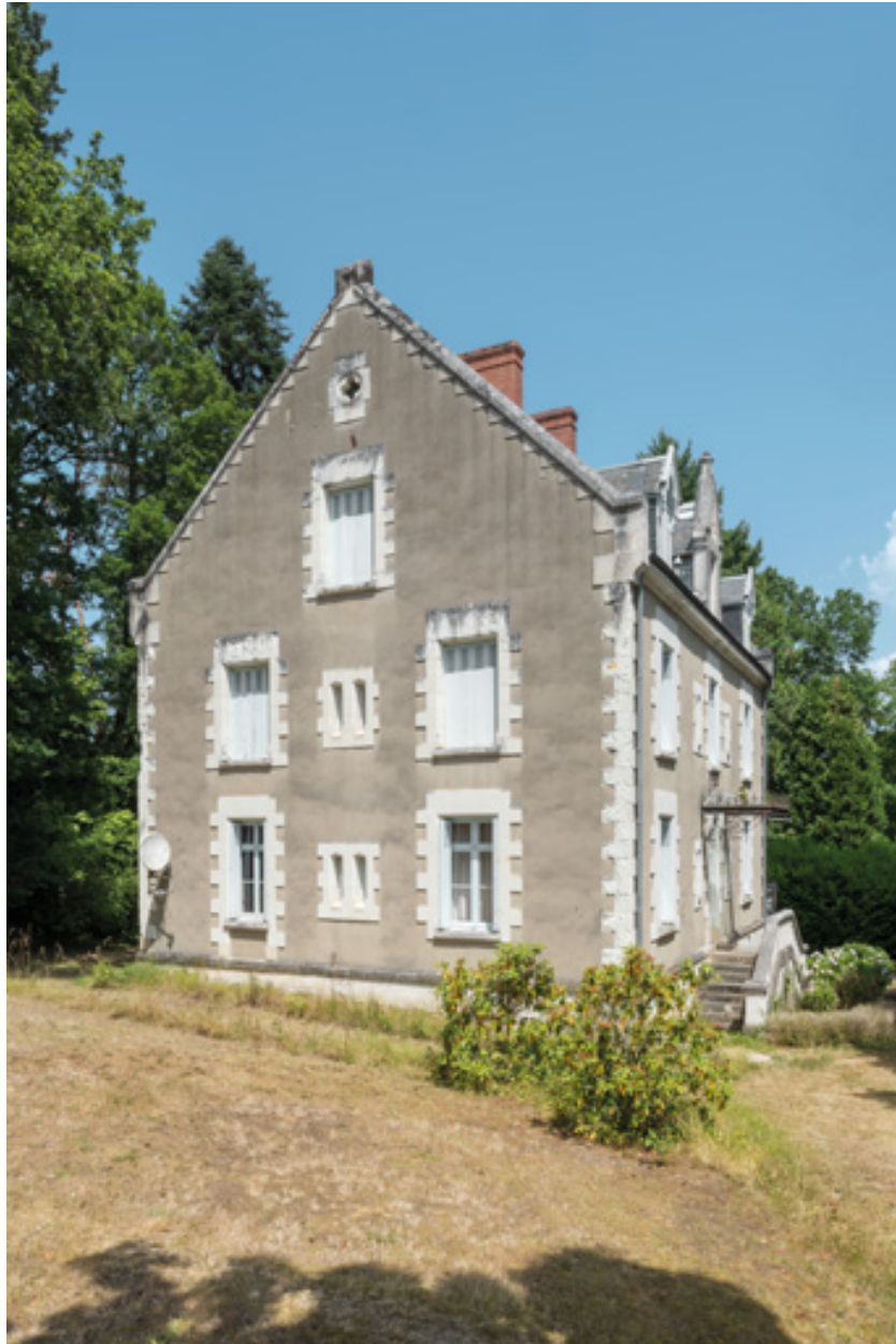
Mur pignon sud-ouest.