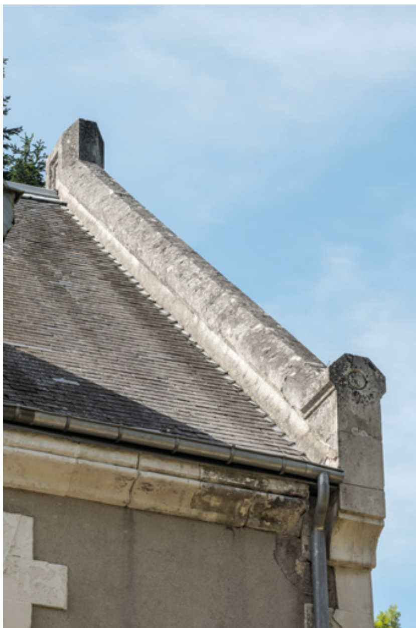
Rampant de pignon.