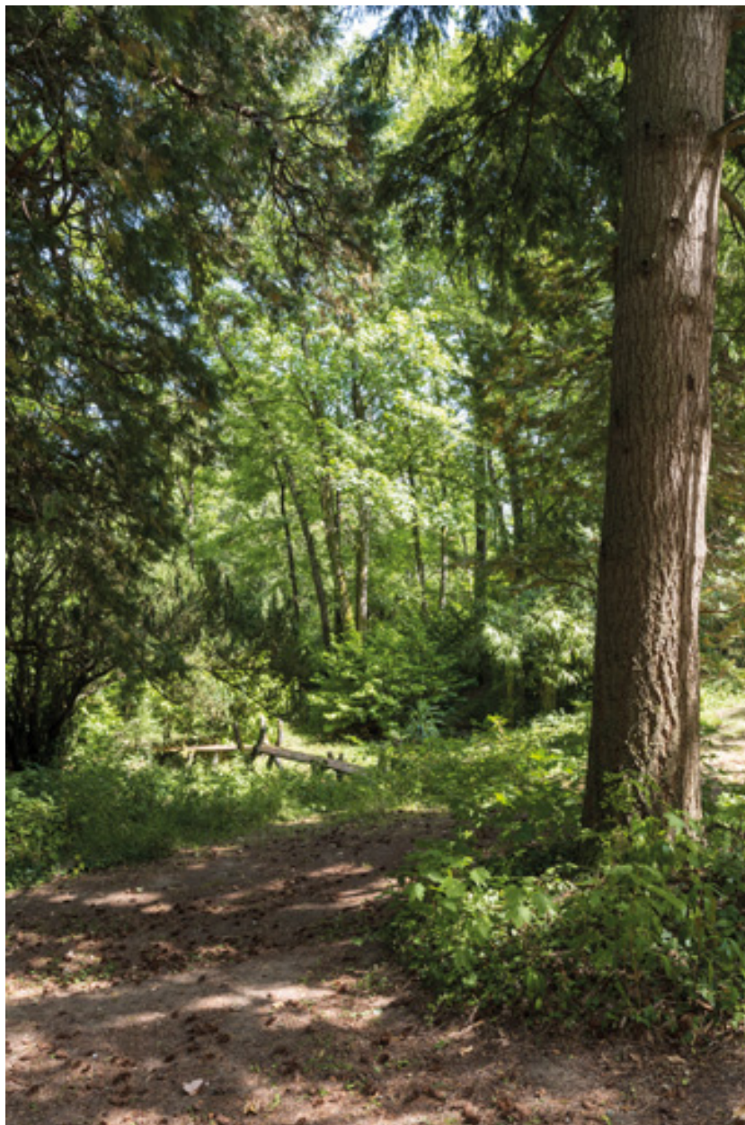
Bosquet, bassin et petit pont.