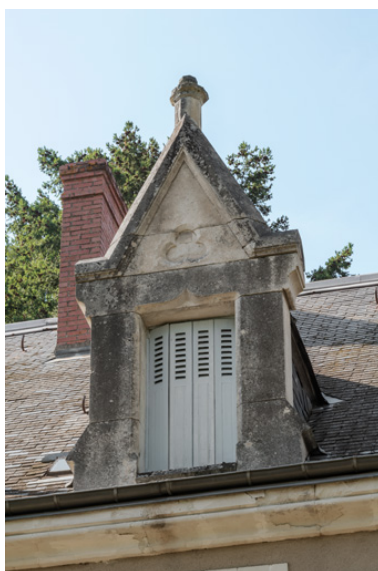
Lucarne centrale du versant sud-est de la toiture. IVR26_20195800492NUC4A