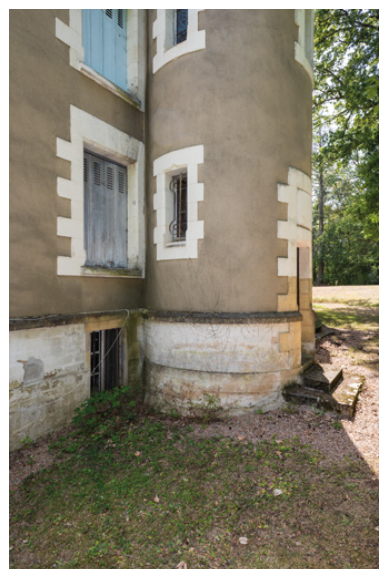
Partie inférieure de la tour d'escalier. IVR26_20195800530NUC4A