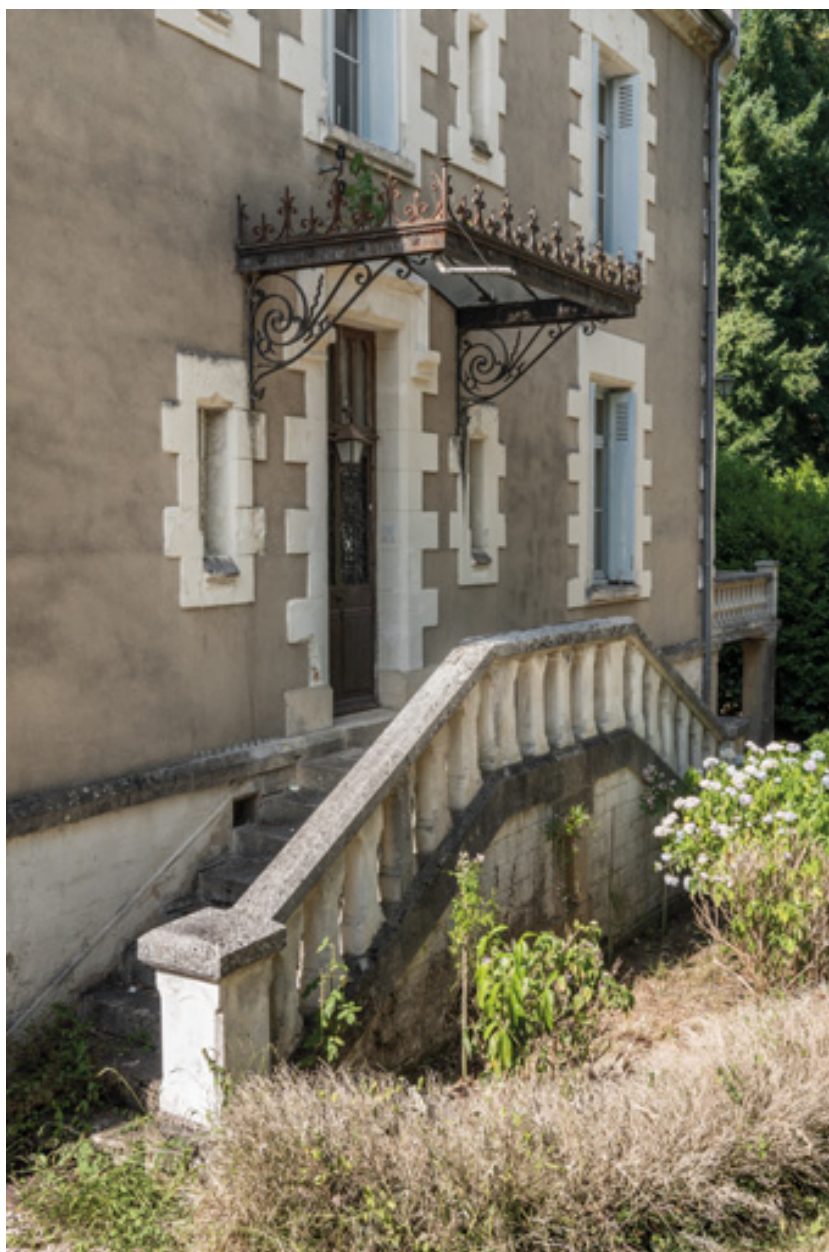
Perron de la façade sud-est.