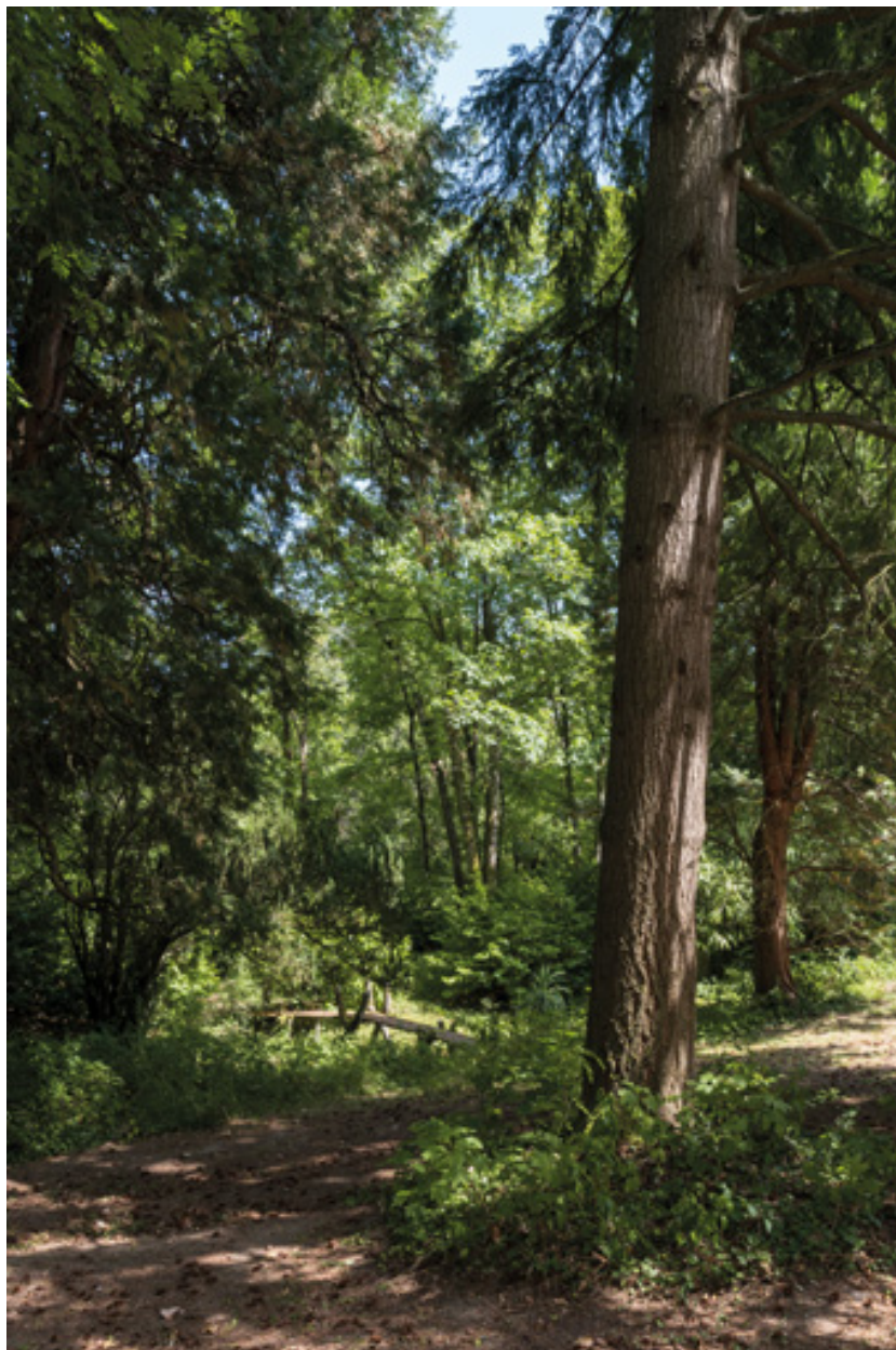
Bosquet, bassin et petit pont.