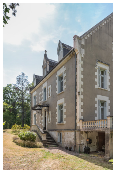
Façade sud-est, vue depuis l'est. IVR26_20195800488NUC4A