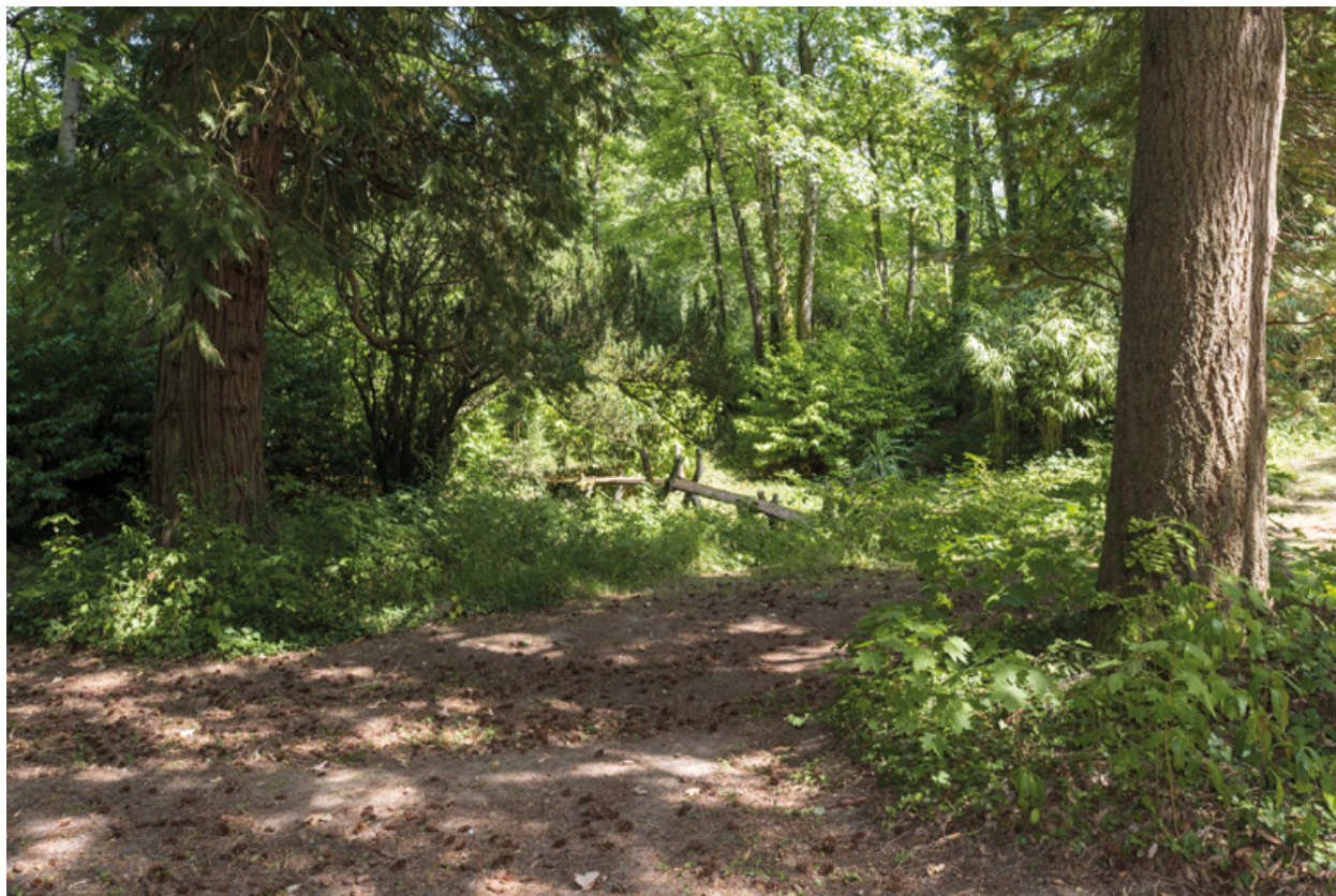
Bosquet, bassin et petit pont.