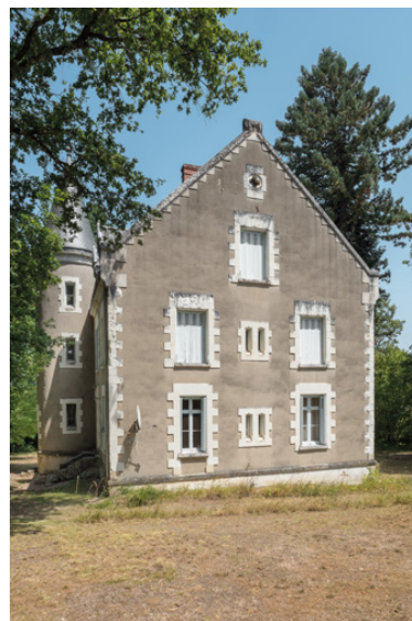
Mur pignon sud-ouest.