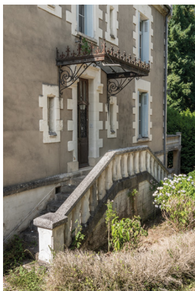
Perron de la façade sud-est. IVR26_20195800491NUC4A