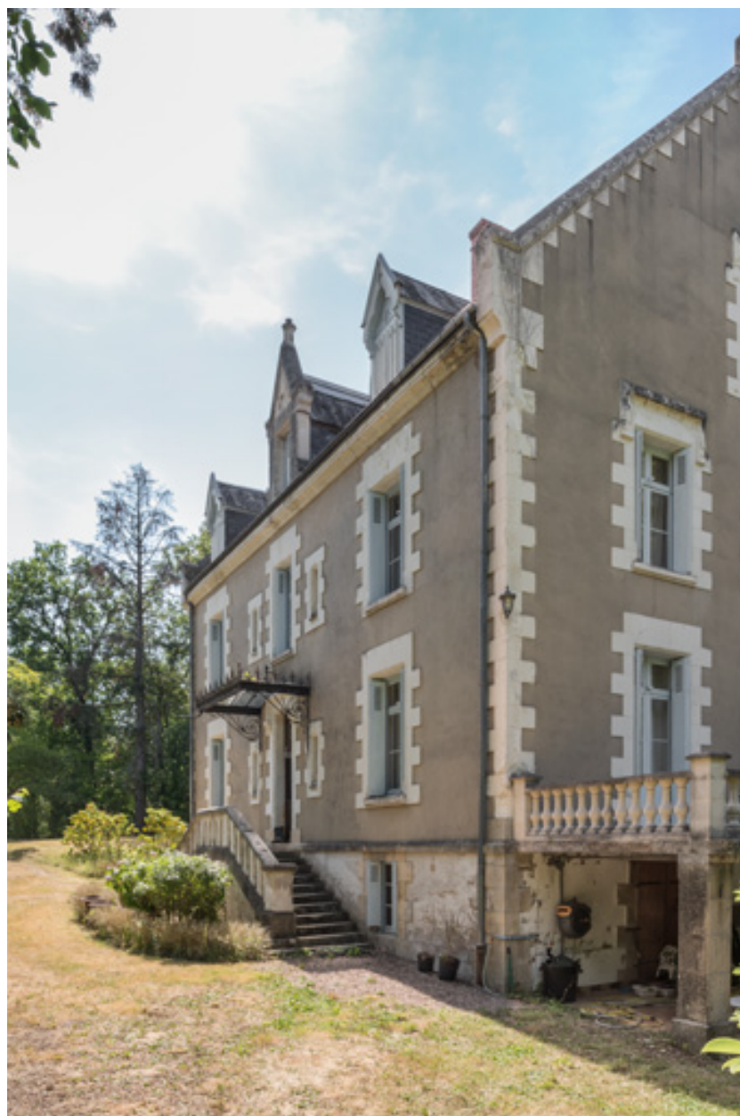
Façade sud-est, vue depuis l'est.