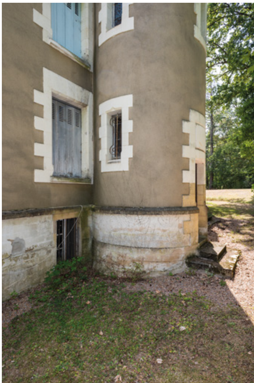
Partie inférieure de la tour d'escalier.