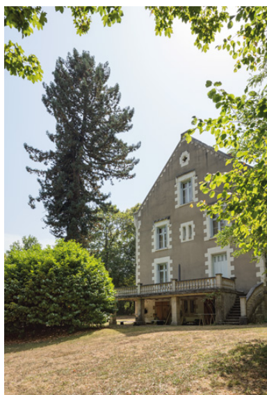
Sequoia. IVR26_20195800532NUC4A