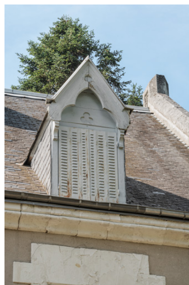
Lucarne de droite du versant sud-est de la toiture. IVR26_20195800493NUC4A