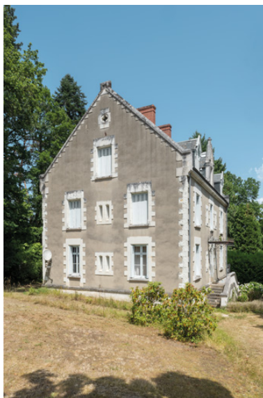
Mur pignon sud-ouest. IVR26_20195800527NUC4A