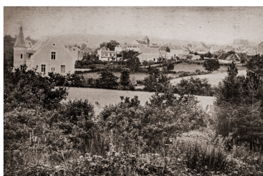
Vue de la villa en 1883. IVR26_20195800311NUC4A