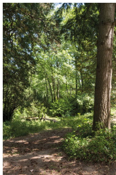
Bosquet, bassin et petit pont. IVR26_20195800534NUC4A