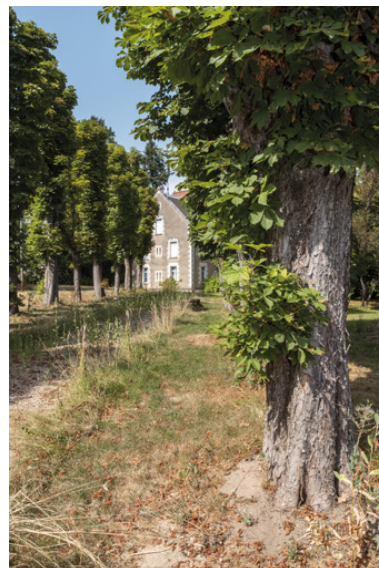
Allée conduisant à la villa depuis l'allée des Garenes.