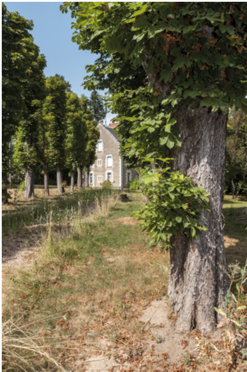
Allée conduisant à la villa depuis l'allée des Garennes.