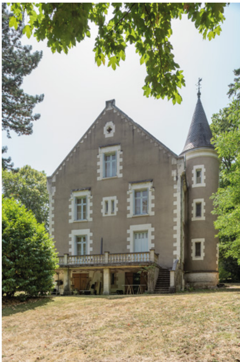
Mur pignon nord-est.