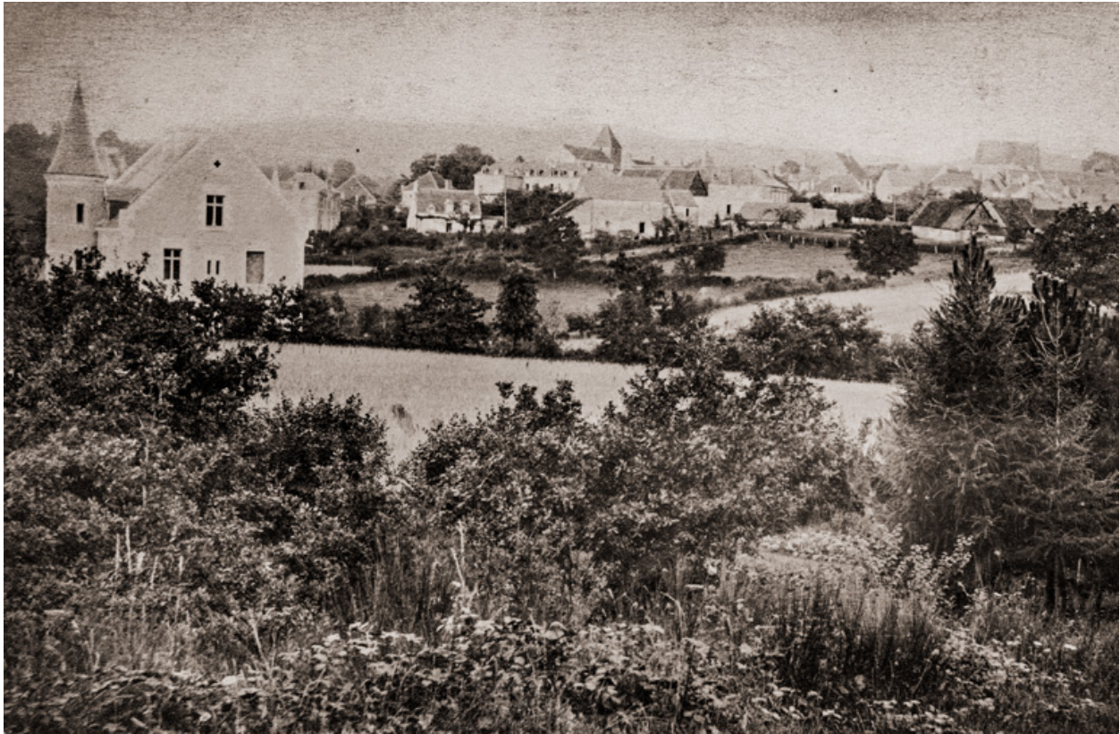
Vue de la villa en 1883.