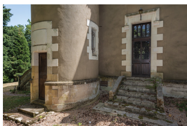
Perron de la façade nord-ouest et tour. IVR26_20195800529NUC4A