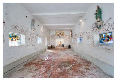
Vue de la nef en direction du chœur.