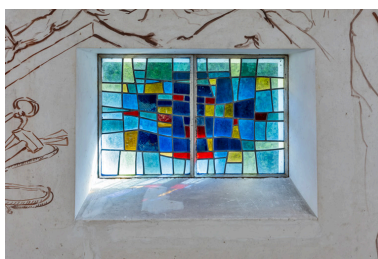
Vue d'une verrière (baie 4). IVR26_20248900182NUC4A