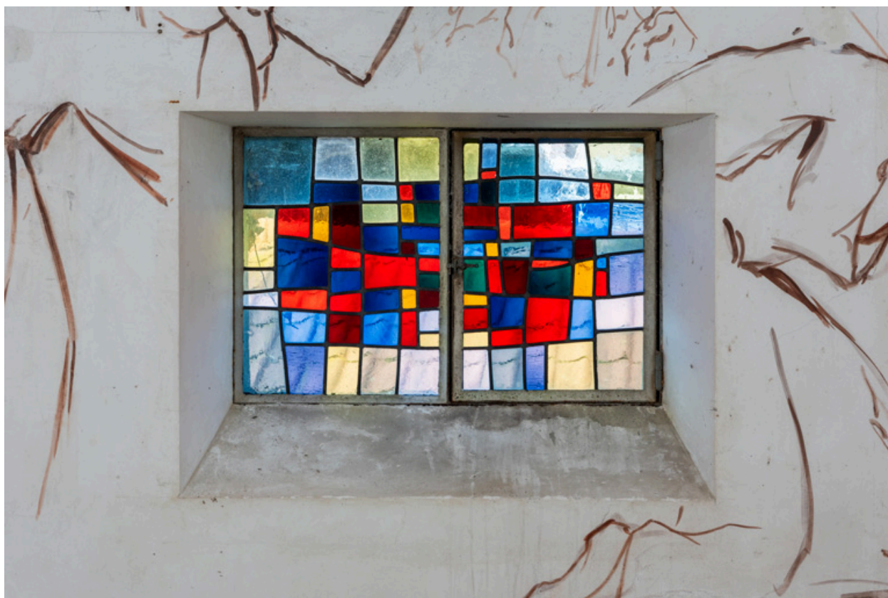
Vue d'une verrière (baie 5).