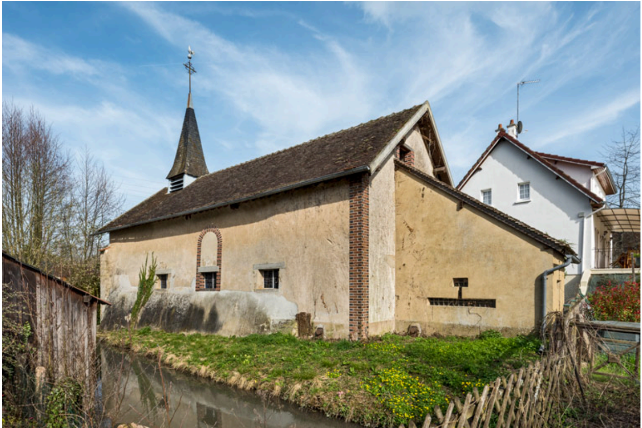
Vue de la façade nord.