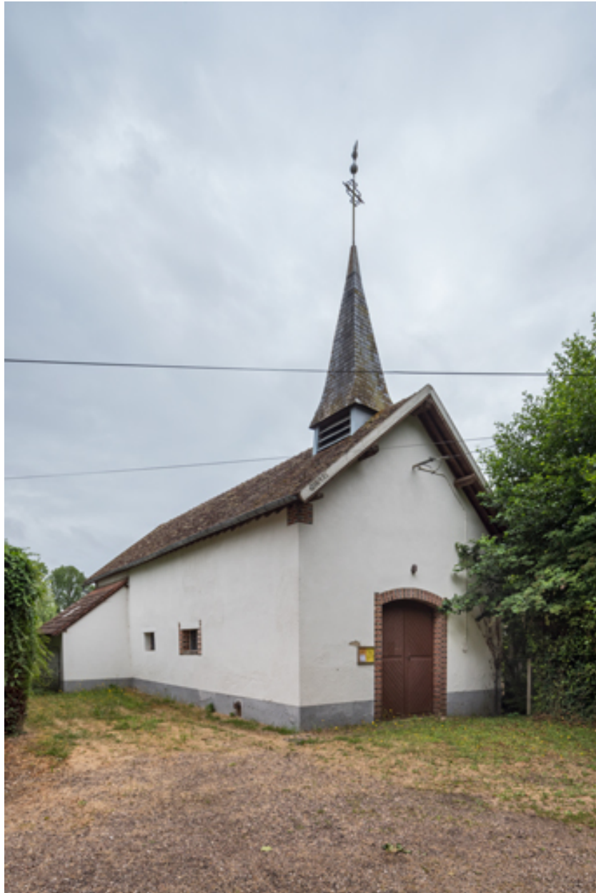
Vue des façades est (antérieure) et sud.