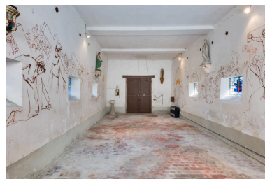
Vue de la nef en direction de l'entrée.