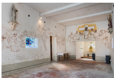
Vue en direction du chœur et de la sacristie. IVR26_20248900175NUC4A