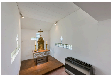
Vue du chœur (de trois quarts). IVR26_20248900179NUC4A