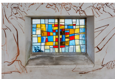
Vue d'une verrière (baie 1). IVR26_20248900184NUC4A