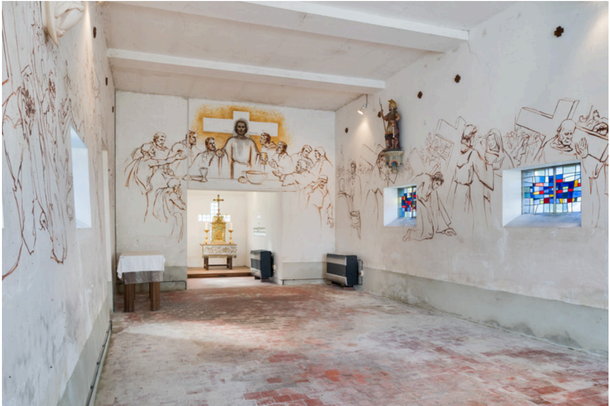
Vue de la nef (de trois quarts).