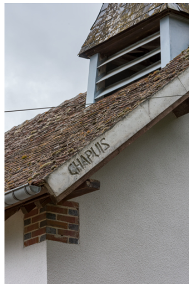
Rampant et rive de la toiture (détail).