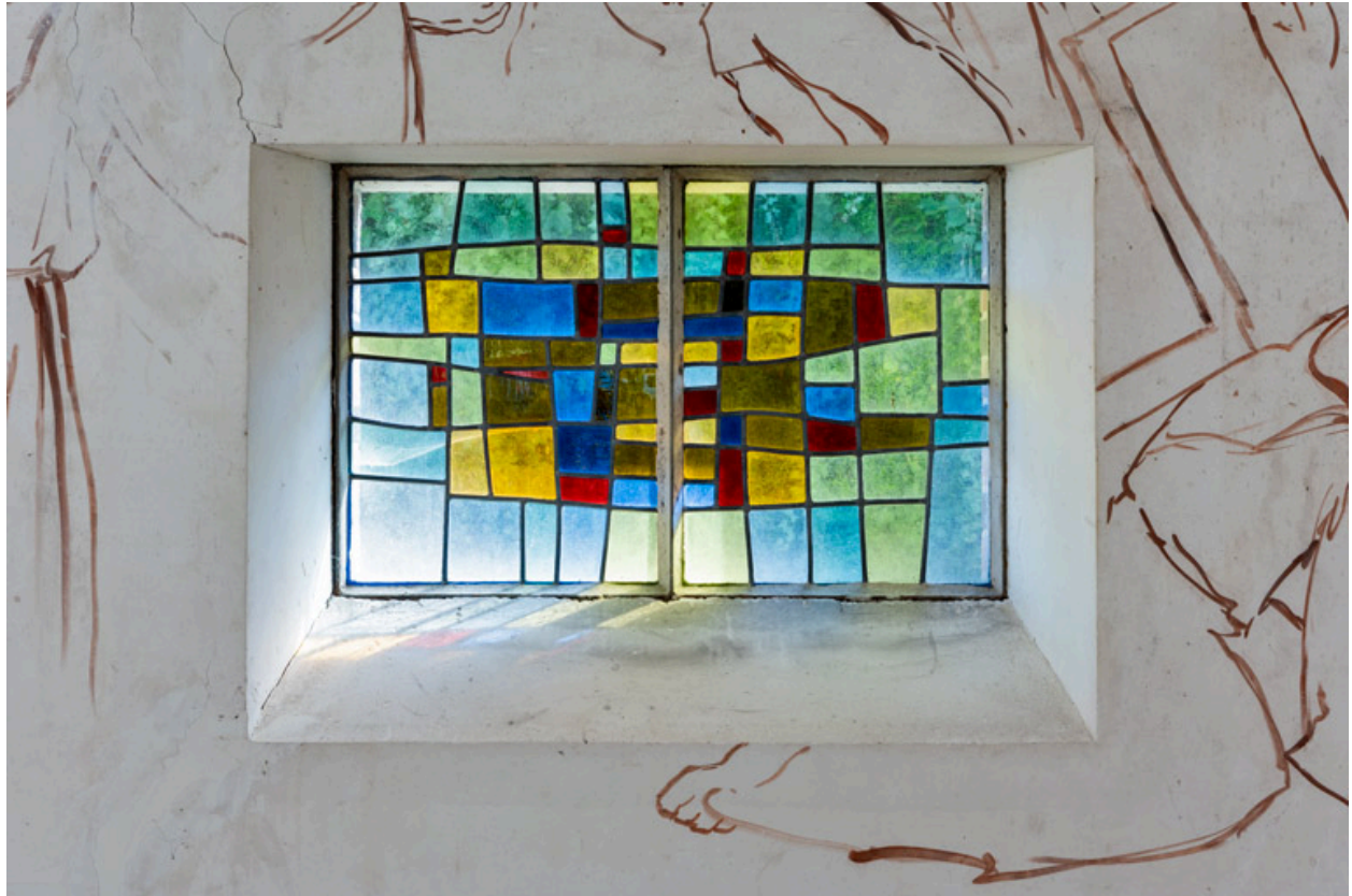
Vue d'une verrière (baie 2).