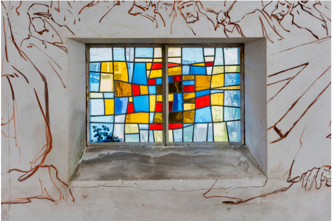
Vue d'une verrière (baie 1).