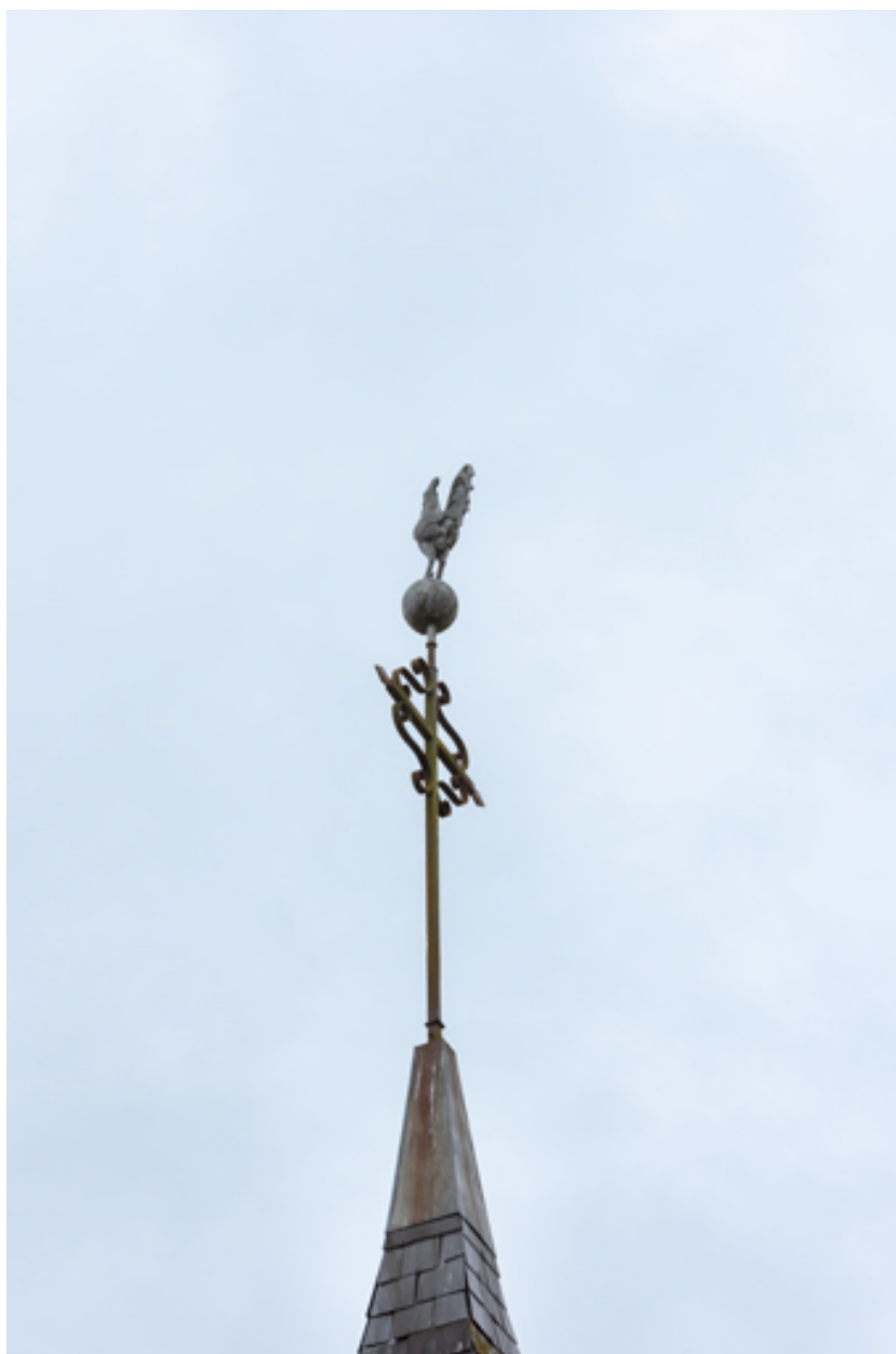
Croix surmontée d'un coq.