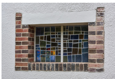
Vue extérieure d'une baie. IVR26_20238901123NUC4A