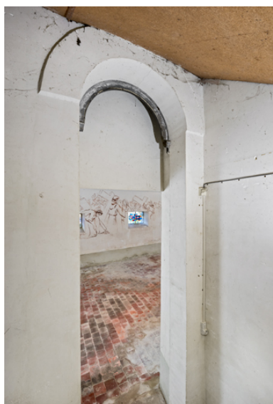
Vue de la baie de la sacristie. IVR26_20248900187NUC4A