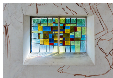
Vue d'une verrière (baie 2). IVR26_20248900183NUC4A