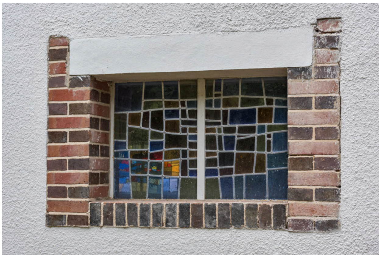
Vue extérieure d'une baie.