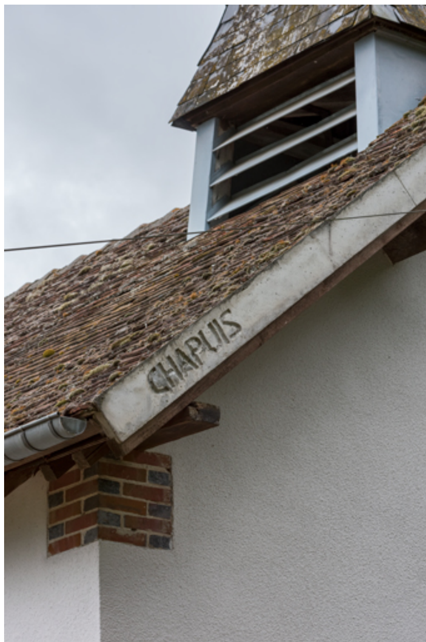
Rampant et rive de la toiture (détail).