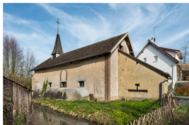
Vue de la façade nord. IVR26_20248900206NUC4A