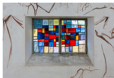
Vue d'une verrière (baie 5).