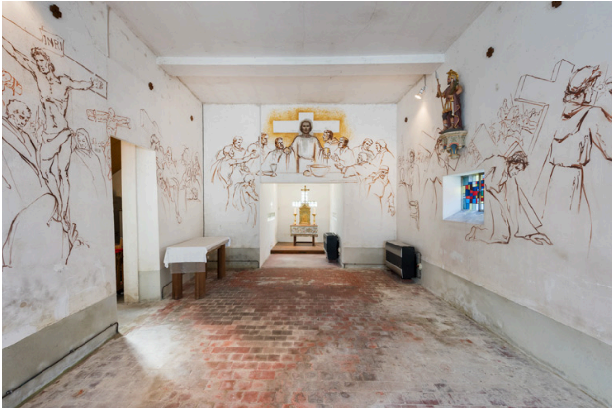
Vue en direction du chœur.