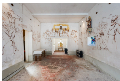
Vue en direction du chœur. IVR26_20248900178NUC4A