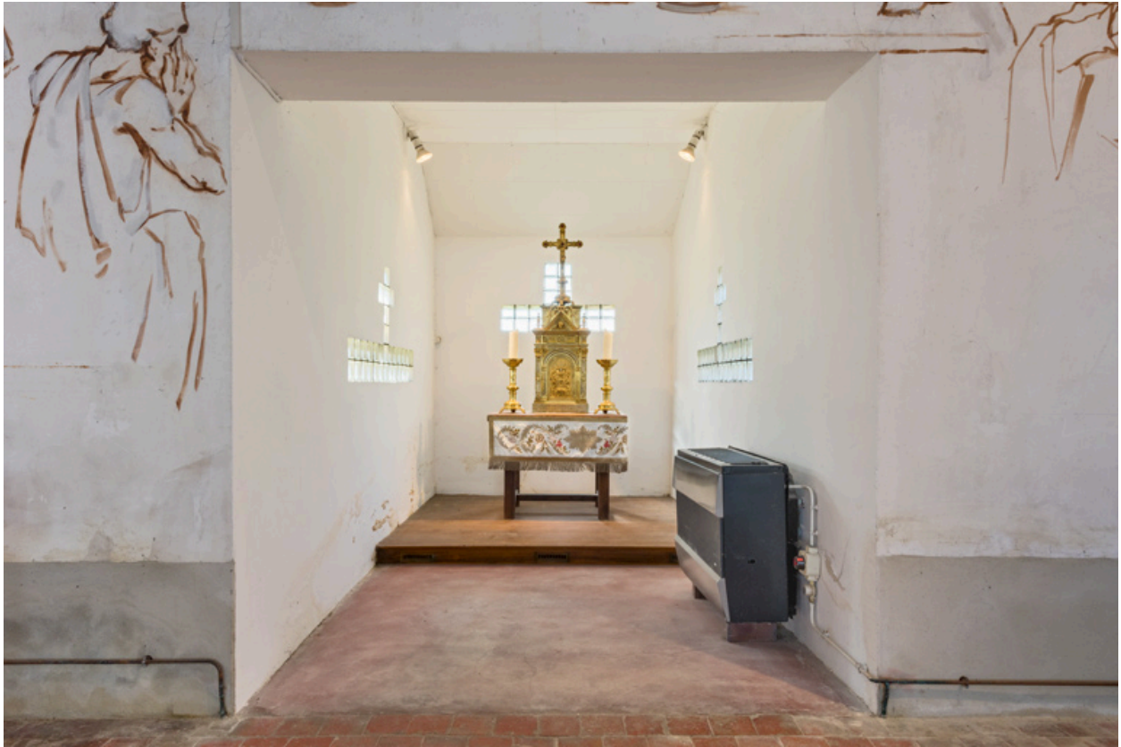
Vue du chœur.