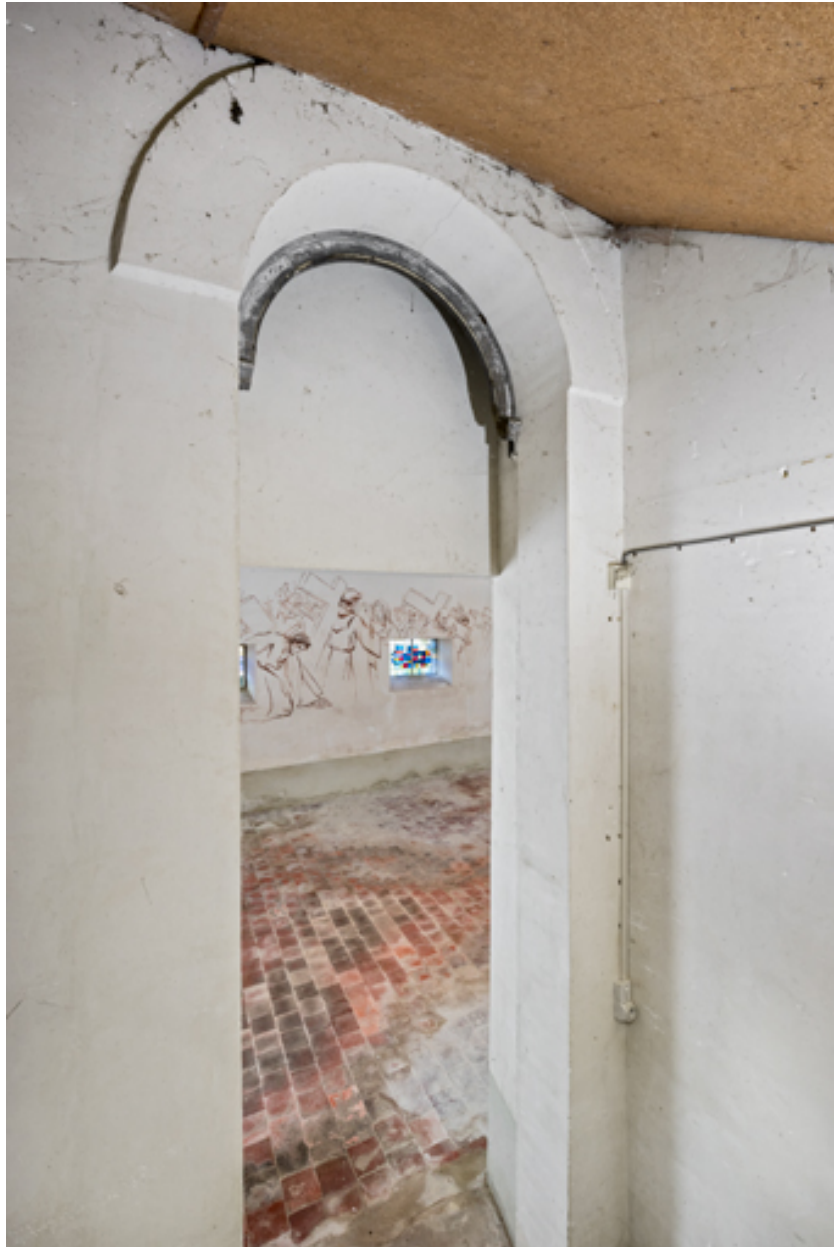
Vue de la baie de la sacristie.