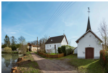
Vue d'ensemble. IVR26_20248900207NUC4A