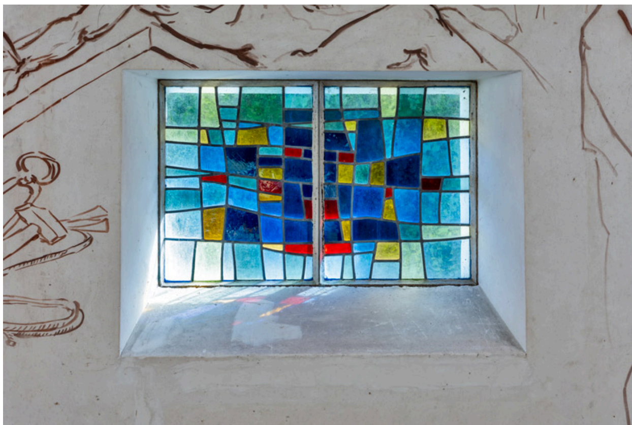
Vue d'une verrière (baie 4).