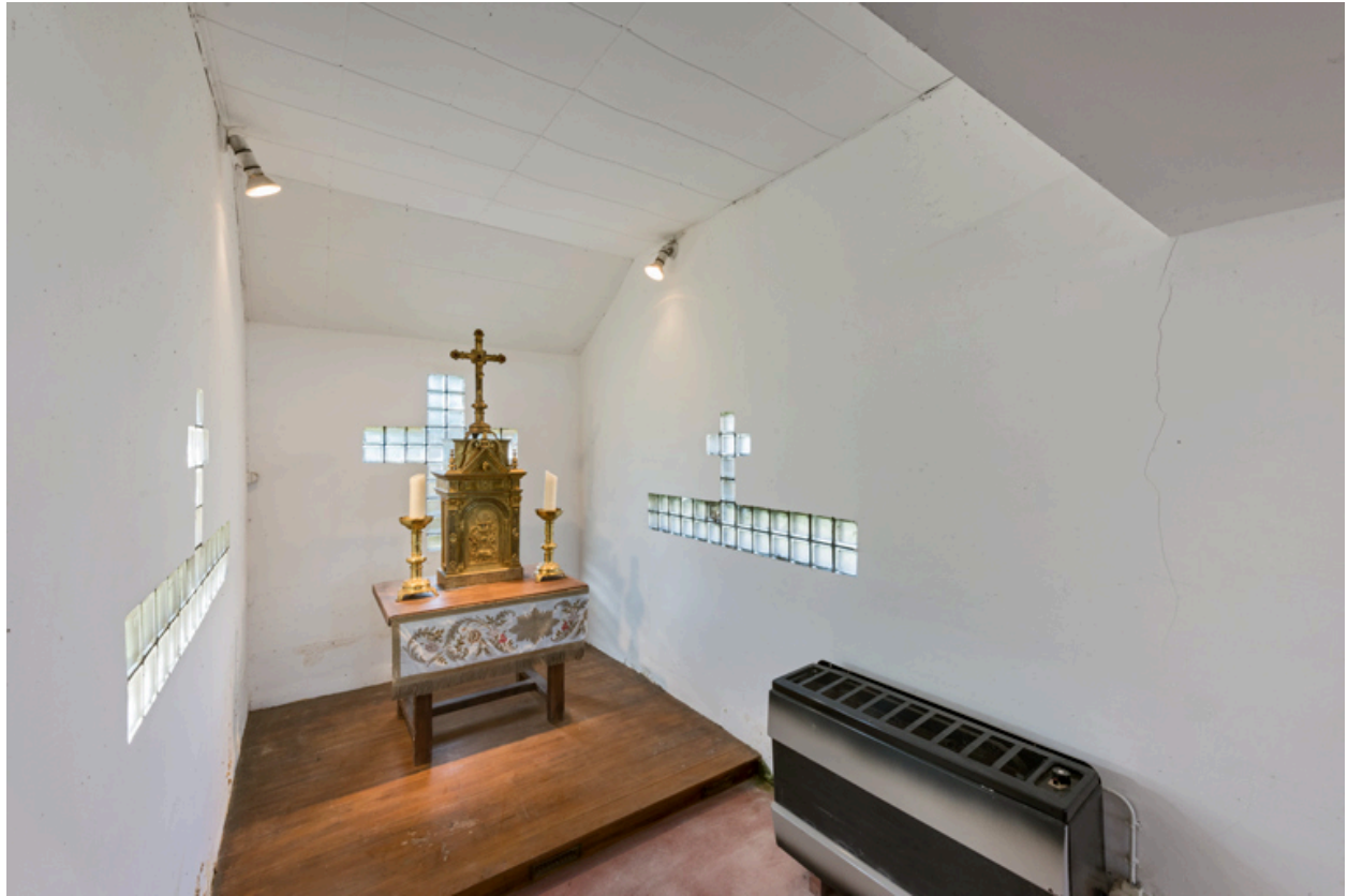
Vue du chœur (de trois quarts).