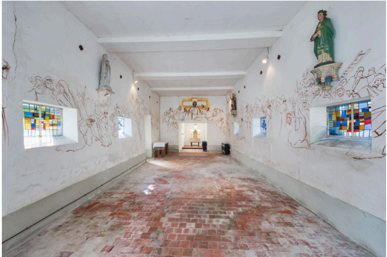
Vue de la nef en direction du chœur.