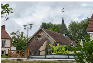
Vue de trois quarts arrière. IVR26_20238901124NUC4A