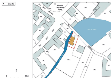
Plan de situation de la chapelle de Saint-Maurice- Thizouailles, échelle 1/1 000 e. IVR26_20248900218NUDA