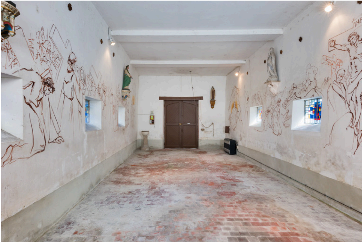
Vue de la nef en direction de l'entrée.