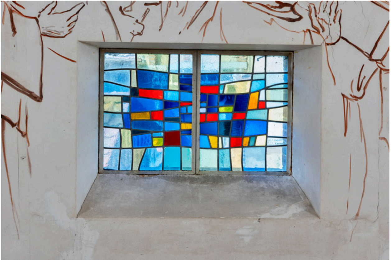
Vue d'une verrière (baie 3).