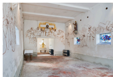
Vue de la nef (de trois quarts). IVR26_20248900176NUC4A