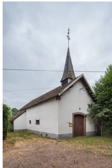
Vue des façades est (antérieure) et sud.