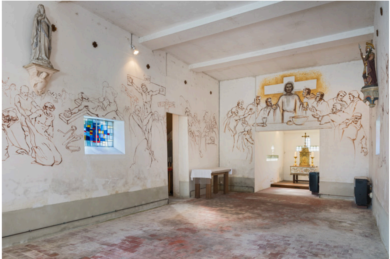
Vue en direction du chœur et de la sacristie.