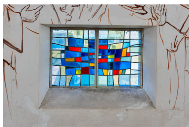
Vue d'une verrière (baie 3). IVR26_20248900185NUC4A