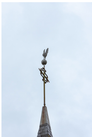
Croix surmontée d'un coq. IVR26_20238901122NUC4A