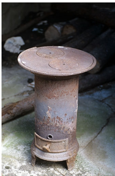
Vue d'ensemble. IVR43_20053900678ZA