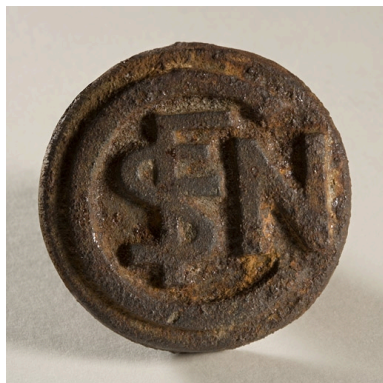
Poignée : logotype SNCF. IVR43_20073900026NUCA