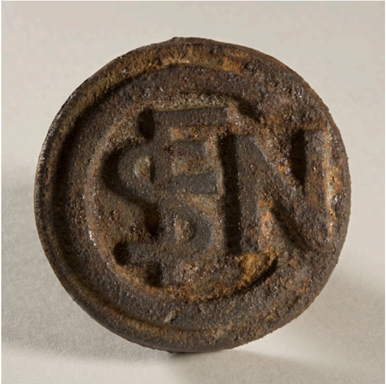
Poignée : logotype SNCF.