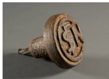
Poignée. IVR43_20073900028NUCA