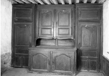
Vue générale IVR26_19852101046V