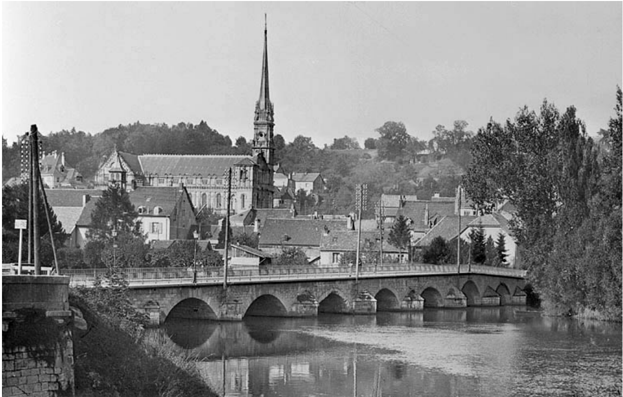
Pont Armand Bermont situé rue Charles Lalance.