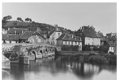
Pont Armand Bermont situé rue Charles Lalance.