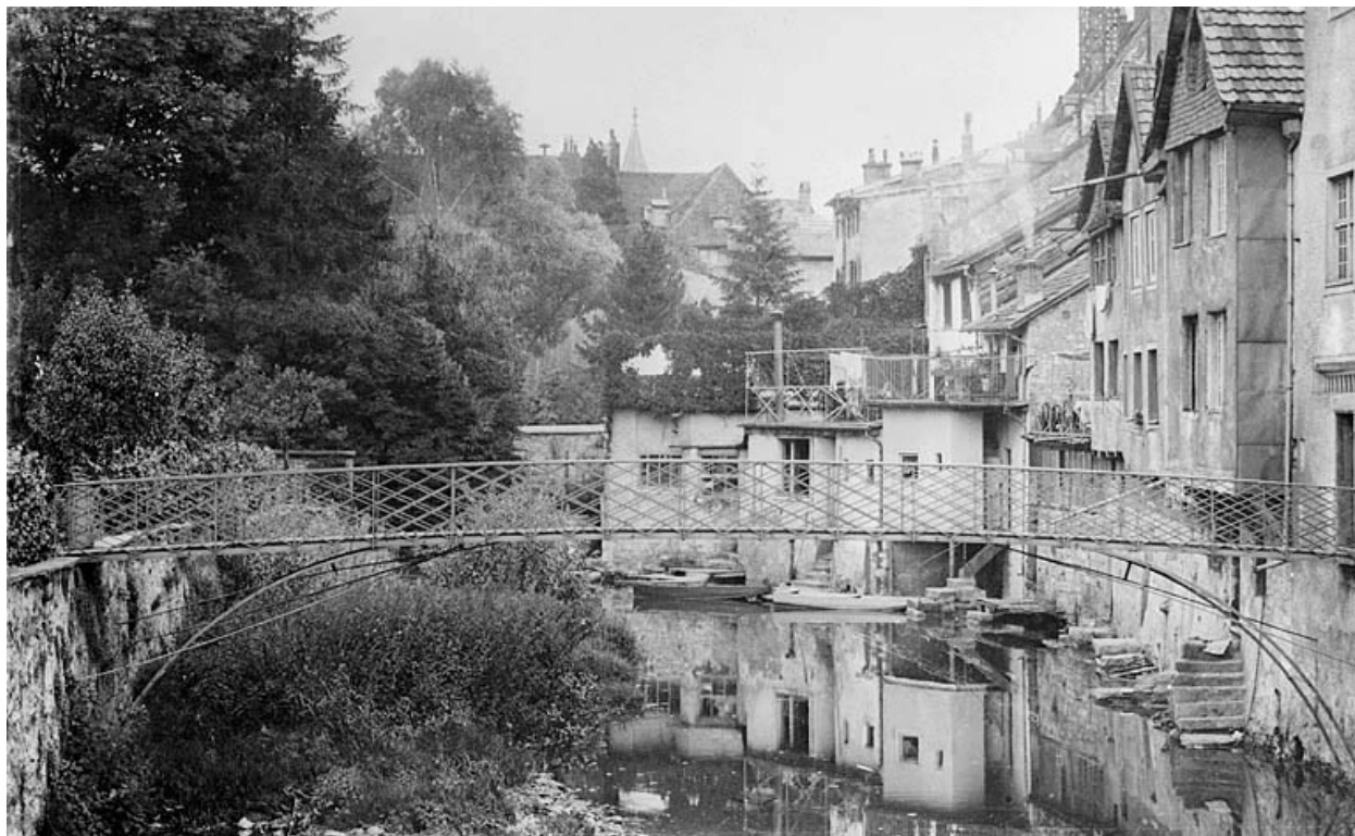
Passerelle de la maison 34, rue des Halles, milieu 20e siècle.