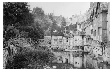
Passerelle de la maison 34, rue des Halles, milieu 20e siècle. IVR43_19872500018V