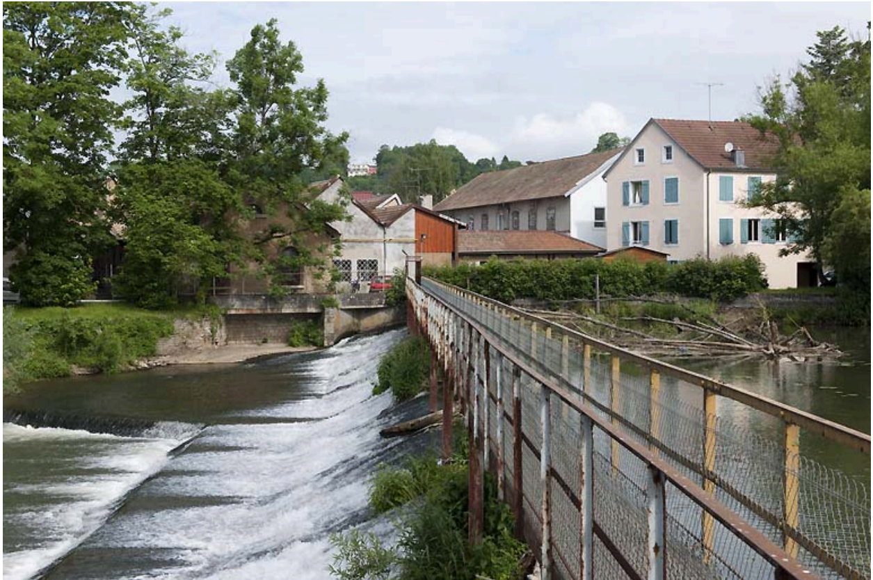
Passerelle sur le barrage situé près des ateliers municipaux, faubourg de Besançon.