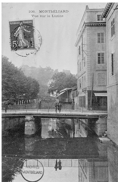
Montbéliard. Vue sur la Luzine [pont des Halles], début 20e siècle.