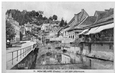
Montbéliard (Doubs). Un coin pittoresque [passerelle de l'hôtel du Lion Rouge, rue des Halles], début 20e siècle.