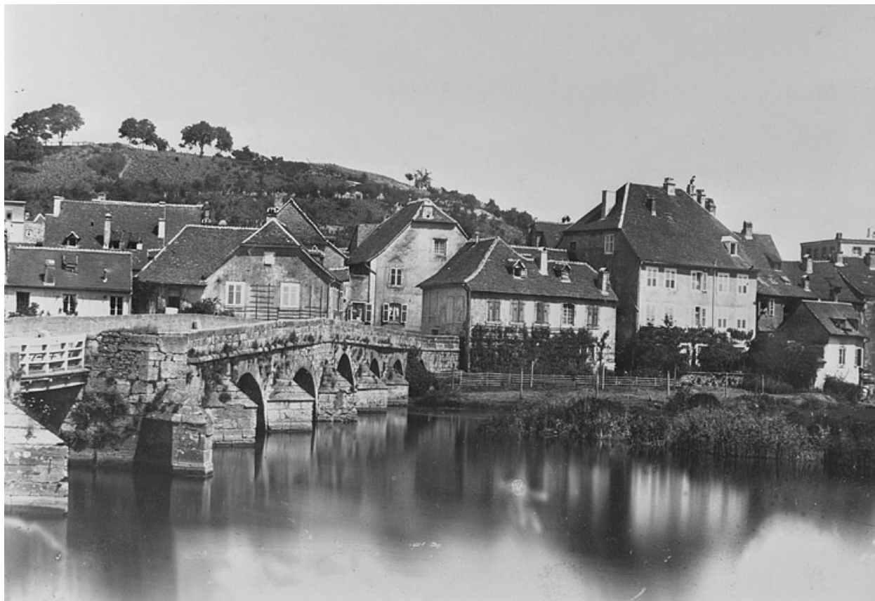
Pont Armand Bermont situé rue Charles Lalance.