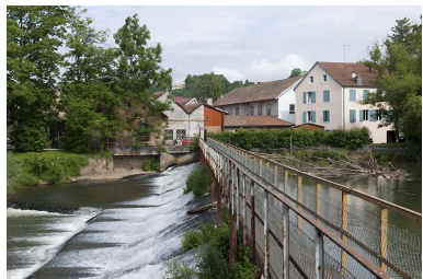
Passerelle sur le barrage situé près des ateliers municipaux, faubourg de Besançon.