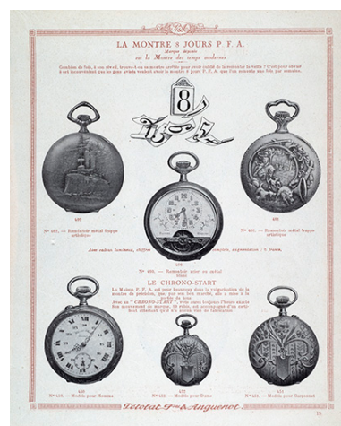
Catalogue Pétolat Frères et Anguenot, s.d. [vers 1930].