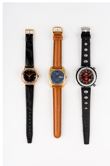
Montres Difor, 2e moitié 20e siècle. (Collection musée du Temps, Besançon). IVR43_20192500279NUC4A