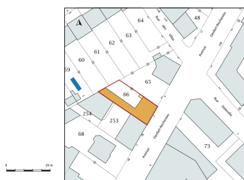
Plan-masse et de situation. Extrait du plan cadastral, 2019.