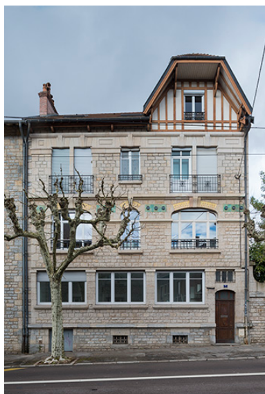
Vue de face. IVR43_20182500502NUC4A