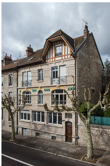
Vue de trois quarts droite. IVR43_20182500500NUC4A