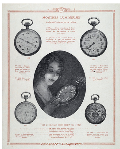
Catalogue Pétolat Frères et Anguenot, s.d. [vers 1930]. Phot. Jérôme Mongreville