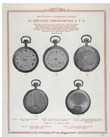
Catalogue Pétolat Frères et Anguenot, s.d. [vers 1930]. Phot. Jérôme Mongreville