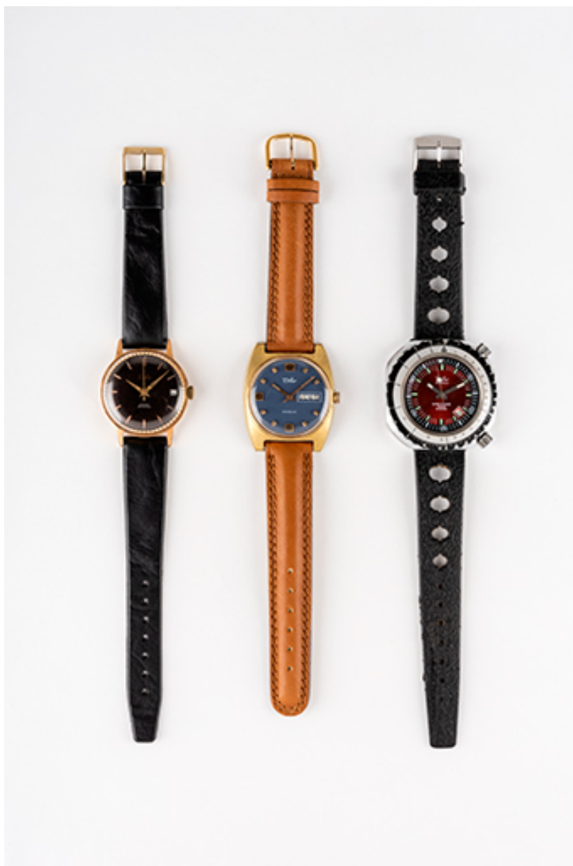
Montres Difer, 2e moitié 20e siècle. (Collection musée du Temps, Besançon).