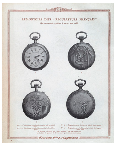
Catalogue Pétolat Frères et Anguenot, s.d. [vers 1930]. IVR43_20172501091NUC4A