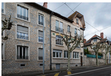
Vue de trois quarts gauche. IVR43_20182500503NUC4A