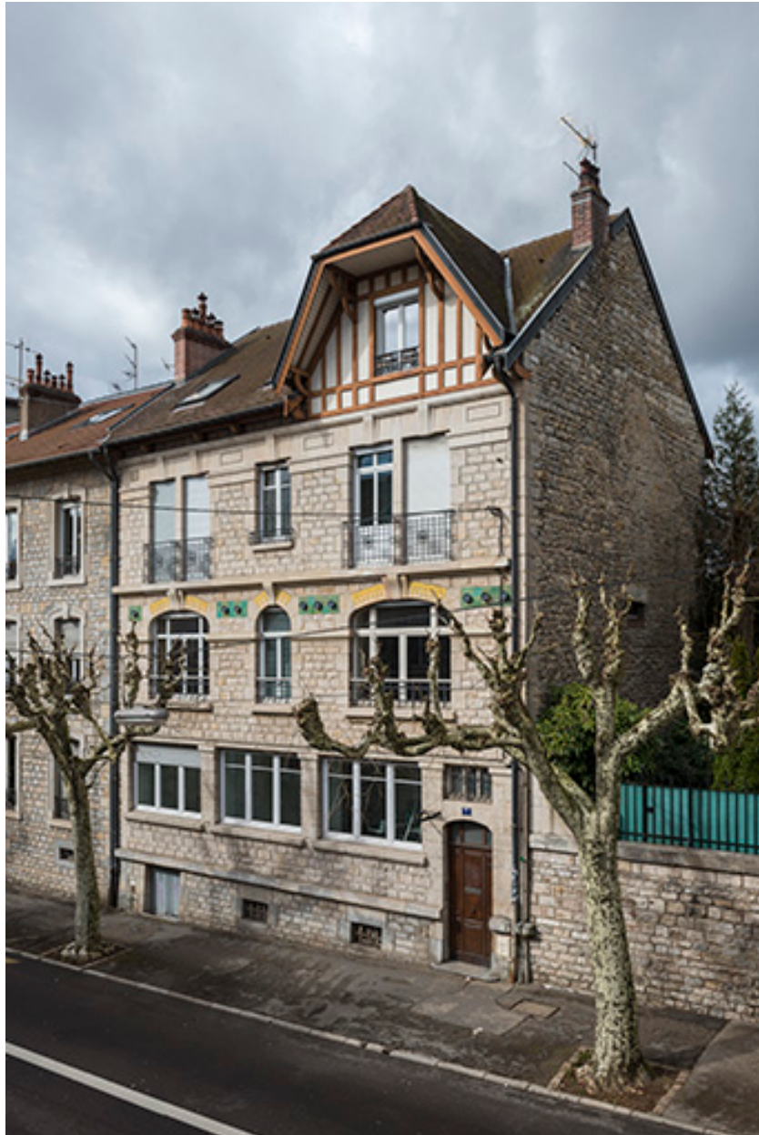
Vue de trois quarts droite.