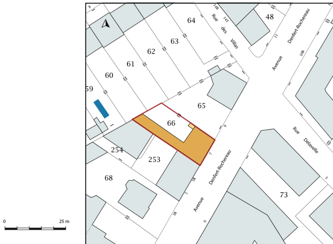
Plan-masse et de situation. Extrait du plan cadastral, 2019.