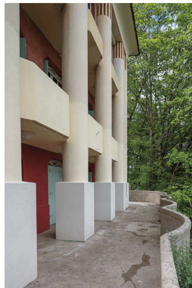
Terrasse de la façade nord.