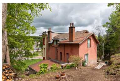
Façade sud, vue de trois quarts.