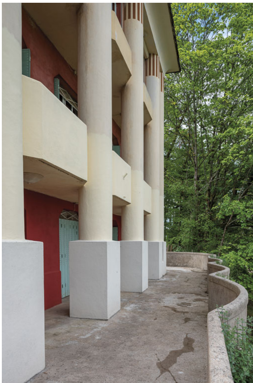
Terrasse de la façade nord.