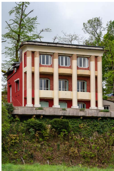
Façade nord, vue de trois-quarts. IVR26_20195800010NUC4A