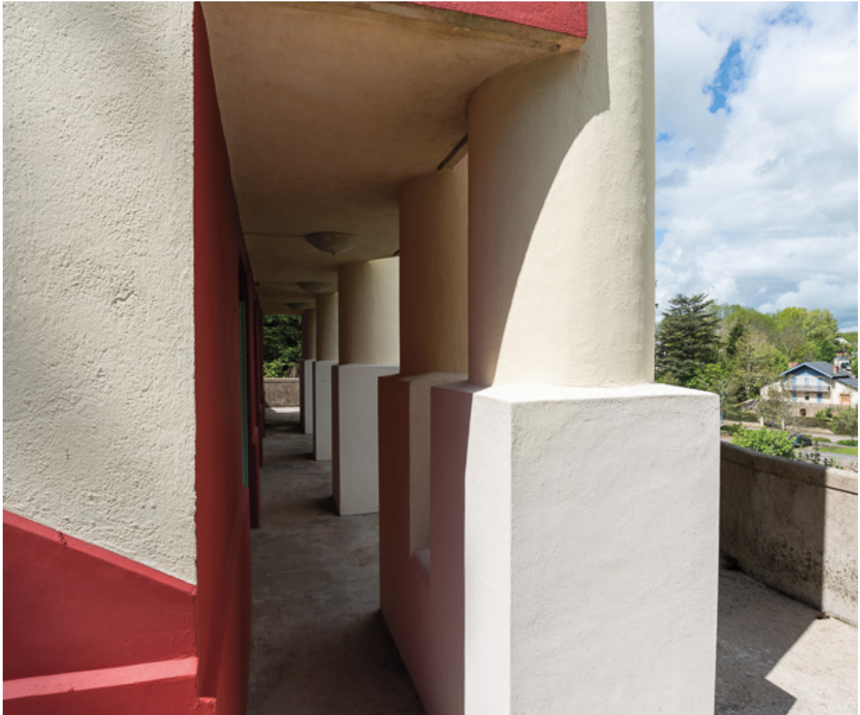
Terrasse de la façade nord, socle des colonnes.