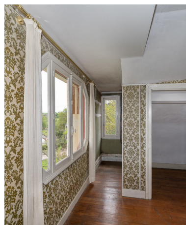
chambre ouverte en façade nord. IVR26_20195800223NUC4AQ