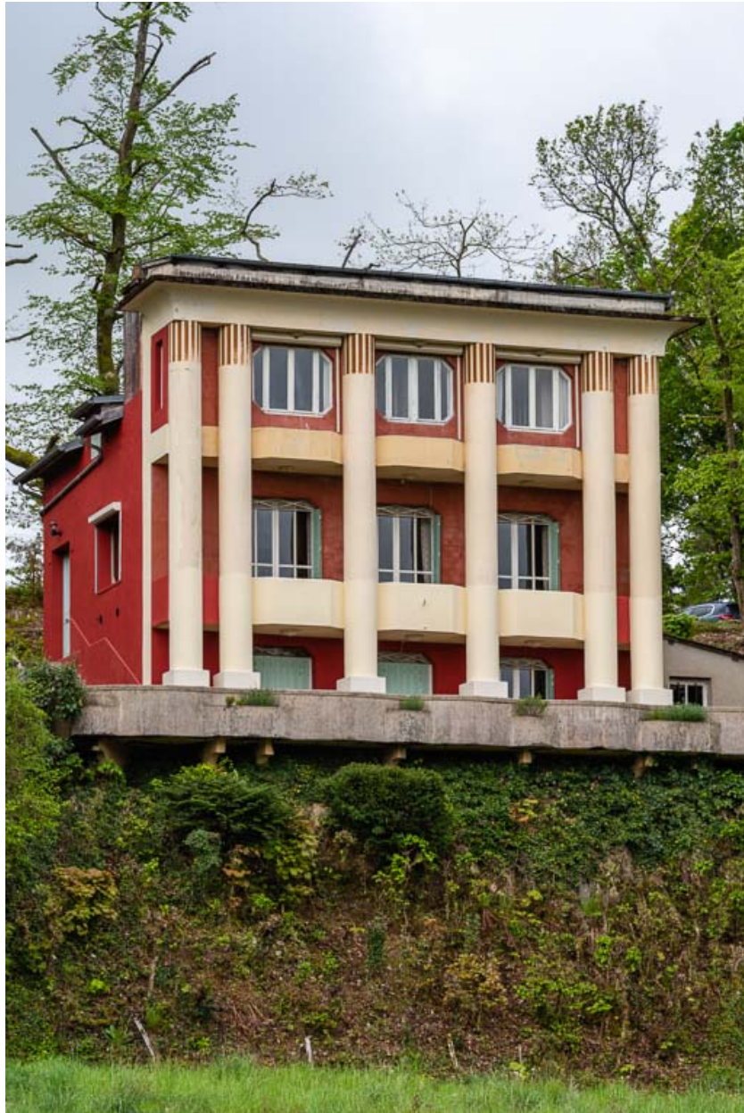
Façade nord, vue de trois-quarts.