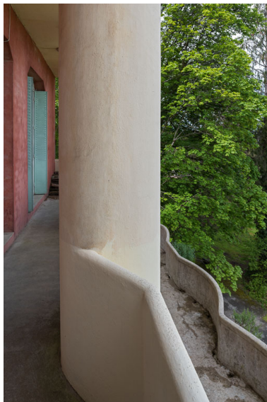
Balcon de la façade nord.