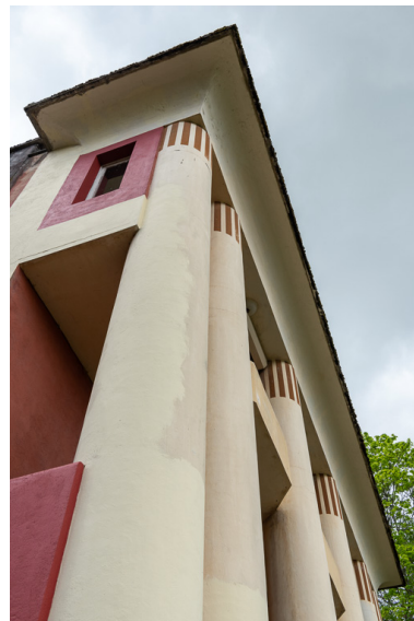
Corniche surmontant le troisième niveau de la façade nord.