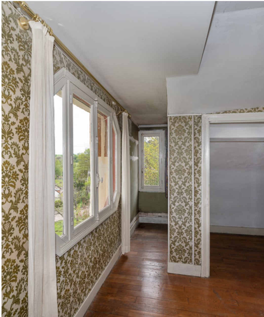
chambre ouverte en façade nord.