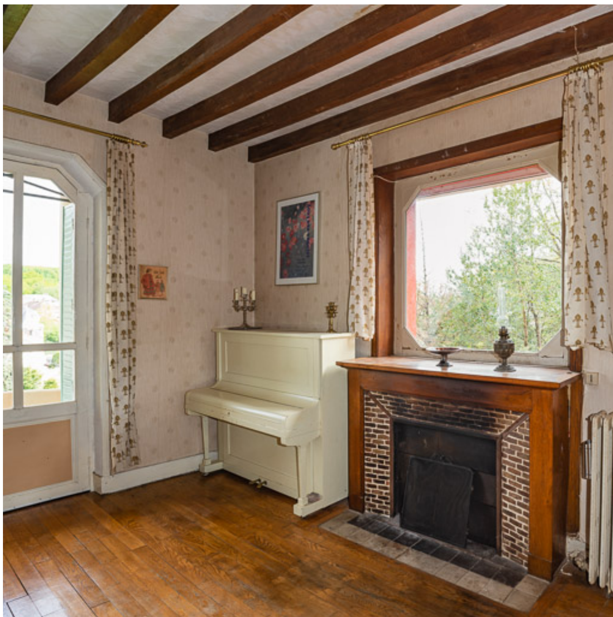
Séjour avec cheminée sous-baie.