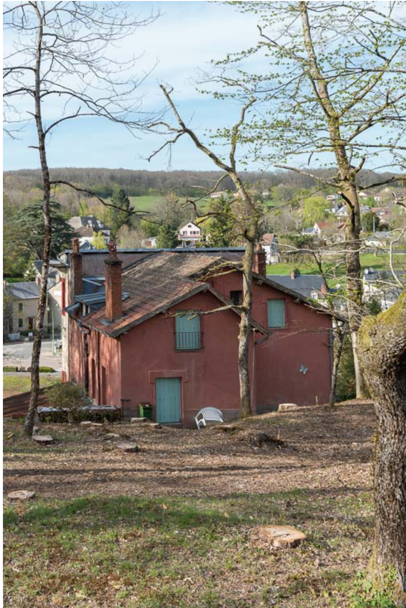
Vue depuis la colline des Garennes au sud.