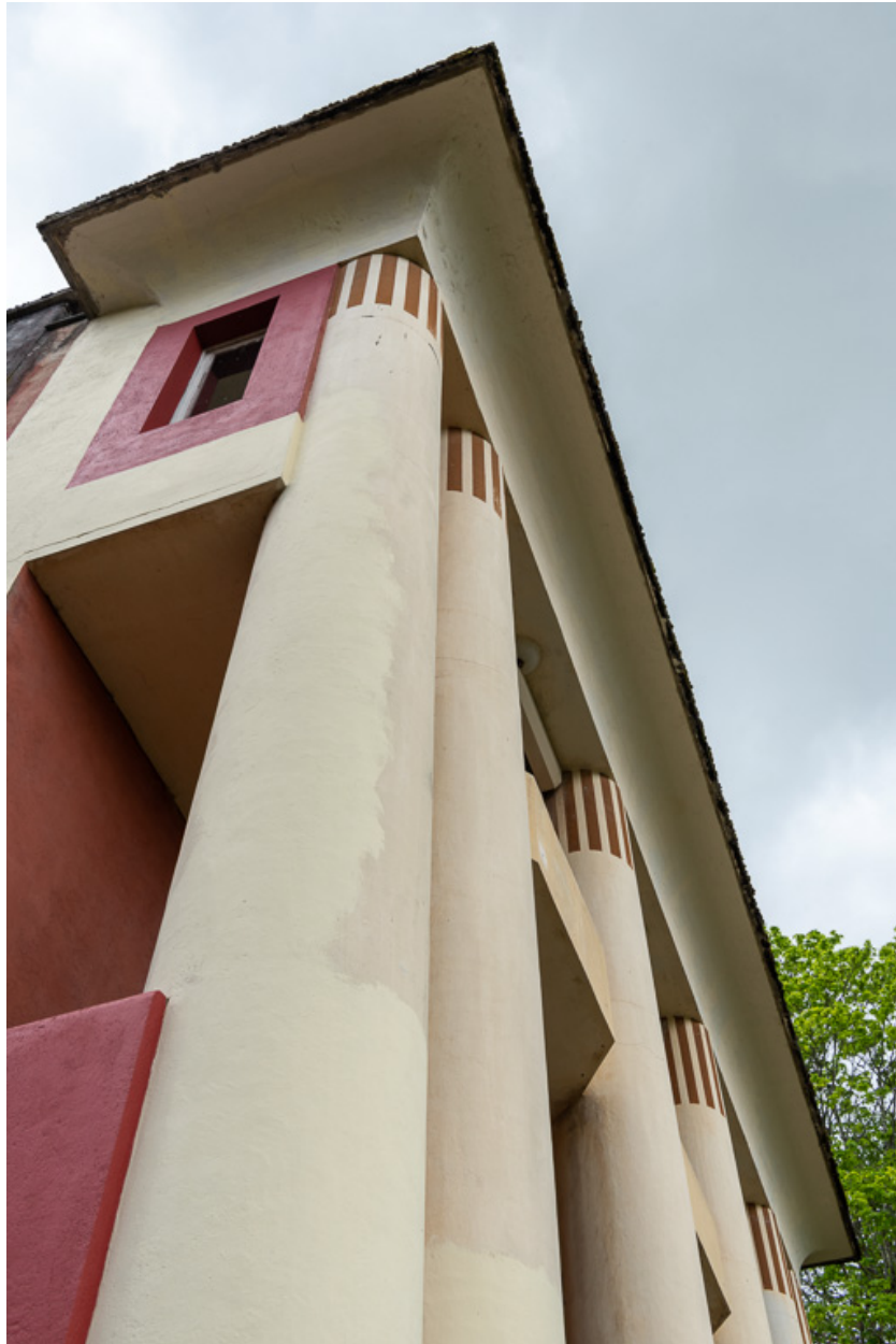
Corniche surmontant le troisième niveau de la façade nord.