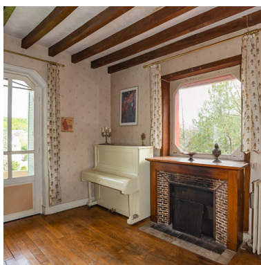
Séjour avec cheminée sous-baie. IVR26_20195800225NUC4AQ

IVR26_20195800224NUC4AQ