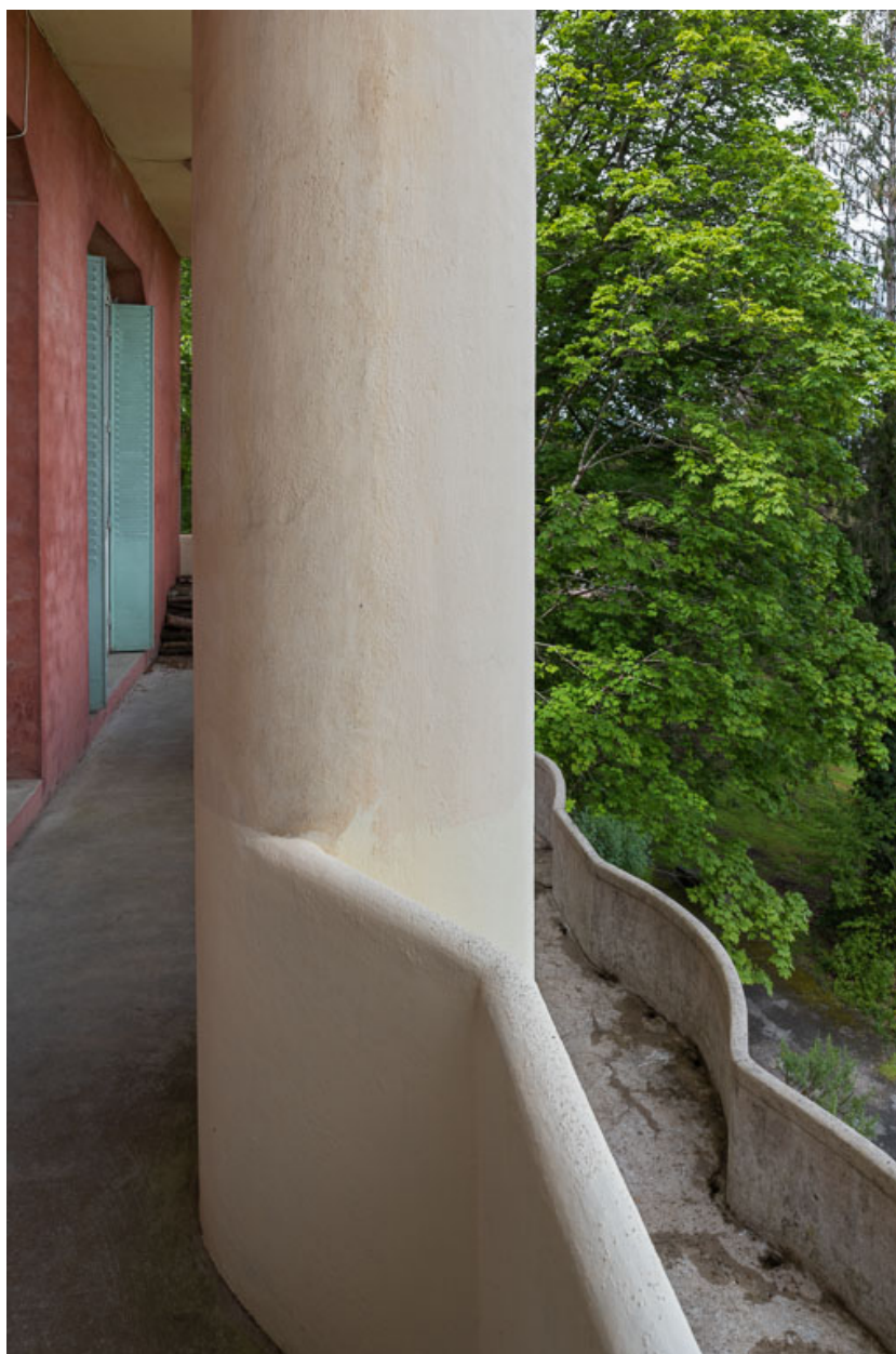
Balcon de la façade nord.