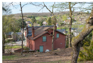
Vue depuis la colline des Garennes au sud. IVR26_2019580007NUC4A