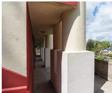
Terrasse de la façade nord, socle des colonnes. IVR26_20195800227NUC4AQ