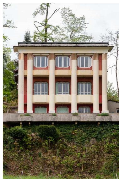
Façade nord, vue de face. IVR26_20195800012NUC4A