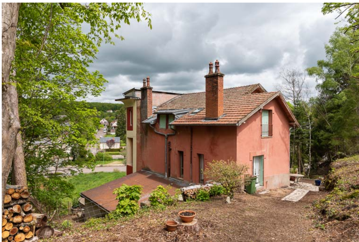
Façade sud, vue de trois quarts.