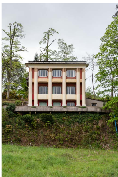
Façade nord, vue de face. IVR26_20195800011NUC4A