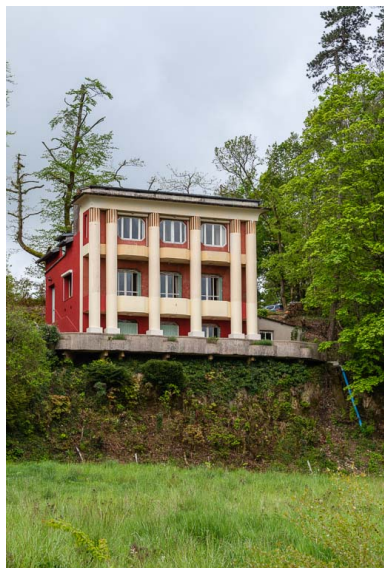
Façade nord, vue de trois quarts.