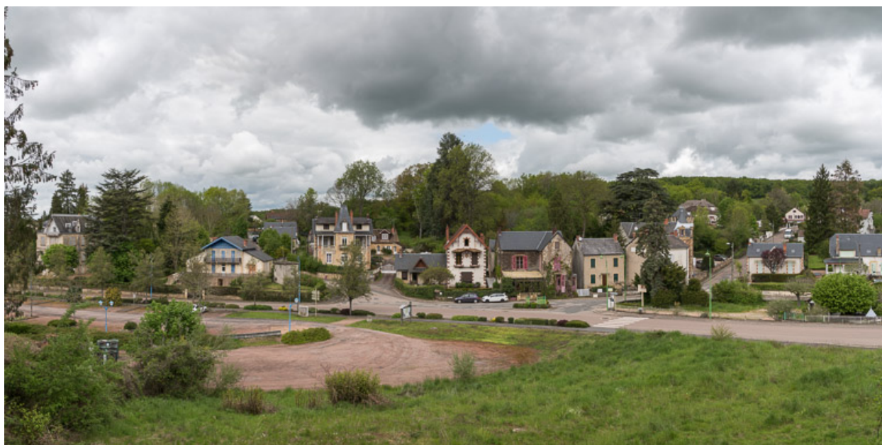
Vue sur le quartier thermal depuis la villa.