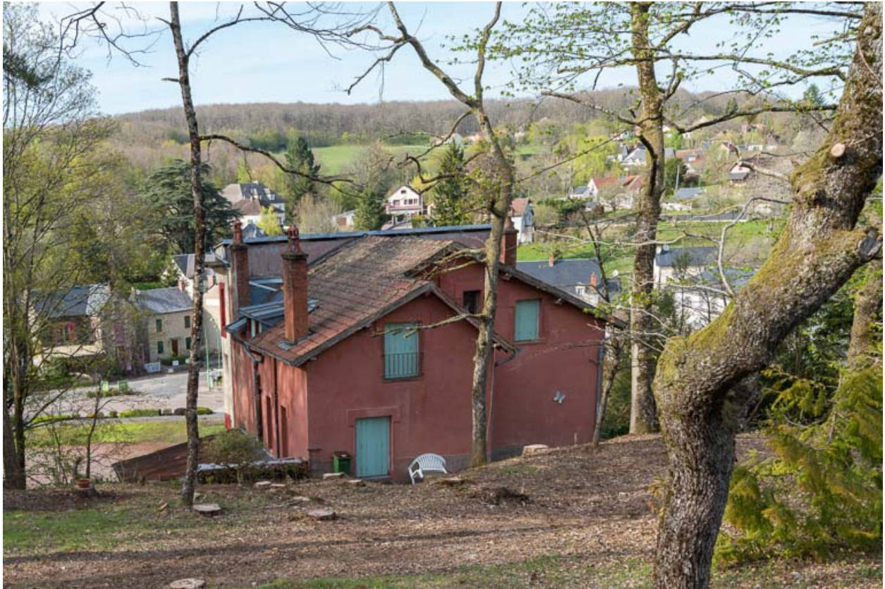
Vue depuis la colline des Garennes au sud.