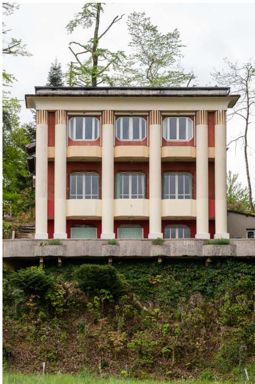
Façade nord, vue de face.