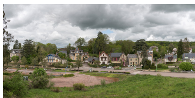
Vue sur le quartier thermal depuis la villa.

IVR26_20195800230NUC2AQ