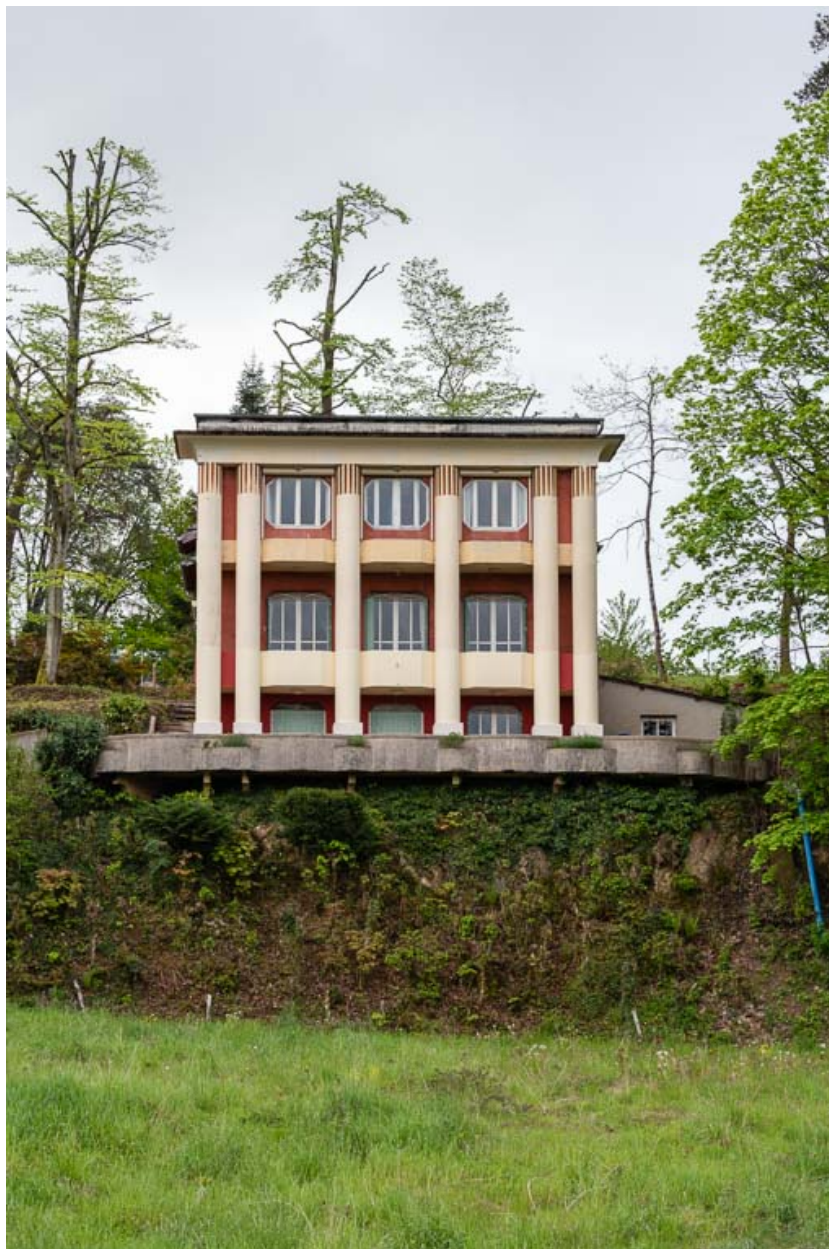
Façade nord, vue de face.