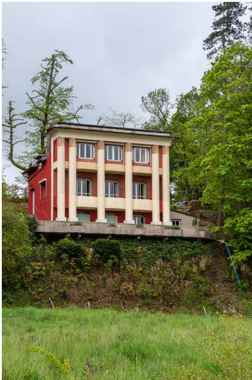
Façade nord, vue de trois quarts.