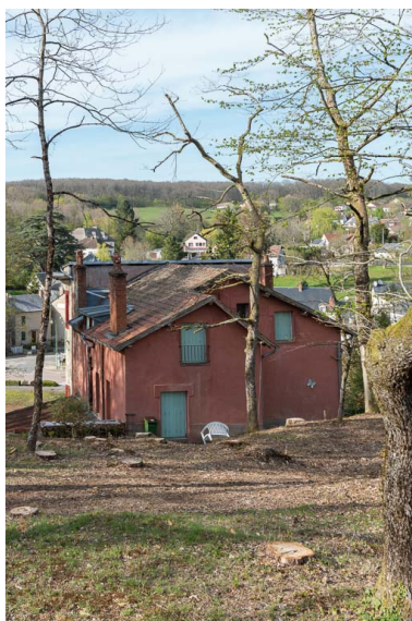
Vue depuis la colline des Garennes au sud.