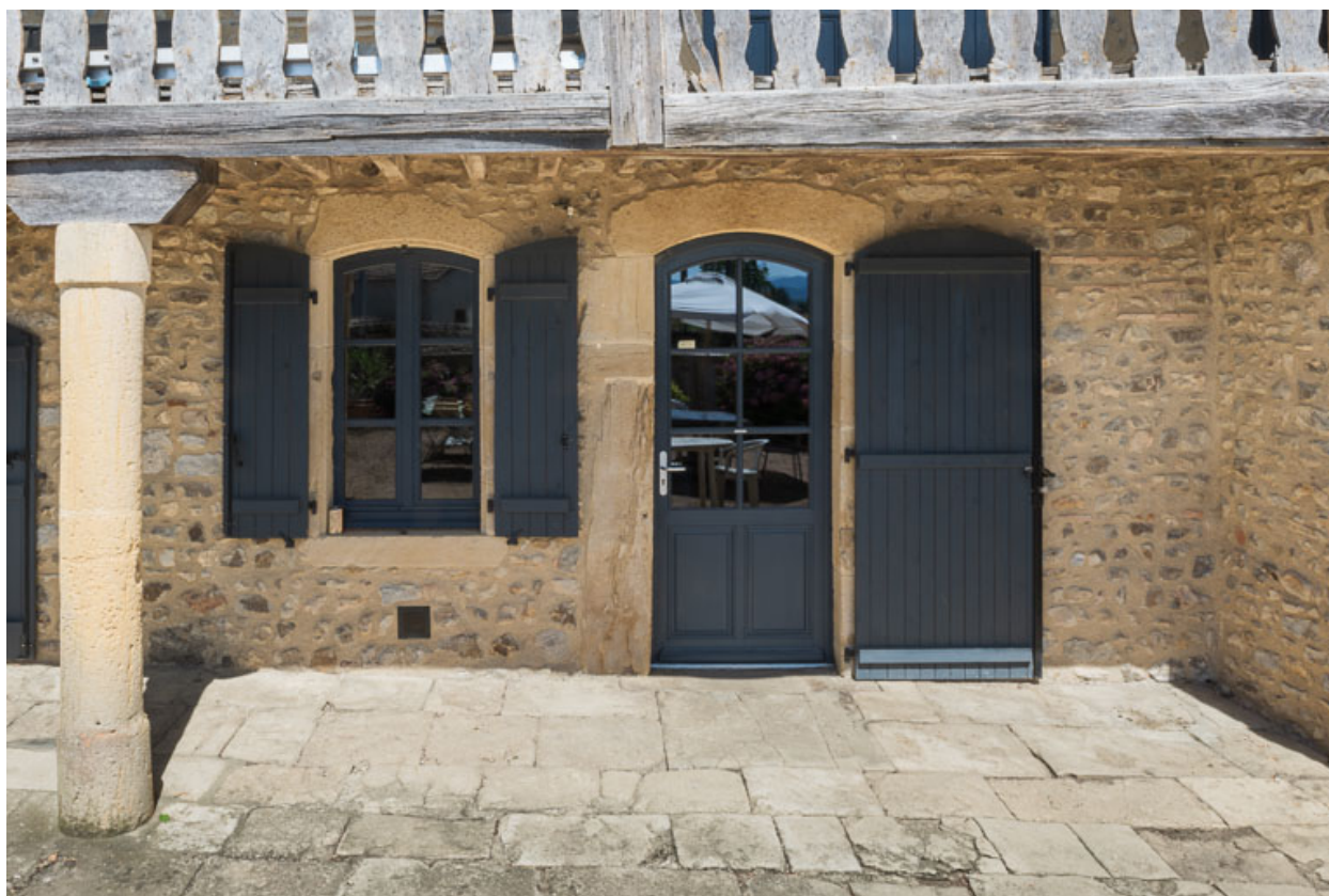
Détail du rez-de-chaussée de la façade antérieure de la maison : baies en arc segmentaire (milieu du XVIIIe siècle)