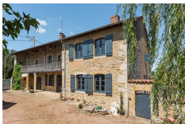
Vue de la façade antérieure de la maison