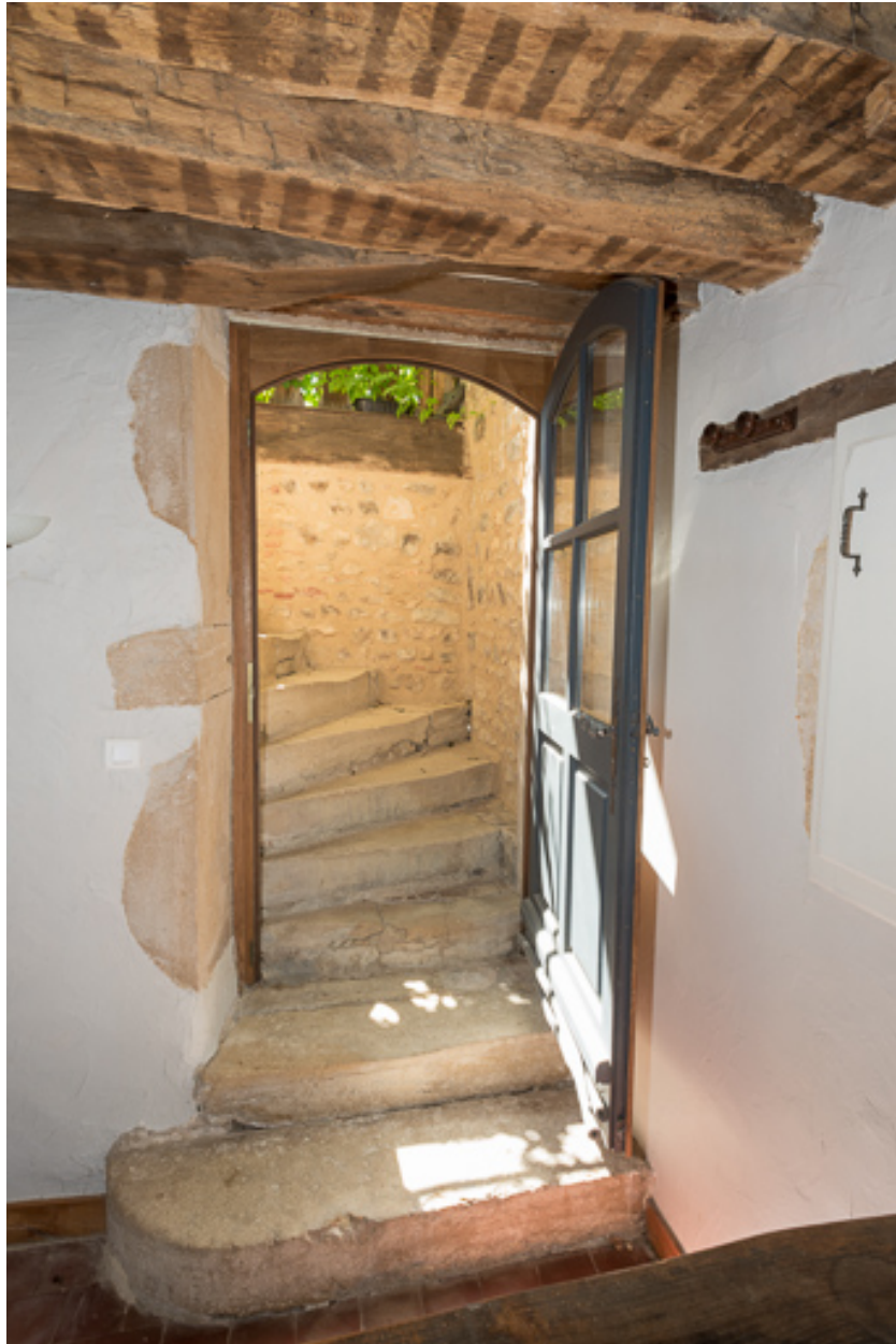
Escalier donnant accès à la galerie