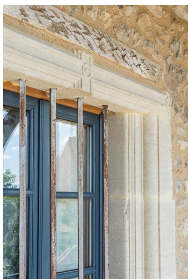
Détail d'une baie, à l'étage de la maison. D'époque Renaissance, cette baie provient vraisemblablement de l'ancien château de Vauban, détruit au début du XVIIIe siècle, et a été utilisée en emploi.