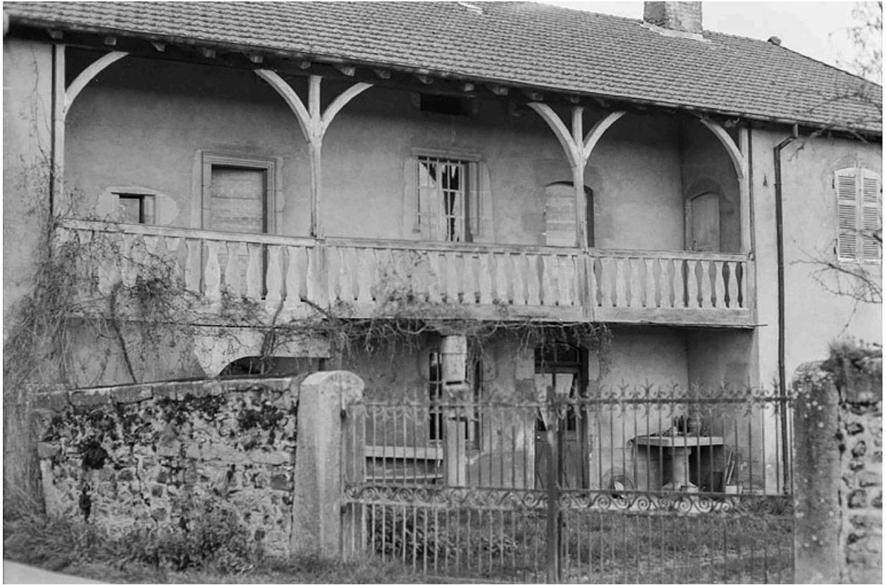
Vue de la maison, centrée sur la galerie, vers 1970.