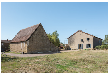
Vue d'ensemble de la ferme au nord IVR26_20197100246NUC4A