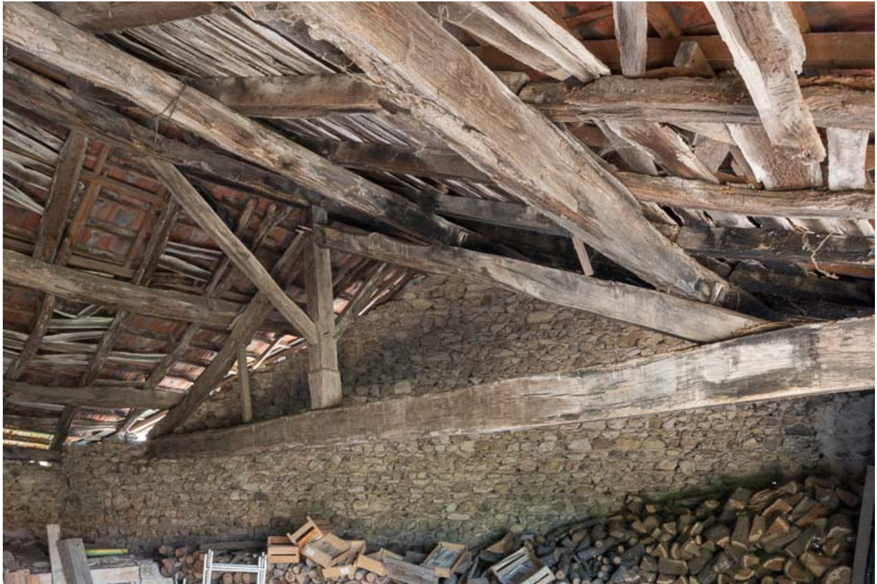
Charpente du cuvage