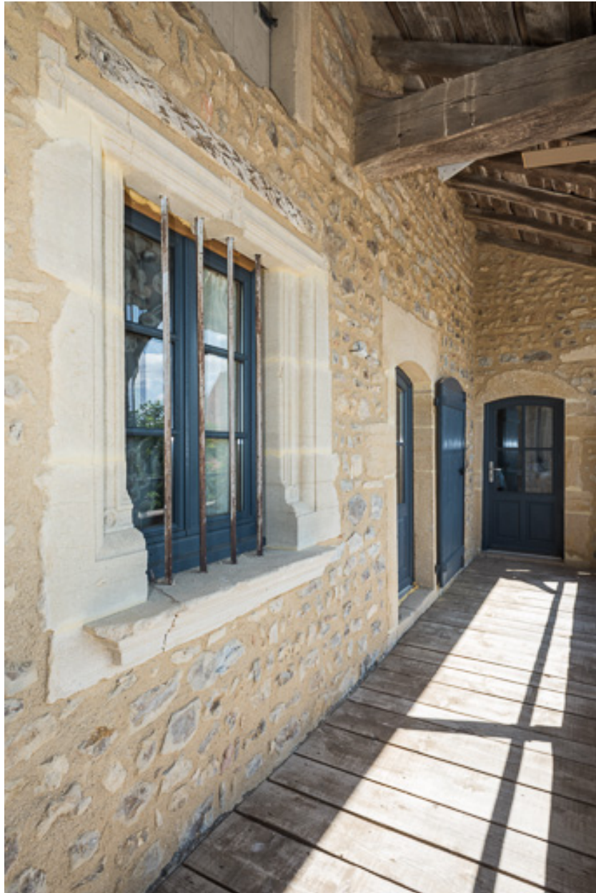
Vue de la galerie