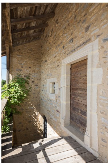
Vue de la galerie, protégée par un débord de toit soutenu par le dépassement des murs-pignons IVR26_20197100248NUC4A