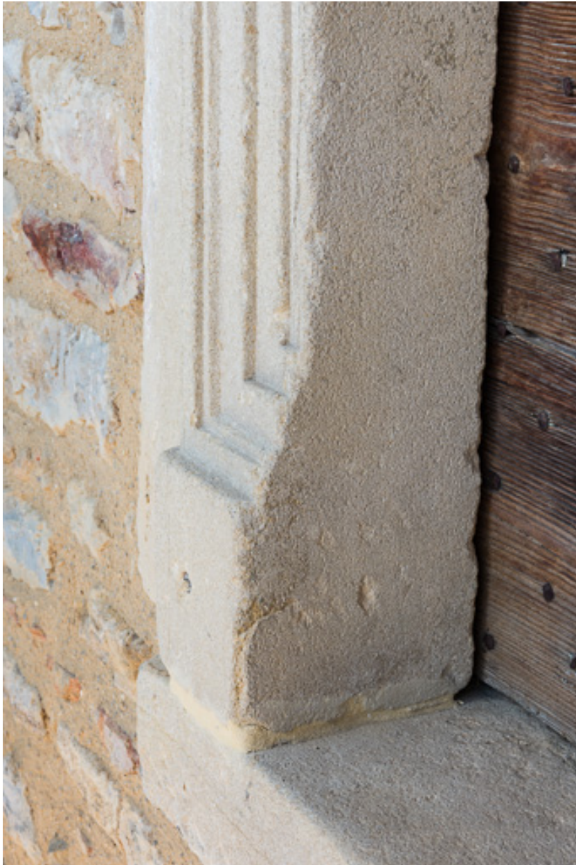
Détail d'une baie moulurée du XVIIe siècle, à l'étage de la maison