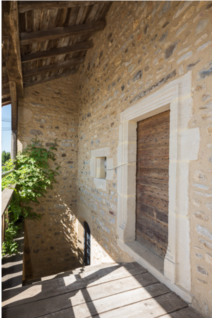
Vue de la galerie, protégée par un débord de toit soutenu par le dépassement des murs-pignons