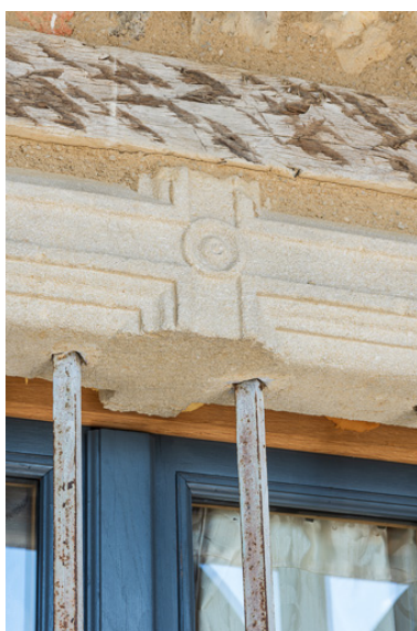
Détail d'une baie moulurée du XVIe siècle, à l'étage de la maison