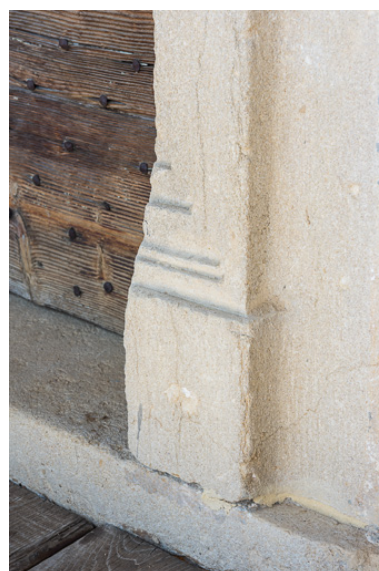
Détail d'une baie moulurée du XVIe siècle, à l'étage de la maison IVR26_20197100252NUC4A