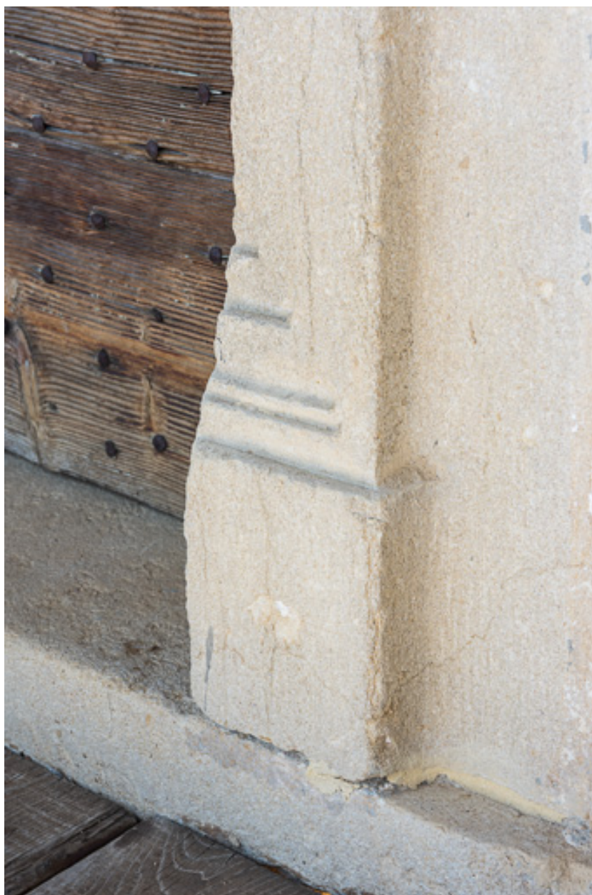
Détail d'une baie moulurée du XVIe siècle, à l'étage de la maison