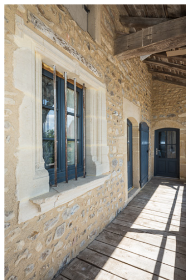
Vue de la galerie IVR26_20197100249NUC4A