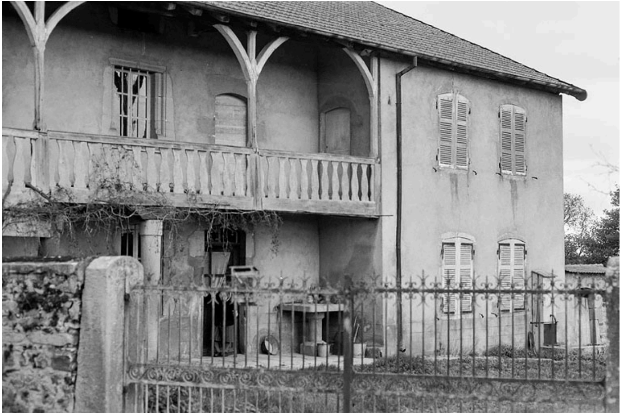
Vue de la maison, vers 1970