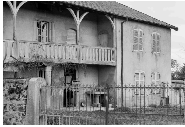
Vue de la maison, vers 1970