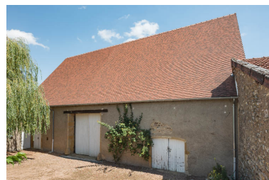
Vue de la façade postérieure de la grange. A droite, une portion du mur du bâtiment du cuvage, construit au sud de la grange, apparaît. IVR26_20197100256NUC4A