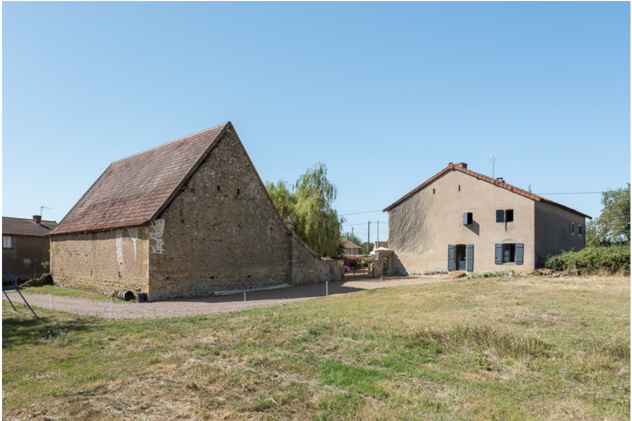
Vue d'ensemble de la ferme au nord