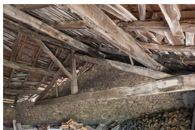
Charpente du cuvage IVR26_20197100257NUC4A