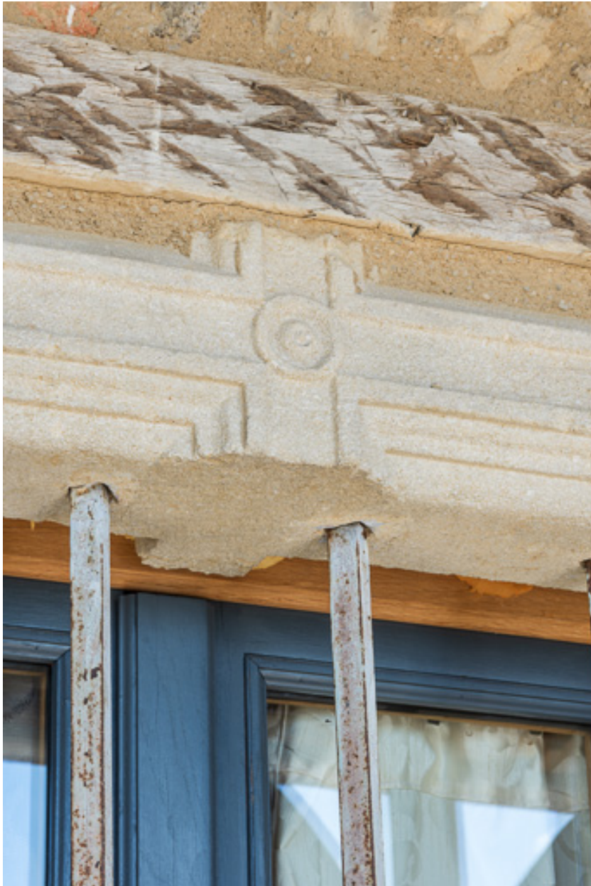
Détail d'une baie moulurée du XVIIe siècle, à l'étage de la maison