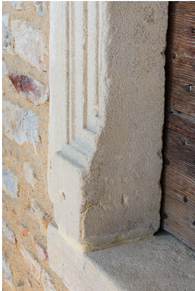
Détail d'une baie moulurée du XVI e siècle, à l'étage de la maison