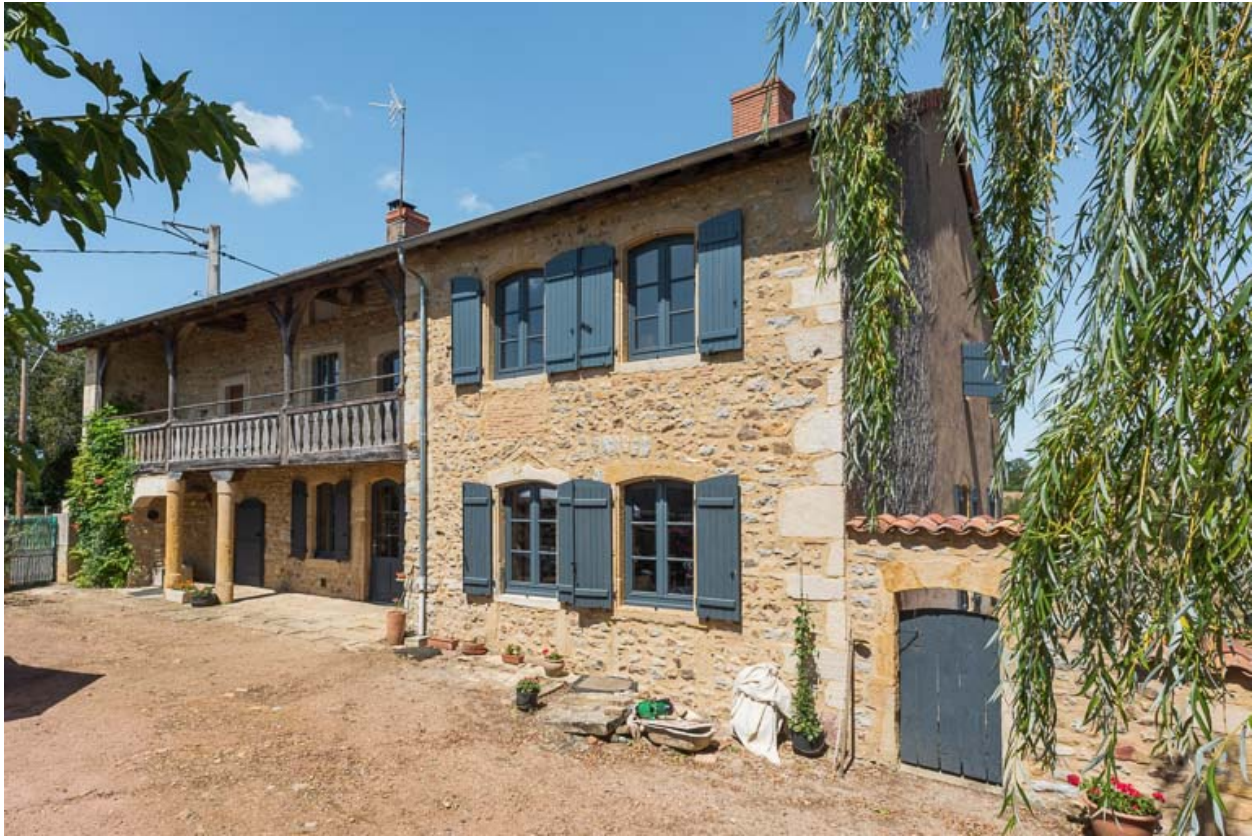
Vue de la façade antérieure de la maison