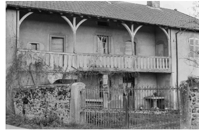
Vue de la maison, centrée sur la galerie, vers 1970. IVR26_20207100080NUC2