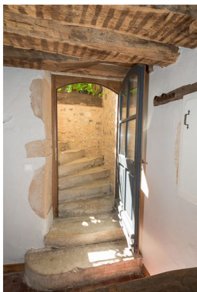
Escalier donnant accès à la galerie IVR26_20197100247NUC4A