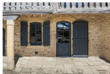
Détail du rez-de-chaussée de la façade antérieure de la maison : baies en arc segmentaire (milieu du XVIIIe siècle) IVR26_20197100254NUC4A