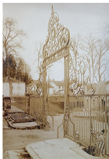
Vue de la grille avant sa dépose.