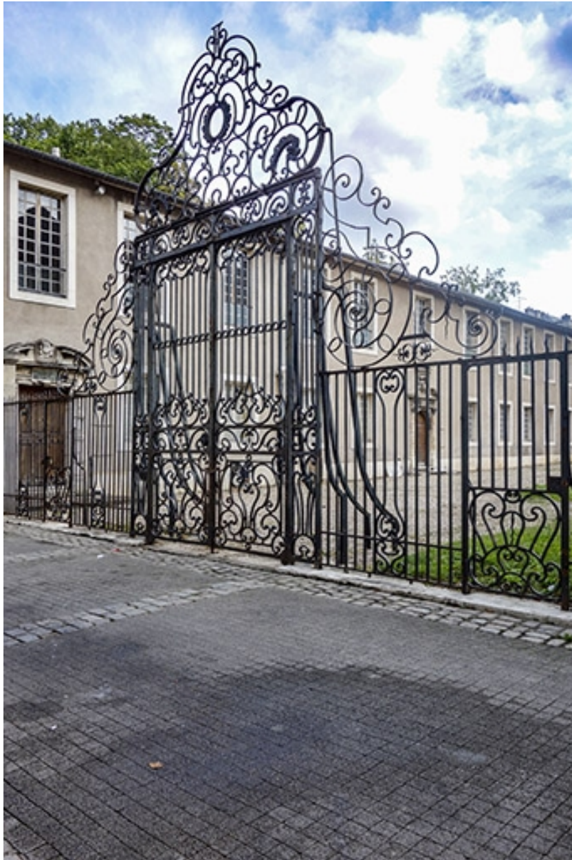
Vue de la grille remontée dans la cour du Musée Lorrain, rue Jacquot, à Nancy.