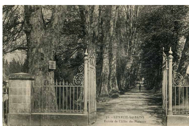
Entrée secondaire (devant l'Allée des Platanes). IVR43_20217000086NUC4A