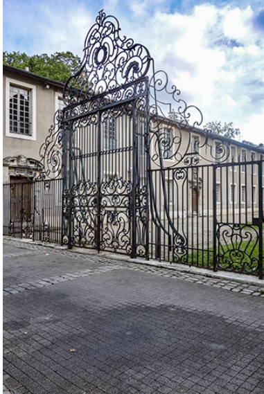
Vue de la grille remontée dans la cour du Musée Lorrain, rue Jacquot, à Nancy.