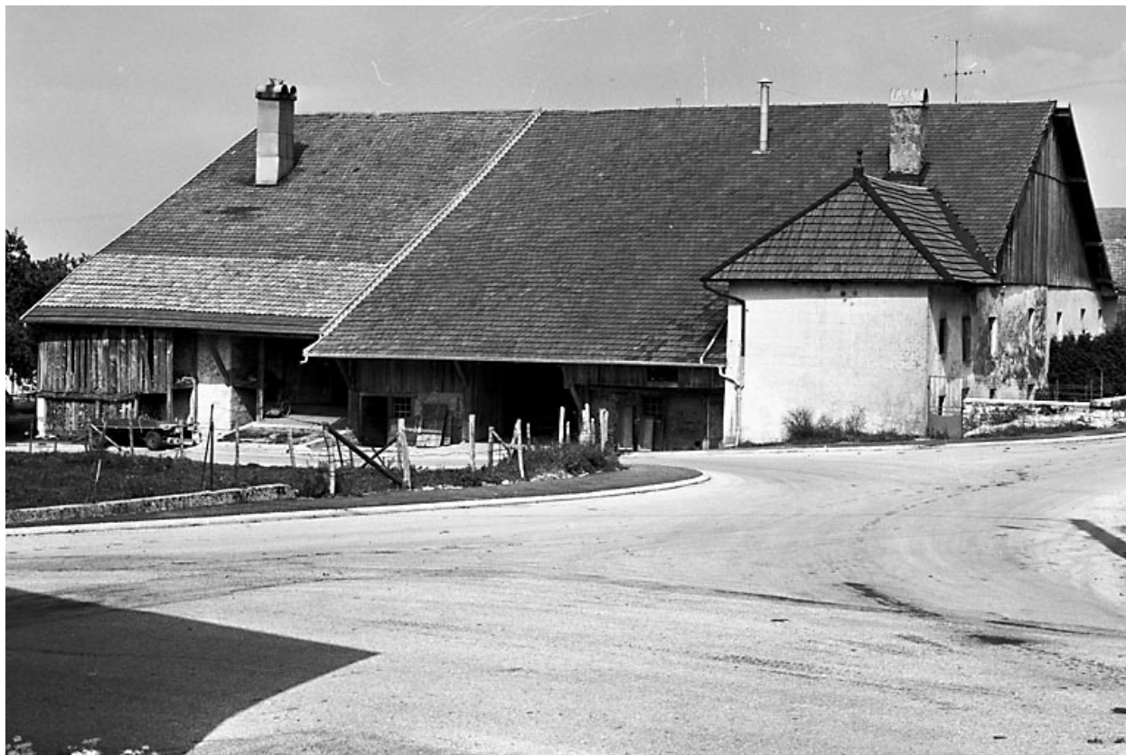
Ferme située 35-37 rue des Châteaux d'Eau : vue d'ensemble.