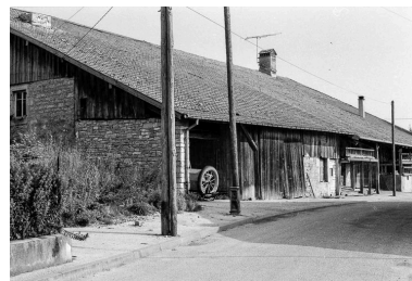
Ferme : façade sur rue. IVR43_19752501258Z