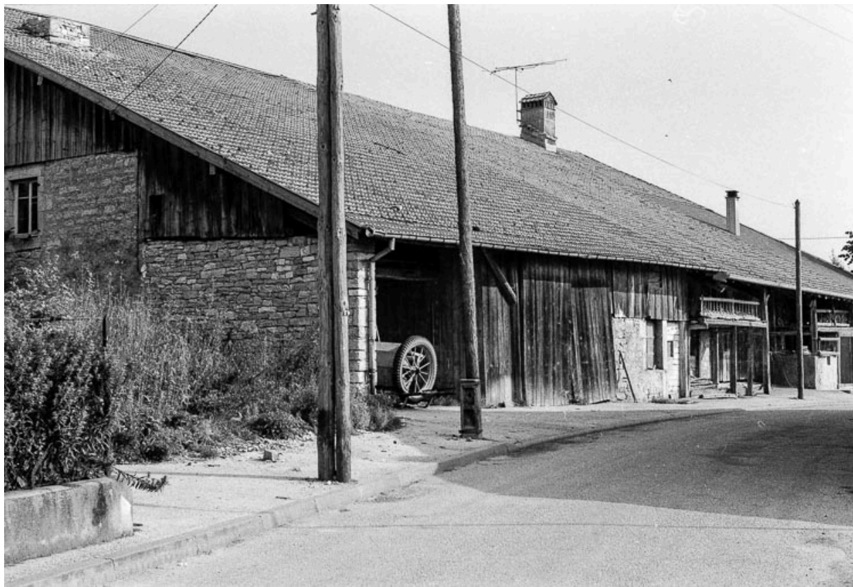
Ferme : façade sur rue.