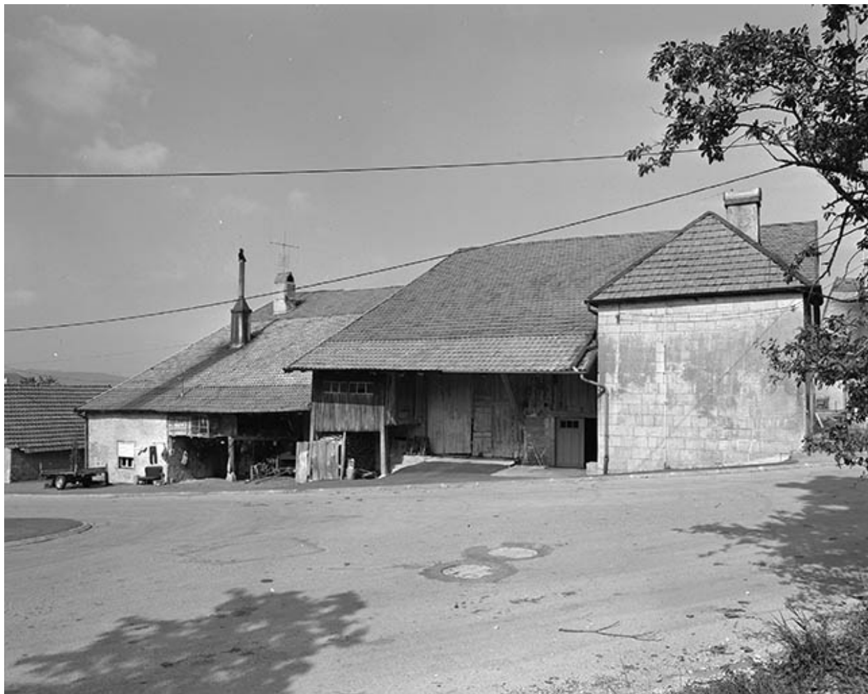
Ferme située 44-46 rue des Châteaux d'Eau : vue d'ensemble.