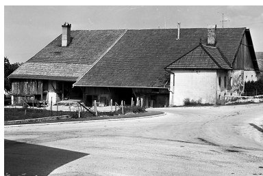
Ferme située 35-37 rue des Châteaux d'Eau : vue d'ensemble.