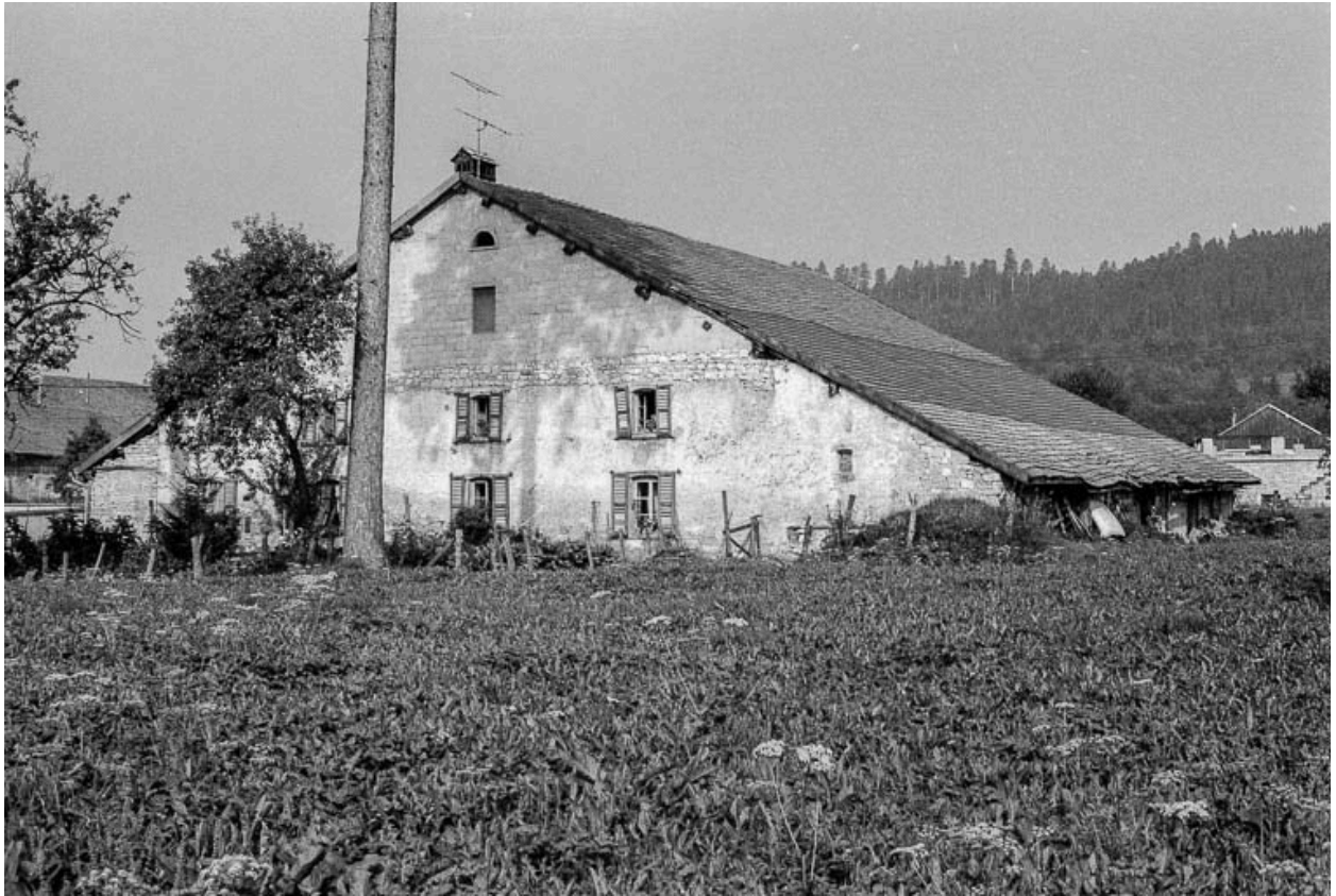
Ferme : façades antérieure et latérale droite.