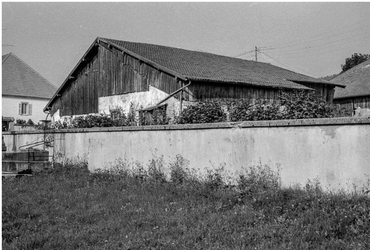
Ferme : façades postérieure et latérale droite.