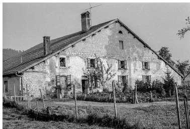
Ferme : façade antérieure vue de trois quarts gauche. IVR43_19752501254Z