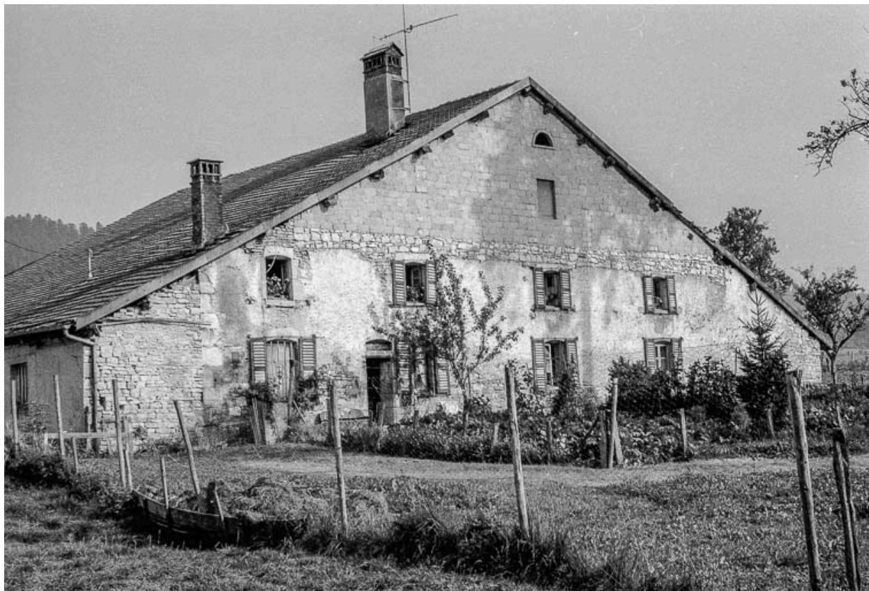
Ferme : façade antérieure vue de trois quarts gauche.