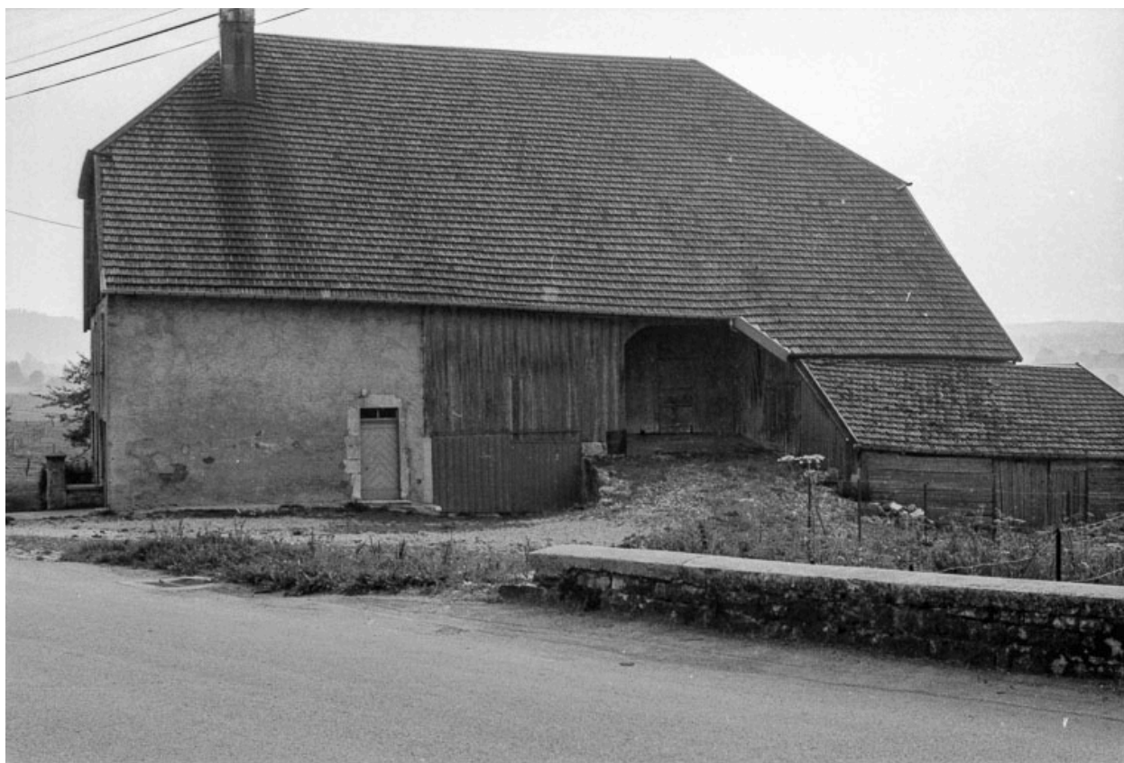
Façade latérale droite.