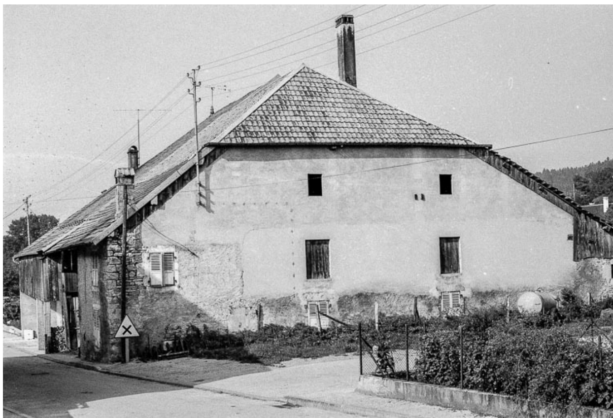
Ferme : façade latérale droite.