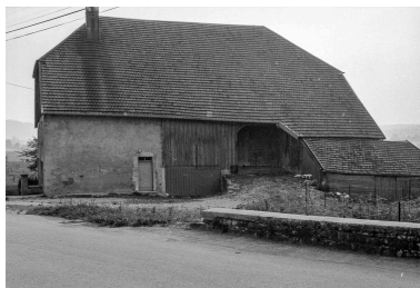
Façade latérale droite.