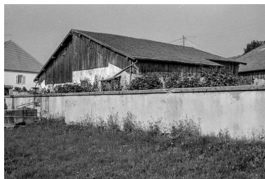
Ferme : façades postérieure et latérale droite.