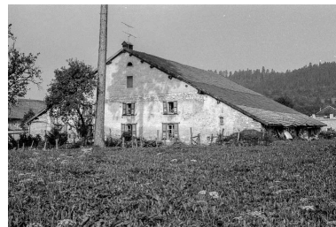
Ferme : façades antérieure et latérale droite. IVR43_19752501255Z