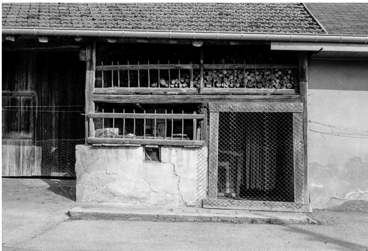
Ferme : détail de la façade antérieure.