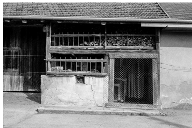
Ferme : détail de la façade antérieure.