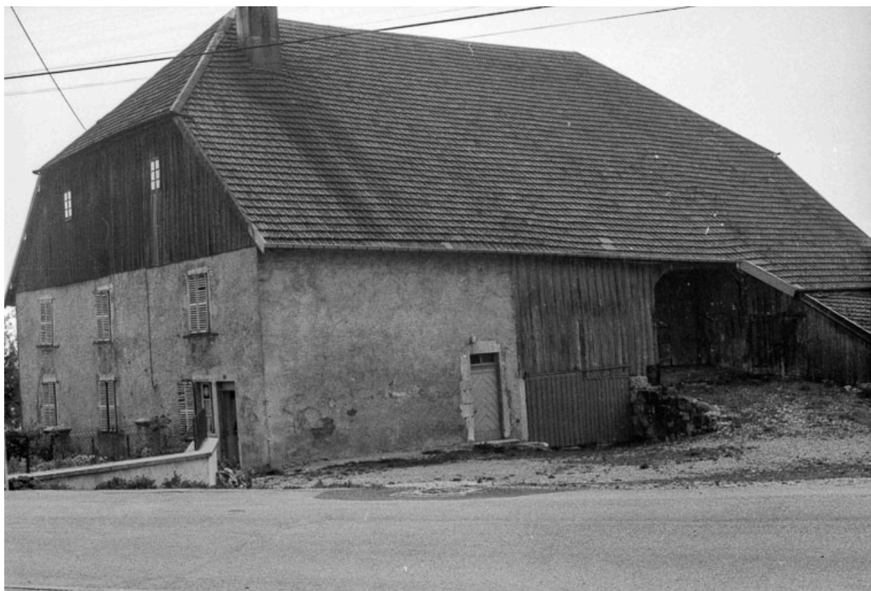
Ferme : façades antérieure et latérale droite.