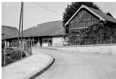
Ferme : vue d'ensemble depuis la rue.