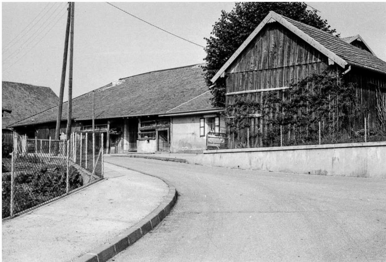
Ferme : vue d'ensemble depuis la rue.