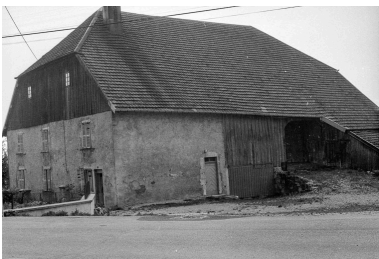
Ferme : façades antérieure et latérale droite.