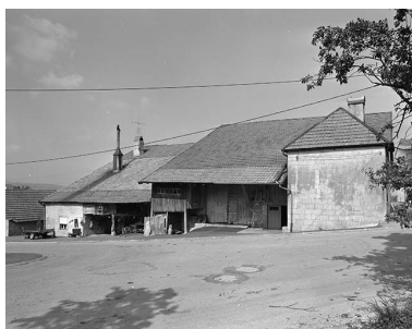
Ferme située 44-46 rue des Châteaux d'Eau : vue d'ensemble. IVR43_19782500333X