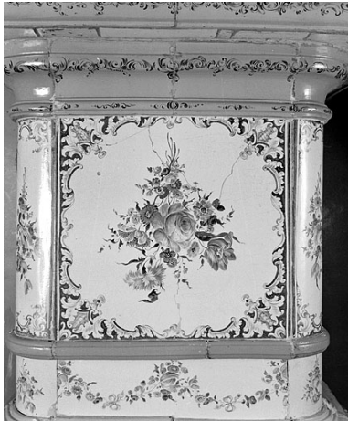
Détail du corps supérieur. IVR43_19882500213X