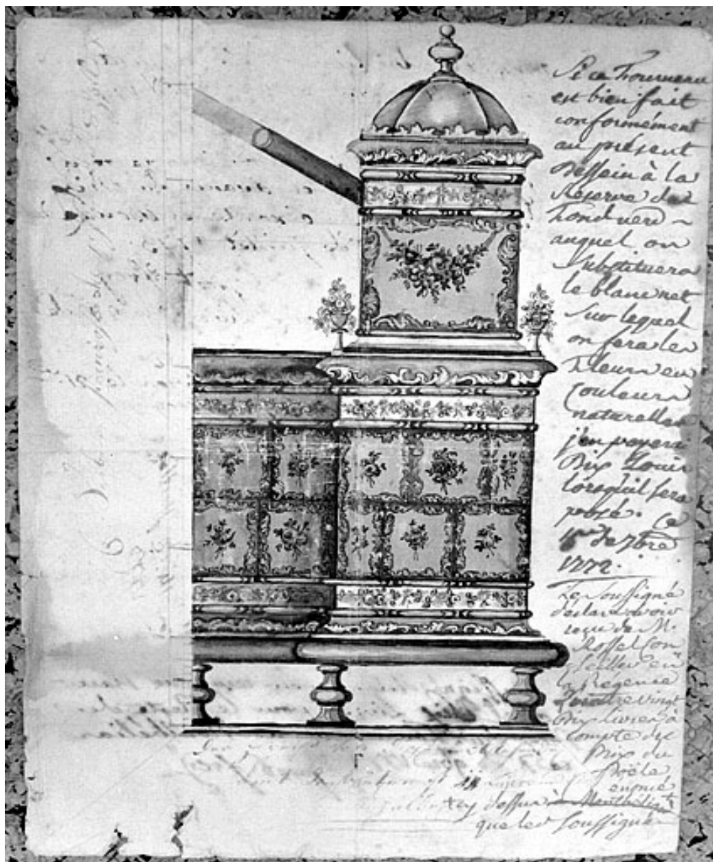
Dessein [projet] d'un poêle de fayence, 1773.