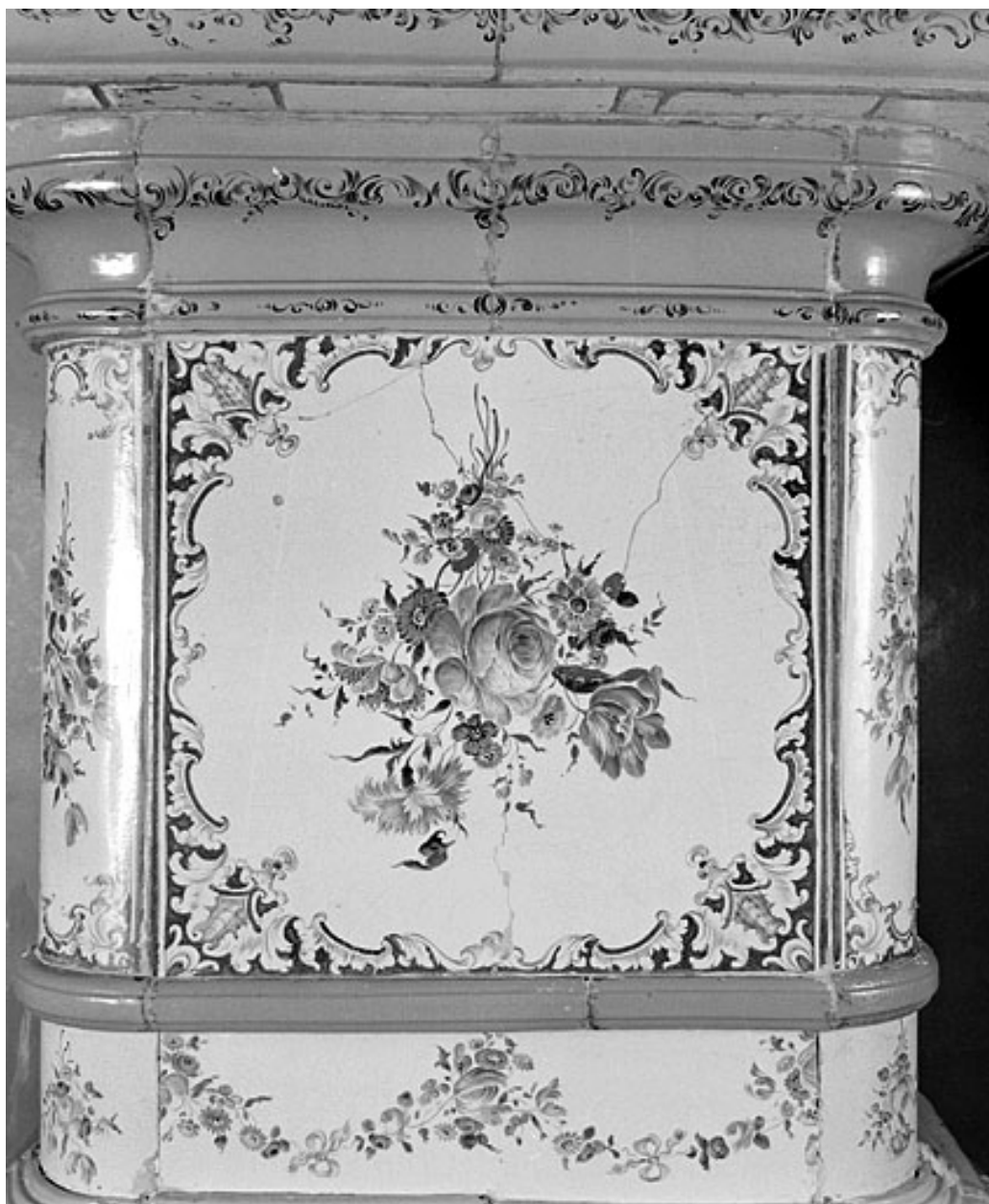
Détail du corps supérieur.