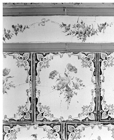
Détail du corps inférieur.