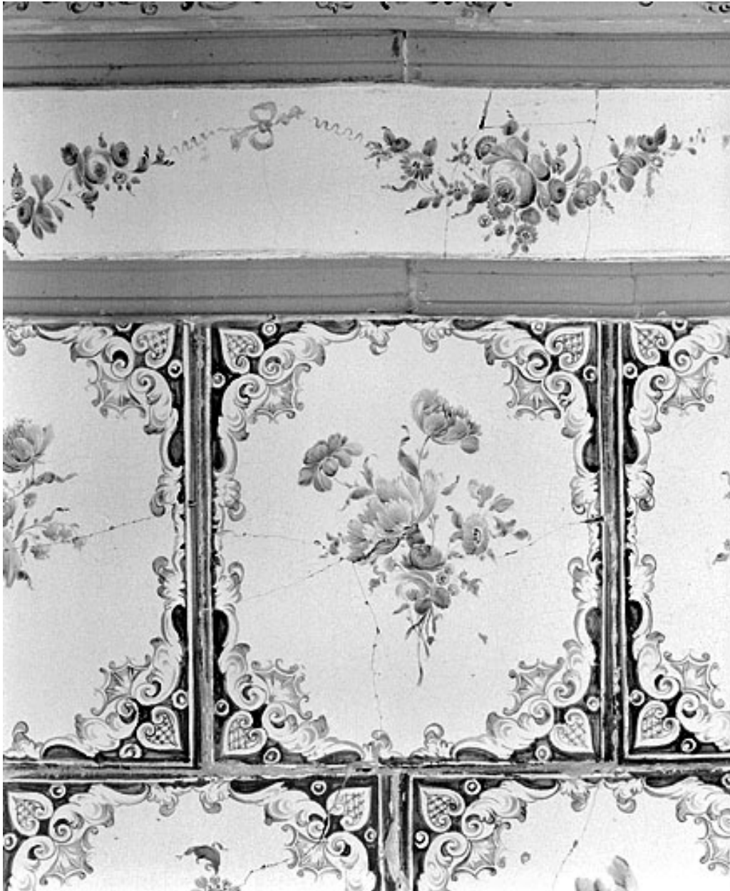
Détail du corps inférieur.