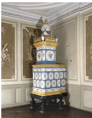
Vue d'ensemble. IVR43_19882500151VA