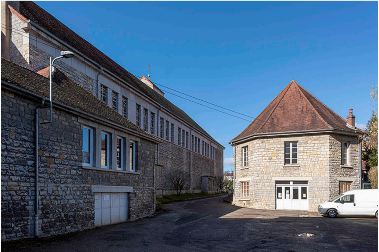
De gauche à droite : sacristie, église et maison des œuvres - cinéma Villarceau.