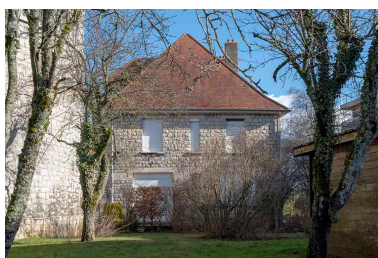
Façade ouest du presbytère vue depuis le jardin. IVR43_20222500078NUC4A