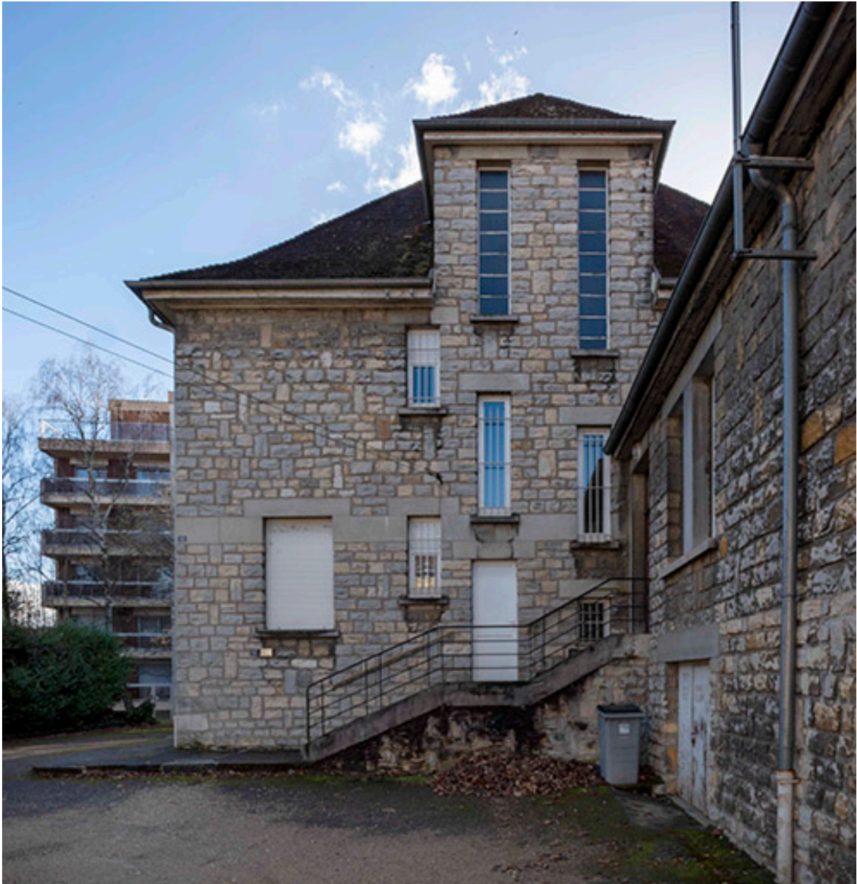
Façade nord du presbytère et bâtiment abritant la chapelle, la sacristie et la chaufferie de l'église.