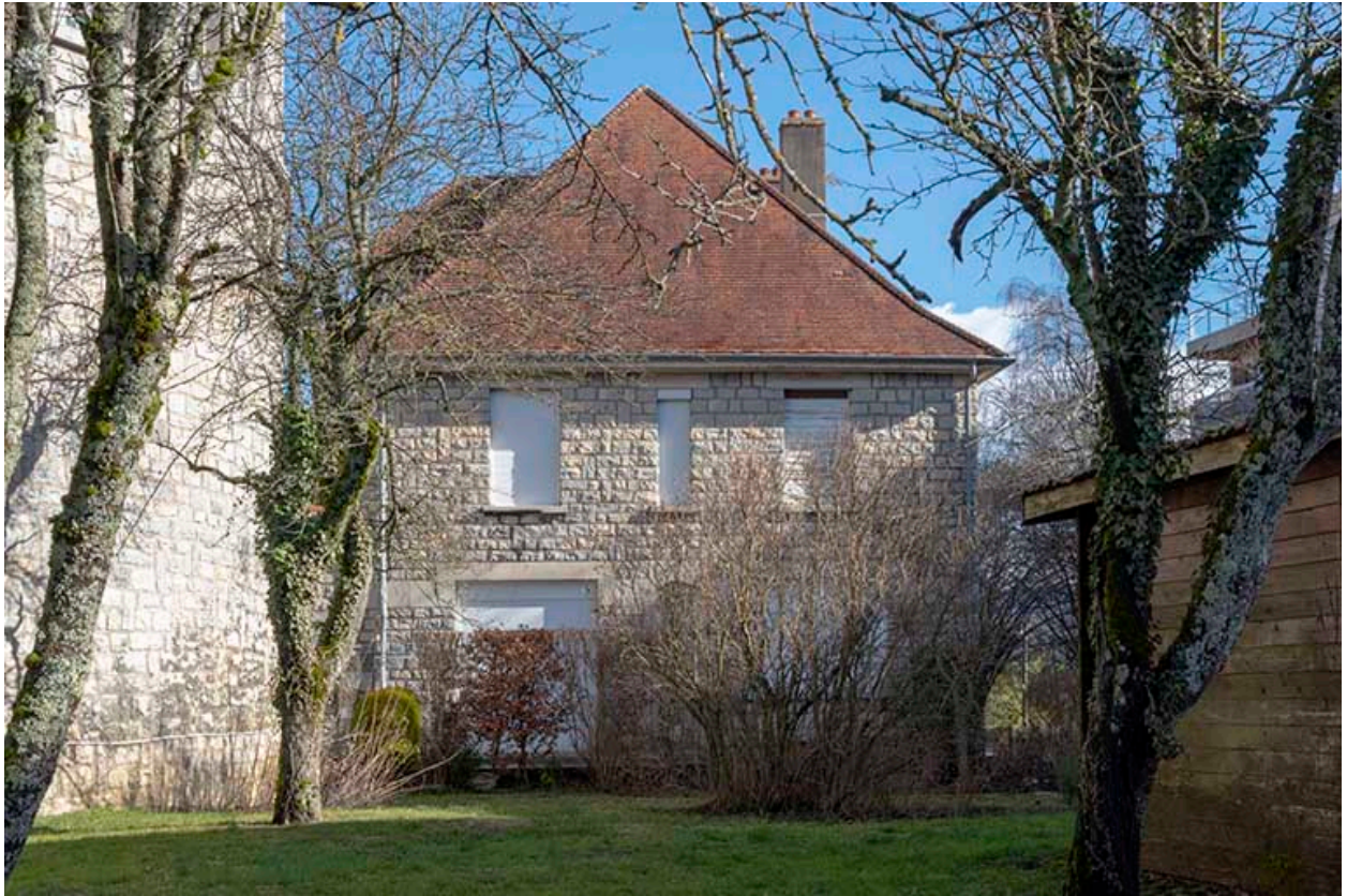
Façade ouest du presbytère vue depuis le jardin.