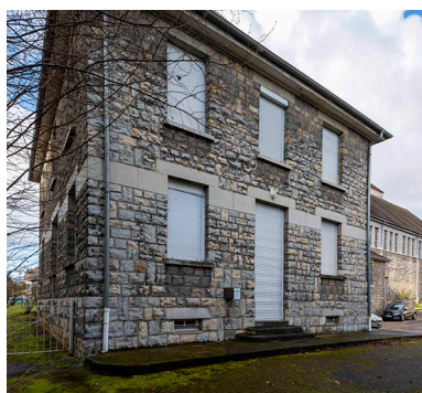
Façades sud et est du presbytère vues de trois quarts. IVR43_20222500071NUC4A