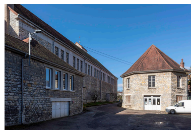
De gauche à droite : sacristie, église et maison des œuvres - cinéma Villarceau.