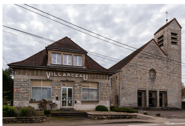
Façades nord de la maison des œuvres - cinéma Villarceau et de l'église Saint-Joseph.