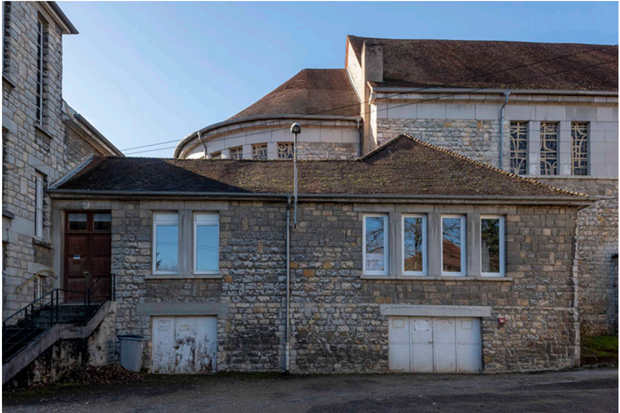
Façade de la sacristie et de la chapelle. En arrière-plan, l'église.