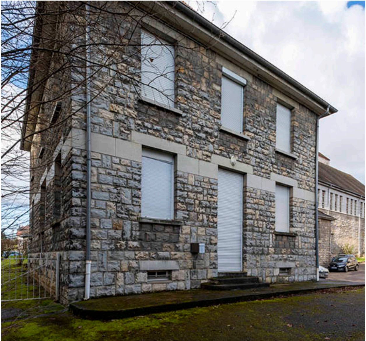
Façades sud et est du presbytère vues de trois quarts.