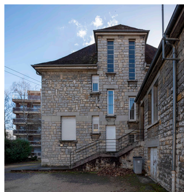
Façade nord du presbytère et bâtiment abritant la chapelle, la sacristie et la chaufferie de l'église.