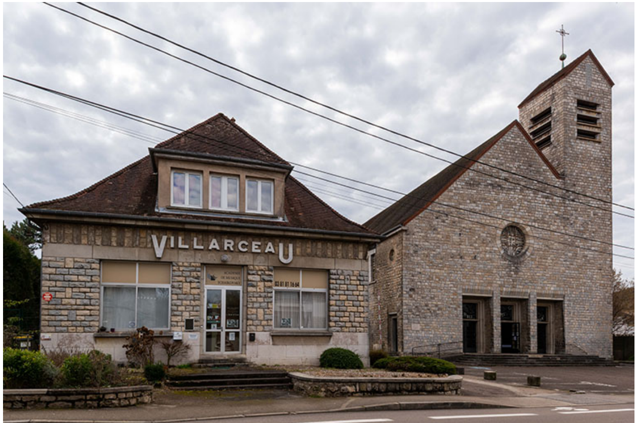
Façades nord de la maison des œuvres - cinéma Villarceau et de l'église Saint-Joseph.