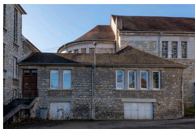
Façade de la sacristie et de la chapelle. En arrière-plan, l'église.