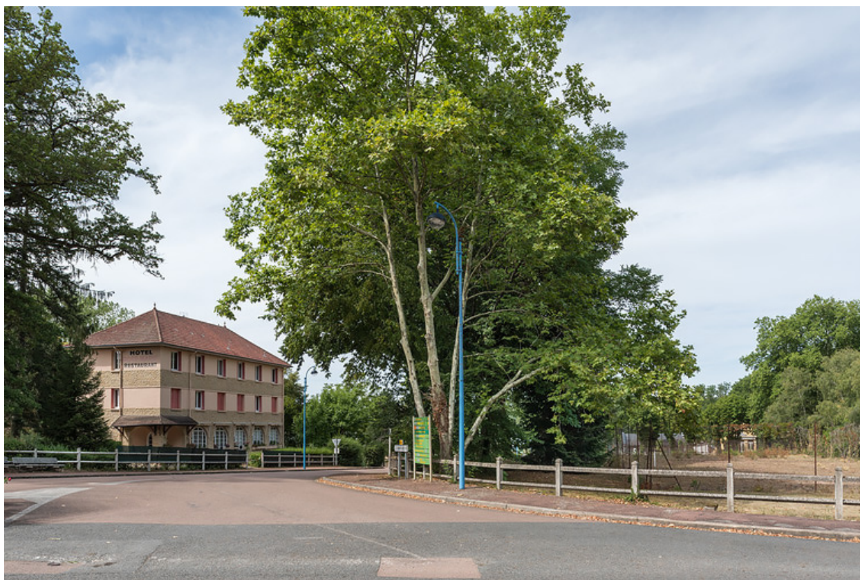
Situation des terrains au croisement de la rue Joseph Duriaux et de l'avenue du Docteur Segard.