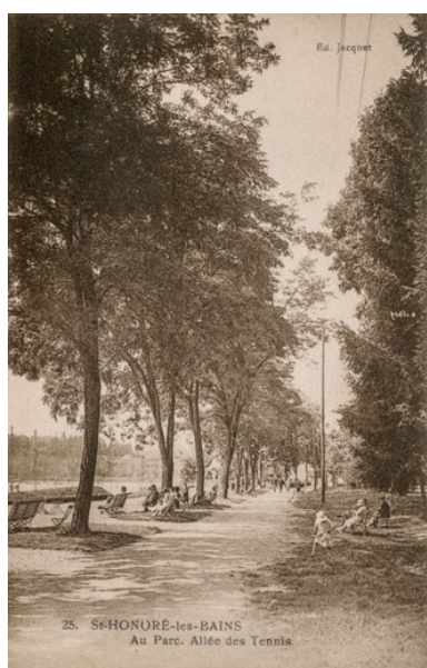
Allée des tennis dans le parc, photographie de l'Entre-deux-guerres. IVR26_20195800265NUC4A