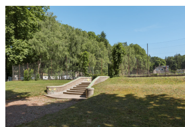
Vue des courts de tennis depuis le club-house. IVR26_20195800385NUC4A