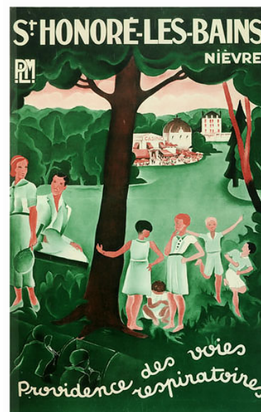
Affiche publicitaire de la Compagnie des chemins de fer de Paris à Lyon et à la Méditerranée (vers 1930). Autr. auteur inconnu IVR26_20215800078NUC2A