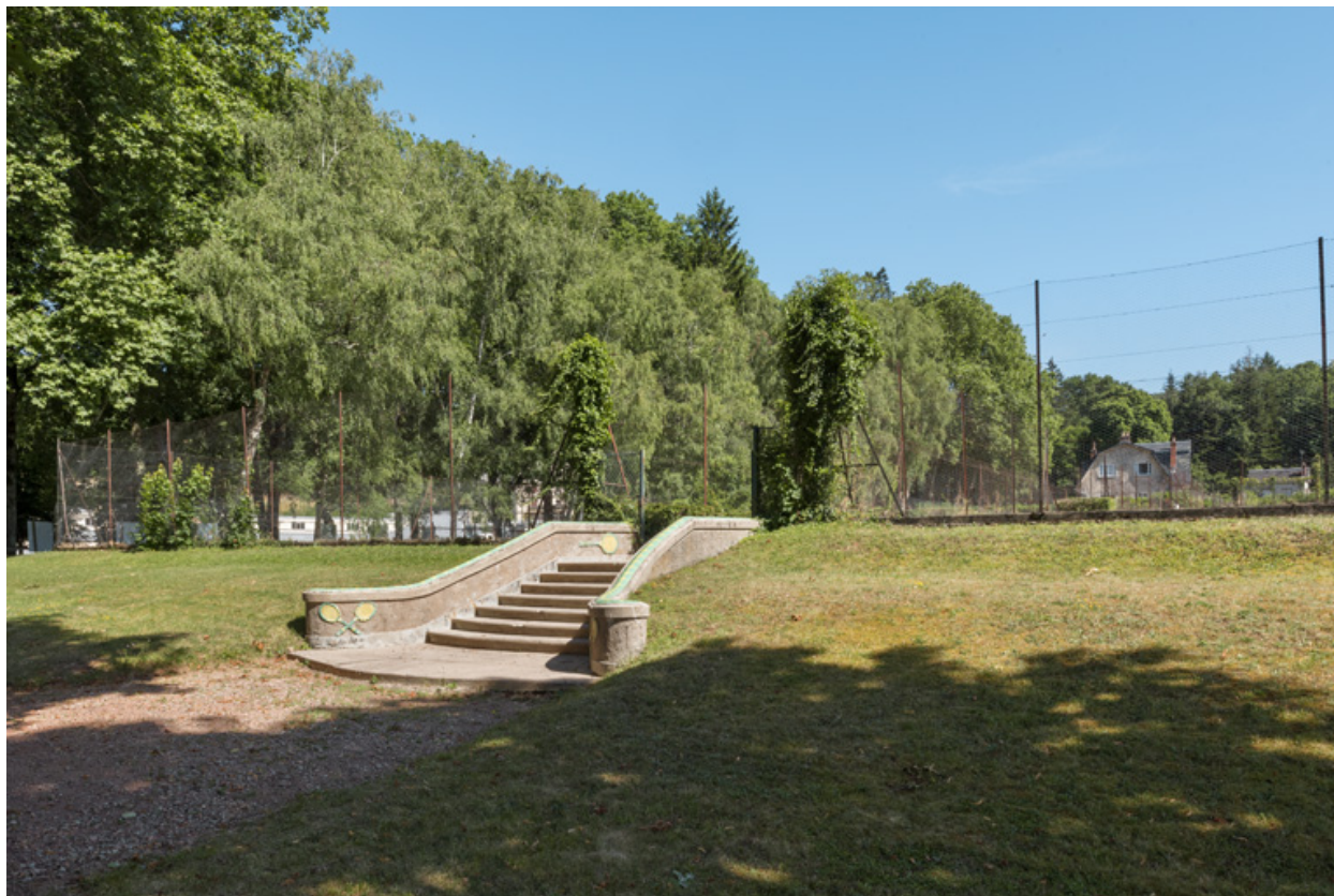
Vue des courts de tennis depuis le club-house.