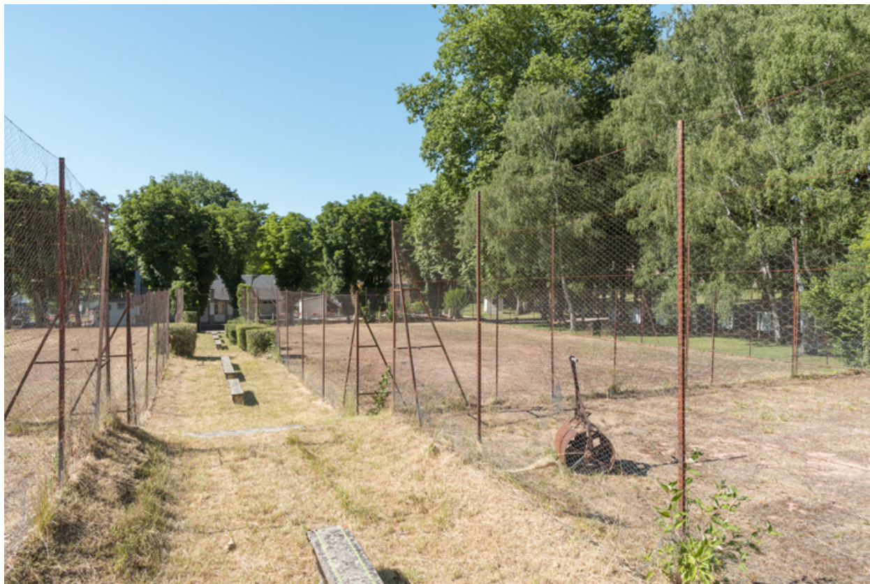
Allée centrale des courts de tennis, vue en direction du nord.