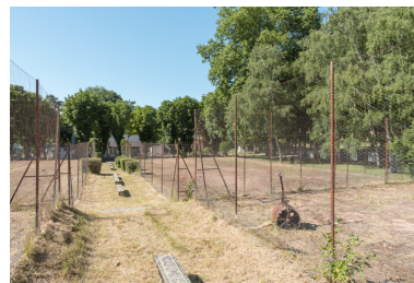
Allée centrale des courts de tennis, vue en direction du nord.