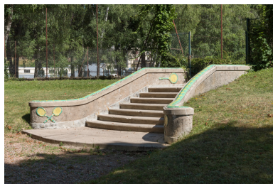
Escalier conduisant aux courts de tennis, vue de trois-quarts. IVR26_20195800386NUC4A