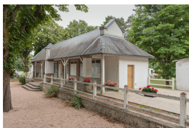
Club-house, vue d'ensemble. IVR26_20195800418NUC4A