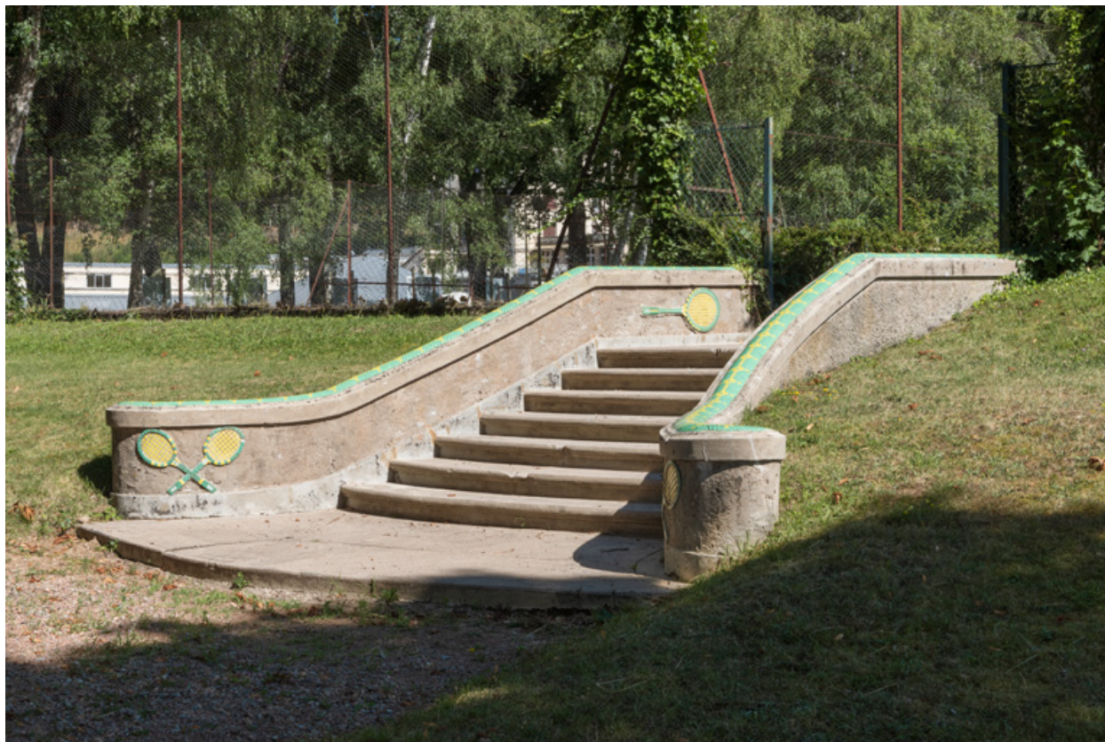
Escalier conduisant aux courts de tennis, vue de trois-quarts.