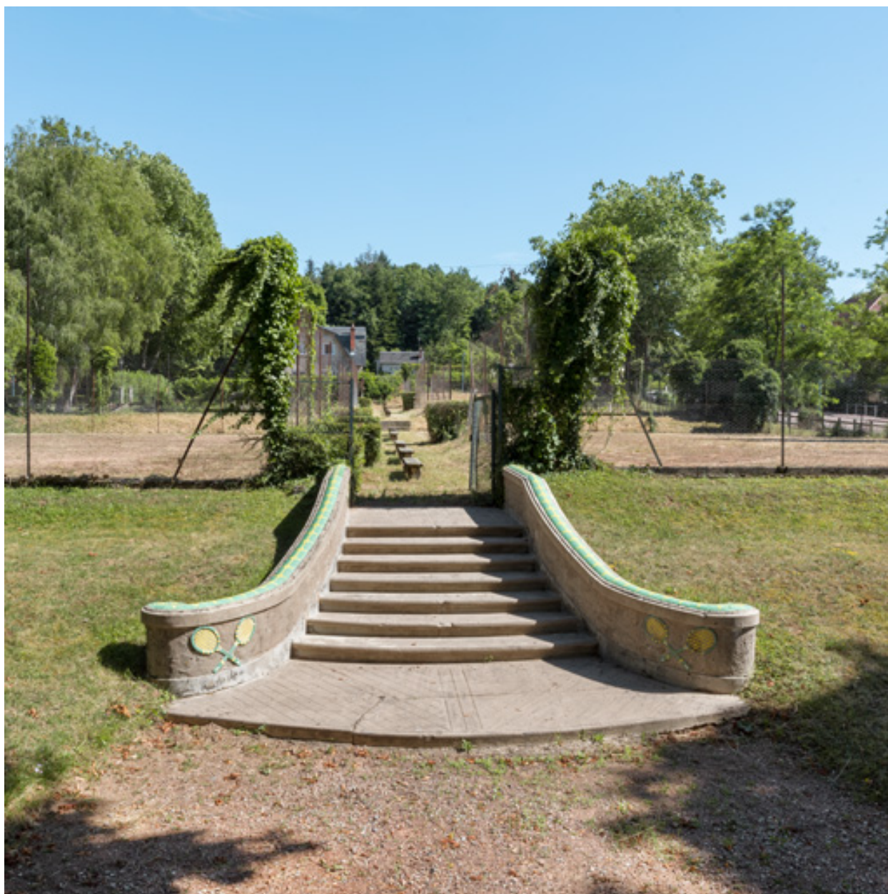
Escalier conduisant aux courts de tennis, vue de face.