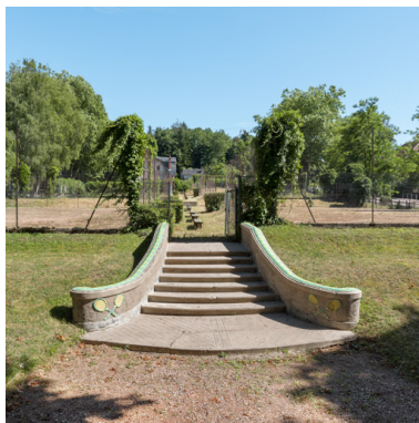
Escalier conduisant aux courts de tennis, vue de face. IVR26_20195800384NUC2A