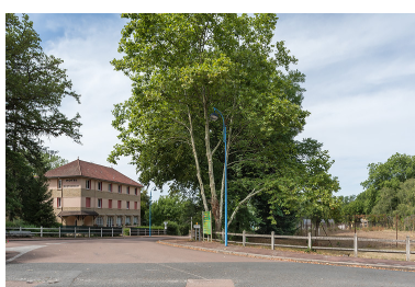
Situation des terrains au croisement de la rue Joseph Duriaux et de l'avenue du Docteur Segard. IVR26_20195800686NUC4A