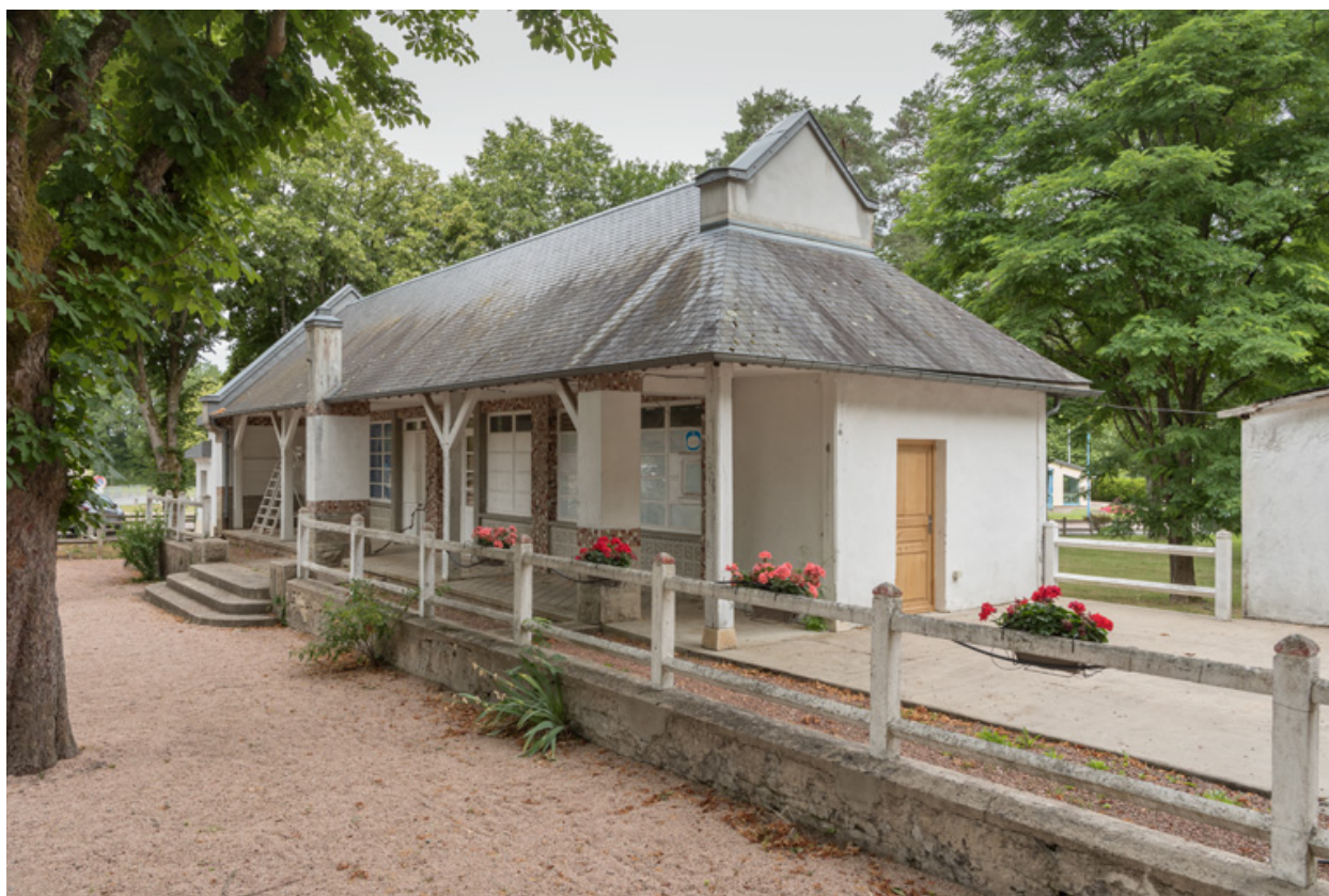
Club-house, vue d'ensemble.