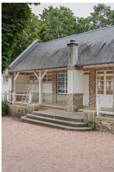
Club-house, entrée. IVR26_20195800419NUC4A