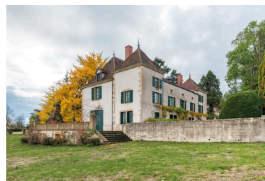
Château : vue de l'est IVR26_20187100782NUC4A