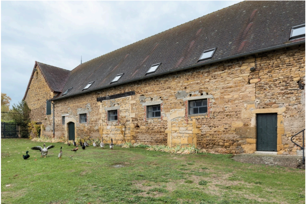
Façade antérieure de la grange, modifiée au XXe siècle