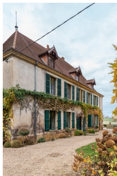
Façade postérieure du château IVR26_20187100779NUC4A