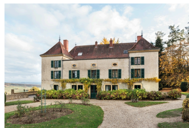
Façade antérieure du château IVR26_20187100777NUC4A