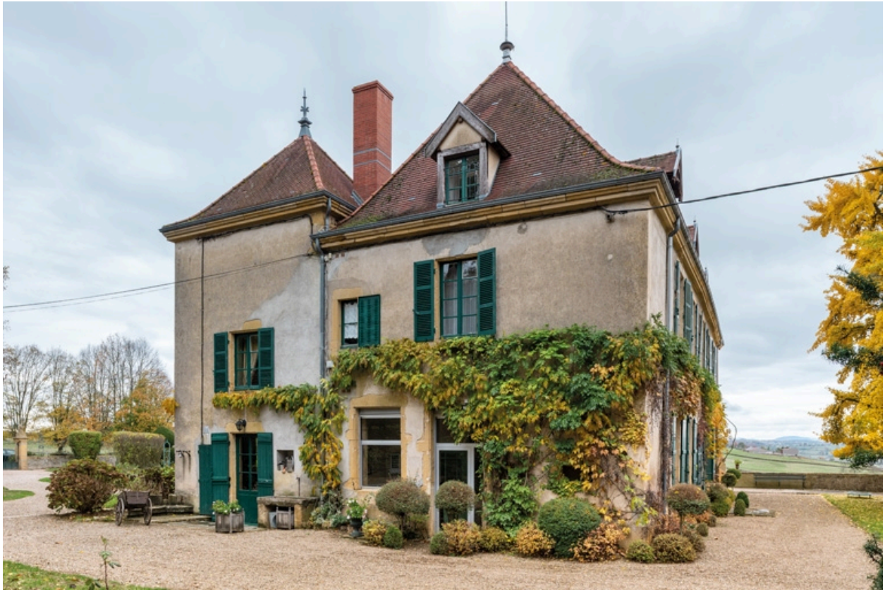
Façade latérale ouest du château