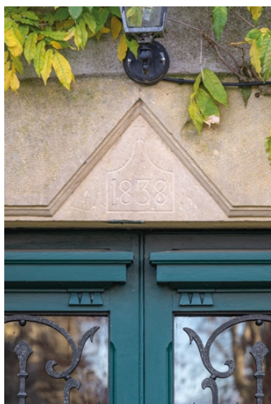
Linteau de la porte d'entrée du château avec la date de 1838 IVR26_20187100796NUC4A