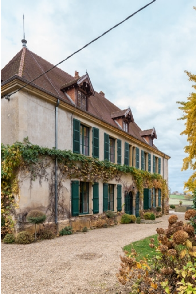
Façade postérieure du château