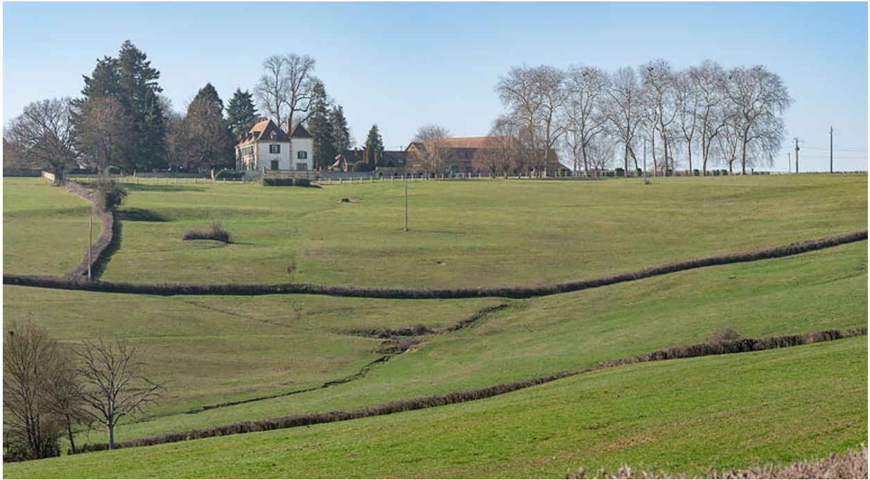
Le château et la ferme de Martigny, dans son paysage, au sommet du coteau dominant le val d'Arconce.