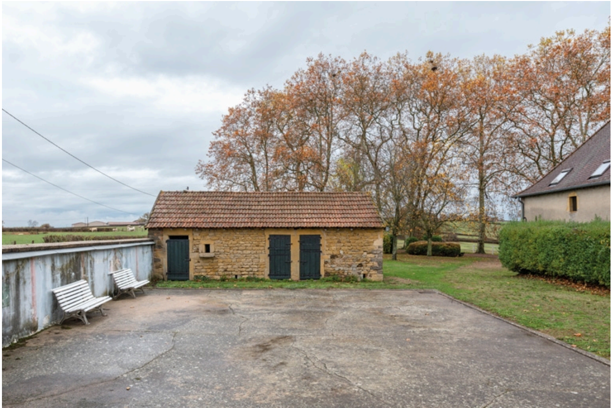
Ancien bâtiment à cochons