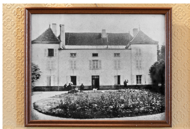
Vue de la façade antérieure du château au début du XXe siècle