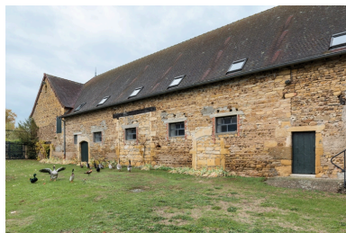
Façade antérieure de la grange, modifiée au XXe siècle IVR26_20187100790NUC4A