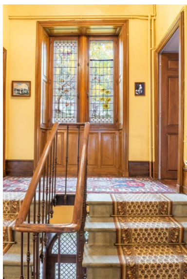
Baie dans l'escalier, ornée d'un vitrail des ateliers Bertrand de Chalon-sur-Saône IVR26_20187100799NUC4A