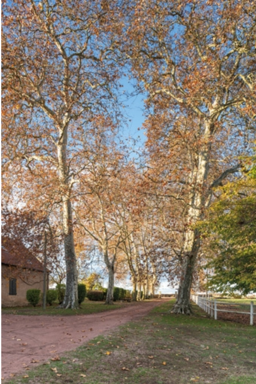
Allée devant le château