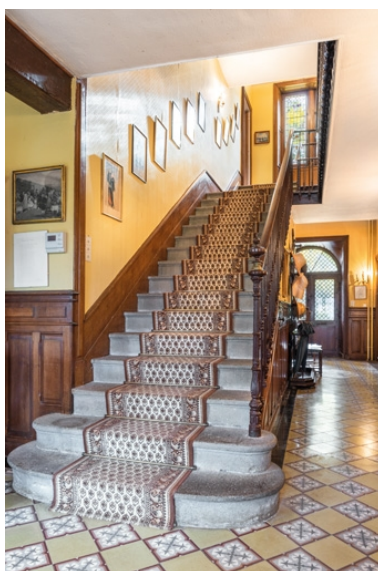
Vestibule du château IVR26_20187100797NUC4A