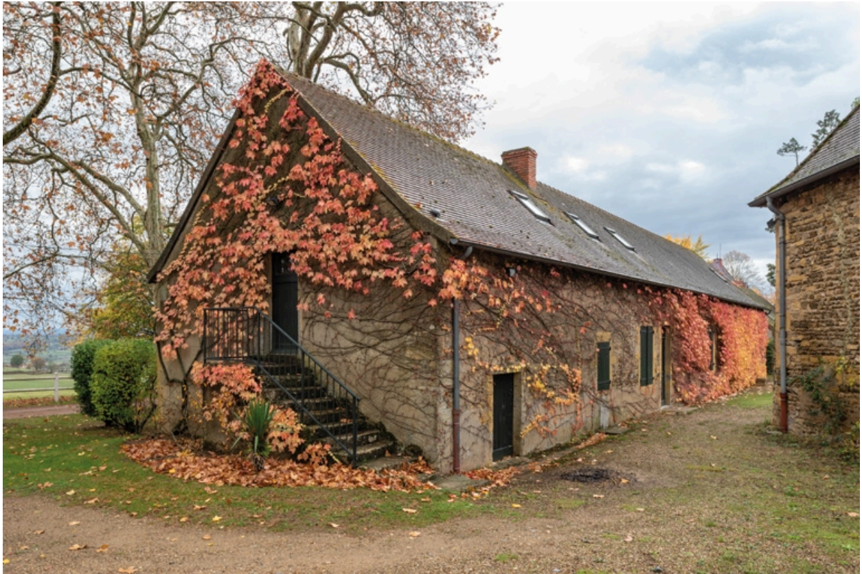
Maison du métayer (ou fermier)