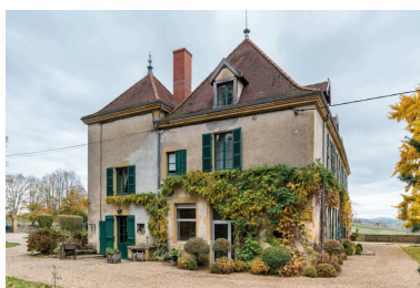
Façade latérale ouest du château IVR26_20187100778NUC4A