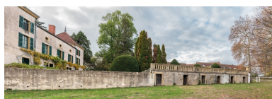
Vue du château, du mur de soutènement de la cour et des chenils IVR26_20187100783NUC4AQ