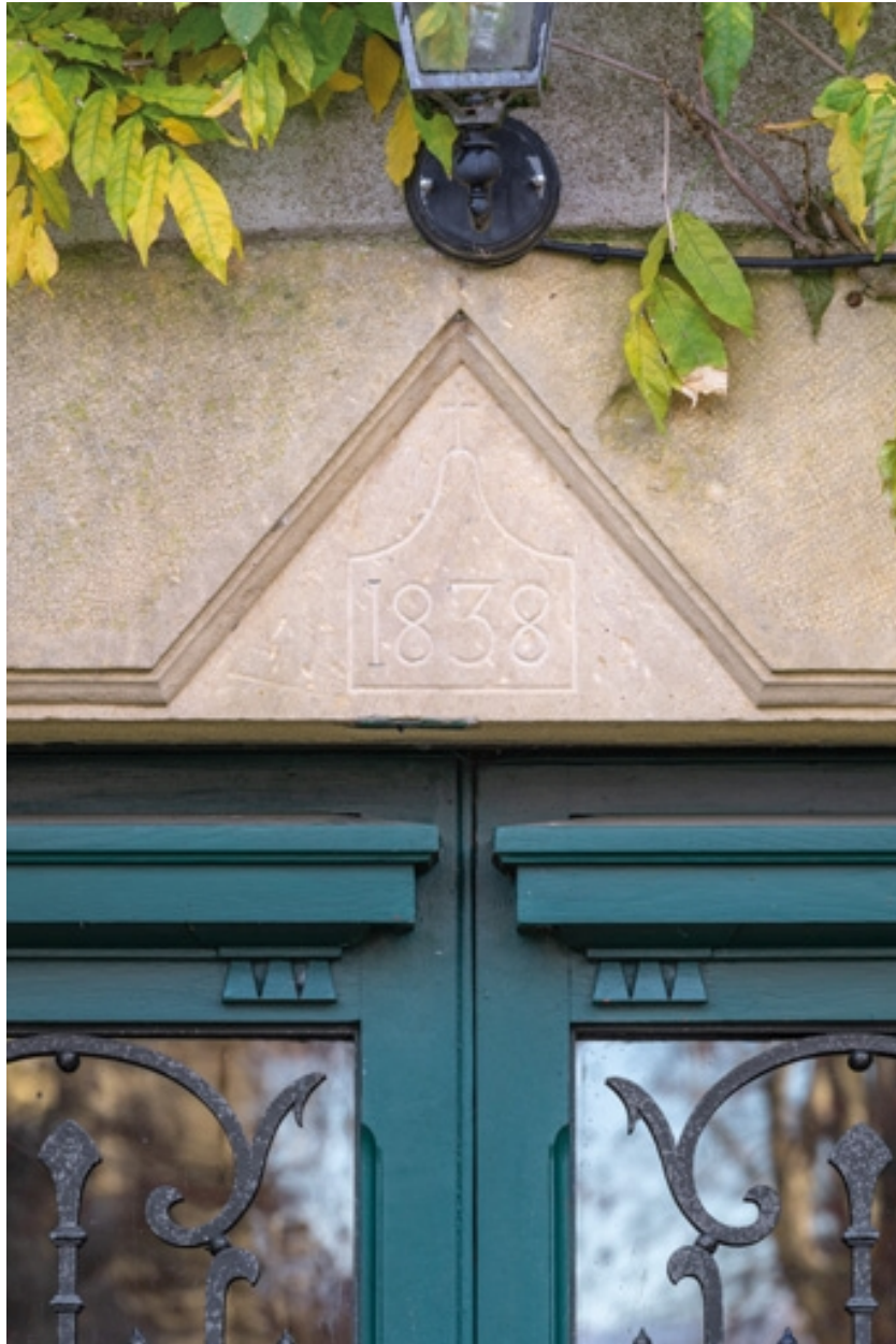
Linteau de la porte d'entrée du château avec la date de 1838