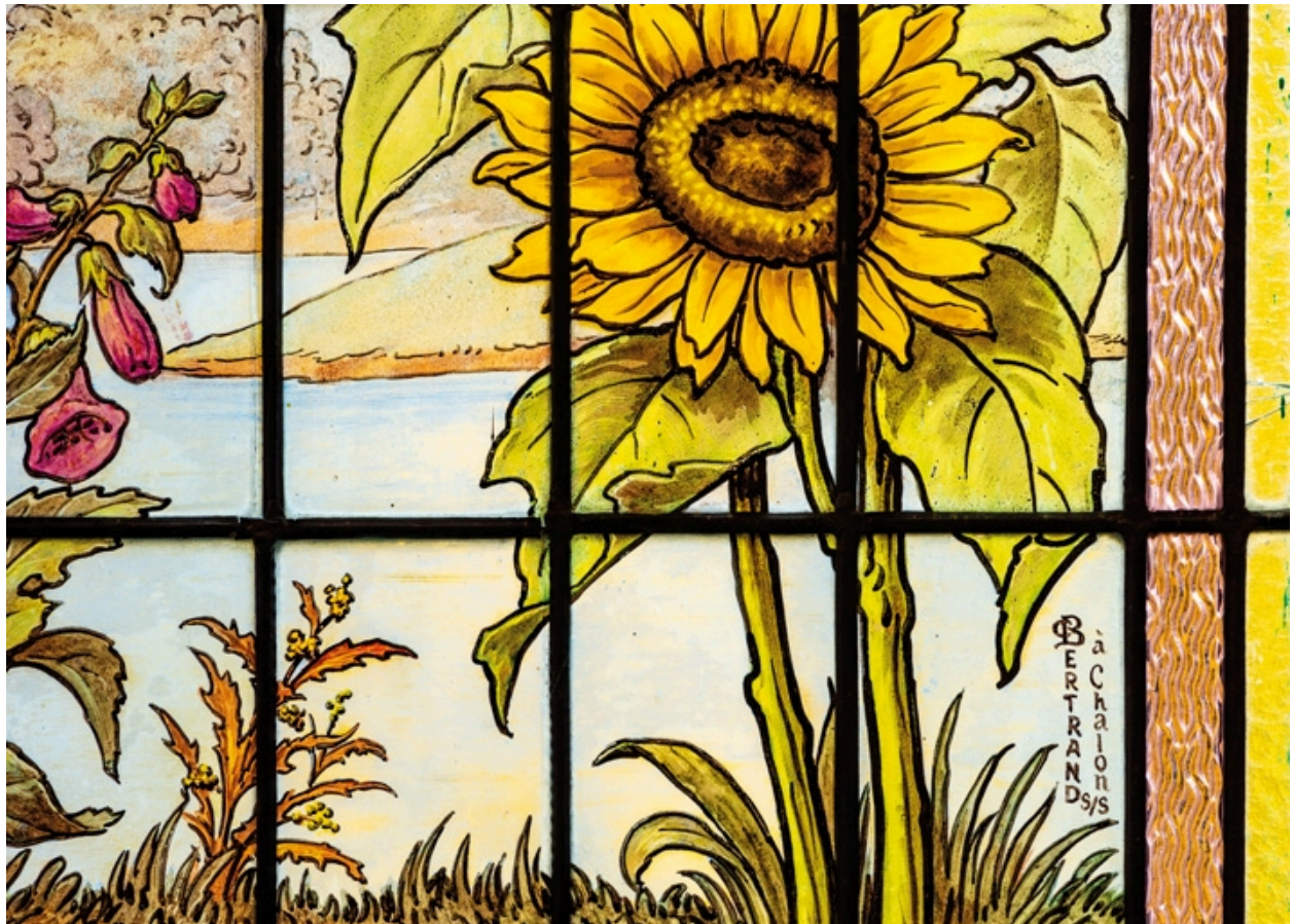
Détail du vitrail dans l'escalier