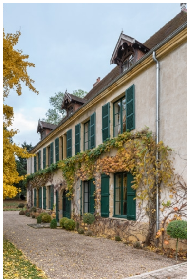
Façade antérieure du château IVR26_20187100780NUC4A