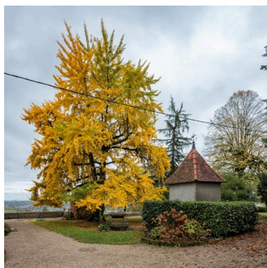
Ginkgo Biloba dans le parc IVR26_20187100793NUC2A