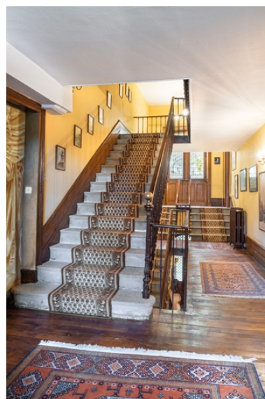
Escalier principal du château