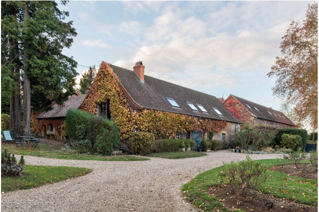
Vue des dépendances dont le bâtiment abritant l'ancien fournil au premier plan