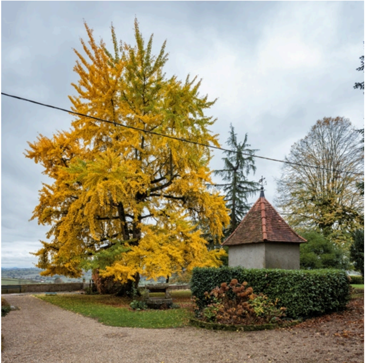
Ginkgo Biloba dans le parc