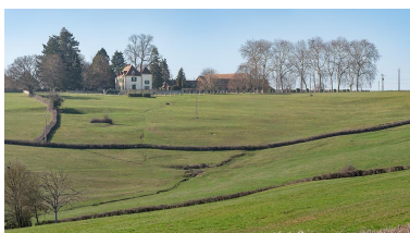
Le château et la ferme de Martigny, dans son paysage, au sommet du coteau dominant le val d'Arconce.