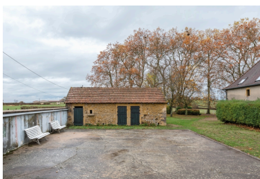
Ancien bâtiment à cochons IVR26_20187100787NUC4A