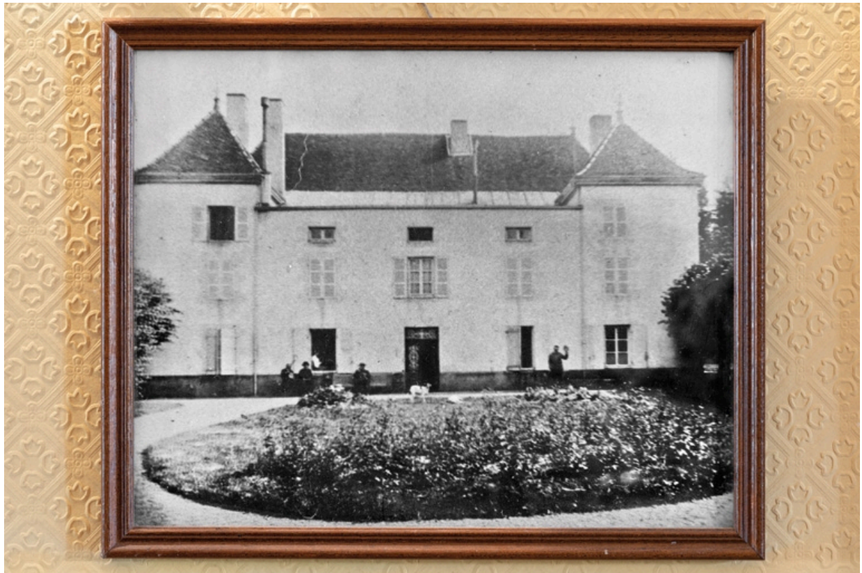
Vue de la façade antérieure du château au début du XXe siècle