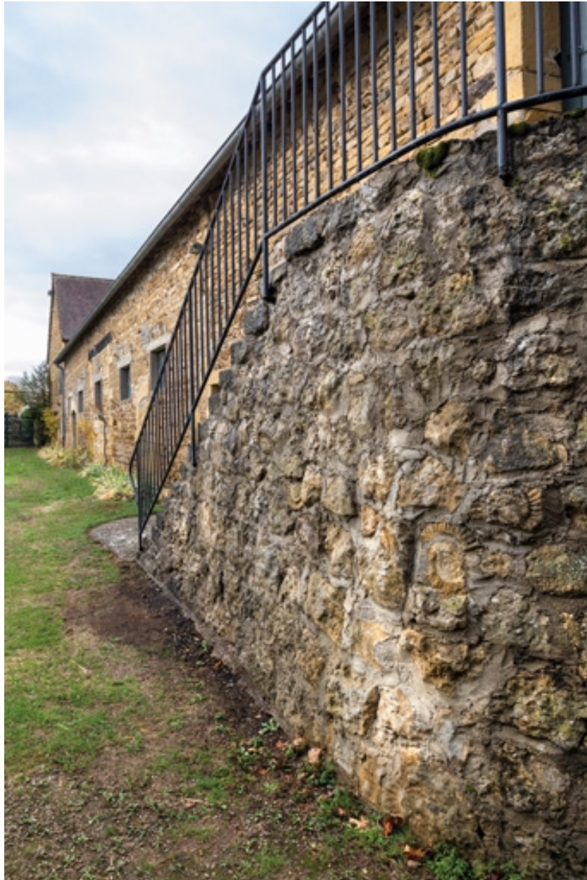
Vue de la grange et de l'escalier, à l'extrémité nord du bâtiment, dont la maçonnerie présente des fossiles