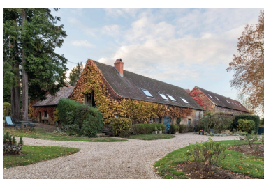
Vue des dépendances dont le bâtiment abritant l'ancien fournil au premier plan IVR26_20187100784NUC4A