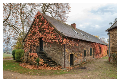
Maison du métayer (ou fermier) IVR26_20187100789NUC4A