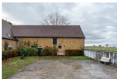
Façade du bâtiment perpendiculaire à la grange (abritant à l'origine des étables et aujourd'hui un petit théâtre)