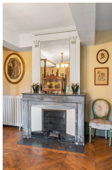
Cheminée dans une des chambres du château IVR26_20187100801NUC4A