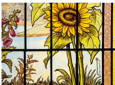
Détail du vitrail dans l'escalier IVR26_20187100800NUC4A