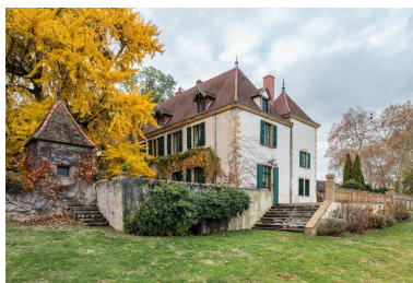
Château : vue de l'est IVR26_20187100781NUC4A