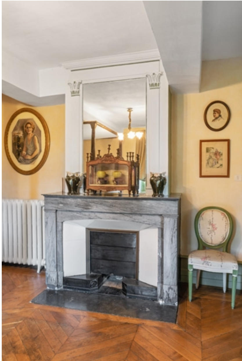
Cheminée dans une des chambres du château