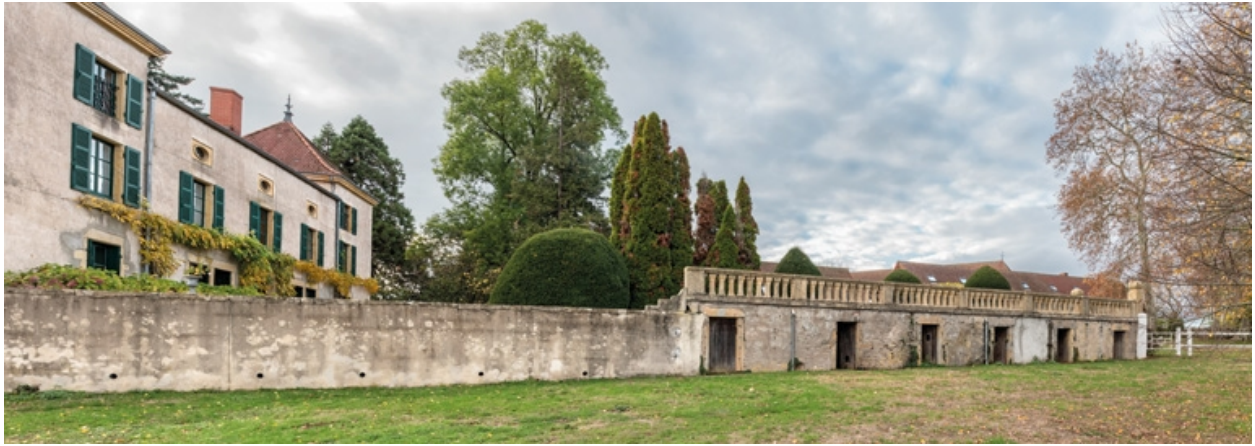
Vue du château, du mur de soutènement de la cour et des chenils