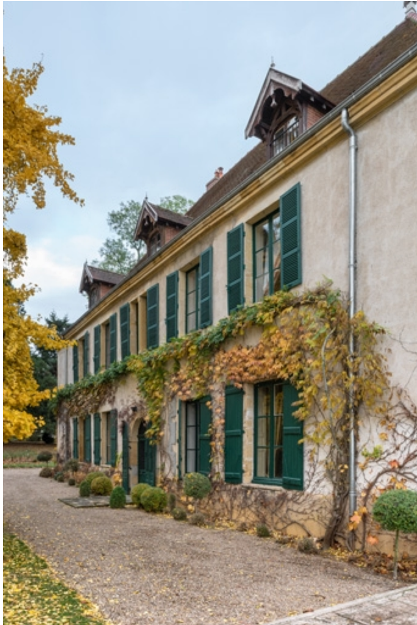
Façade antérieure du château