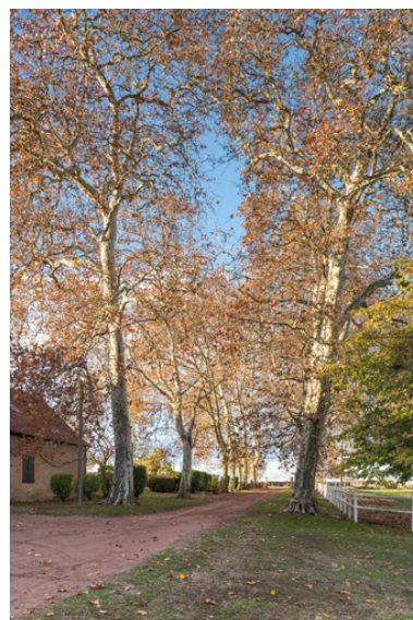
Allée devant le château IVR26_20187100794NUC4A