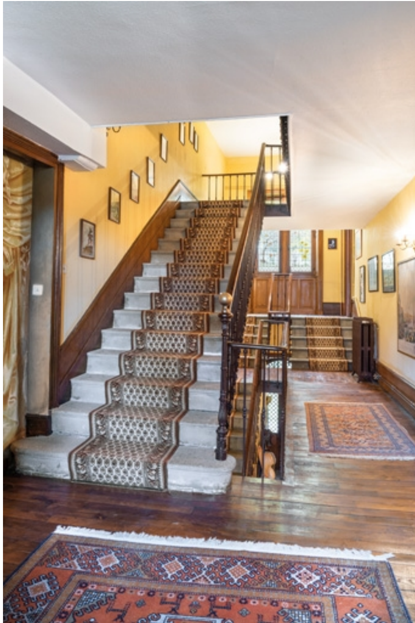
Escalier principal du château