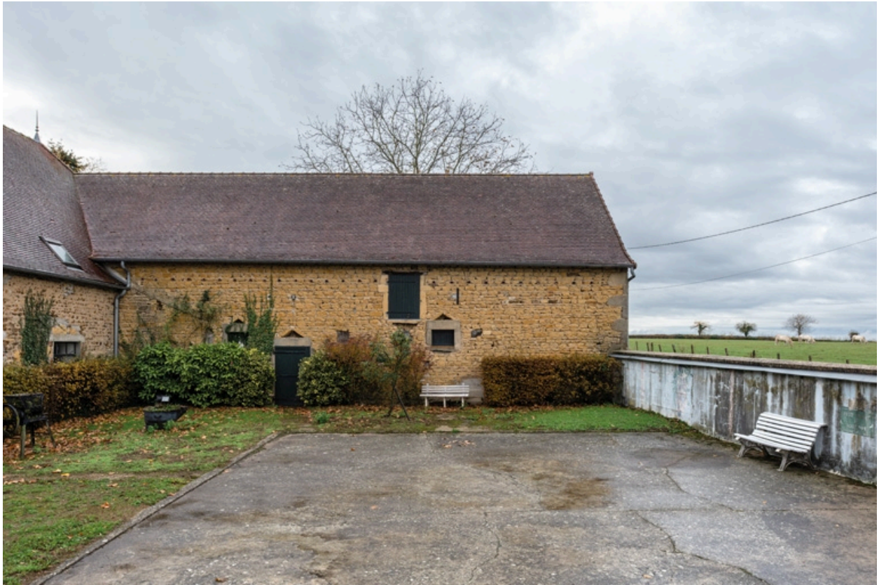
Façade du bâtiment perpendiculaire à la grange (abritant à l'origine des étables et aujourd'hui un petit théâtre)