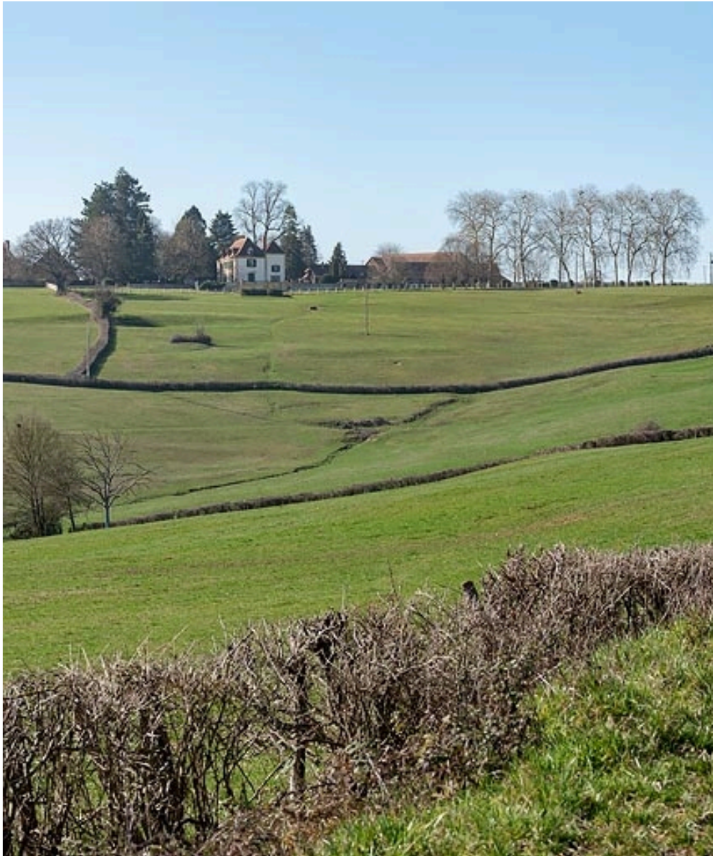
Le château et la ferme de Martigny, dans son paysage, au sommet du coteau dominant le val d'Arconce.