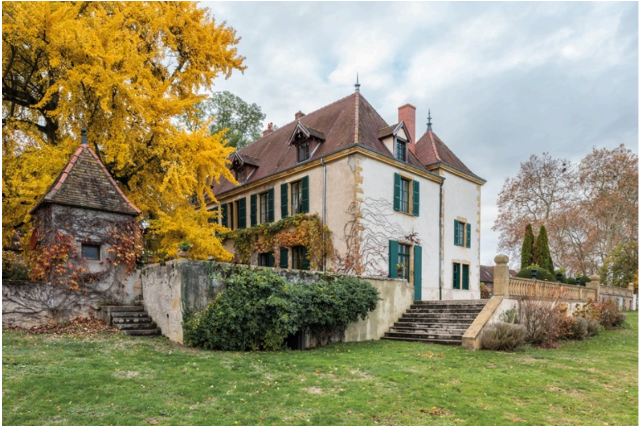
Château : vue de l'est