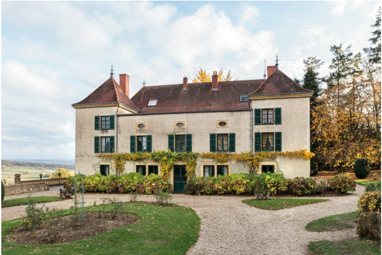
Façade antérieure du château