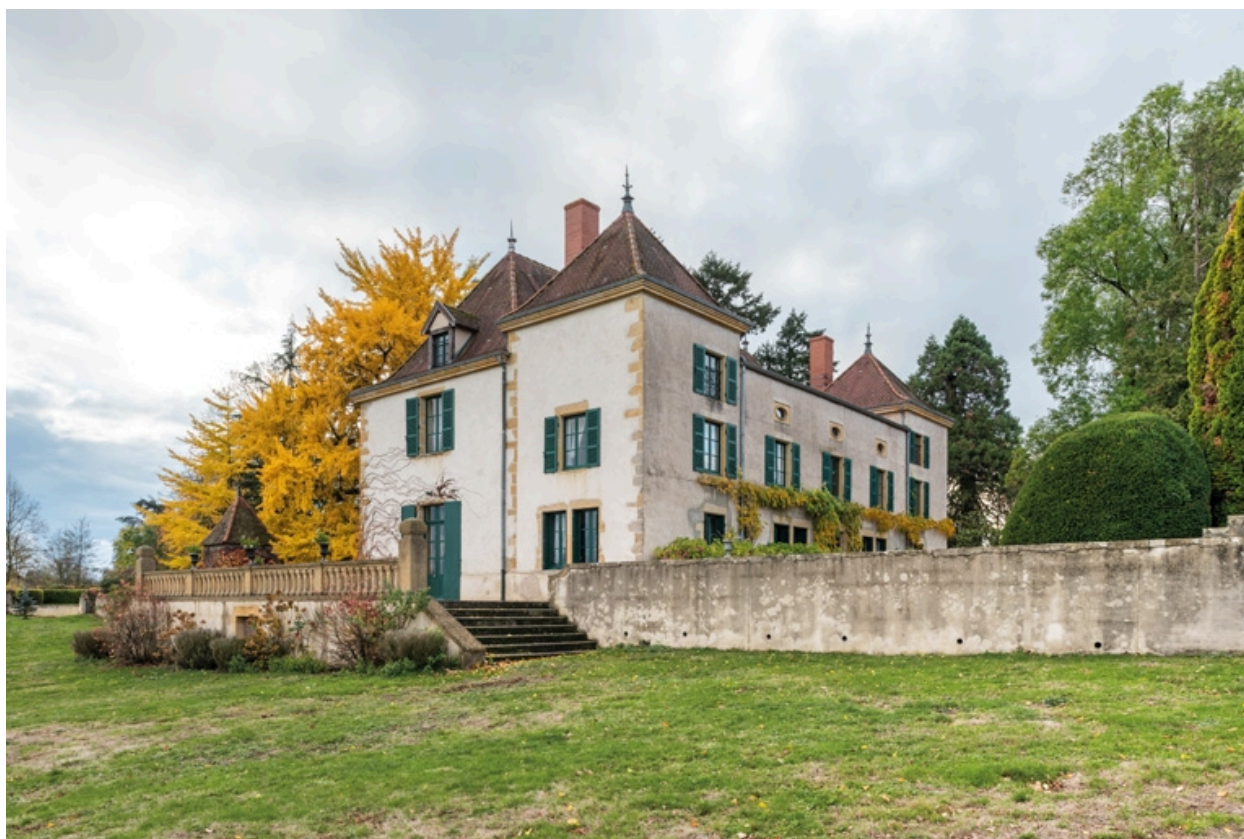
Château : vue de l'est