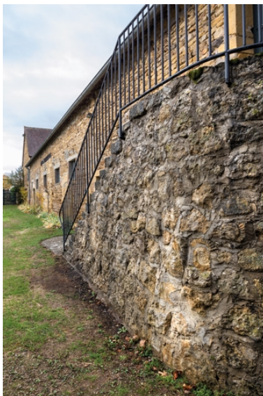
Vue de la grange et de l'escalier, à l'extrémité nord du bâtiment, dont la maçonnerie présente des fossiles