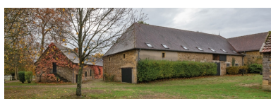
Vue d'ensemble des dépendances et bâtiments de ferme