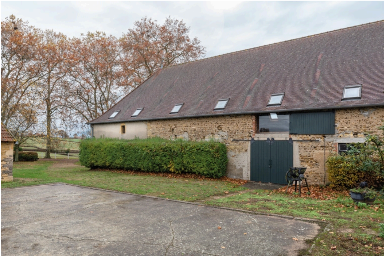
Façade antérieure de la grange