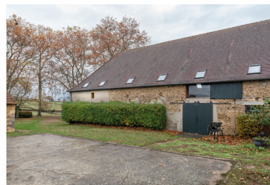
Façade antérieure de la grange IVR26_20187100788NUC4A