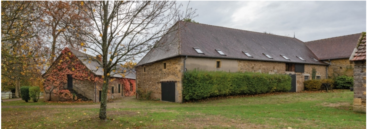
Vue d'ensemble des dépendances et bâtiments de ferme