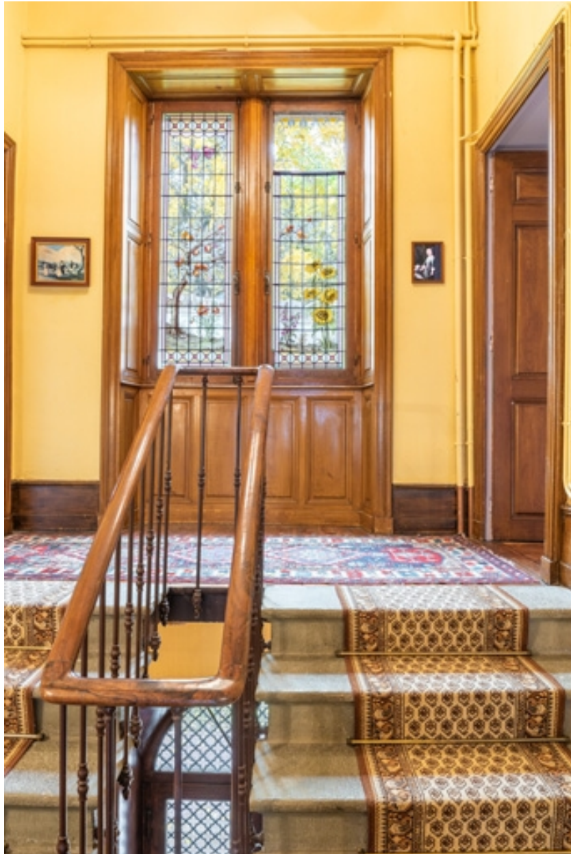
Baie dans l'escalier, ornée d'un vitrail des ateliers Bertrand de Chalon-sur-Saône