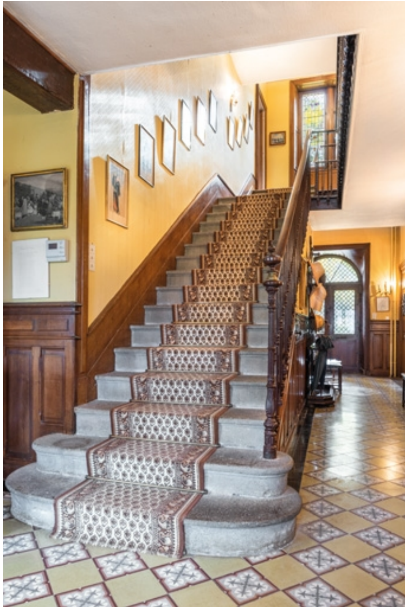
Vestibule du château