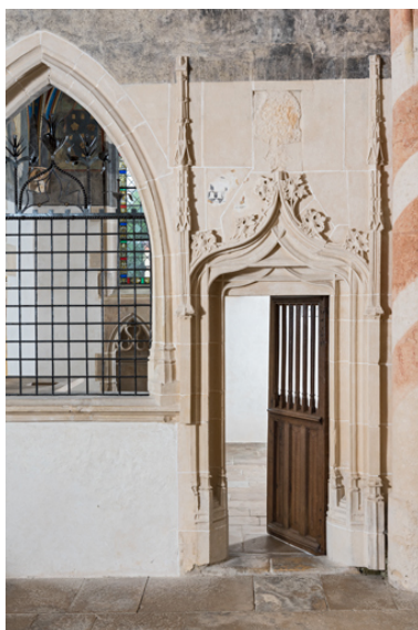
Porte de la chapelle de Lugny.