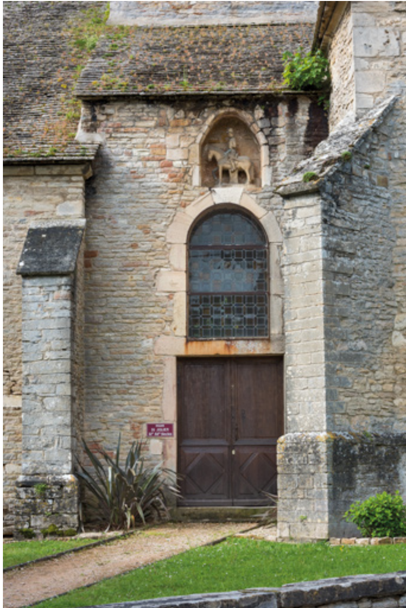
Porte nord surmontée d'une baie et d'une niche abritant une statue équestre.