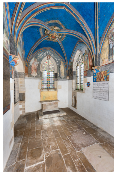
Chapelle de Lugny (vue intérieure en direction du sud-est). IVR26_20237100162NUC4A