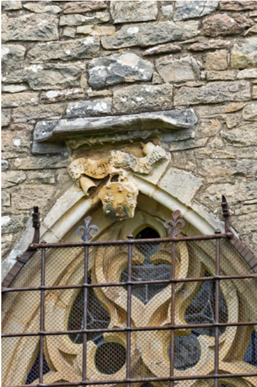
Baie de la chapelle de Lugny, détail de l'encadrement sculpté : écu aux armes de la famille de Lugny surmonté d'un phylactère (inscription non lue).