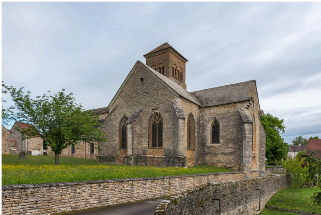
Flanc sud, avec la chapelle de Lugny et le chœur (vue depuis le sud).