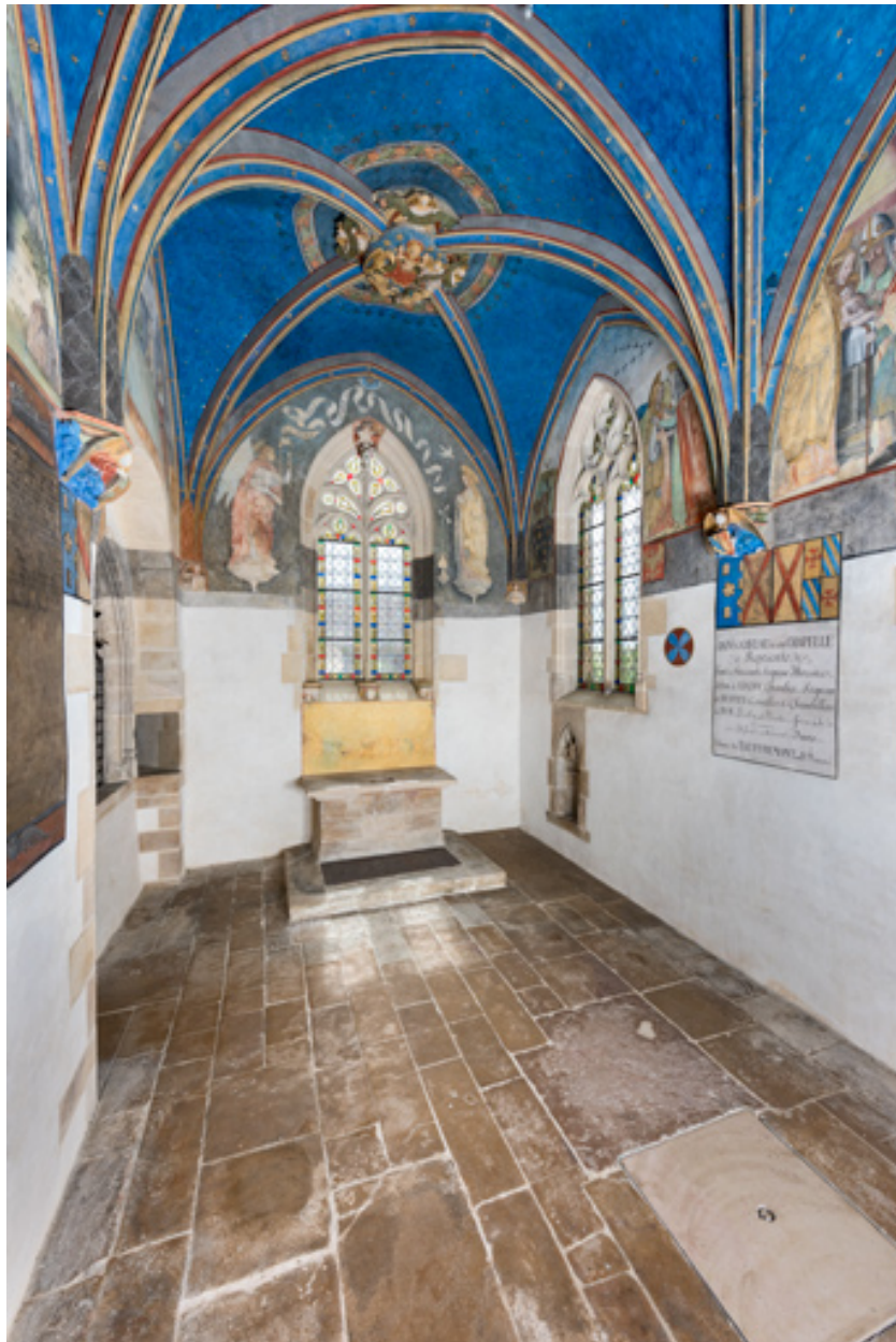
Chapelle de Lugny (vue intérieure en direction du sud-est).