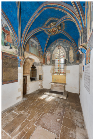
Chapelle de Lugny (vue intérieure en direction de l'est). IVR26_20237100165NUC4A