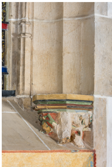
Embrasure de la baie au-dessus de l'autel de la chapelle de Lugny, détail : culot à décor de feuillage. IVR26_20237100172NUC4A