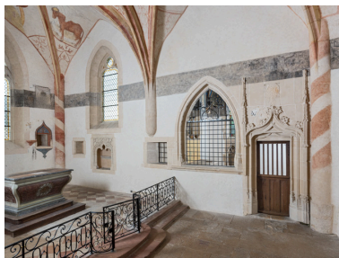
Chœur avec le maître-autel et la chapelle de Lugny (vue en direction du sud, porte fermée). IVR26_20237100188NUC4A