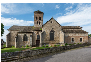
Flanc nord (vue depuis le nord). IVR26_20247100002NUC4A