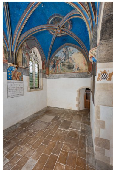
Chapelle de Lugny (vue intérieure en direction de l'ouest).