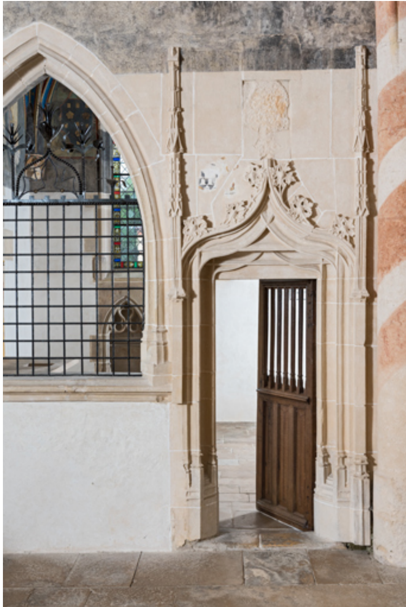
Porte de la chapelle de Lugny.