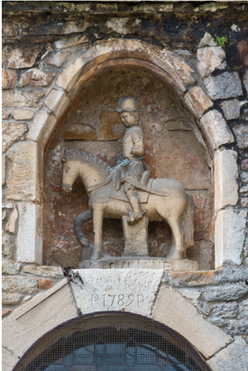
Porte nord surmontée d'une baie et d'une niche abritant une statue équestre, détail : inscription "R 1789 P".