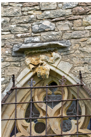
Baie de la chapelle de Lugny, détail de l'encadrement sculpté : écu aux armes de la famille de Lugny surmonté d'un phylactère (inscription non lue). IVR26_20247100008NUC4A