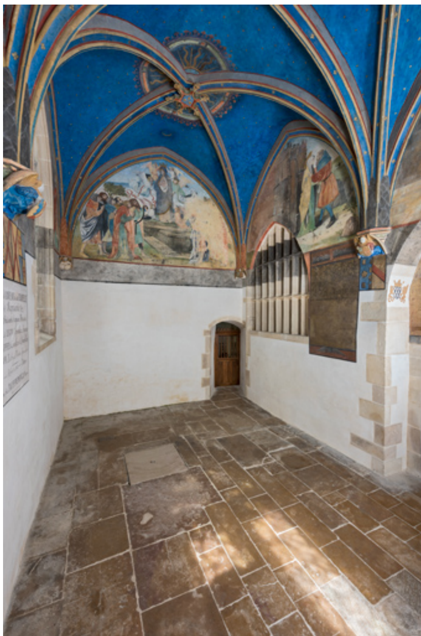
Chapelle de Lugny (vue intérieure en direction du nord-ouest).