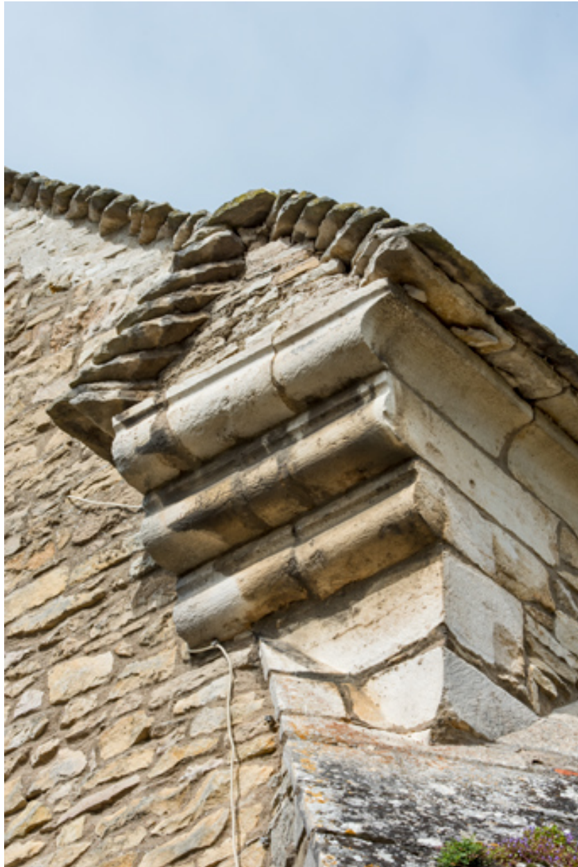
Chevet, détail : console à trois assises en ressaut.