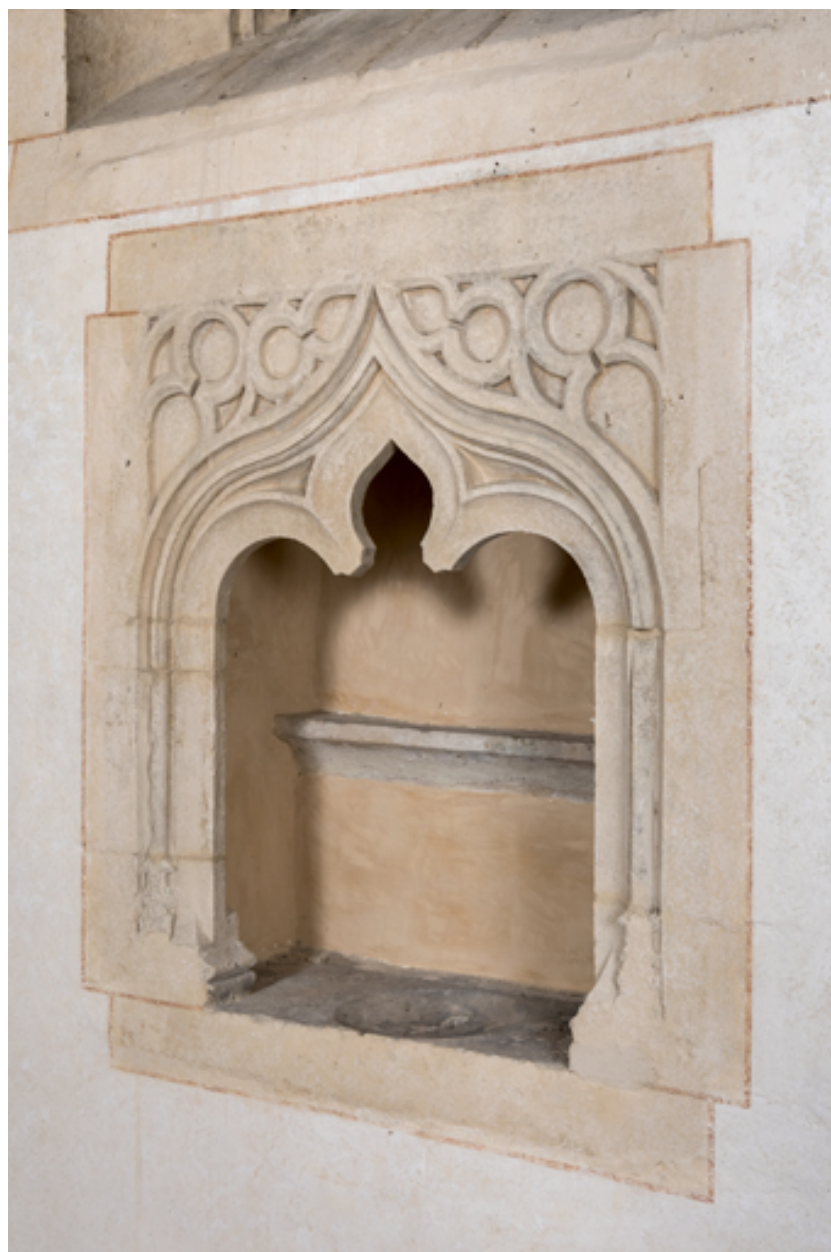
Lavabo dans le chœur.