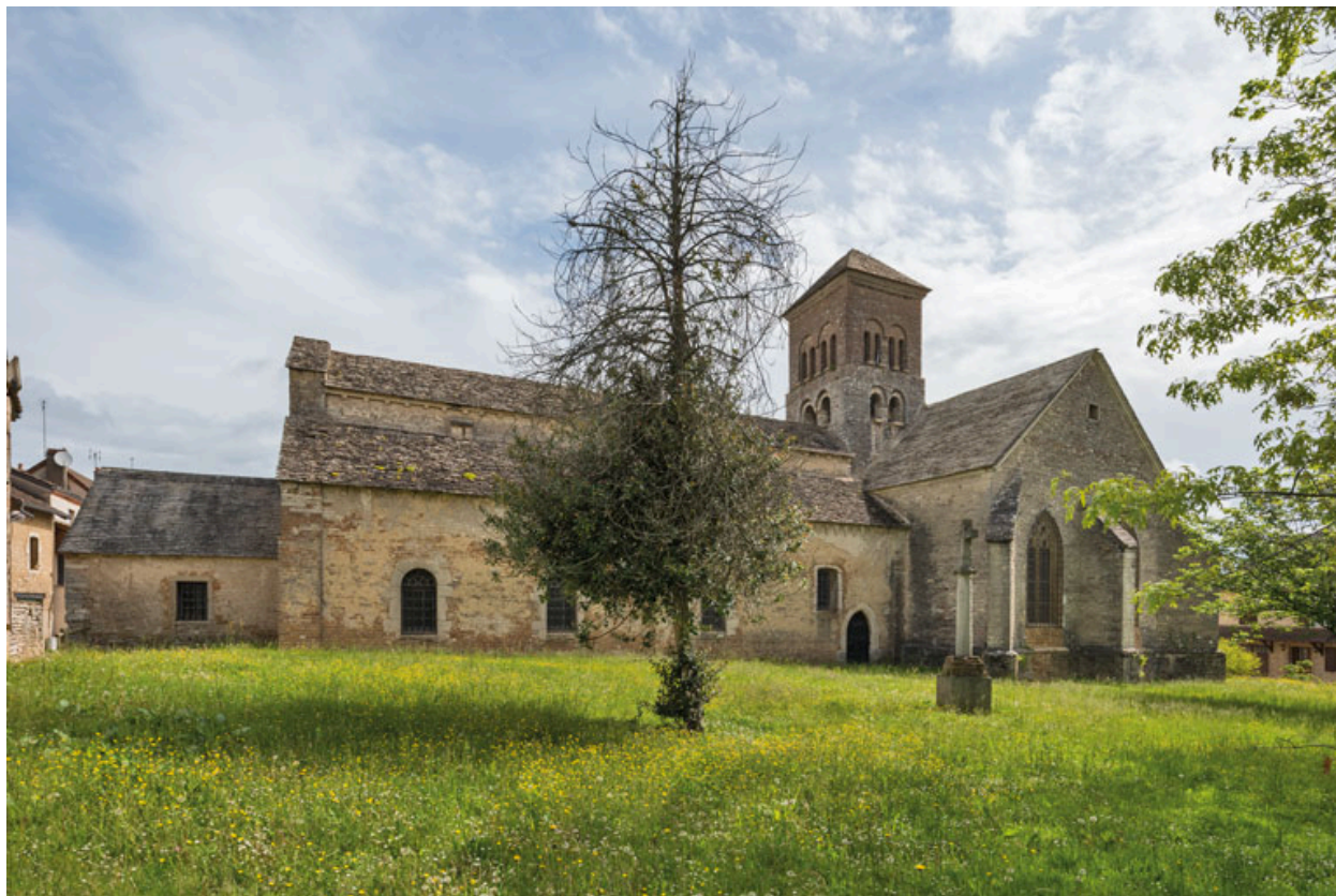
Flanc sud, avec la nef (vue depuis le sud-ouest).