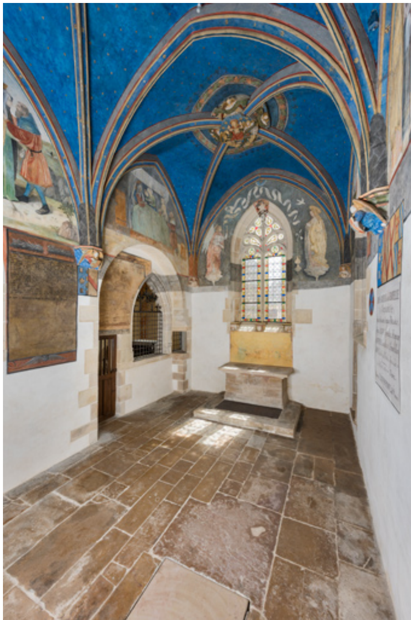
Chapelle de Lugny (vue intérieure en direction de l'est).