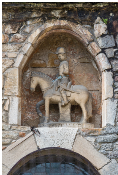
Porte nord surmontée d'une baie et d'une niche abritant une statue équestre, détail : inscription "R 1789 P".