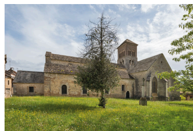
Flanc sud, avec la nef (vue depuis le sud-ouest). IVR26_20247100009NUC4A