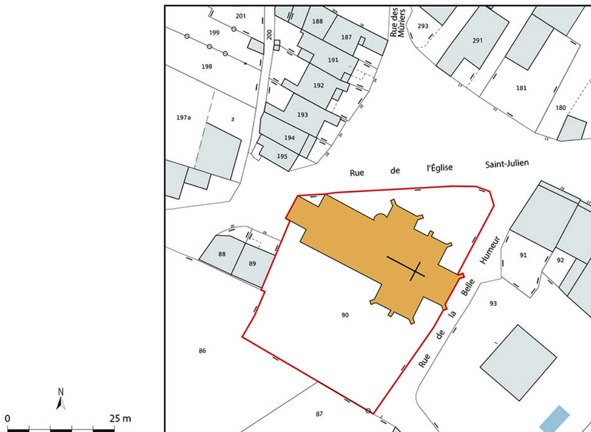
Plan-masse et de situation. Extrait du plan cadastral, 2024. Sennecey-le-Grand, section AE. Échelle 1/500.