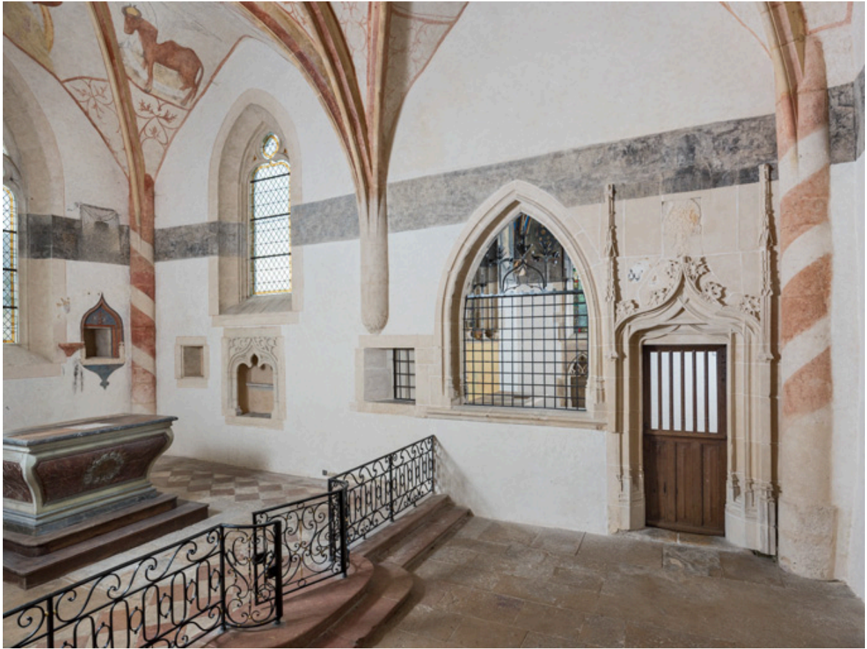
Chœur avec le maître-autel et la chapelle de Lugny (vue en direction du sud, porte fermée).