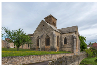
Flanc sud, avec la chapelle de Lugny et le chœur (vue depuis le sud).