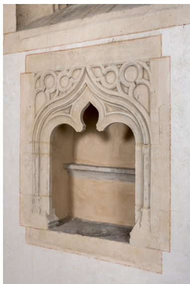
Lavabo dans le chœur.