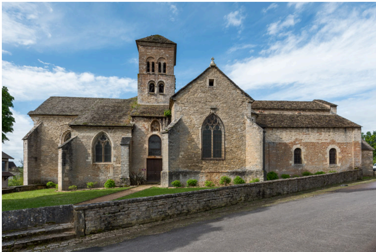
Flanc nord (vue depuis le nord).