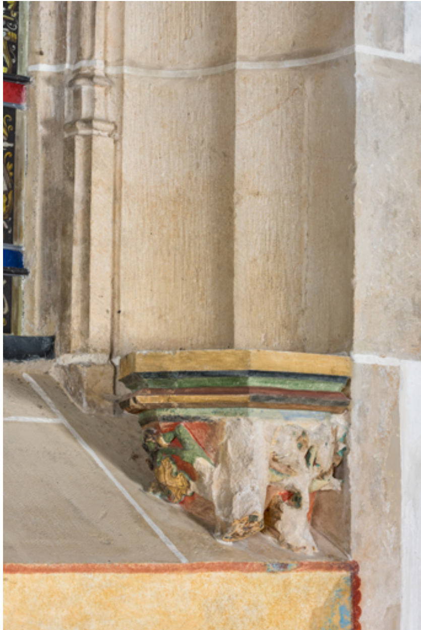
Embrasure de la baie au-dessus de l'autel de la chapelle de Lugny, détail : culot à décor de feuillage.