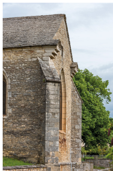
Chevet (vue depuis le sud). IVR26_20247100006NUC4A