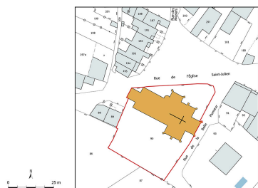
Plan-masse et de situation. Extrait du plan cadastral, 2024. Sennecey-le-Grand, section AE. Échelle 1/500. IVR26_20247100065NUDA