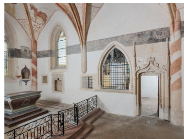
Chœur avec le maître-autel et la chapelle de Lugny (vue en direction du sud, porte fermée). IVR26_20237100189NUC4A