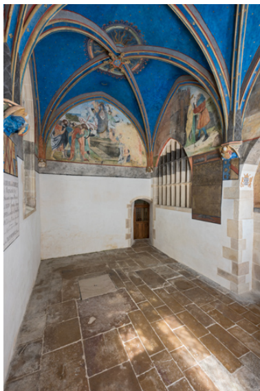
Chapelle de Lugny (vue intérieure en direction du nord-ouest). IVR26_20237100158NUC4A