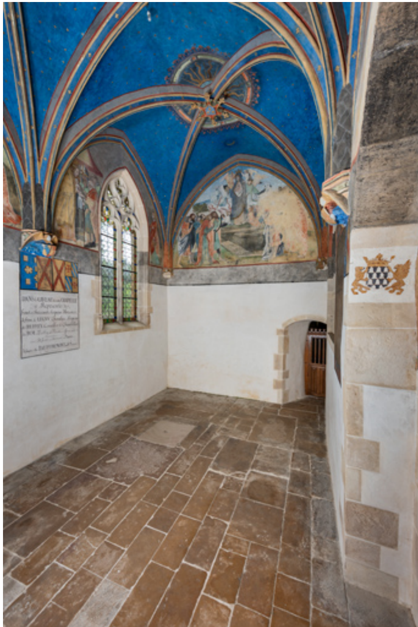
Chapelle de Lugny (vue intérieure en direction de l'ouest).