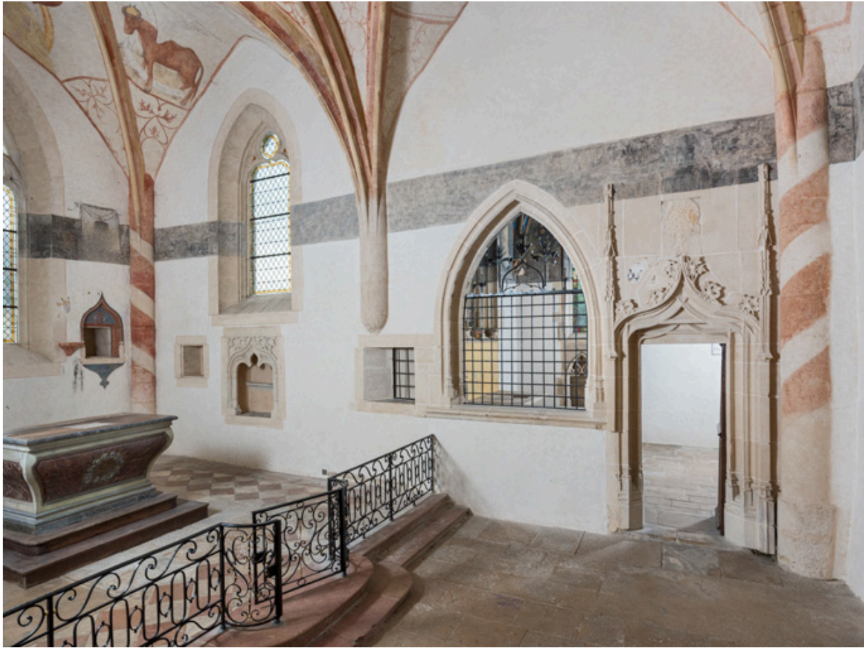
Chœur avec le maître-autel et la chapelle de Lugny (vue en direction du sud, porte fermée).