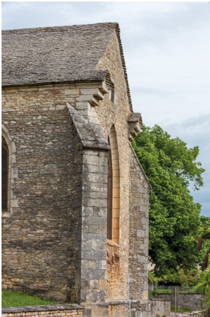
Chevet (vue depuis le sud).