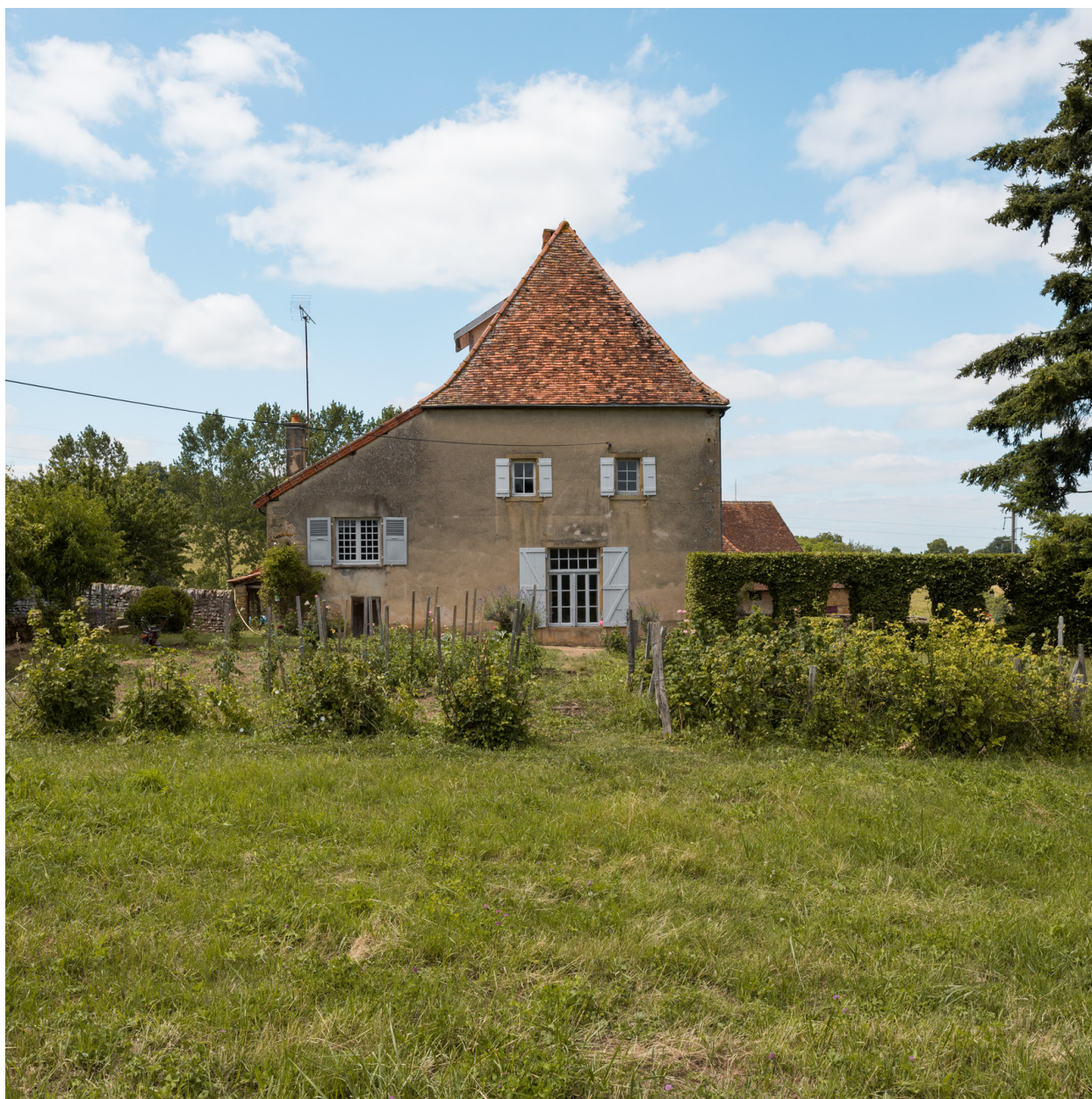
Façade sud du logement.