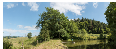
Etang. IVR26_20187100330NUC4AQ