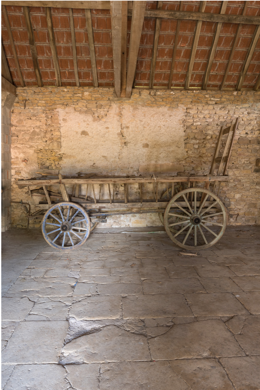
Bâtiment agricole. Char à foin.