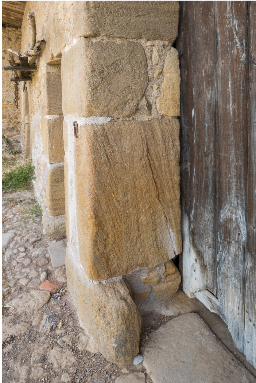
Bâtiment agricole. Piédroit de la porte de remise.