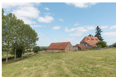
Vue d'ensemble depuis le sud-ouest. IVR26_20187100329NUC4A