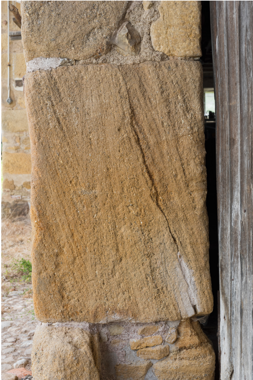
Détail du piédroit de la porte de remise.