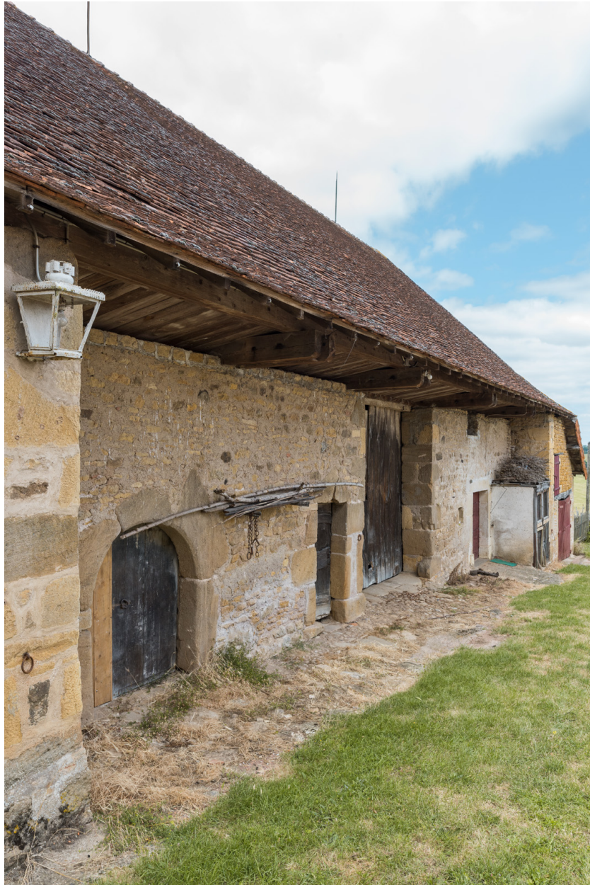
Vue de trois quarts gauche du bâtiment agricole.