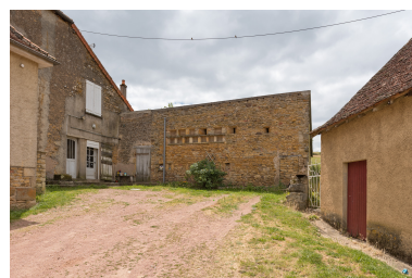
Mur d'une dépendance agricole (soue). IVR26_20187100328NUC4A