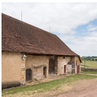
Façade antérieure du bâtiment agricole. Vue de trois quarts gauche. IVR26_20187100315NUC4A