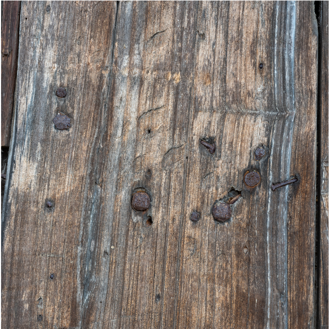
Détail du vantaux de la porte de remise.