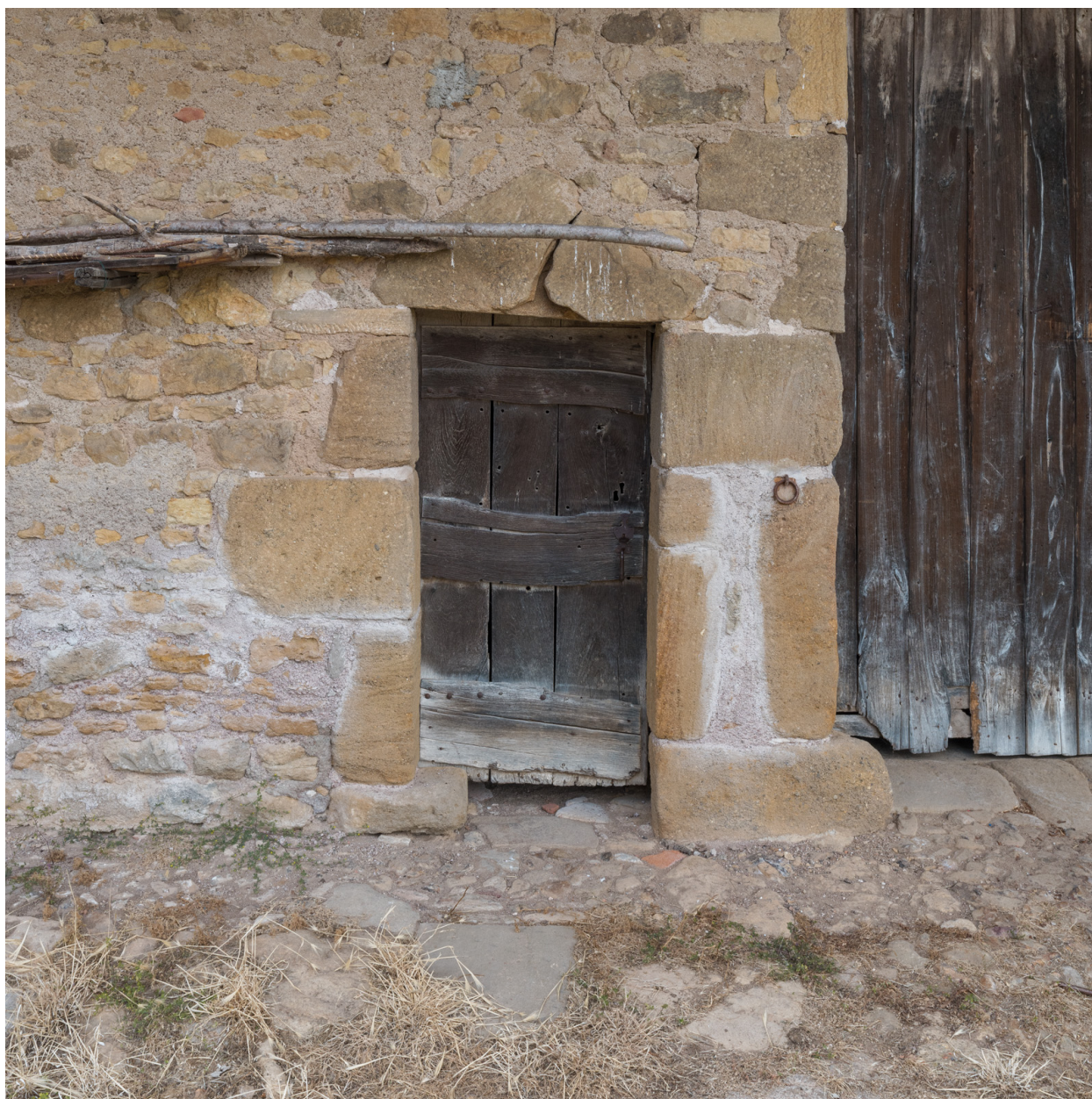
Façade antérieure du bâtiment agricole. Porte piétonne.