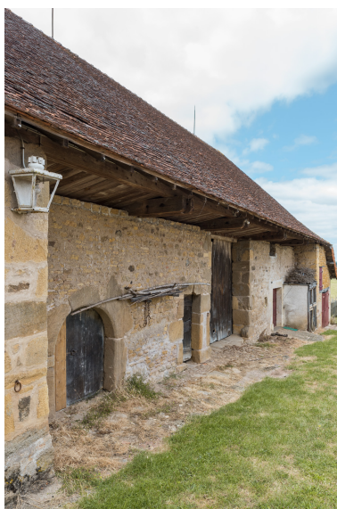
Vue de trois quarts gauche du bâtiment agricole. IVR26_20187100316NUC4A