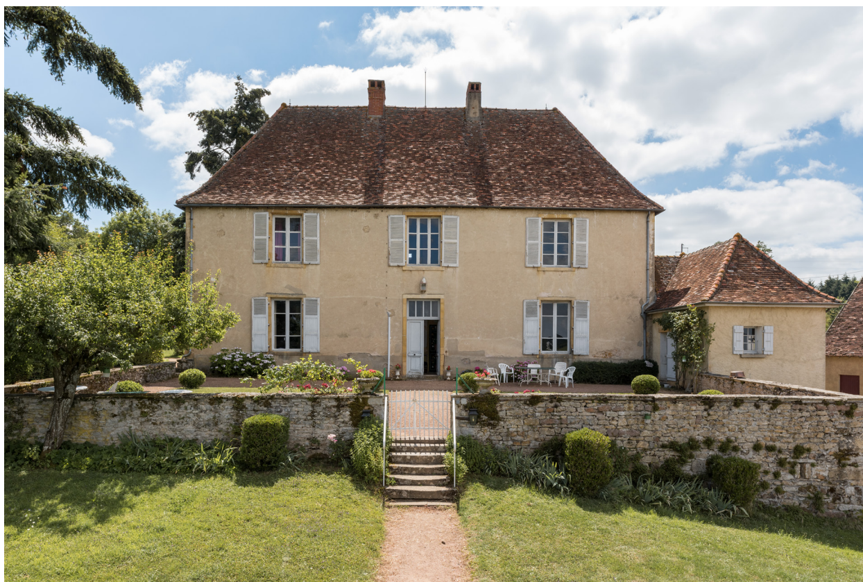
Façade antérieure du logement