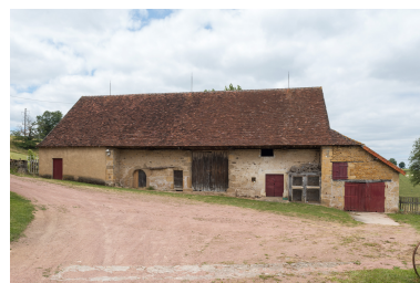
Façade antérieure du bâtiment agricole (étable, remise, fenil). IVR26_20187100314NUC4A