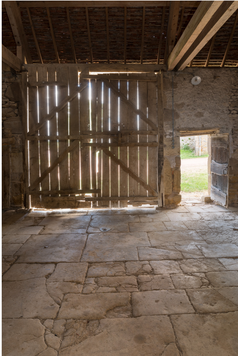
Bâtiment agricole. Vue intérieure de la remise.