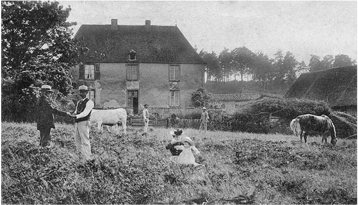
Vue de la ferme de Montgiraud au début du XXe siècle, carte postale, collection privée.