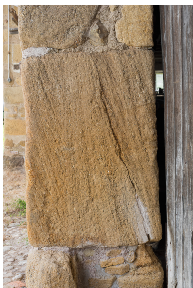
Détail du piédroit de la porte de remise. IVR26_20187100321NUC4A