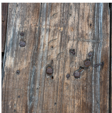
Détail du vantail de la porte de remise. IVR26_20187100322NUC4A