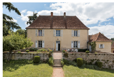
Façade antérieure du logement IVR26_20187100310NUC4A