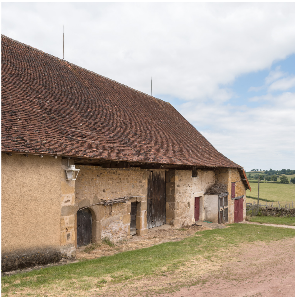
Façade antérieure du bâtiment agricole. Vue de trois quarts gauche.