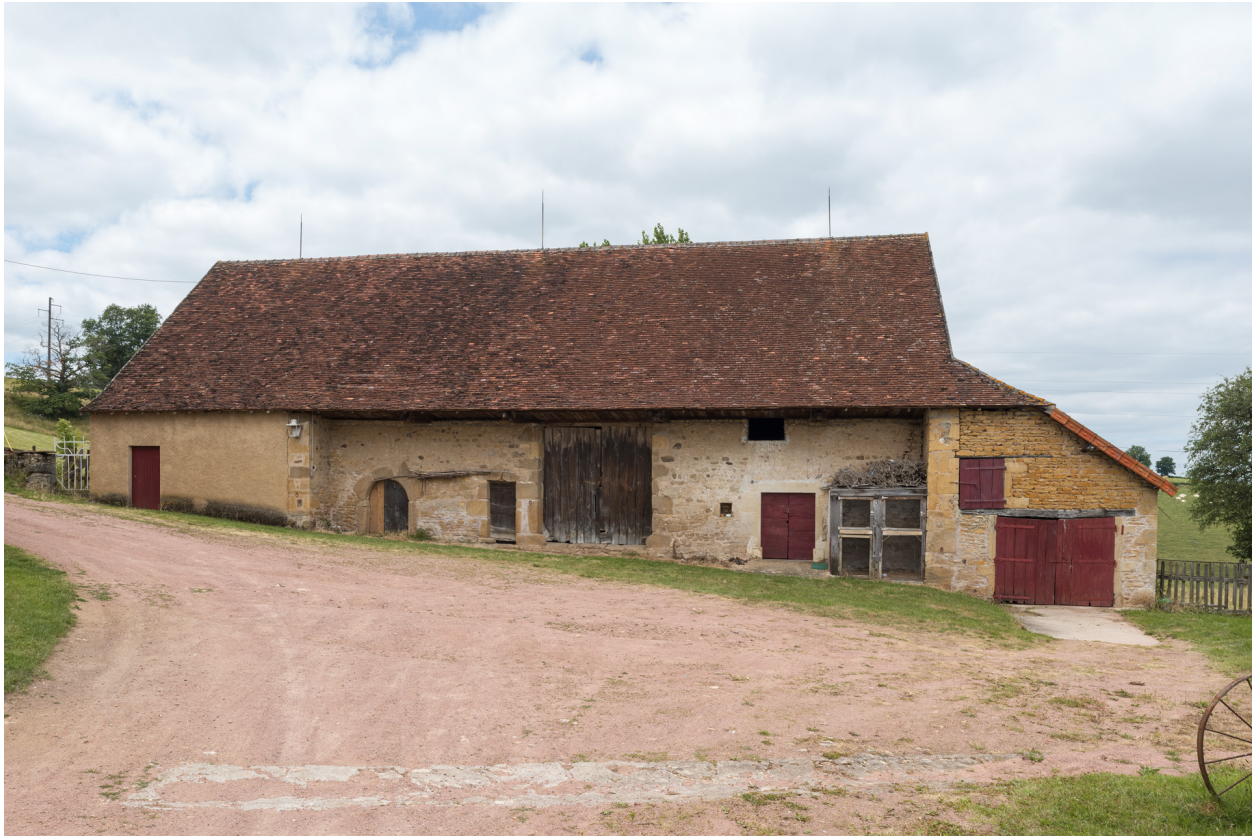
Façade antérieure du bâtiment agricole (étable, remise, fenil).