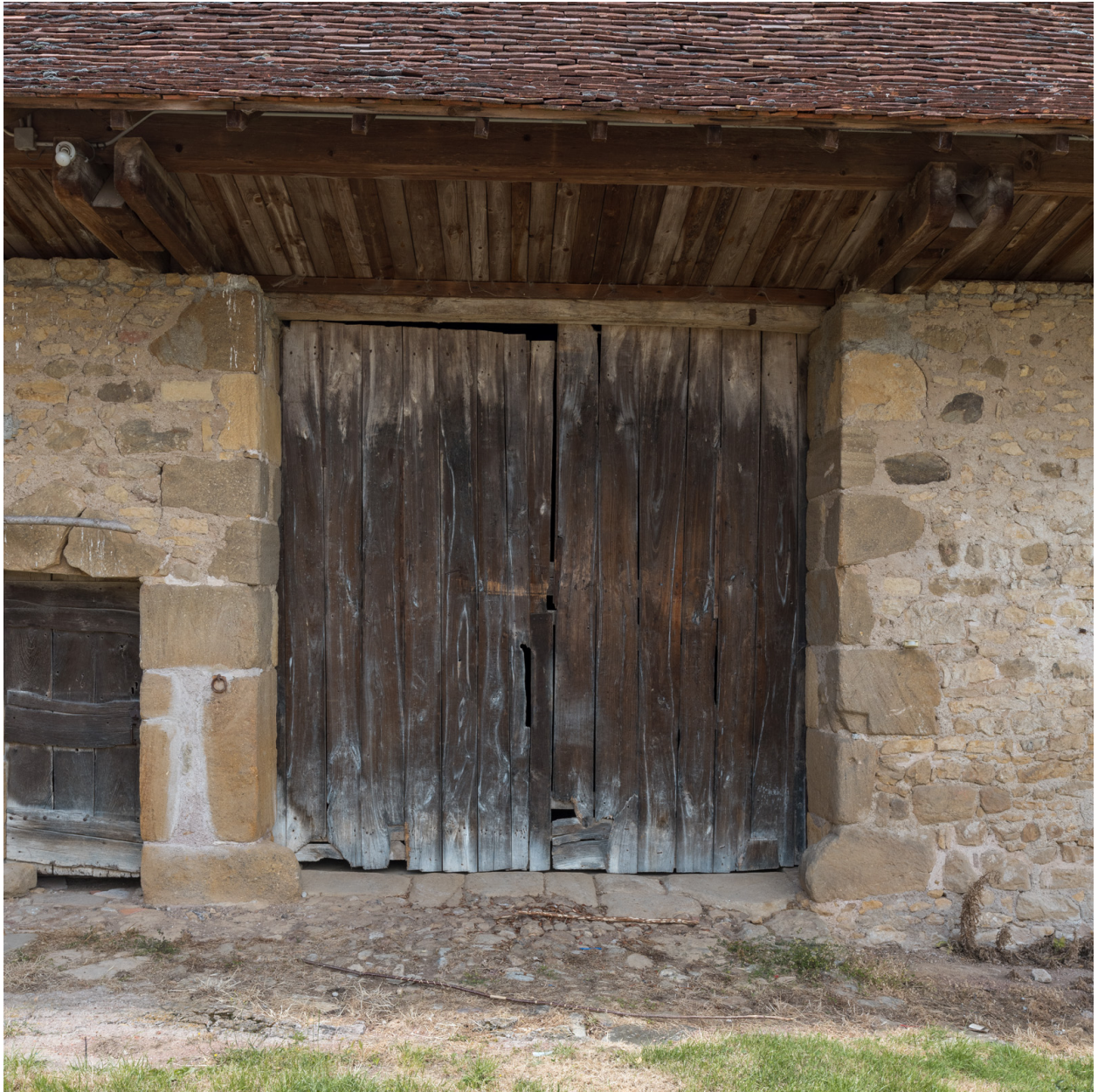
Façade antérieure du bâtiment agricole. Porte de la remise.