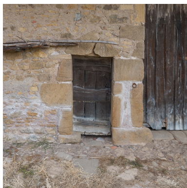
Façade antérieure du bâtiment agricole. Porte piétonne.