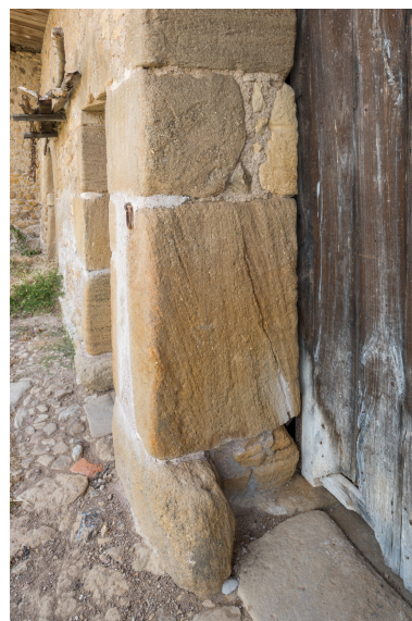
Bâtiment agricole. Piédroit de la porte de remise. IVR26_20187100320NUC4A