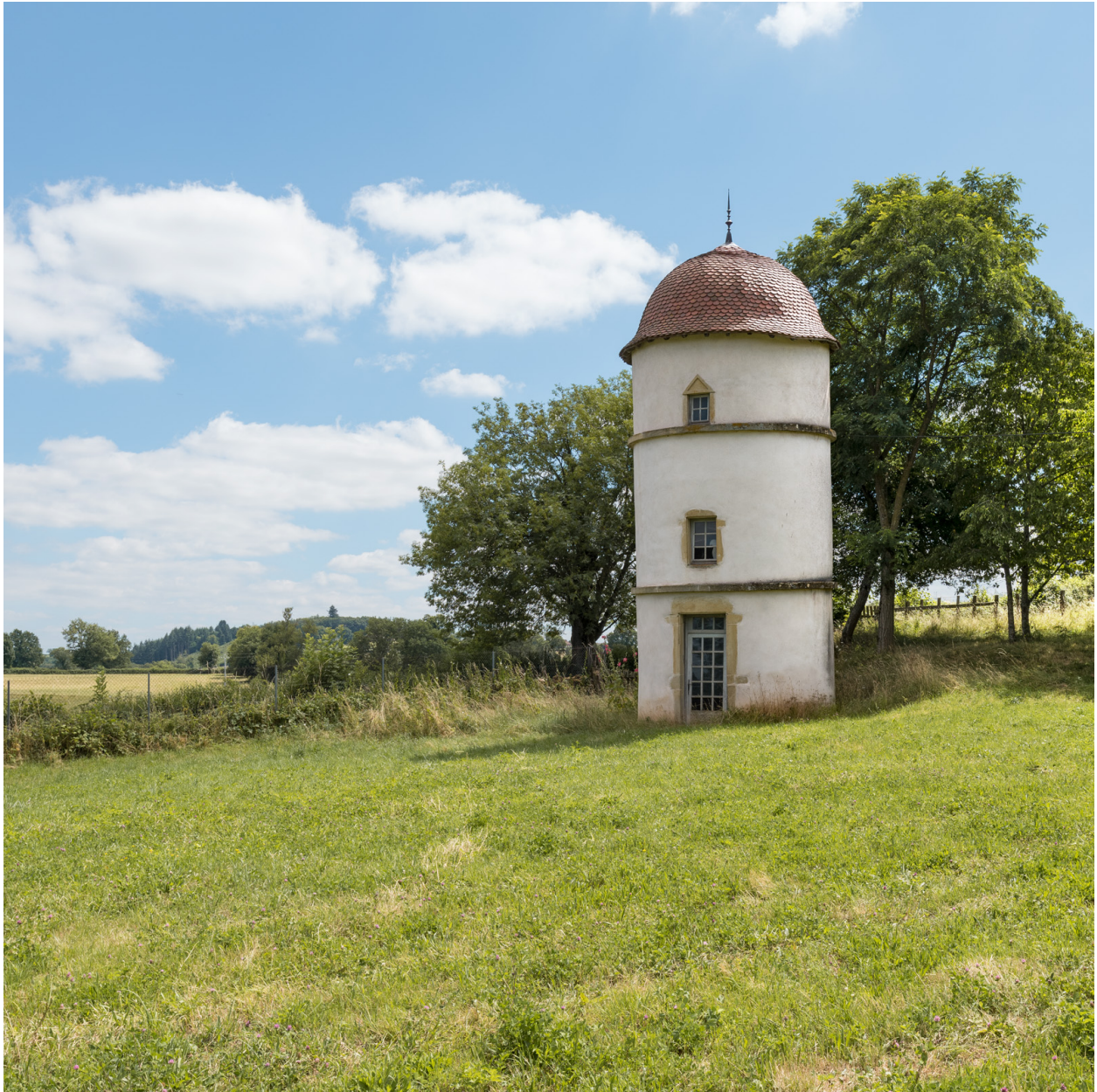
Pigeonnier. Vue rapprochée.