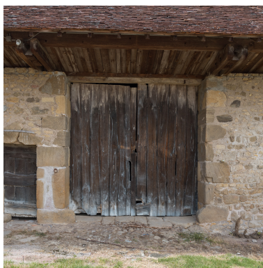
Façade antérieure du bâtiment agricole. Porte de la remise. IVR26_20187100319NUC4A