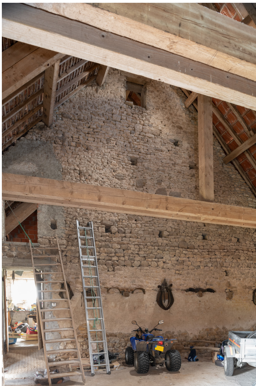
Bâtiment agricole. Mur de refend entre la remise et l'étable.