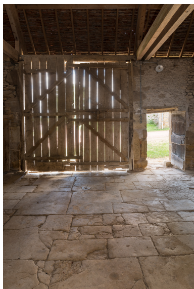
Bâtiment agricole. Vue intérieure de la remise. IVR26_20187100323NUC4A