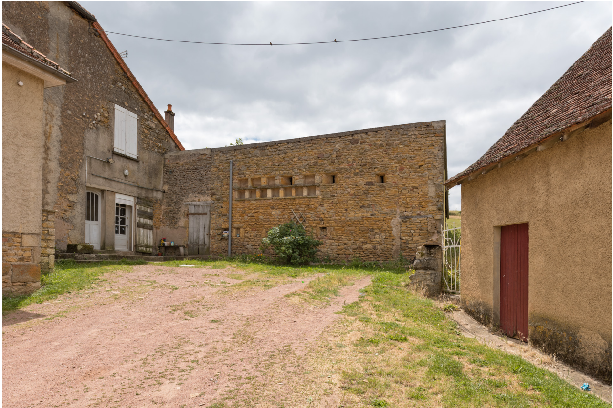
Mur d'une dépendance agricole (soue).