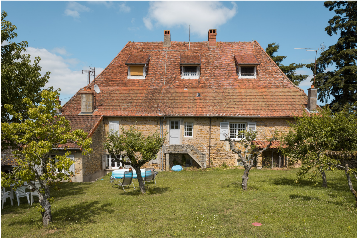
Façade postérieure du logement.