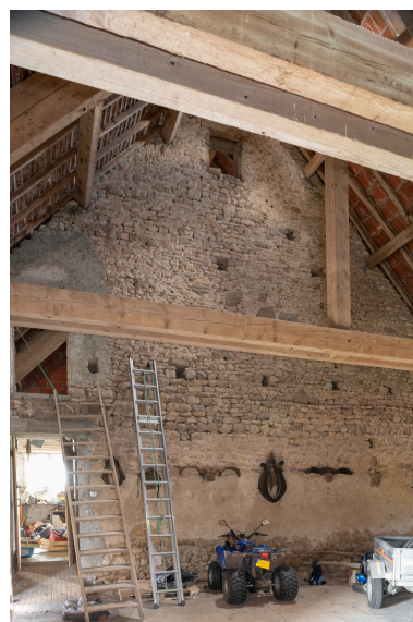
Bâtiment agricole. Mur de refend entre la remise et l'étable. IVR26_20187100324NUC4A