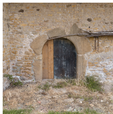
Façade antérieure du bâtiment agricole. Porte cintrée d'une étable. IVR26_20187100317NUC4A