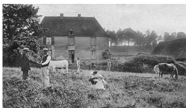
Vue de la ferme de Montgiraud au début du XXe siècle, carte postale, collection privée. IVR26_20207100170NUC2