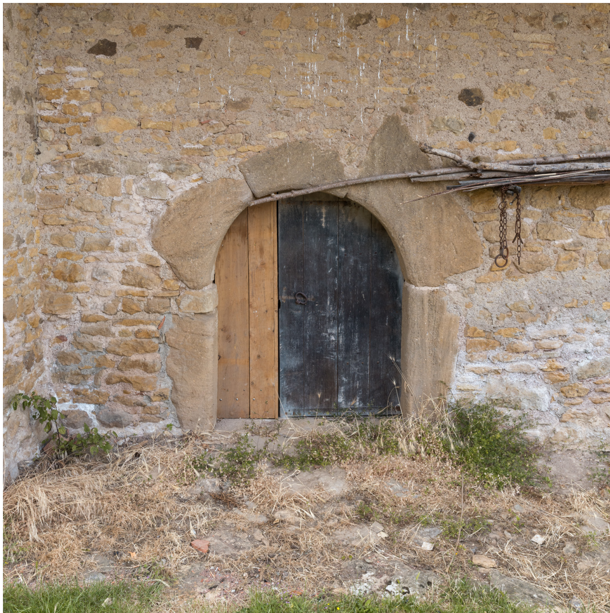
Façade antérieure du bâtiment agricole. Porte cintrée d'une étable.