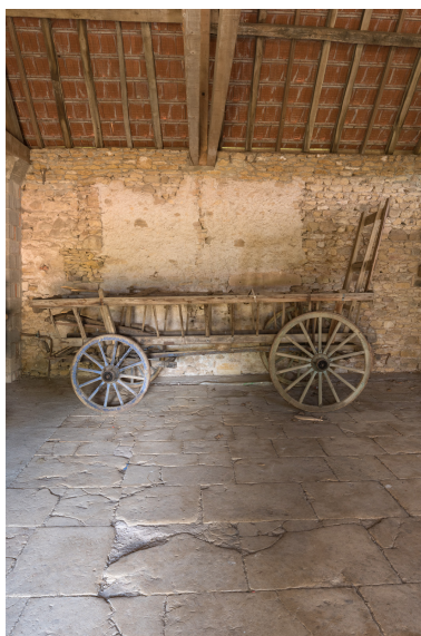
Bâtiment agricole. Char à foin. IVR26_20187100325NUC4A