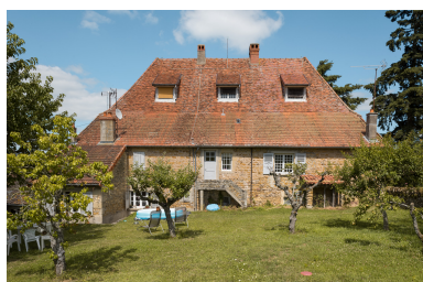
Façade postérieure du logement. IVR26_20187100312NUC4A