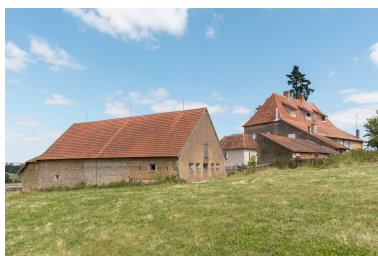
Vue d'ensemble depuis l'ouest. IVR26_20187100313NUC4A