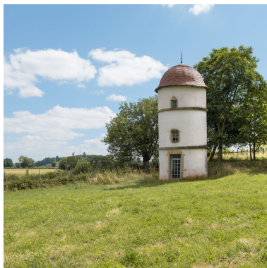
Pigeonnier. Vue rapprochée. IVR26_20187100327NUC4A

IVR26_20187100326NUC4A