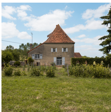
Façade sud du logement. IVR26_20187100311NUC4A