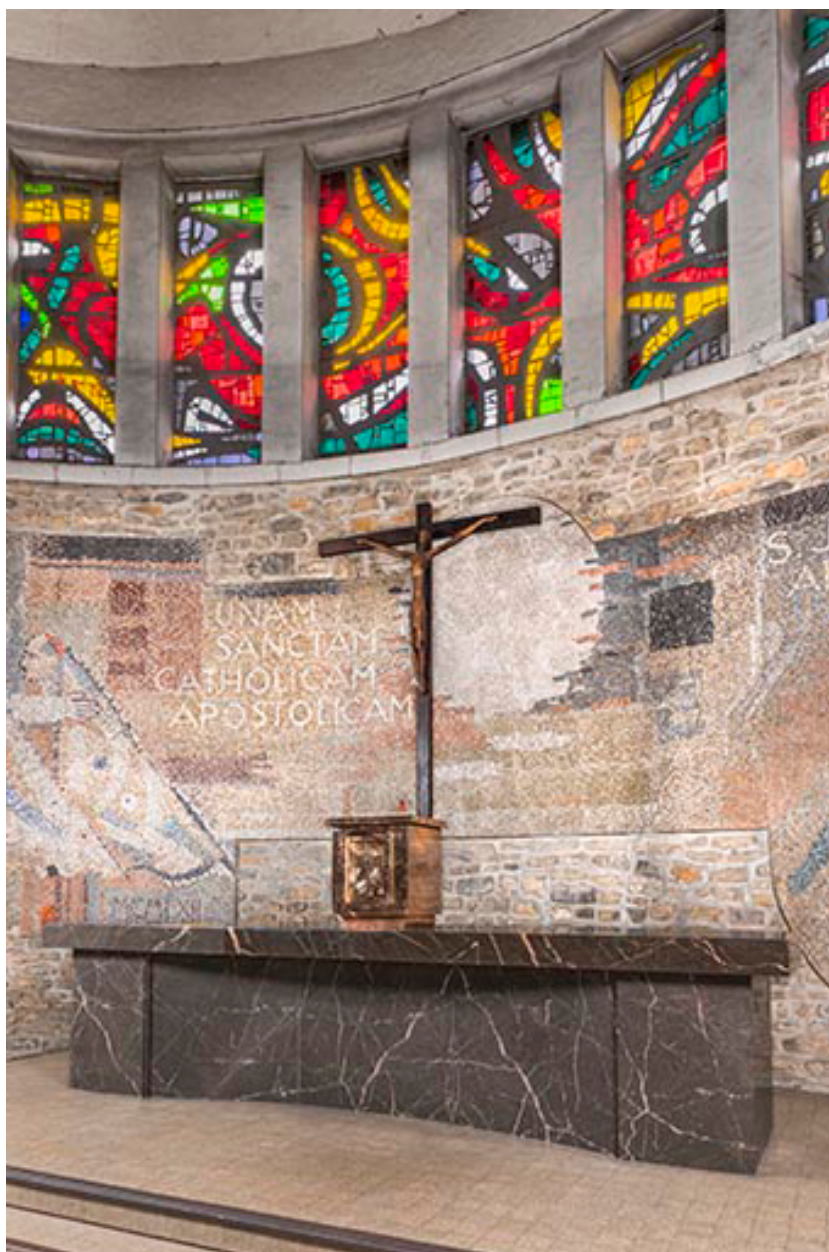
Vue du maître-autel, du tabernacle et de la croix d'autel.