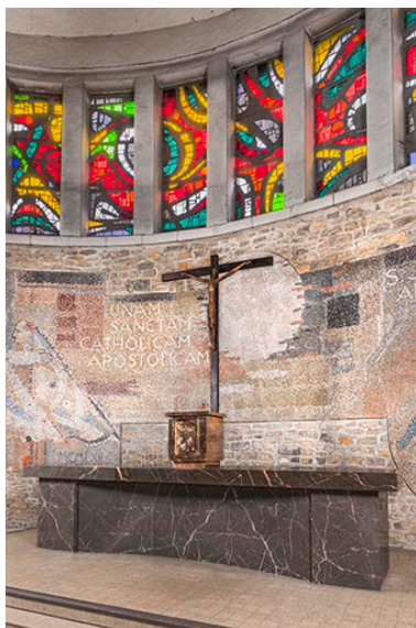
Vue du maître-autel, du tabernacle et de la croix d'autel.