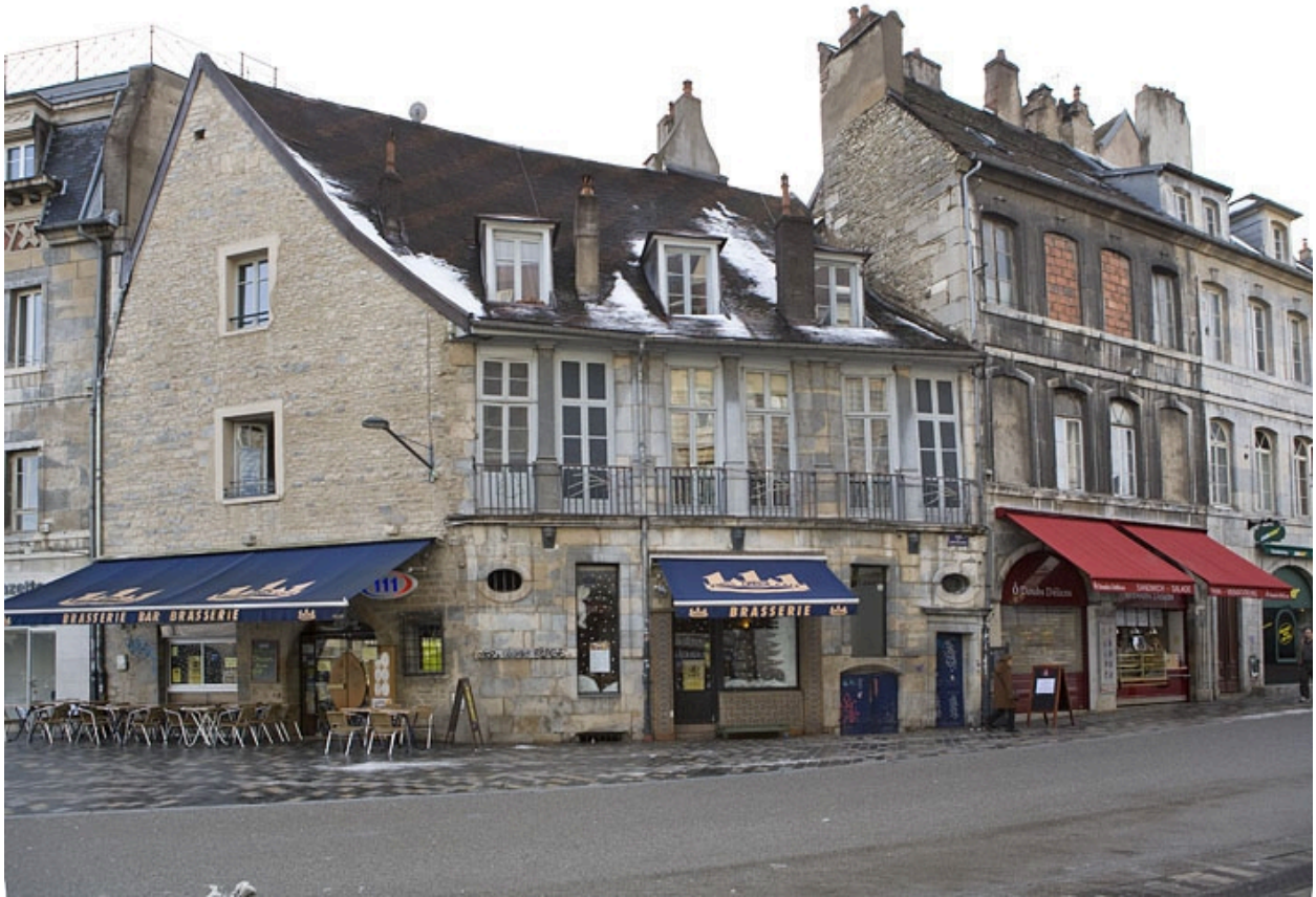
Vue d'ensemble du logis secondaire depuis la rue des Boucheries.