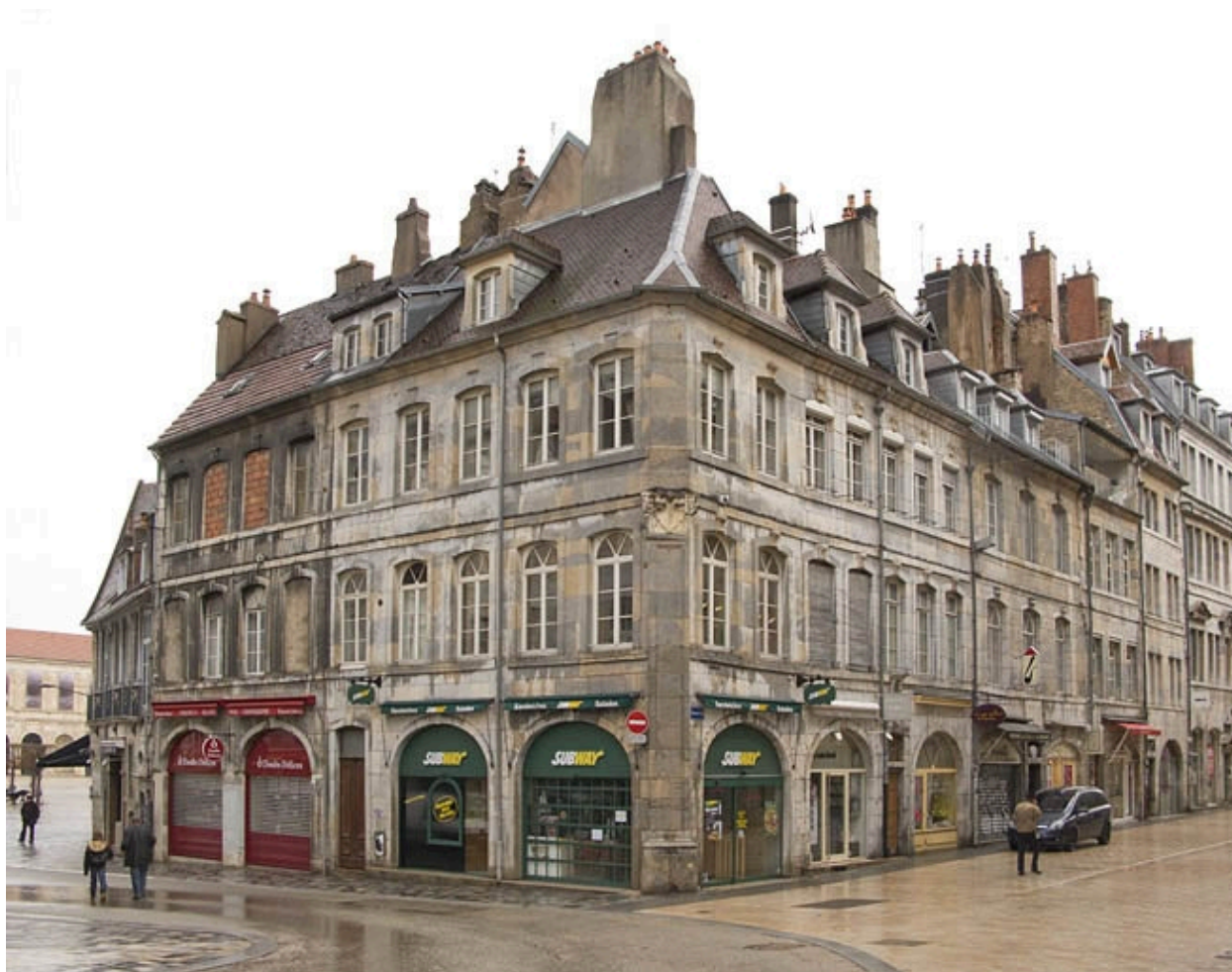
Vue d'ensemble depuis l'angle de la rue des Boucheries et de la Grande Rue.