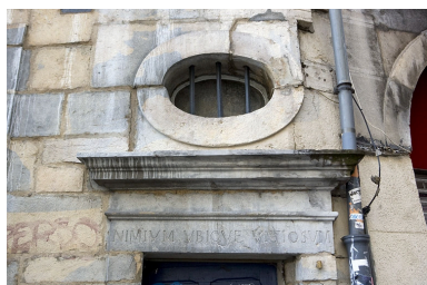
Détail du linteau de porte avec inscription du logis secondaire, rue des Boucheries. IVR43_20102500205NUC2A