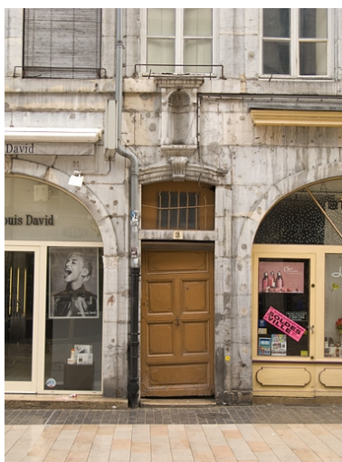
Détail de la porte d'entrée.