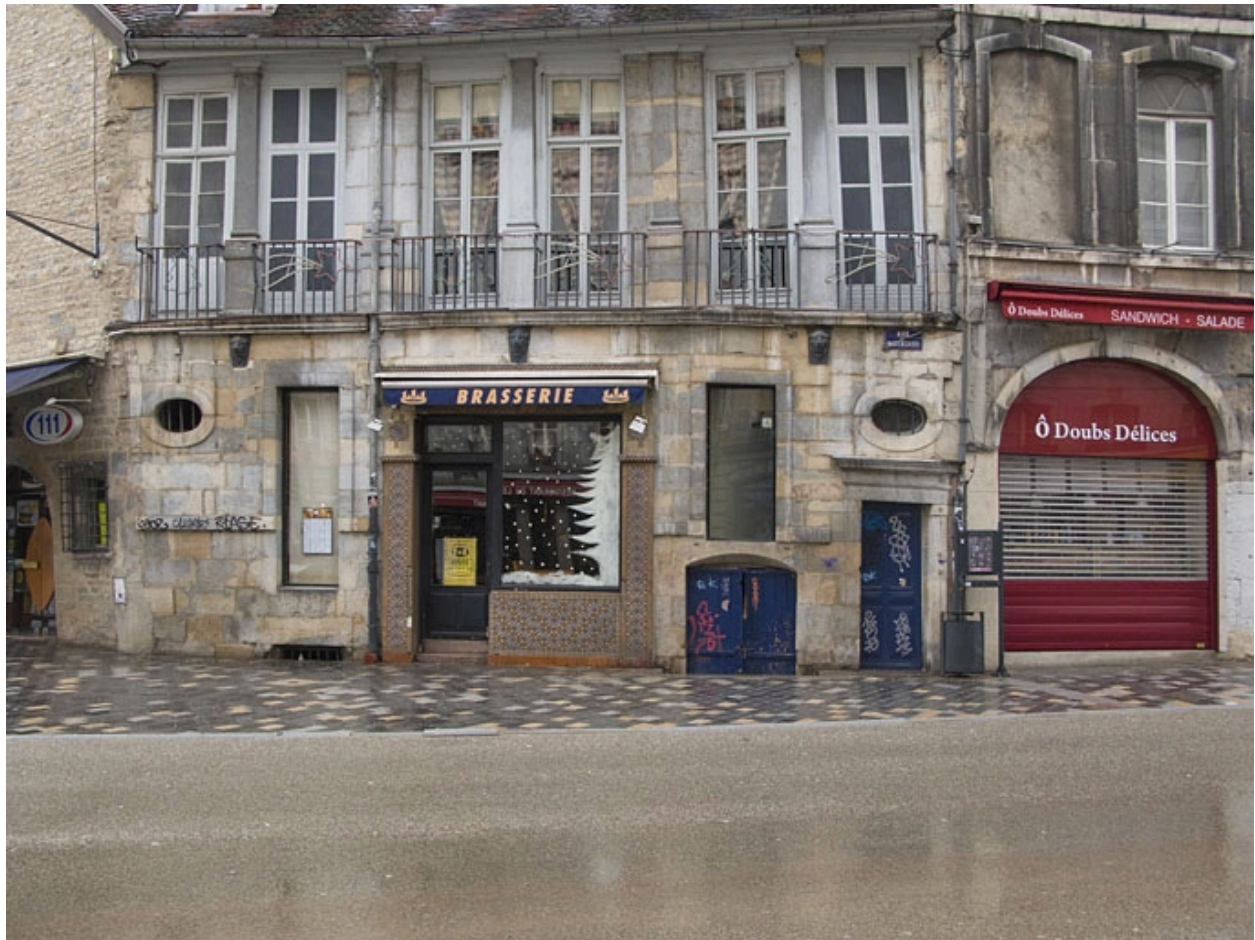
Détail de la façade antérieure du logis secondaire, rue des Boucheries.