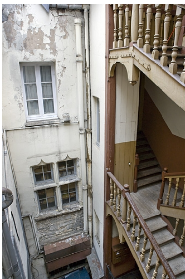
Façade sur cour du logis secondaire depuis l'escalier à cage ouverte.