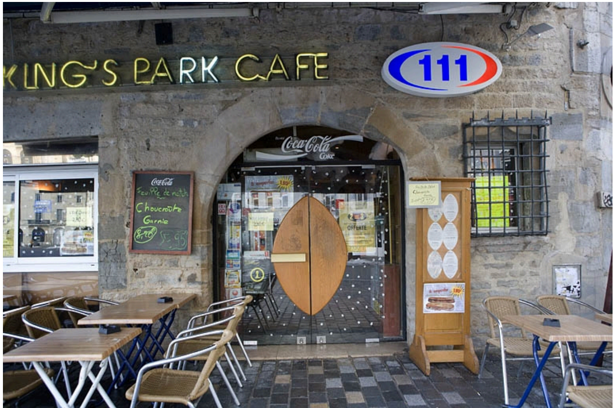
Détail de l'entrée : façade sur pignon du logis secondaire.