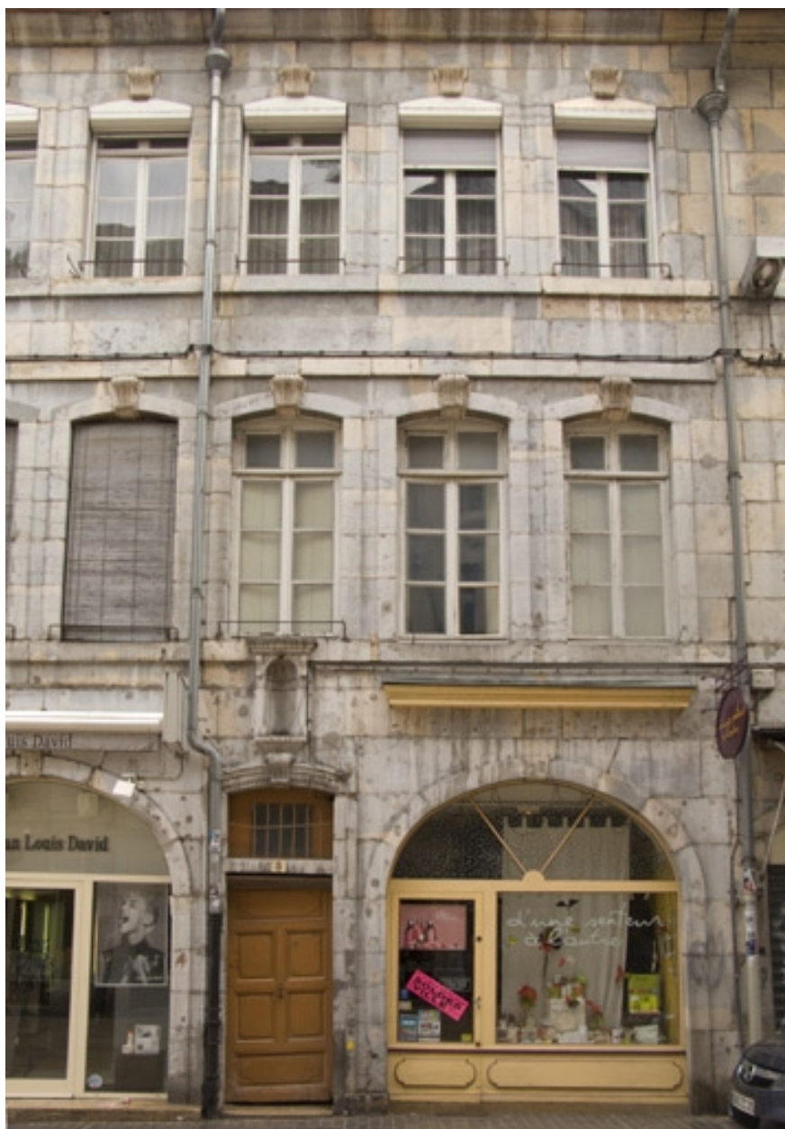
Vue d'ensemble de la façade antérieure du logis principal, de face.