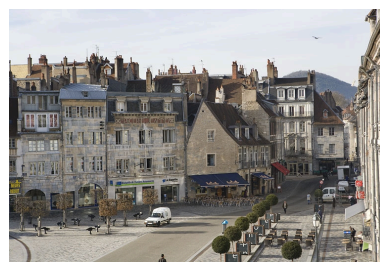
Vue éloignée du logis secondaire depuis la place de la Révolution. IVR43_20102500213NUC2A