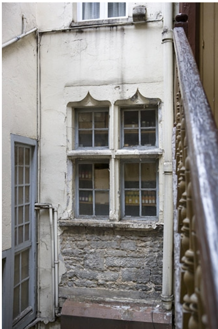
Logis secondaire : détail de la fenêtre en accolade sur cour.