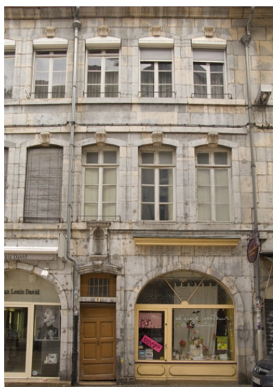
Vue d'ensemble de la façade antérieure du logis principal, de face.