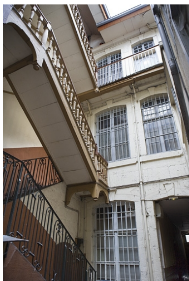
Façade postérieure du logis principal.