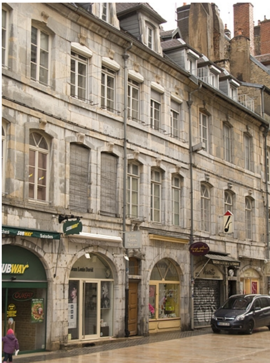
Vue d'ensemble de trois quarts gauche.