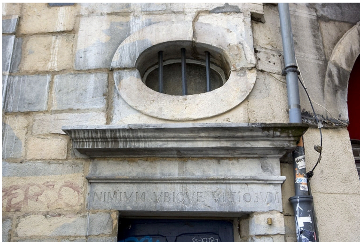
Détail du linteau de porte avec inscription du logis secondaire, rue des Boucheries.