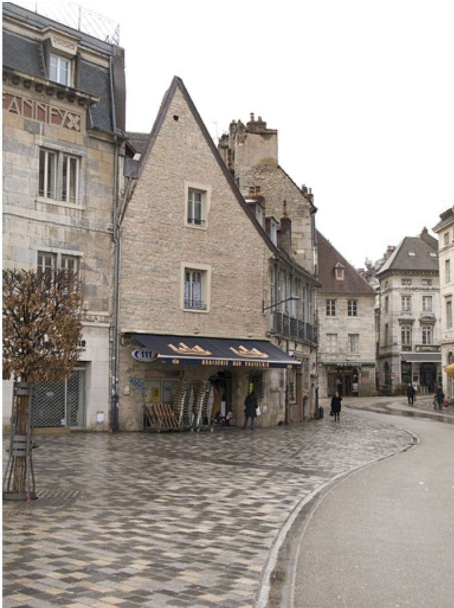
Vue d'ensemble de la façade sur pignon du logis secondaire, depuis la rue des Boucheries.