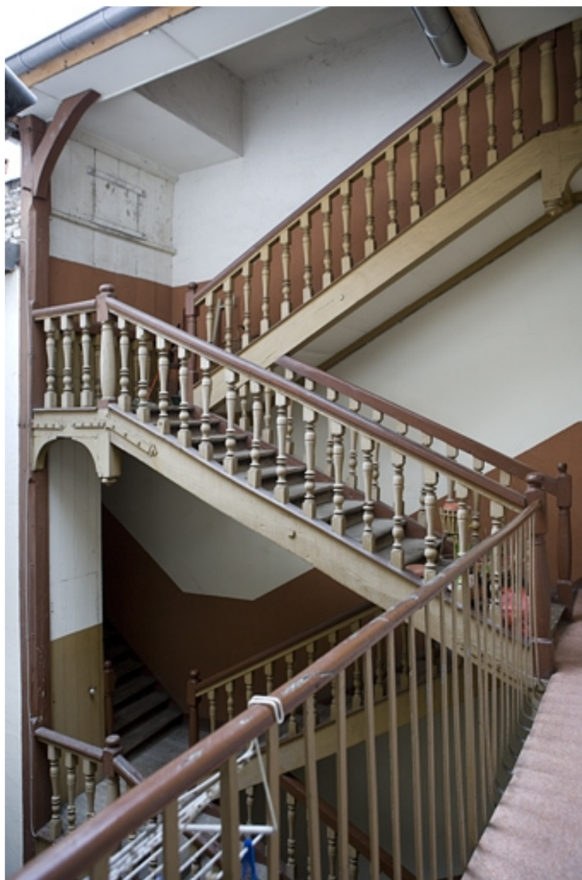
Vue d'ensemble de l'escalier à cage ouverte sur cour.