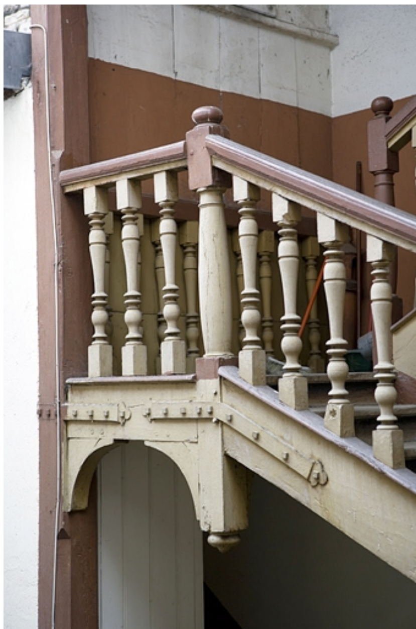
Détail des balustres de l'escalier à cage ouverte sur cour.