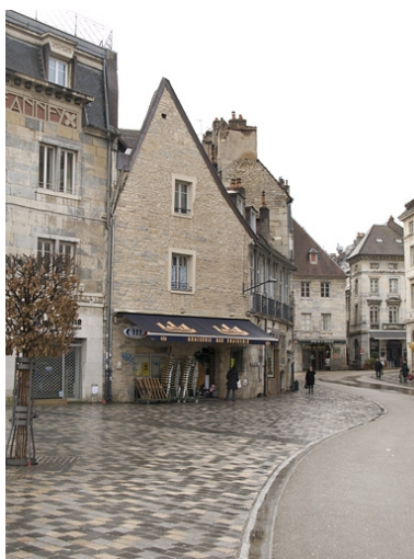
Vue d'ensemble de la façade sur pignon du logis secondaire, depuis la rue des Boucheries.