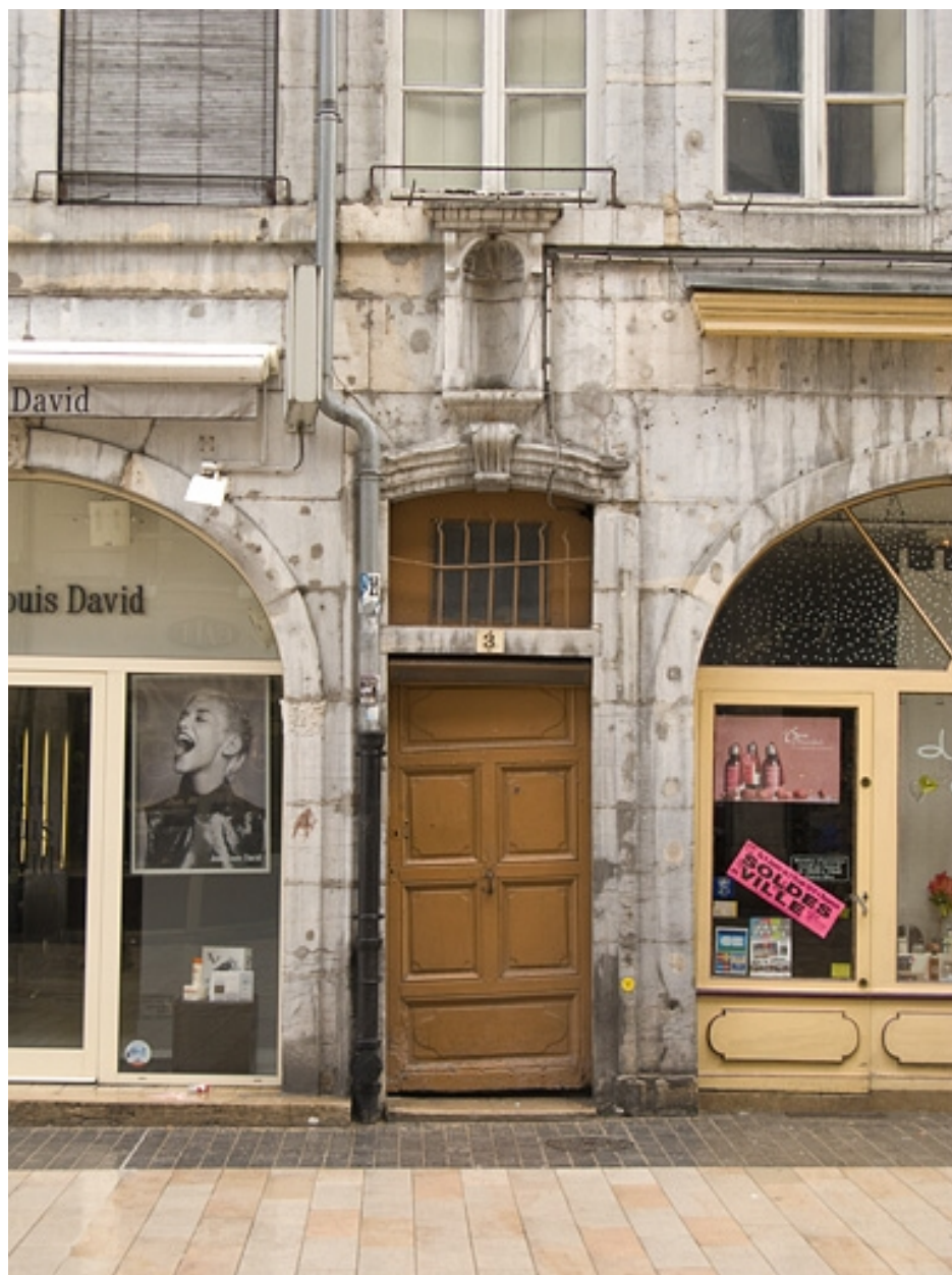
Détail de la porte d'entrée.