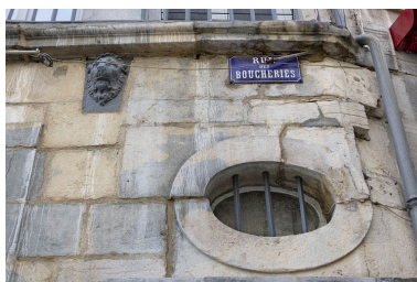
Détail de l'oculus au-dessus du linteau de porte du logis secondaire, rue des Boucheries. IVR43_20102500206NUC2A