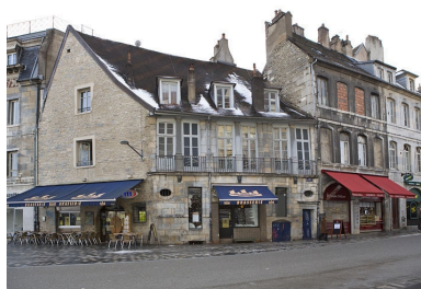
Vue d'ensemble du logis secondaire depuis la rue des Boucheries. IVR43_20102500202NUC2A