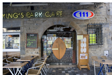
Détail de l'entrée : façade sur pignon du logis secondaire. IVR43_20102500207NUC2A