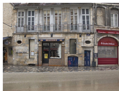
Détail de la façade antérieure du logis secondaire, rue des Boucheries.