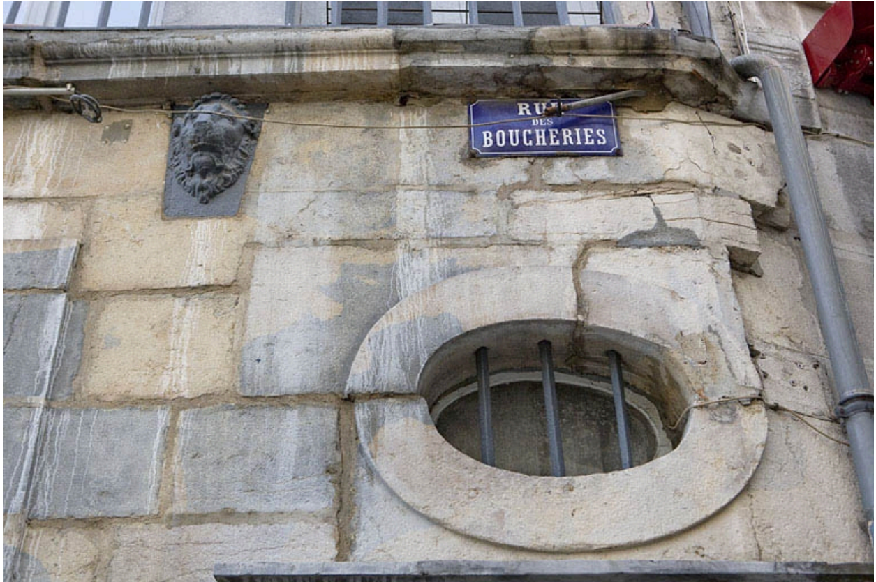
Détail de l'oculus au-dessus du linteau de porte du logis secondaire, rue des Boucheries.