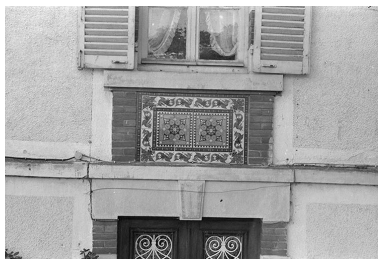
Détail de la façade est : allège de la baie du premier étage (carreaux de grès cérame produits par les Ets Perrusson d'Écuisses).

IVR26_19997100733Z