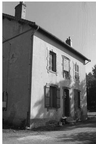
Logement d'ingénieur, vu du nord-est.

IVR26_19997100732Z