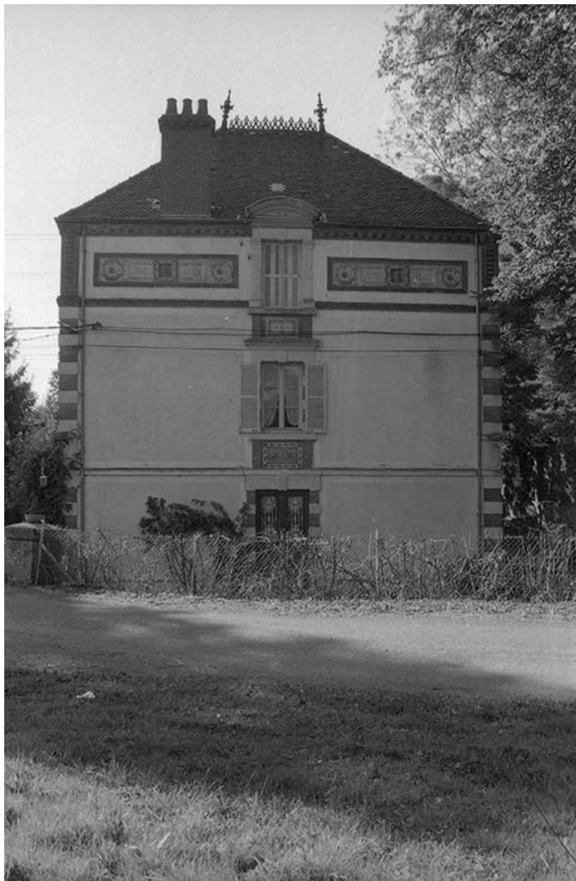
Façade est du logement patronal.