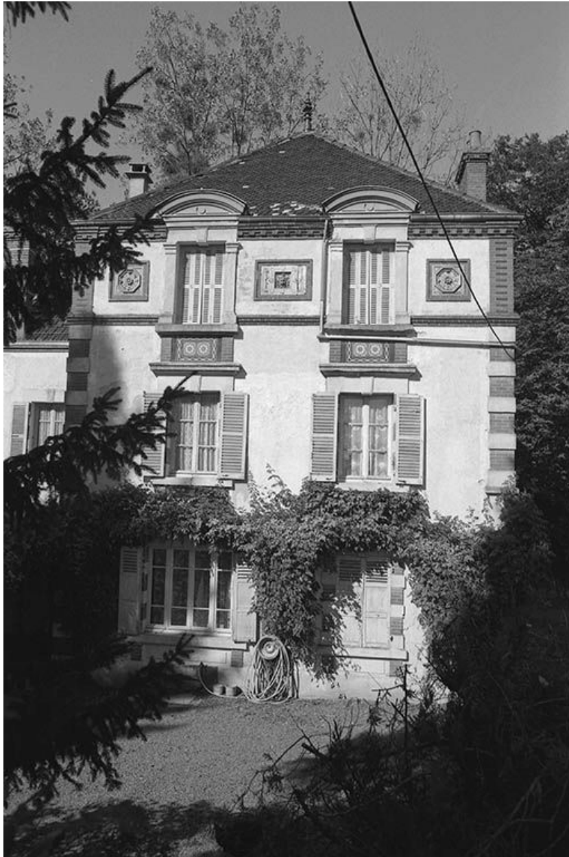
Façade sud du logement patronal.