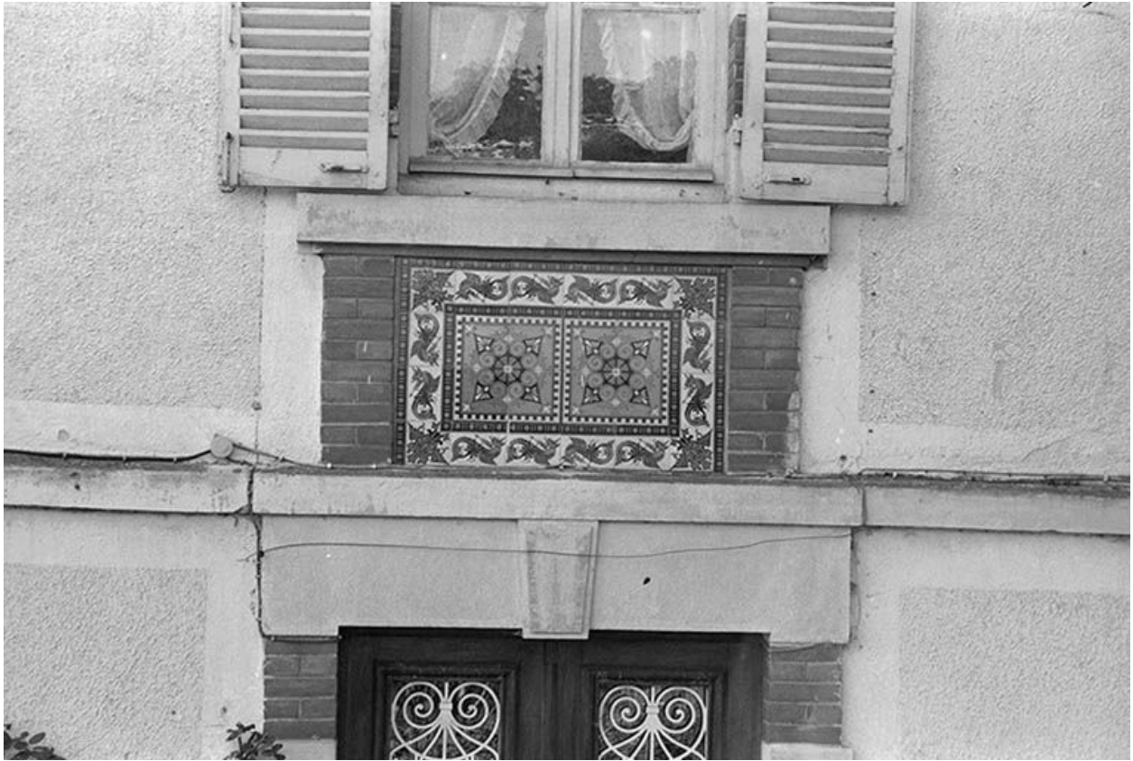
Détail de la façade est : allège de la baie du premier étage (carreaux de grès cérame produits par les Ets Perrusson d'Ecuisses).