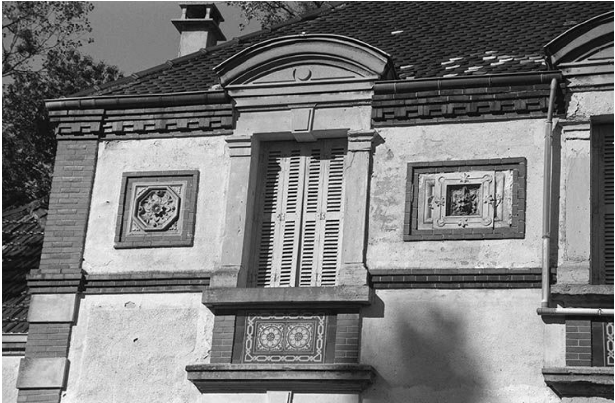
Détail de la façade sud : panneaux de céramique encadrant une baie de l'étage en surcroît (provenance indéterminée).