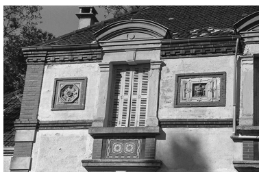
Détail de la façade sud : panneaux de céramique encadrant une baie de l'étage en surcroît (provenance indéterminée).