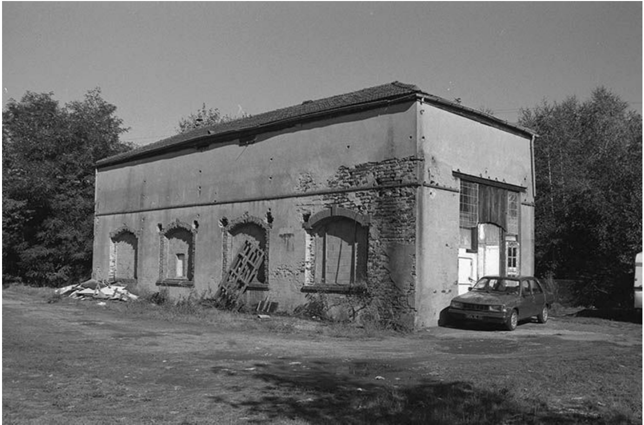
Salle des machines, vue du sud-ouest.