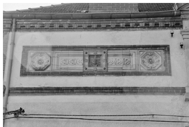
Détail de la façade est : panneaux de céramique (provenance indéterminée).

IVR26_19997100733Z