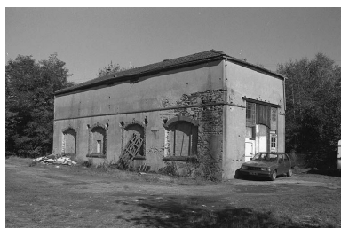
Salle des machines, vue du sud-ouest.

IVR26_19997100739Z