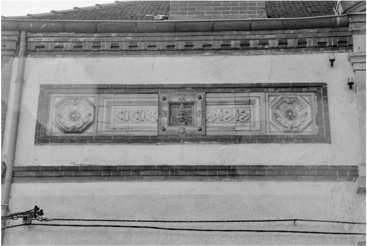
Détail de la façade est : panneaux de céramique (provenance indéterminée).