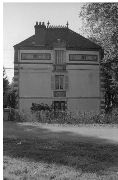
Façade est du logement patronal. IVR26_19997100731Z