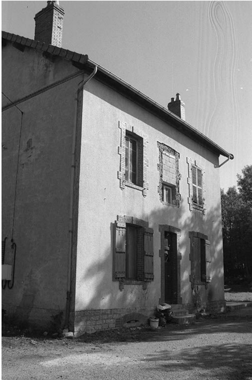
Logement d'ingénieur, vu du nord-est.