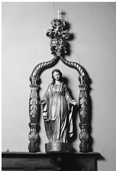
La Vierge.