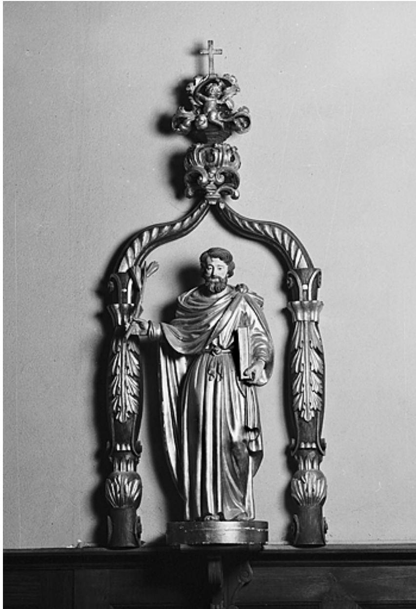
Saint Joseph (?)