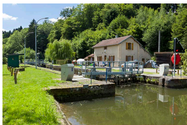
Le site d'écluse depuis l'amont. IVR43_20157000900NUC2A