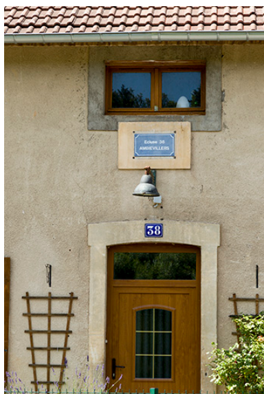
Plaque d'identification de l'écluse.