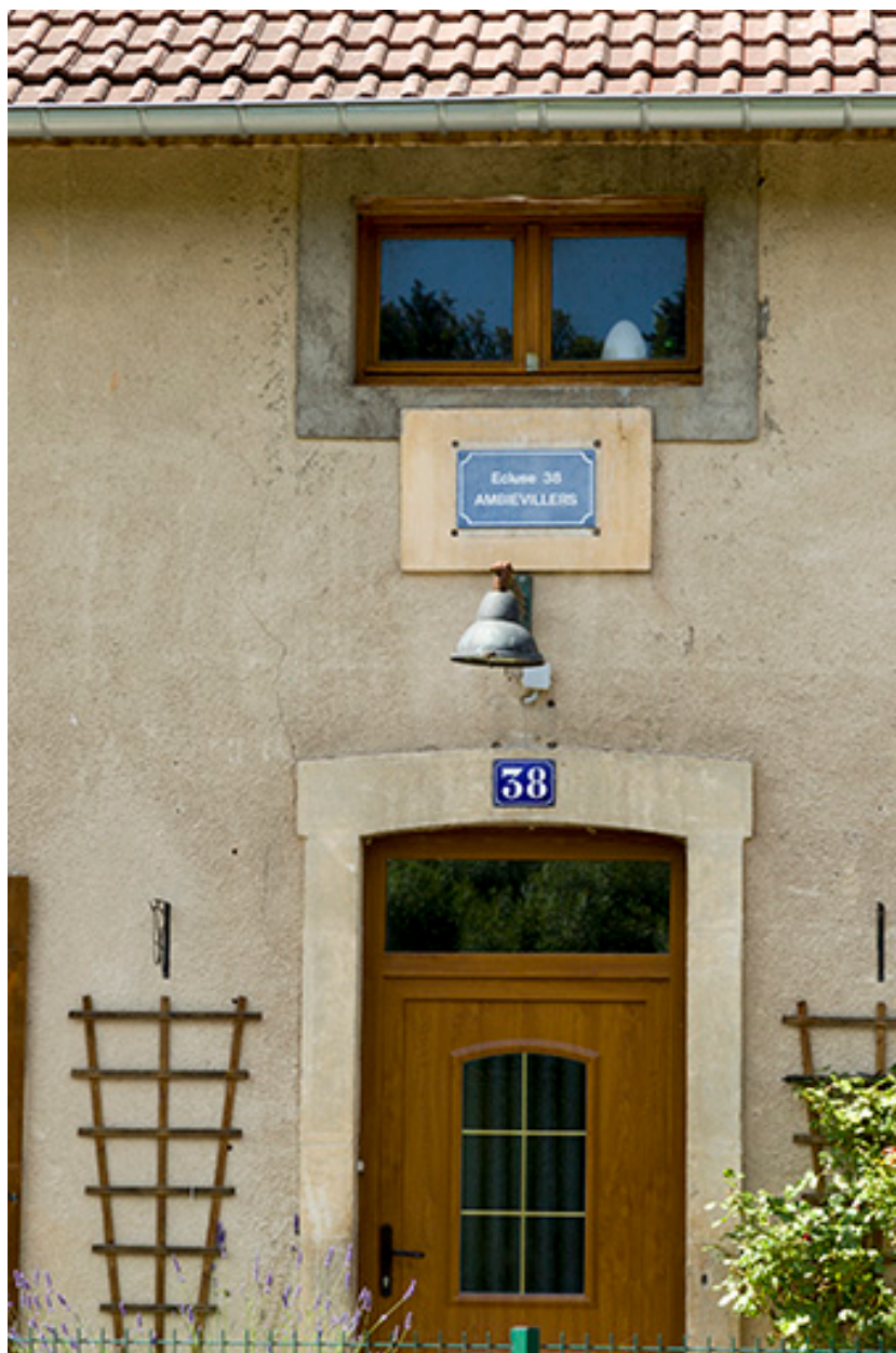
Plaque d'identification de l'écluse.