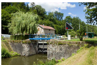
Vue d'ensemble depuis l'aval.