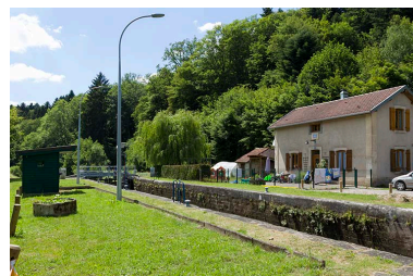
Le site d'écluse. IVR43_20157000899NUC2A