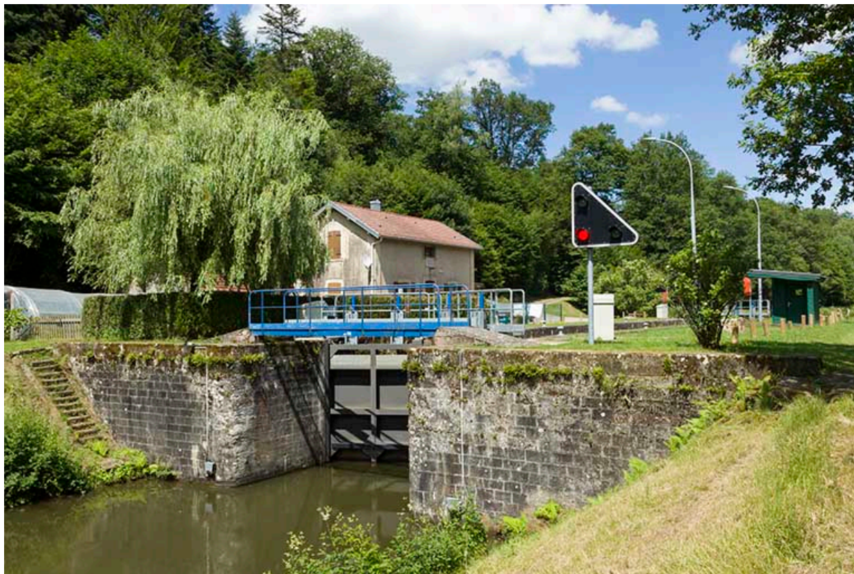
Vue d'ensemble depuis l'aval.