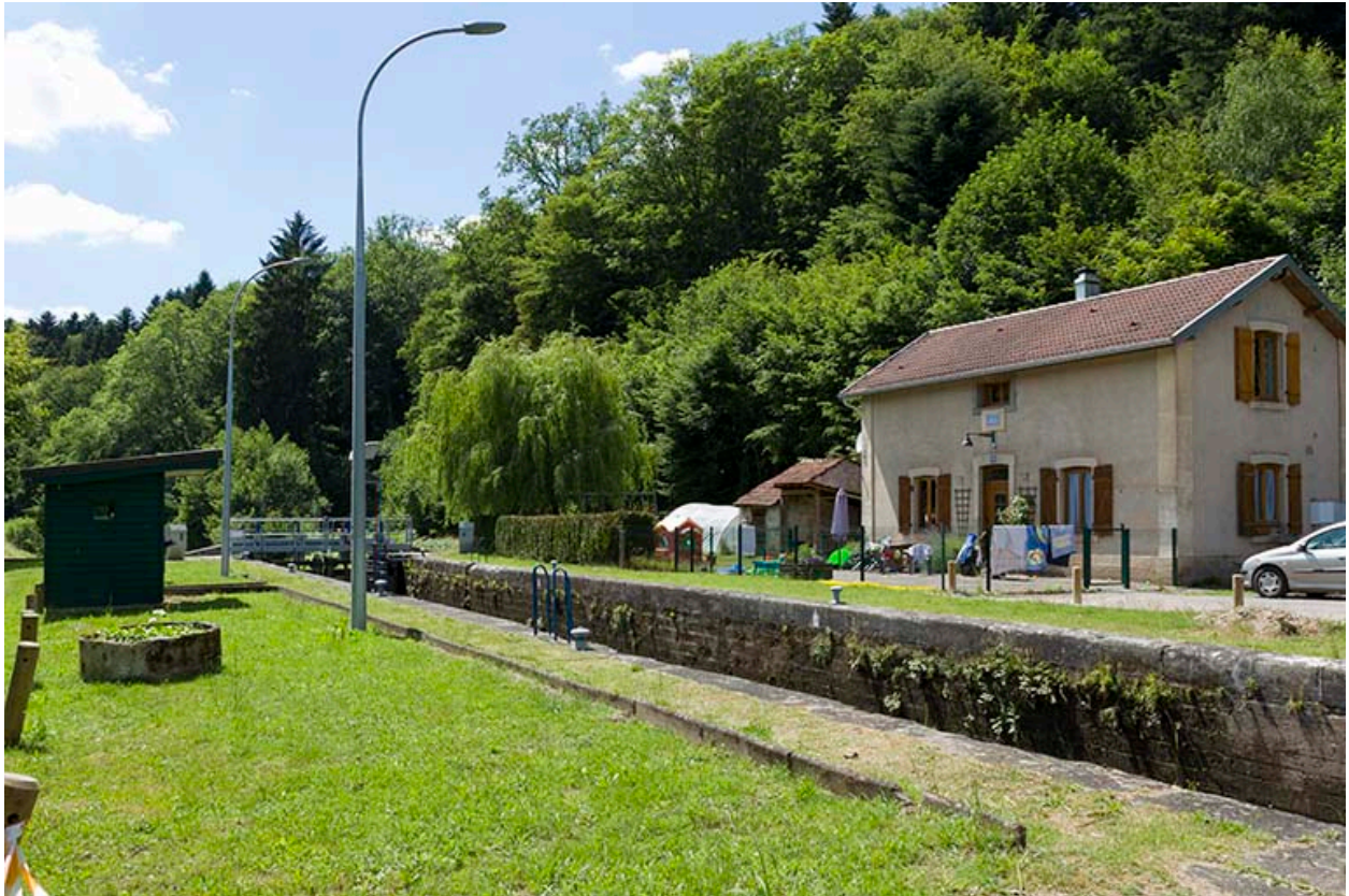
Le site d'écluse.