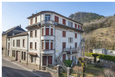
Vue depuis le nord-est. IVR43_20223900281NUC4A