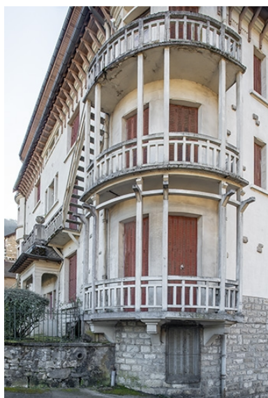
Balcons de l'angle nord-ouest. IVR43_20223900279NUC4A