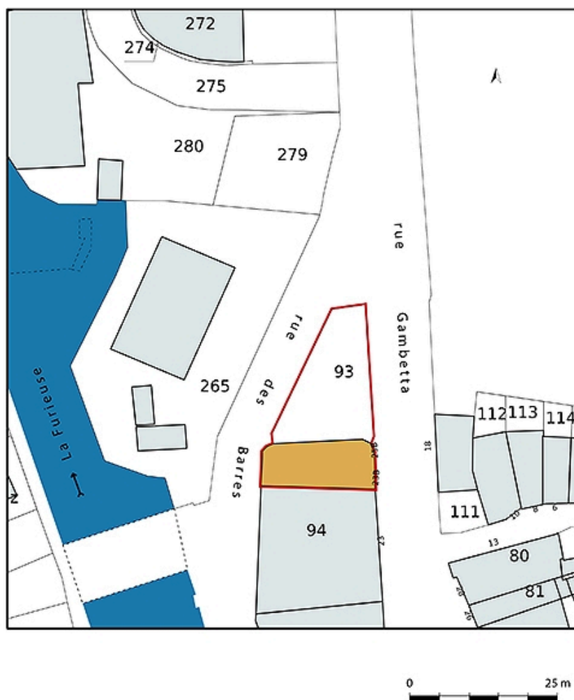
Plan-masse et de situation, extrait du plan cadastral (2021).