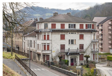
Façade principale, angle de la rue Gambetta (à gauche) et de la rue des Barres (à droite). IVR43_20223900283NUC4A