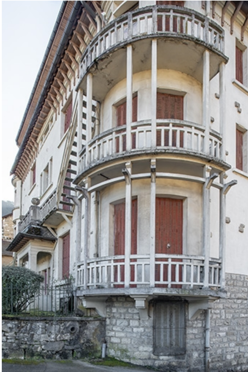
Balcons de l'angle nord-ouest.