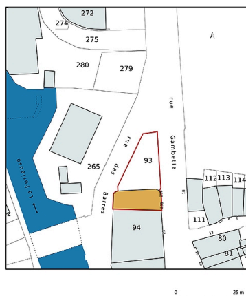
Plan-masse et de situation, extrait du plan cadastral (2021). IVR43_20213900179NUDA