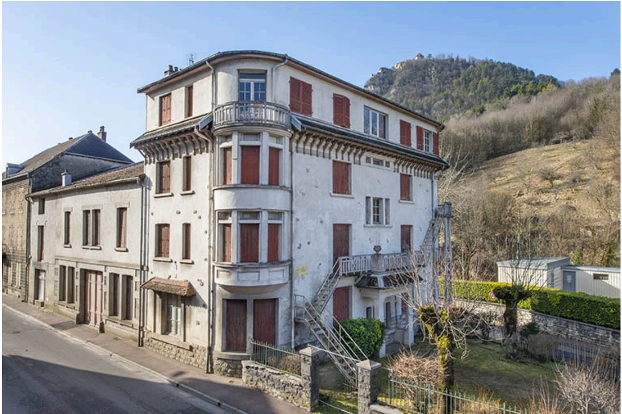
Vue depuis le nord-est.