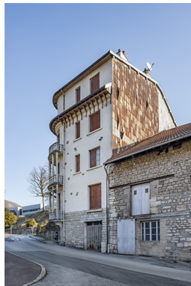
Vue depuis le sud-ouest. IVR43_20223900280NUC4A