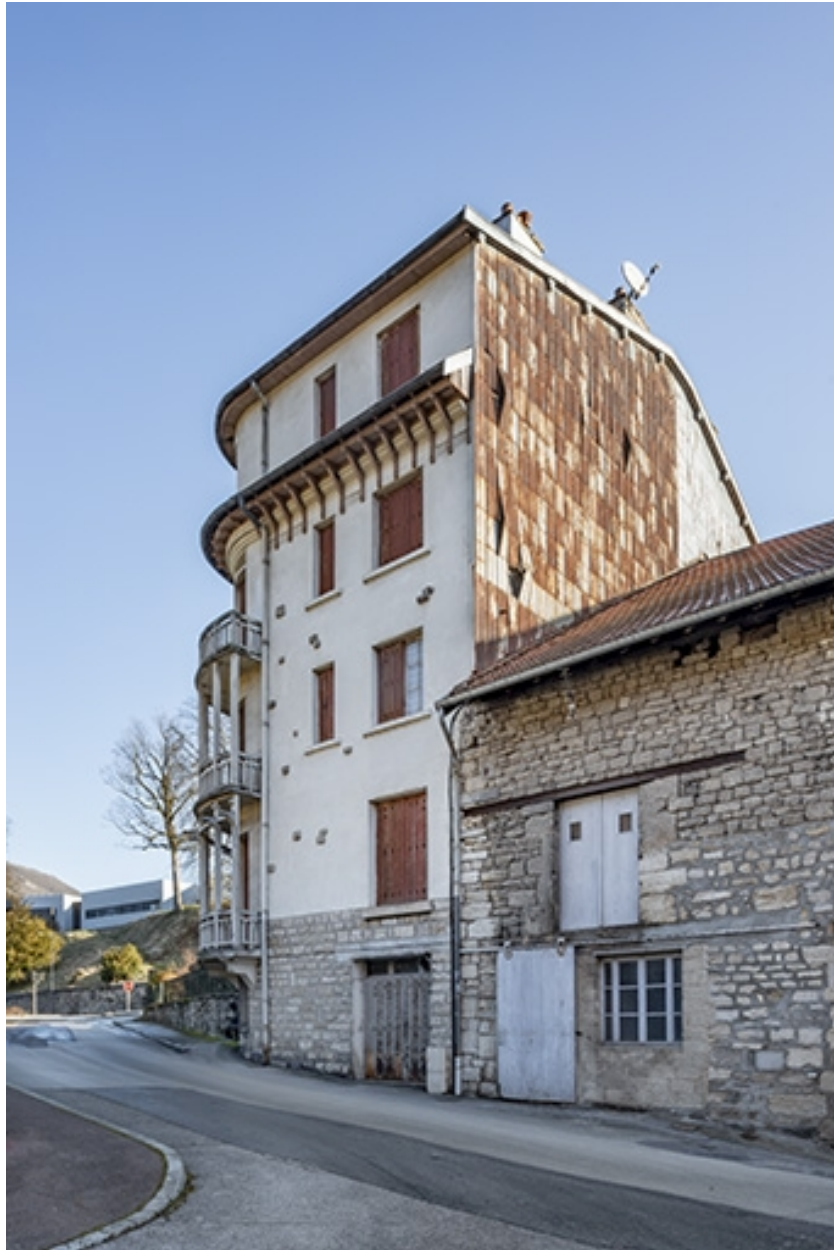
Vue depuis le sud-ouest.