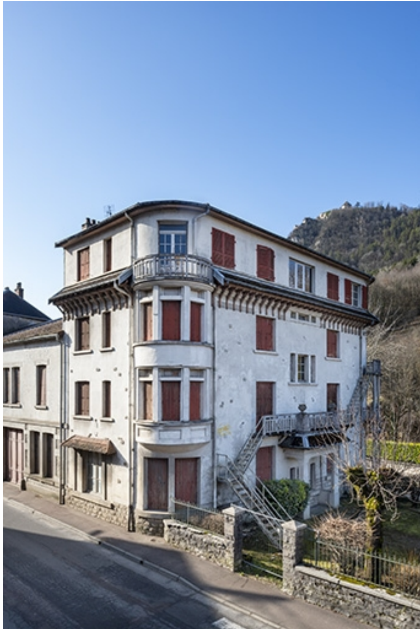
Vue depuis le nord-est.