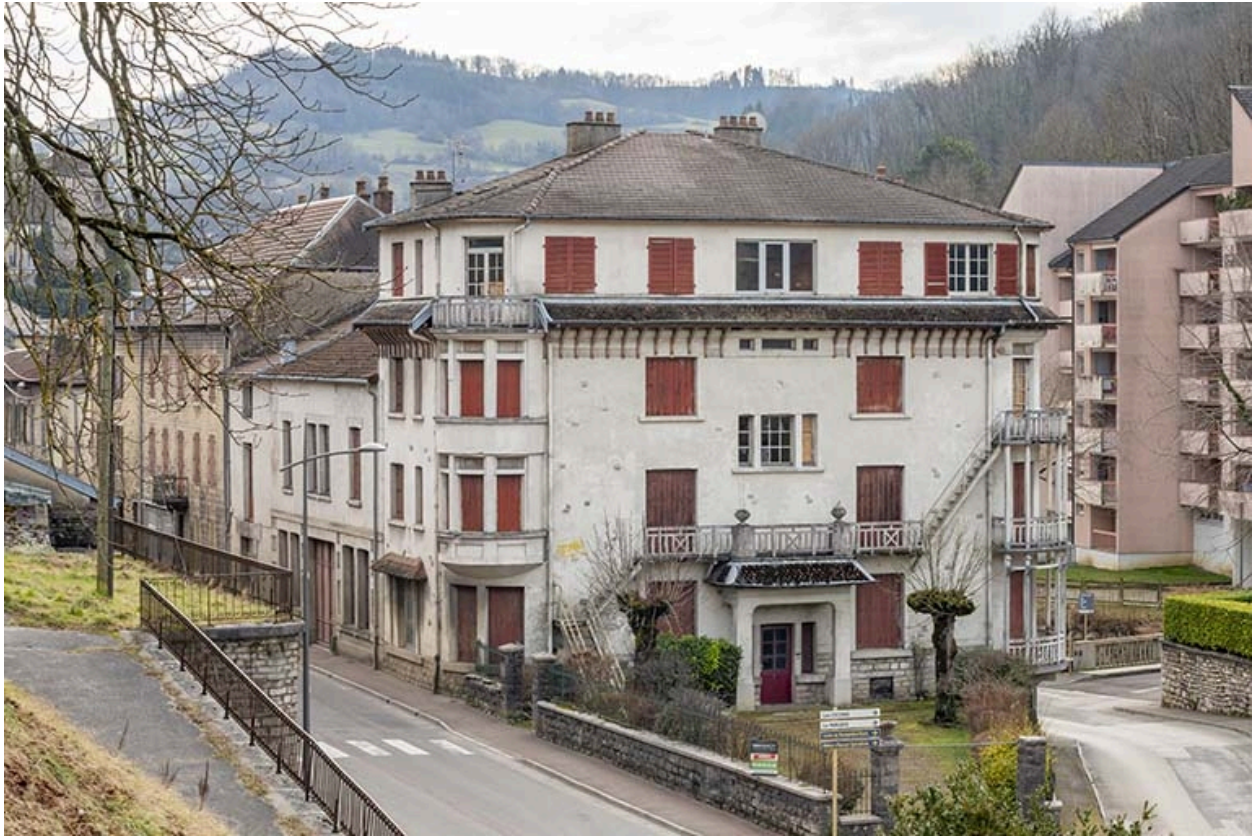
Façade principale, angle de la rue Gambetta (à gauche) et de la rue des Barres (à droite).