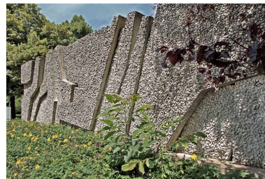
Vue de face, détail. IVR26_20092100390NUC2A