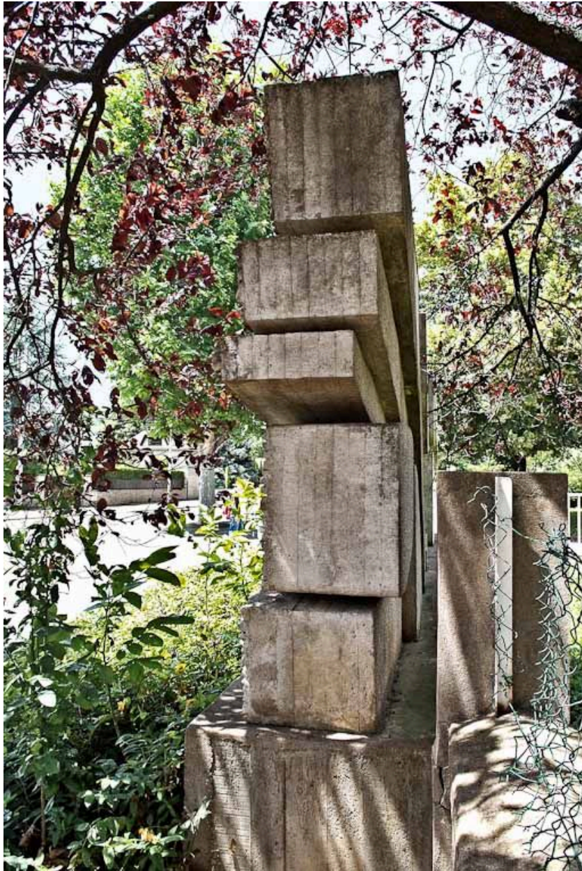
Vue de côté.