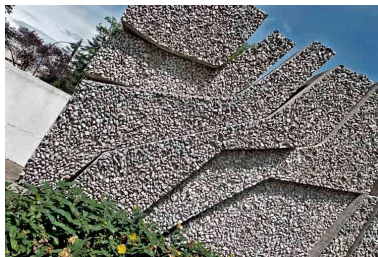
Vue de face. IVR26_20092100388NUC2A