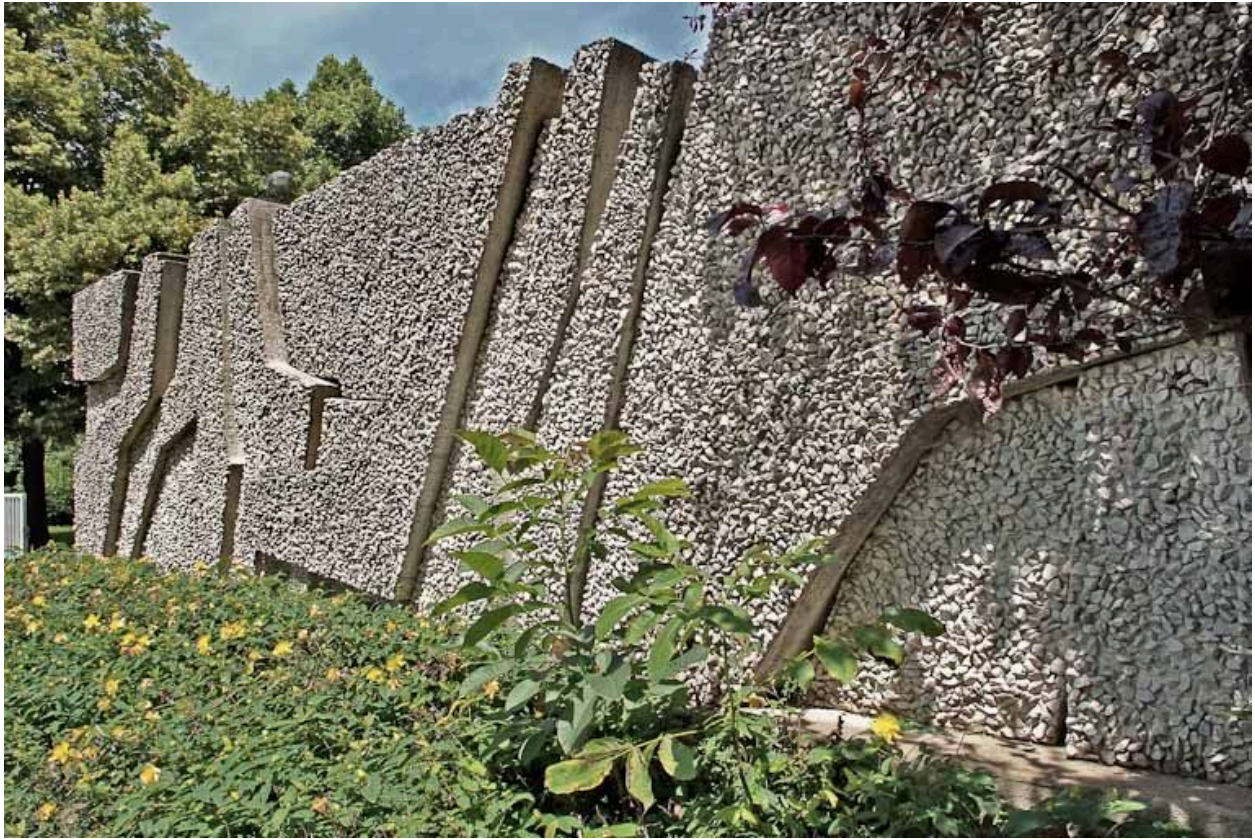
Vue de face, détail.